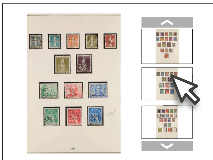
Galerieansicht mit mehreren Abbildungen zu einem Los