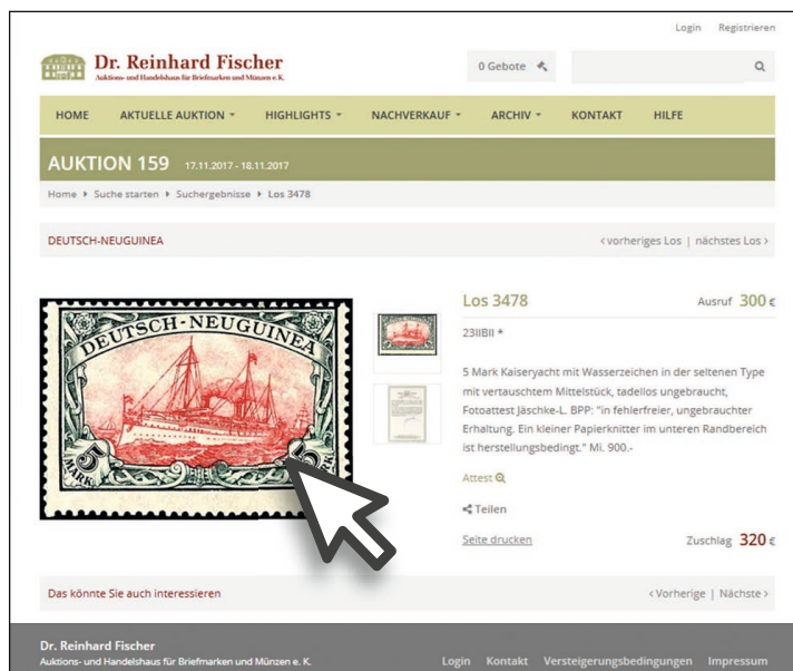
Detailansicht eines Loses