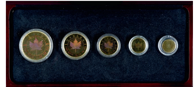
227 Set zu 50, 20, 10, 5, und 1 Dollar, Gold, 2001, Maple Leaf, 1, 1/2, 1/4, 1/10 und 1/20 oz, Hologramm-Motiv, mit Zertifikat in Ausgabeschatulle, st. Auflage nur 600 Stück! (Abbildung auf 46% verkleinert) 2700,—