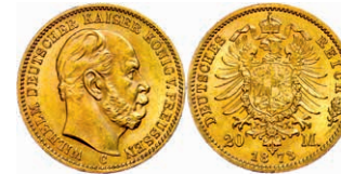
86 20 Mark, 1873, Wilhelm I., Mzz C, kleine Randfehler, vz. J. 243 250,—