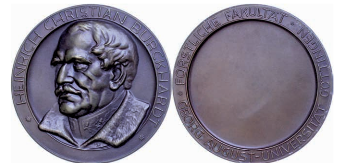
569 Göttingen, Bronzemedaille (Dm. ca. 70,8mm, ca. 127,7g), o.J., signiert "HD", Prämienmedaille der forstlichen Fakultät der Georg-August-Universität Göttingen für Verdienste um die Forstwirtschaft. Medaille wird in unregelmäßigen Abständen verliehen und ist dadurch sehr selten. Av: Kopf Burckhardts nach halblinks. Rev: Blankes Feld, darum Umschrift. Stellenweise etwas Belag, prägefriech. (Abbildung auf 61% verkleinert) 50,—