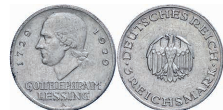
132 3 Reichsmark, 1929, Gotthold Ephraim Lessing, Mzz A, Randfehler, ss. J. 335 Gebot