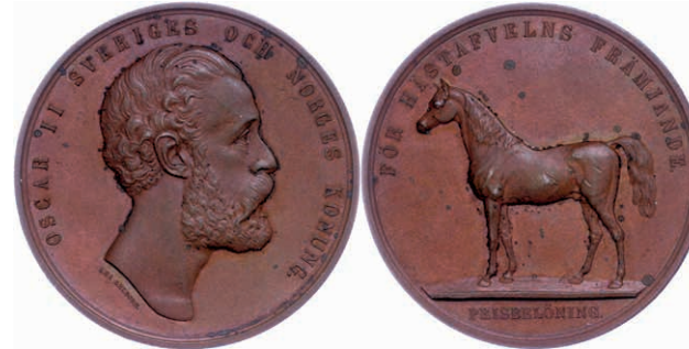
472 Norwegen, Bronzemedaille (Dm. ca. 43,2mm, ca. 34,02g), o.J., von Lea Ahlborn, Prämienmedaille für Pferdezucht. Av: Kopf Oscar II. nach rechts. Rev: Pferd nach links. Kleine Flecken, wz. Rf., kl. Kr., vz. 30,—