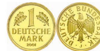
160 1 DM, 2001, J, Abschiedsmark, in Kapsel, st, J. 481. 500,—