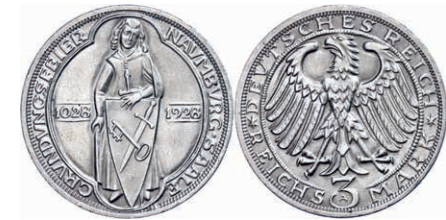
130 3 Reichsmark, 1928, Naumburg/Saale 900 Jahre Stadtrecht, vz. J. 333 60,—