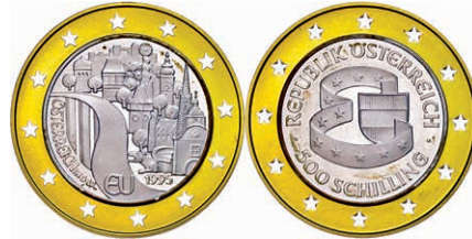
267 500 Schilling, Bimetall Gold/Silber, 1995, Österreich als Mitglied der EU, 986er Gold, 8,1 g, 900er Silber, 5,22 g, KM 3023, Schön 223, PP. 250,—