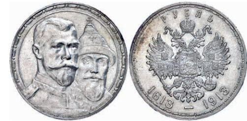
289 Rubel, 1913, Nikolaus II., St. Petersburg, 300 Jahre Romanov Dynastie, Bitkin 336, kl. Rf., vz. 80,—