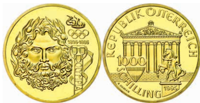
266 1000 Schilling, Gold, 1995, Zeus 100 Jahre Olympia, 16,97 g, 986er Gold, Fb. 922, in Kapsel, in Schatulle mit Zertifikat, PP. 600,—