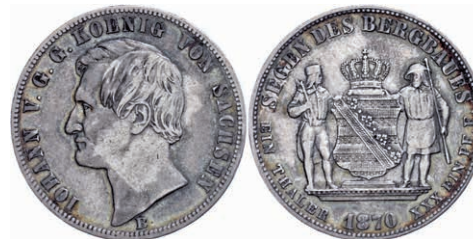
71 Taler, 1870, Johann, AKS 135, kl. Rf., ss. 60,—