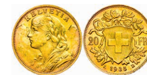
301 20 Franken, Gold, 1935, Vreneli, Fb. 499, kl. Rf., vz 180,—