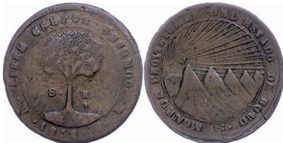
221 8 Reales, Kupfer, 1858, Variante mit "HOND", KM 21a, kl. Schröttingsriss und Schröttingsfehler, s-ss. 120,—