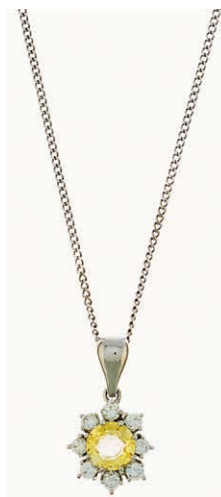
970 Repräsentativer Kettenanhänger mit zentralem Besatz aus einem unbehandelten gelben Saphir mit einem Durchmesser von ca. 7,0 mm von ca. 1,4 ct. umgeben von acht Brillanten, getestet, mit jeweils einem Durchmesser von ca. 2,5 mm von zusammen ca. 0,47 ct. an einer Flachpanzerkette. 585er WG. L. des Anhängers ca. 2,0 cm. L. der Kette ca. 40,0 cm. Ca. 4,0 gr. 300,—

Aufhängung ist mit elf Steinen im Brillantschliff besetzt. Die Ohrringe sind jeweils mit einem Hauptstein im Kissenschliff von ca. 5,5 x 5,5 mm von ca. 0,63 ct. umgeben von jeweils 24 Steinen im Brillantschliff besetzt. Der Ringkopf ist mit einem Hauptstein von ca. 5,5 x 5,5 mm von ca. 0,63 ct. umgeben von 24 Steinen im Brillantschliff besetzt, die Ringschiene ist umlaufend mit 35 Steinen im Brillantschliff besetzt. Alles 585er GG, jeweils gestempelt. 20. Jh. L. der dreifach längenverstellbaren Ankerkette ca. 45,0 cm. Kettenanhänger ca. 0,7/1,6 x 0,7 cm. Ohrringe ca. 0,7 x 0,7 cm. Ringgröße: Deutschland: 56; USA/Kanada: 6.5; Großbritannien: 02; Frankreich: 16. Zusammen ca. 9,70 gr. 340,—