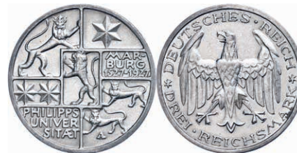
127 3 Reichsmark, 1927, 400-Jahrfeier der Gründung der Universität Marburg, f. vz. J. 330 50,—