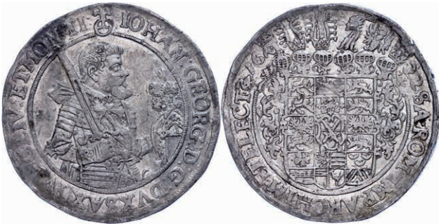
55 Taler, 1622, Johann Georg I., Schnee 818, Dav. 7591, etwas Belag, Präge-schwäche, leichter Prägeglanz, ss-vz. 180,—