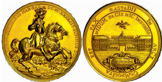
561 Baden, Goldmedaille (Dm. ca. 50,4mm, ca. 71,02g, 900er Gold), 1955, unsigniert, auf den 300. Geburtstag des Markgrafen Ludwig Wilhelm und den Frieden von Rastatt. Av: Der Markgraf zu Pferd nach rechts, darum Umschrift. Rev: Das Rastatter Schloss darüber Adler. Mit Randschrift, winzige Kratzer, f.st. (Abbildung auf 87% verkleinert) 3800,—