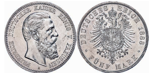
75 5 Mark, 1888, Friedrich III., Kratzer, kl. Rf., vz. J. 99 80,—