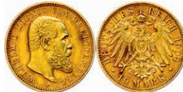
114 10 Mark, 1904, Karl, ss. J. 295 140,—