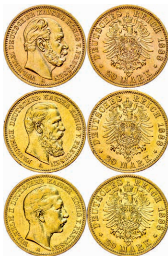
90 3x 20 Mark, 1888, Wilhelm I. bis Wilhelm II., in Holzschatulle, jeweils um ss bis vz. J. 246/248/250 800,—