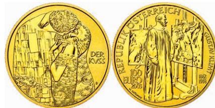
269 100 Euro, Gold, 2003, Malerei, 16g fein, mit Zertifikat in Ausgabeschatulle, st. 650,—