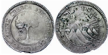
219 2 Reales, 1831, TF, KM 9.3, div. Kratzer, Schröttingsfehler am Rand, ss. 50,—