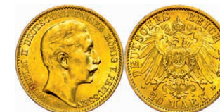
104 20 Mark, 1913, Wilhelm II., minimale Randfehler, ss-vz. J. 252 250,—