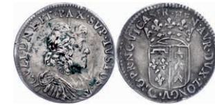
299 Neuenburg-Fürstentum, 10 Kreuzer, Silber, o.J (1648), Heinrich II 1595-1663, Nachahmung 1/12 Ecu von Ludvig XIII von Frankreich. Av.: Büste n. r. und Umschrift. Rev.: Wappen. HMZ 2-685, Kratzer im Aversfeld, Prüfhieb am Rand, wellig, selten, ss. 50,—