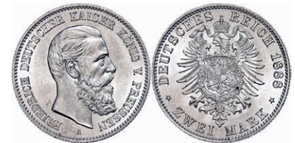
74 2 Mark, 1888, Friedrich III., vz-st. J. 98 50,—