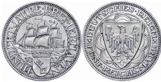
122 5 Reichsmark, 1927, Bremerhaven 100-Jahrfeier, kleine Randfehler, ss-vz. J. 325 180,—