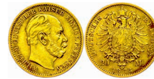
85 20 Mark, 1873, A, Wilhelm I., kl. Rf., ss. J. 243 250,—