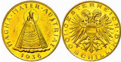
263 100 Schilling, Gold, 1936, Madonna von Mariazell, Fb. 522, Herinek 14, kleine Kratzer, vz. 1500,—