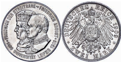
79 2 Mark, 1909, Friedrich August III., Universität Leipzig, wz. Kratzer, f. st. J. 138 60,—

Goldmünzen ab 1800 sowie Goldbarren sind als Anlagegold ggf. umsatzsteuerfrei (auch für das Aufgeld), soweit der Zuschlagpreis inkl. Aufgeld und Losgebühr nicht höher als der Goldwert + 80% ist.