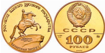
291 100 Rubel, Gold, 1990, Reiterdenkmal Peter I., Parchimowicz 272, Fb. 203, in Kapsel, mit Zertifikat, PP. 600,—