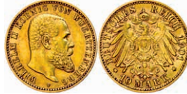
113 10 Mark, 1901, Karl, ss+. J. 295 140,—