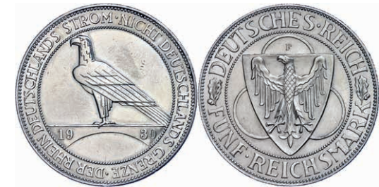
143 5 Reichsmark, 1930, Rheinlandräumung, Mzz F, Felder bearbeitet, kleine Randfehler, ss-vz. J. 346 50,—