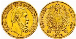
111 20 Mark, 1873, Karl, kleiner Randfehler, gutes ss. J. 290 250,—