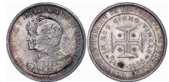
275 1000 Reis, 1898, Carlos I., 400 Jahre Entdeckung Indiens, kl. Rf. und Kr., vz+ 80,—