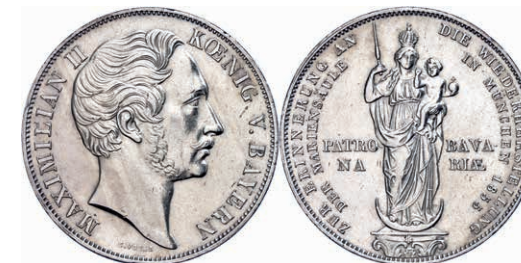
63 Doppelgulden, 1855, Maximilian II., Mariensäule München, AKS 168, J. 84, wz. Rf., vz. 50,—

Goldmünzen ab 1800 sowie Goldbarren sind als Anlagegold ggf. umsatzsteuerfrei (auch für das Aufgeld), soweit der Zuschlagpreis inkl. Aufgeld und Losgebühr nicht höher als der Goldwert + 80% ist.