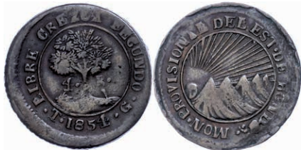
220 4 Reales, Kupfer, 1854, KM 20a, ss. 70,—