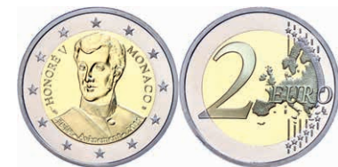
249 2 Euro, 2019, 200. Jahrestag der Thronbesteigung von Fürst Honoré V., in Kapsel, in Originalschatulle mit Zertifikat und Umverpackung, PP. 300,—