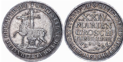
59 24 Mariengroschen, 1726, Christoph Friedrich, IIG, Dav. 1000, hübsche Patina, ss+. 100,—