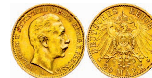
103 20 Mark, 1909 A, Wilhelm II., kl. Rf., vz. J. 252. 300,—