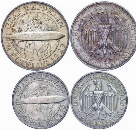
139 3 und 5 Reichsmark, 1930, A, Zeppelin, je kl. Rf., kl. Kr., vz. J. 342/343 100,—