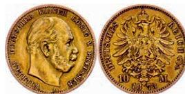
83 10 Mark, 1873 A, Wilhelm I., ss. J. 242 150,—