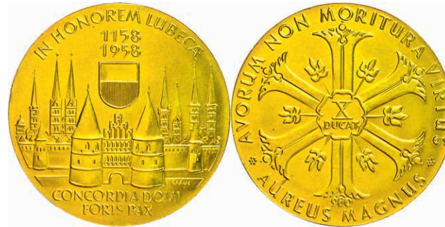
564 Goldmedaille zu 10 Dukaten (Dm. ca. 50,1mm, ca. 34,97g), unsigniert, 1958, 800 Jahre Holstentor. Punziert "980", kl. Rf., vz-st. (Abbildung auf 88% verkleinert) 1300,—