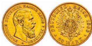
92 20 Mark, 1888, Friedrich III., kl. Kr., kl. Rf., ss-vz. J. 248. 250,—