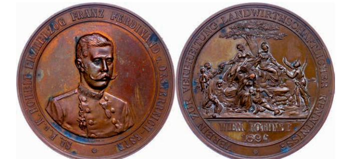
479 Österreich, Wien, Bronzemedaille (Dm. ca. 65,0mm, ca. 103,41g), 1894, von Bachrach, auf die internationale Ausstellung für Volksernährung und Hygiene in Wien vom Verein für Verbreitung landwirtschaftlicher Kenntnisse. Av: Brustbild Franz Ferdinands schräg rechts. Rev: Zwei Frauen unter einem Baum sitzend einem Soldaten und einer Frau mit Kindern Essen reichend, darunter eine Frau die einen Mann aufrichtet. Wurzbach 2436. Im Originaltueti (beschädigt), etwas Belag, kl. Kr., kl. Rf., vz. (Abbildung auf 67% verkleinert) 70,—