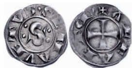
222 Siena, Grosso (1,76g), o.J. (12./13. Jh.). Av: "S" zwischen zwei Doppelpunkten, darum "SENAVETVS". Rev: Kreuz, darum "ALFAETM". Ss. 70,—