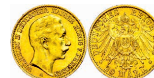
102 20 Mark, 1909 A, Wilhelm II., kl. Rf., kl. Kr., vz. J. 252. 300,—