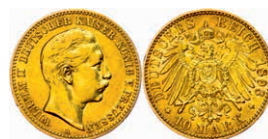
96 10 Mark, 1893, Wilhelm II., ss. J. 251 120,—