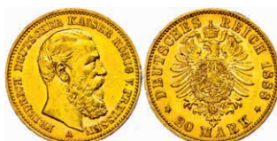
93 20 Mark, 1888, Friedrich III., kl. Rf., ss. J. 248 250,—