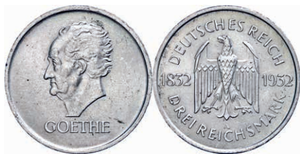
146 3 Reichsmark, 1932, Johann Wolfgang von Goethe, Mzz A, kleine Randfehler, ss-vz. J. 350 20,—