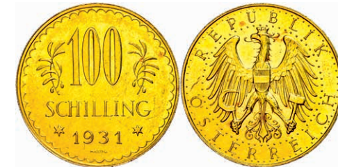
261 100 Schilling, Gold, 1931, Fb. 520, Kratzer, vz. 800,—