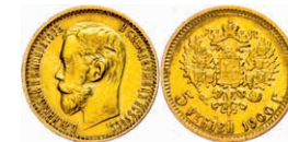
287 5 Rubel, Gold, 1900, Nikolaus II., Fb. 180, kl. Rf., ss. 150,—