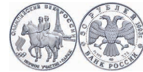
298 50 Rubel, Platin, 1993, Olympische Spiele 1900 in Paris, Parch. 1604, in Kapsel, 7,78g. Auflage 7500 Exemplare, PP. 350,—