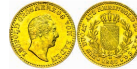
61 Dukat (Rheingolddukat), 1846, Carl-Leopold Friedrich 1830-1852, in der Jahreszahl "1" rückgewandt, keine Signatur "D" im Halsabschnitt, 3,68g, feine Kratzer im Aversfeld, f. vz, AKS 74, J. 52b., Fr. 153. Auflage 1950 Stück. 2000,—