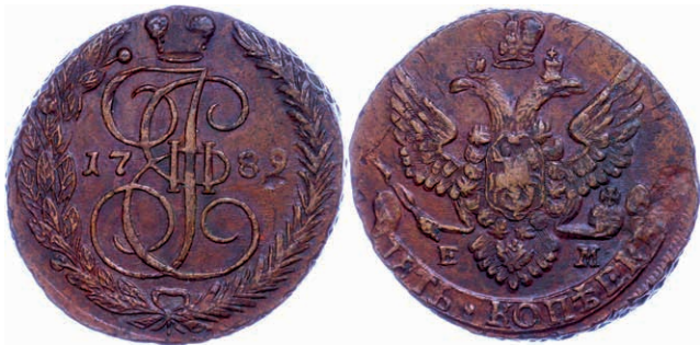
278 5 Kopeken, 1789, Katharina II., Ekaterinburg, Bitkin 643, ss-vz. 30,—