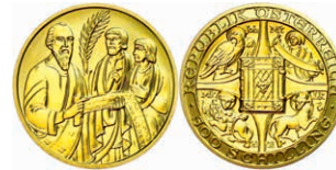
268 500 Schilling, Gold, 2001, Die Bibel, Fb. 935, 10g fein, mit Zertifikat in Ausgabeschatulle, st. 350,—