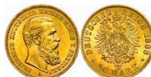
95 20 Mark, 1888, Friedrich III., kleine Randfehler, vz. J. 248 250,—