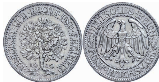
128 5 Reichsmark, 1929, Eichbaum, Mzz F, Randfehler, ss. J. 331 100,—