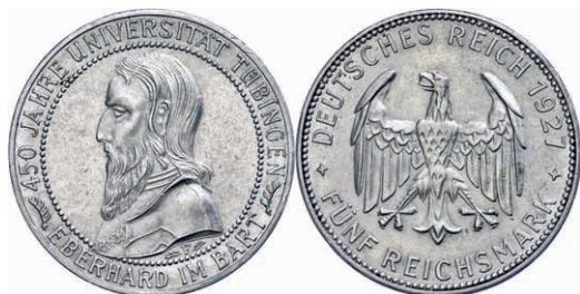
125 5 Reichsmark, 1927, 450-Jahrfeier der Gründung der Universität Tübingen, kleine Randfehler, f. vz. J. 329 180,—