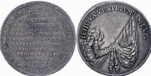
56 Taler, 1691, Johann Georg III., auf seinen Tod, Schnee 971, Dav. 7643, Slg. Merseb. 1271, justiert, ss-vz. 450,—