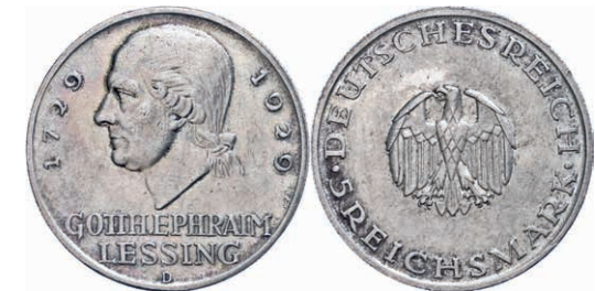
133 5 Reichsmark, 1929, Gotthold Ephraim Lessing, Mzz D, kleine Randfehler, berieben, ss. J. 336 50,—