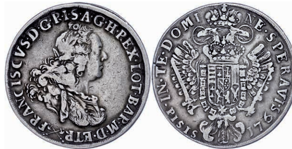
224 Toskana, Francescone (10 Paoli), 1765, Franz II., Dav. 1505, kl. Kratzer auf dem Avers, ss. 160,—