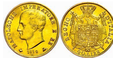
225 40 Lire, Gold, 1814, Napoleon, Mailand, Fb. 5, kl. Rf., bearbeitete Stellen, vz. 400,—