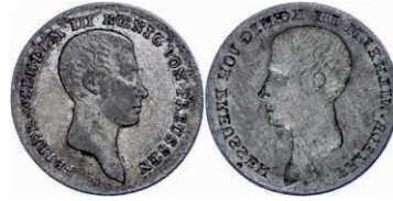
68 1/6 Taler, o.J. (1809-1818), Friedrich Wilhelm III., inkuse Vorderseitenprägung, AKS 24, J. 31, ss. Sehr selten! 180,—