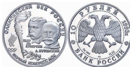
297 10 Rubel 1993, Palladium, "Väter der Olympischen Idee", 15,5g, Auflage 7500 Ex., mit Zertifikat in Ausgabeetui, KM 352, Parch. 1351, selten, PP. 950,—