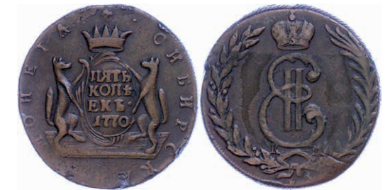
276 5 Kopeken (32,10g), 1770, Katharina II., Suzun, Bitkin 1066, Randfehler, ss. 30,—