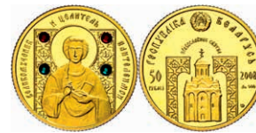
329 50 Rubel, Gold, 2008, PP. 350,—