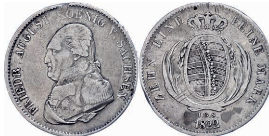
70 Taler, 1822, Friedrich August I., AKS 24, J. 33, Avers min. justiert, Rf., Fassungsspur. 50,—