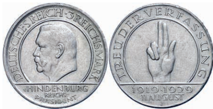
137 3 Reichsmark, 1929, Schwurhand, Mzz J, kleine Randfehler, ss-vz. J. 340 Gebot