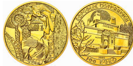
270 100 Euro, Gold, 2004, Wiener Secession, 16g fein, mit Zertifikat in Ausgabeschatulle, st. 650,—