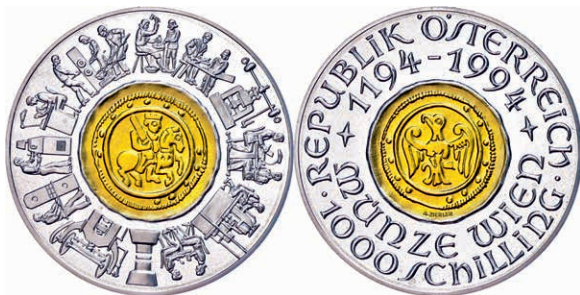
265 1000 Schilling, Bimetall Gold/Silber, 1994, 800 Jahre Münze Wien, Zentrum aus 13g Feingold, mit Zertifikat in Ausgabeschatulle, PP. 450,—