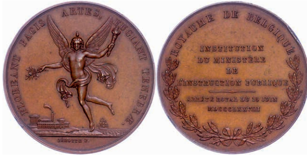
462 Belgien, Bronzemedaille (Dm. ca. 42,8mm, ca. 30,06g), 1878, von Jéhotte. Av: Genius mit Lorbeerzweig und Fackel, im Hintergrund Gebäude und Segelschiff. Rev: 6 Zeilen Schrift im Lorbeerkranz. Randfehler, vz. 30,—