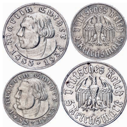
147 2 und 5 Reichsmark, 1933, Mzz A, Martin Luther, ss-vz. J. 352, 353. 100,—