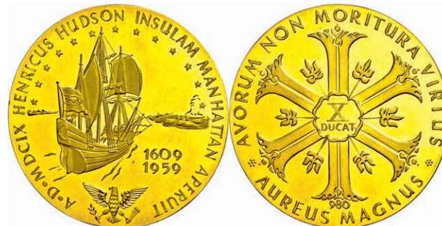
566 Goldmedaille zu 10 Dukaten (Dm. ca. 50,1mm, ca. 34,91g), unsigniert, 1959, auf die Entdeckung Manhattans durch Henry Hudson. Punziert "980", kleine Prüfspur, kl. Kr., vz-st. (Abbildung auf 88% verkleinert) 1300,—