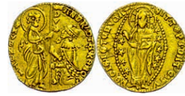
223 Venedig, Zecchino (3,39g), o.J. (1368-1382), Andrea Contarini, Fb. 1227, ss. 310,—