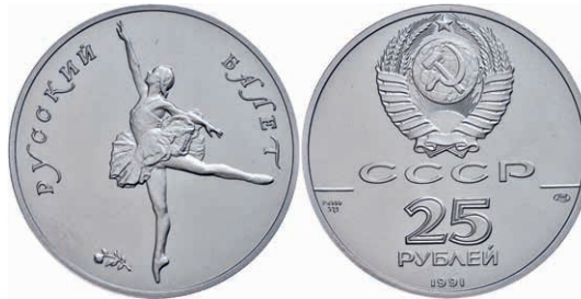
295 25 Rubel, Palladium, 1991, Ballerina, 1 oz, Fb. B8, in Kapsel, st. 1800,—