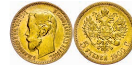
285 5 Rubel, Gold, 1900, Nikolaus II., Fb. 180, berieben, ss. 150,—