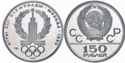
290 150 Rubel, Platin, 1977, Olympia-Emblem, Fb. 182, KM 152, berührte PP. 350,—