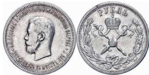
283 Rubel, 1896, Nikolaus II., St. Petersburg, Bitkin 322, kl. Rf., berieben, vz. 200,—