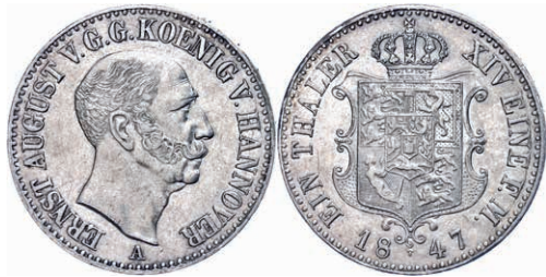
66 Taler, 1847, Ernst August, AKS 105, kleiner Randfehler, ss-vz. 70,—