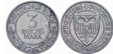
119 3 Reichsmark, 1926, Lübeck 700 Jahre Reichsfreiheit, ss-vz. J. 323 30,—