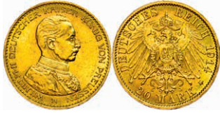
107 20 Mark, 1914, Wilhelm II. in Gardeuniform, kleine Randfehler, ss-vz. J. 253 250,—