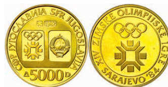
226 5000 Dinar 1982, 900er Gold, 8g, Rev.: Emblem der Olympiade Sarajevo 1984, mit Zertifikat und Etui, Exemplare 55.000, vz aus PP, KM 95. 330,—