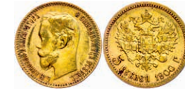
286 5 Rubel, Gold, 1900, Nikolaus II., Fb. 180, etwas Belag, kl. Rf., ss. 150,—