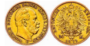
87 20 Mark, 1873, Wilhelm I., Mzz C, ss. J. 243 250,—