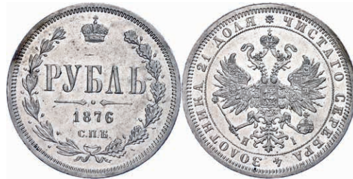
281 Rubel, 1876, Alexander II., St. Petersburg, Bitkin 89, kl. Kratzer, kl. Rf., vz. 200,—