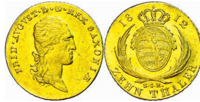
69 10 Taler, Gold, 1812, Friedrich August I., SGH, AKS 1, kl. Kratzer, Rand stellenweise bearbeitet, ss. 600,—