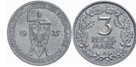
117 3 Reichsmark, 1925, 1000 Jahre Rheinlande, Mzz A, kleine Kratzer, winzige Randfehler, vz. J. 321 20,—