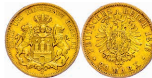
81 20 Mark, 1878, kl. Rf., ss. J. 210 250,—