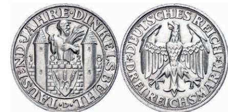
131 3 Reichsmark, 1928, 1000-Jahrfeier Dinkelsbühl, kleine Randfehler, ss-vz. J. 334 300,—