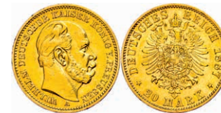
89 20 Mark, 1887, A, Wilhelm I., kl. Rf., ss-vz, J. 246 300,—