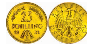
262 25 Schilling, Gold, 1931, Fb. 521, kleine Kratzer und Randfehler, vz. 200,—