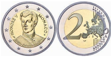
252 2 Euro, 2019, 200. Jahrestag der Thronbesteigung von Fürst Honoré V., in Kapsel, in Originalschatulle mit Zertifikat und Umverpackung, PP. 300,—