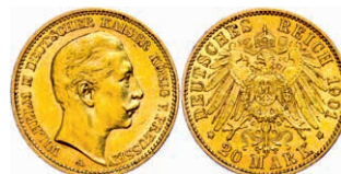
100 20 Mark, 1901, Wilhelm II., ss-vz. J. 252 250,—