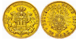
82 20 Mark, 1887, kl. Rf., ss. J. 210 250,—