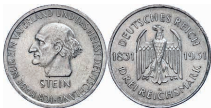
145 3 Reichsmark, 1931, Reichsfreiherr vom und zum Stein, kleine Randfehler, vz. J. 348 40,—