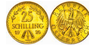
259 25 Schilling, Gold, 1926, Fb. 521, vz. 200,—