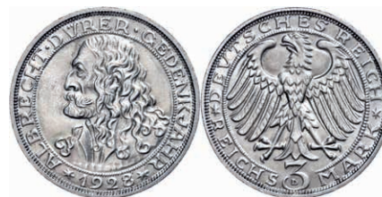
129 3 Reichsmark, 1928, Albrecht Dürer, minimale Randfehler, vz. J. 332 160,—