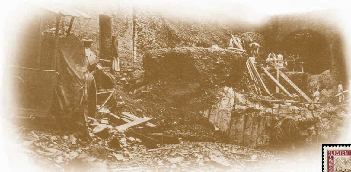
Abbildung oben: Wetterkatastrophe im Ahrtal 13. Juni 1910 - Altenahr Verwüstete Chaussee mit der in Abgrund gestürzten Dampfwalze

Alle Erlöse einschließlich Aufgeld und Losgebühr kommen den Flutopfern zu Gute.