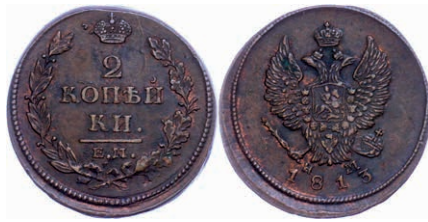
280 2 Kopeken, 1813, Alexander I., Ekaterinburg, Bitkin 353, Kratzer, ss-vz. 30,—