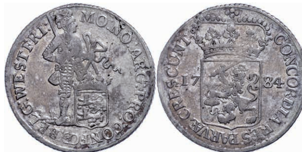
256 Westfriesland, Silberdukat, 1784, Delm. 971, kl. Schrötlingsfehler, ss. 70,—