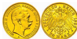
98 20 Mark, 1896, A, Wilhelm II., f. st. J. 252. 375,—