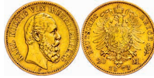
112 20 Mark, 1873, Karl, ss. J. 290 250,—