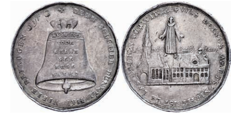
335 Hamburg, Silbermedaille (Dm. ca. 32mm, ca. 43g), o.J. (um 1708), un-sign., auf die von Pastor Christian Crumholz verursachten Unruhen. Av: Geistlicher über Kirche, darum Umschrift. Rev: Glocke mit Namen der Anführer, darum Umschrift. Gaedechens 1711, Randfehler, ss. 500,—

heit. Av: Männliche Gestalt pflanzt einen Baum. Rev: 2 trinkende Kartenspieler sich gegenüber sitzend. Felder bearbeitet, vz. 30,—