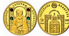
330 50 Rubel, Gold, 2008, in Kapsel, PP. 350,—