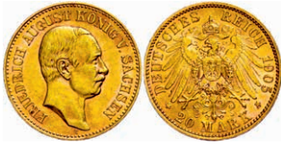
108 20 Mark, 1905, Friedrich August III., wz. Rf., f. vz. J. 268 300,—