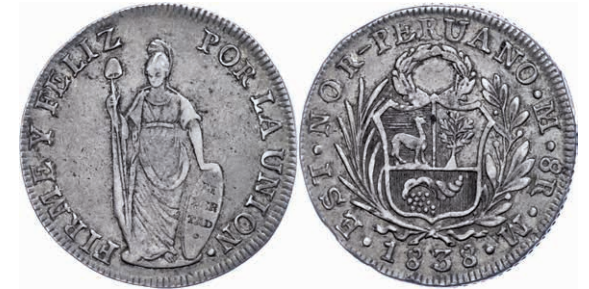
274 Nord Peru, 8 Reales, 1838, Lima, M, KM 155, ss. 70,—