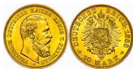
91 10 Mark 1888 A, Friedrich III., vz+, J. 247. 180,—