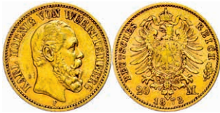
109 20 Mark, 1872, Karl, kleine Randfehler, kleiner Schrötlingsfehler, ss. J. 290 250,—