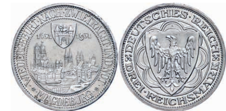
144 3 Reichsmark, 1931, Magdeburg, kleine Randfehler, vz. J. 347 100,—