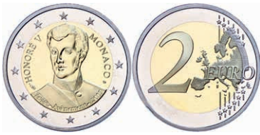
250 2 Euro, 2019, 200. Jahrestag der Thronbesteigung von Fürst Honoré V., in Kapsel, in Originalschatulle mit Zertifikat und Umverpackung, PP. 300,—