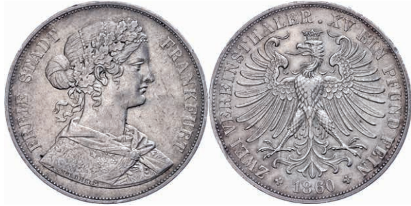
64 Doppeltaler, 1860, AKS 4, J. 43, kl. Rf., ss. 70,—