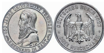
124 3 Reichsmark, 1927, 450-Jahrfeier der Gründung der Universität Tübingen, kleine Randfehler, Avers berieben, vz. J. 328 140,—