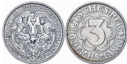
123 3 Reichsmark, 1927, Nordhausen 1000 Jahre Königspfalz, kleine Randfehler, vz. J. 327 40,—