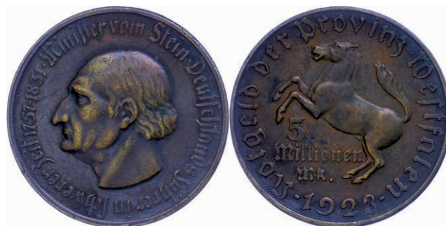
150 Provinz Westfalen, 5 Mill. Mark 1923, vom Stein, Wert Dreizeilig mit Mk, selten, kl. Rf., sehr schön - vorzüglich, J. N21, Funck 645.10C. 120,—