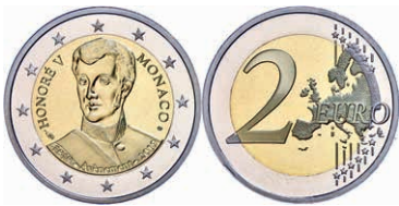
253 2 Euro, 2019, 200. Jahrestag der Thronbesteigung von Fürst Honoré V., in Kapsel, in Originalschatulle mit Zertifikat und Umverpackung, PP. 300,—

Alle Einzellose und Zertifikate/Gutachten sind unter www.rhenumis.de farbig abgebildet!