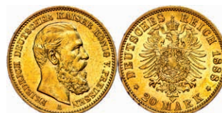
94 20 Mark, 1888, Friedrich III., kleine Randfehler, kleine Kratzer, ss-vz. J. 248 250,—