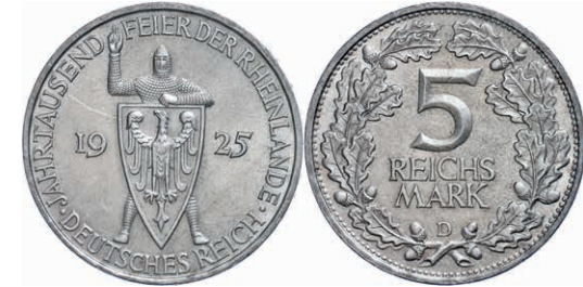
118 5 Reichsmark, 1925, 1000 Jahre Rheinlande, Mzz D, kleine Randfehler, vz. J. 322 40,—