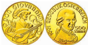
264 500 Schilling Gold, 1991, Mozart "Don Giovanni", 8 g, 986er Gold, Fb. 915, in Kapsel, in Samtschatulle mit Zertifikat, am Rand leicht angelaufen, PP. 300,—