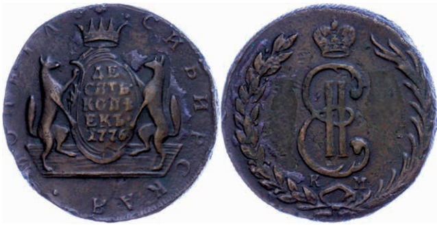
277 10 Kopeken (62,36g), 1776, Katharina II., Suzun, Bitkin 1035, Schröttingsfehler, ss. (Abbildung auf 95% verkleinert) 50,—