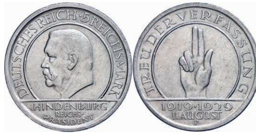
138 5 Reichsmark, 1929, Schwurhand, Mzz F, kleine Randfehler, ss. J. 341 50,—