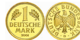
157 1 DM, 2001, D, Abschiedsmark, in Kapsel, st, J. 481. 500,—