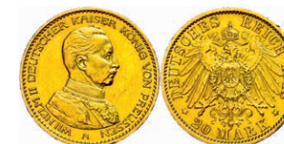
105 20 Mark, 1913, Wilhelm II. in Gardeuniform, kleine Randfehler, vz. J. 253 250,—