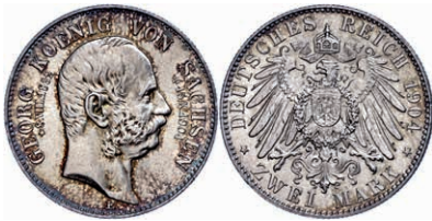
78 2 Mark, 1904, Georg, Auf seinen Tod, vz-st. J. 132 70,—