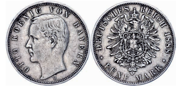
72 5 Mark, 1888, Otto, kl. Rf., berieben, ss. J. 44 200,—