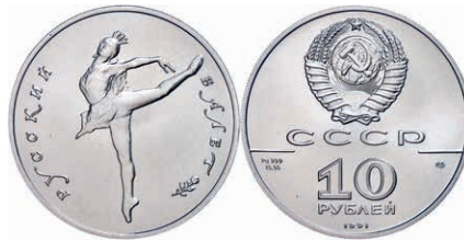
294 10 Rubel, Palladium, 1991, Ballerina, 1/2 oz, Fb. B9, in Kapsel, st. 900,—