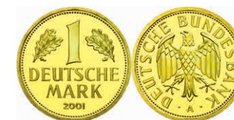
156 1 DM, 2001, A, Abschiedsmark, in Kapsel, st, J. 481. 500,—