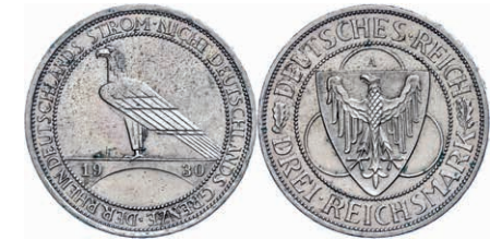
142 3 Reichsmark, 1930, Rheinlandräumung, Mzz A, kleine Randfehler, vz. J. 345 Gebot