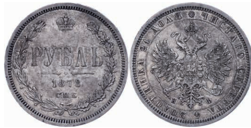
282 Rubel, 1878, Alexander II., St. Petersburg, Bitkin 92, kl. Rf., vz. 110,—