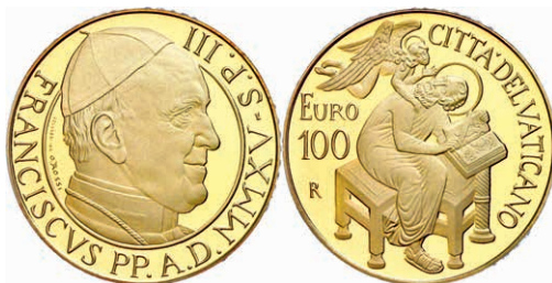
328 100 Euro, Gold, 2015, Franziskus, Die Evangelisten: Matthäus, 30g 917er Gold, mit Zertifikat in Ausgabeschatulle und Umverpackung, PP. Auflage 999 Stück. 1800,—