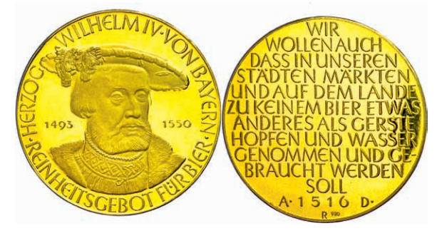
567 BAYERN, Goldmedaille zu 5 Dukaten o.J. (1960), 40,1 mm; 17,29 g, gestempelt 980er Gold, Stempel von Karl Roth, auf das bayerische Reinheitsgebot für Bier. Herzog Wilhelm IV von Bayern. Av.: Büste des Herzogs fast von vorn mit Barett. Rev: 12 Zeilen Schrift. Ehling 193., vz aus PP 700,—