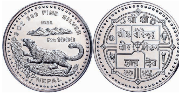
254 1000 Rupien, Silber, 1988, Schneeleopard, 5 oz, KM 1036, in Kapsel, mit Zertifikat des Anbieters, PP. (Abbildung auf 67% verkleinert) 100,—