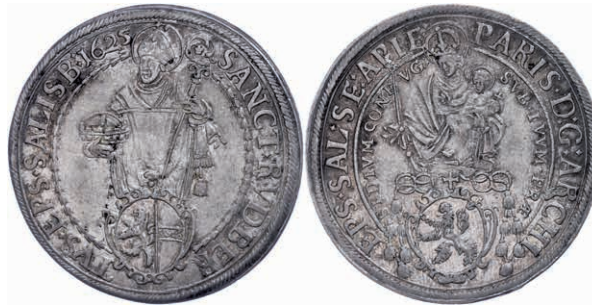
58 Taler, 1625, Paris Graf von Lodron, Zöttl 1476, Probszt 1199, f. vz. 150,—