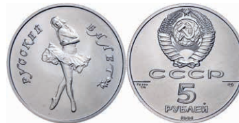
296 5 Rubel, Palladium, 1991, Ballerina, 1/4 oz, Fb. B10, in Kapsel, st. 450,—