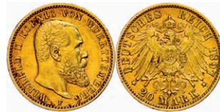
116 20 Mark, 1897, Wilhelm II., kleine Randfehler, ss. J. 296 250,—

Alle Einzellose und Zertifikate/Gutachten sind unter www.rhenumis.de farbig abgebildet! Dort sind auch 258 weitere Lose zu finden, die nicht im gedruckten Katalog, sondern nur im Internet zu finden sind!