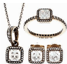
969 Äußerst repräsentative Demiparure bestehend aus einer Kette, einem Ring und einem Paar Ohrringen, alle mit Besatz aus facettierten Zirkonia, die Hauptsteine im Kissenschliff. Der Kettenanhänger ist mit einem Hauptstein von ca. 5,5 x 5,5 mm von ca. 0,63 ct. umgeben von 24 Steinen im Brillantschliff besetzt, die

Aufhängung ist mit elf Steinen im Brillantschliff besetzt. Die Ohrringe sind jeweils mit einem Hauptstein im Kissenschliff von ca. 5,5 x 5,5 mm von ca. 0,63 ct. umgeben von jeweils 24 Steinen im Brillantschliff besetzt. Der Ringkopf ist mit einem Hauptstein von ca. 5,5 x 5,5 mm von ca. 0,63 ct. umgeben von 24 Steinen im Brillantschliff besetzt, die Ringschiene ist umlaufend mit 35 Steinen im Brillantschliff besetzt. Alles 585er GG, jeweils gestempelt. 20. Jh. L. der dreifach längenverstellbaren Ankerkette ca. 45,0 cm. Kettenanhänger ca. 0,7/1,6 x 0,7 cm. Ohrringe ca. 0,7 x 0,7 cm. Ringgröße: Deutschland: 56; USA/Kanada: 6.5; Großbritannien: 02; Frankreich: 16. Zusammen ca. 9,70 gr. 340,—