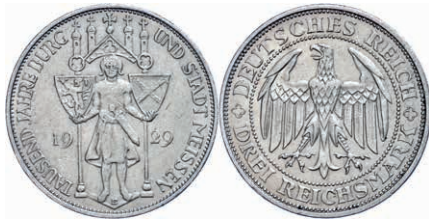
135 3 Reichsmark, 1929, Meißen 1000 Jahre Burg und Stadt, kleine Randfehler, ss-vz. J. 338 Gebot