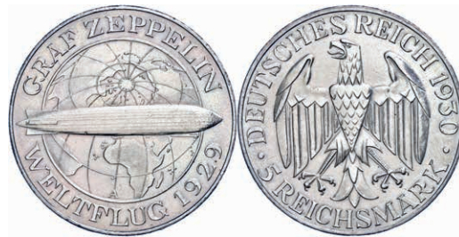
140 3 Reichsmark, 1930, Zeppelin, Mzz A, ss. J. 342 50,—