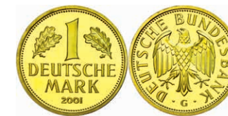
159 1 DM, 2001, G, Abschiedsmark, in Kapsel, st, J. 481. 500,—