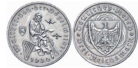
141 3 Reichsmark, 1930, Walther von der Vogelweide, Mzz A, kleine Randfehler, vz. J. 344 30,—