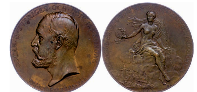
482 Schweden, Stockholm, Bronzemedaille (Dm. ca. 61mm, ca. 102,05g), 1897, von Lindberg, auf die Kunst- und Industrieausstellung in Stockholm. Av: Kopf Oscar II. nach links. Rev: Weibliche Gestalt auf Wolke sitzend mit Palmzweig