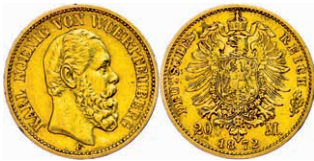
110 20 Mark, 1872, Karl, kleine Randfehler, ss. J. 290 250,—