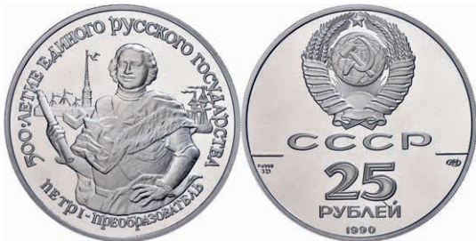
292 25 Rubel, Palladium, 1990, Zar Peter I., 1 oz, Parchimowicz 251, in Kapsel, PP. 1800,—