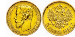
284 5 Rubel, Gold, 1898, Nikolaus II., Fb. 180, ss-vz. 150,—