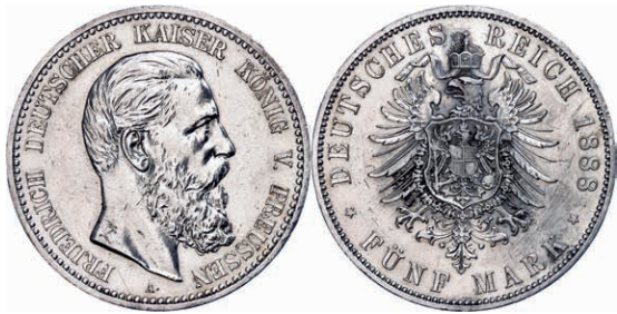
76 5 Mark, 1888, Friedrich III., kl. Kr., wz. Rf., f. vz. J. 99 80,—