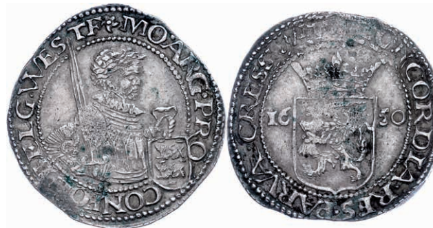
255 Westfriesland, Taler, 1650, Prägeschwäche, ss-vz. 90,—