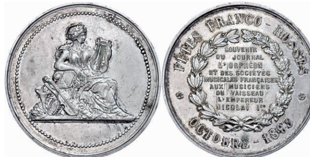
475 Frankreich, Toulon, Nickelmedaille (Dm. ca. 46,3mm, ca. 44,93g), 1893, unsigniert, auf die Musiker des russischen Schlachtschiffs Imperator Nikolaus I.. Av: Sitzende männliche Gestalt mit Lorbeerkranz und Lyra, zu Füßen andere Instrumente. Rev: 9 Zeilen Schrift in Eichen- Lorbeerkranz, darum Umschrift. Rand punziert, kl. Kr., kl. Rf., vz. (Abbildung auf 94% verkleinert) 50,—