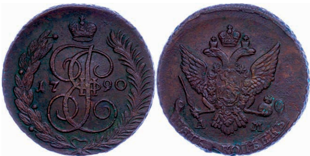
279 5 Kopeken, 1790, Katharina II., Anninskoye, Bitkin 860, Schröttingsfehler, vz. (Abbildung auf 96% verkleinert) 50,—