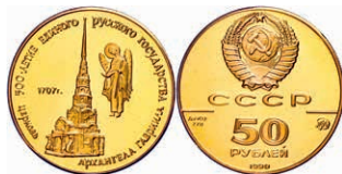
293 50 Rubel, Gold, 1990, Kirche des Erzengels Gabriel in Moskau, Parchimowicz 260, Fb. 204, in Kapsel, PP. 300,—