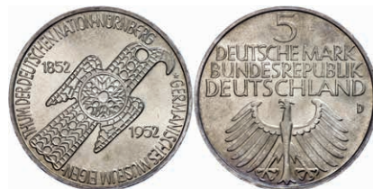
151 5 Mark, 1952, Germanisches Museum, kl. Rf. und Kr., f. st. J. 388 250,—