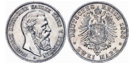
73 2 Mark, 1888, Friedrich III., berieben, vz+, J. 98 30,—