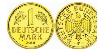
158 1 DM, 2001, F, Abschiedsmark, in Kapsel (beschädigt), kl. rote Flecken, st, J. 481. 500,—