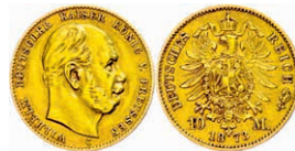
84 10 Mark, 1873, C, Wilhelm I., ss. J. 242 150,—