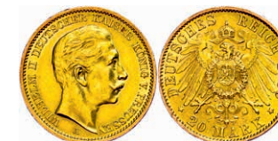
101 20 Mark, 1909 A, Wilhelm II., kl. Rf., kl. Kr., vz. J. 252 300,—