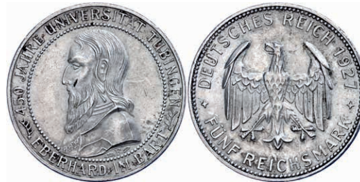
126 5 Reichsmark, 1927, Universität Tübingen, kl. Rf., vz. J. 329 200,—