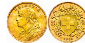
300 20 Franken, Gold, 1935, B, Vreneli, kl. Rf., Fb. 499, vz. 200,—