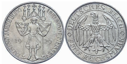
136 5 Reichsmark, 1929, Meißen 1000 Jahre Burg und Stadt, ss. J. 339 140,—