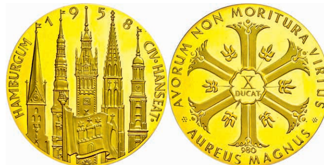
565 Goldmedaille zu 10 Dukaten (Dm. ca. 50,1mm, ca. 35,00g), unsigniert, 1958, auf die Hansestadt Hamburg. Punziert "980", kl. Kr., vz-st. (Abbildung auf 88% verkleinert) 1300,—