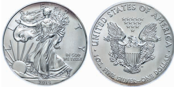
320 1 Dollar, 2014, Silver Eagle, in Slab der PCGS mit der Bewertung MS70, First Strike, Government Box #5, Mercanti Label, etwas angelaufen. 150,—