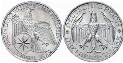
134 3 Reichsmark, 1929, Waldeck Vereinigung mit Preußen, kleine Randfehler, winzige Kratzer, vz. J. 337 40,—