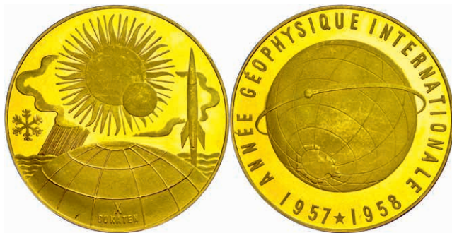
563 Goldmedaille zu 10 Dukaten (Dm. ca. 50,1mm, ca. 34,96g), unsigniert, 1958, auf das internationale geophysikalische Jahr. Av: Globus mit Satellitenorbit. Rev: Globus, im Hintergrund Mond und Sonne, daneben Rakete und Wolken. Ohne Punze, kl. Kr., vz-st. (Abbildung auf 88% verkleinert) 1300,—