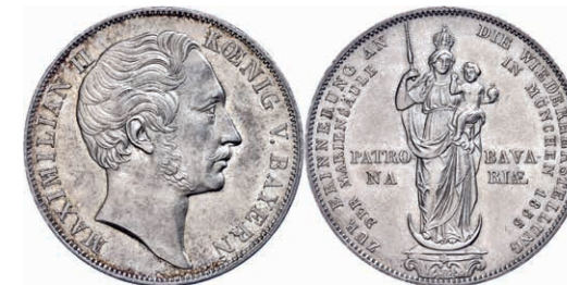
62 Doppelgulden, 1855, Maximilian II., Mariensäule München, AKS 168, J. 84, kl. Rf. und Kr., vz 45,—