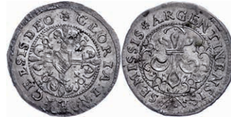
60 1/2 Gros, o.J. (17. Jh.), ss-vz. 45,—