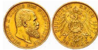
115 20 Mark, 1897, Wilhelm II., kleine Randfehler, ss-vz. J. 296 250,—