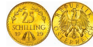
260 25 Schilling, Gold, 1929, Fb. 521, vz-st. 200,—