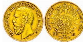
80 10 Mark, 1873, Friedrich I., kl. Rf., ss. J. 183 180,—