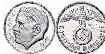
331 2 Reichsmark 1938, versilberte Æ-Medaille (ca.8,06g) in der Größe von 2 Reichsmark. Av: vgl. J. 366. Rev: Kopf Hitlers nach links. Vgl. KM X27. Rand bearbeitet, leicht angelaufen, PP. 50,—