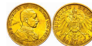
106 20 Mark, 1913, Wilhelm II., wz. Rf., vz. J. 253 250,—