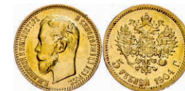
288 5 Rubel, Gold, 1904, Nikolaus II., Fb. 180, poliert, Randfehler, ss. 150,—