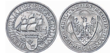
120 3 Reichsmark, 1927, Bremerhaven 100-Jahrfeier, kleine Randfehler, vz. J. 324 80,—