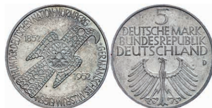
152 5 Mark, 1952, Germanisches Museum, wz. Rf., Patina, f. st. J. 388 200,—