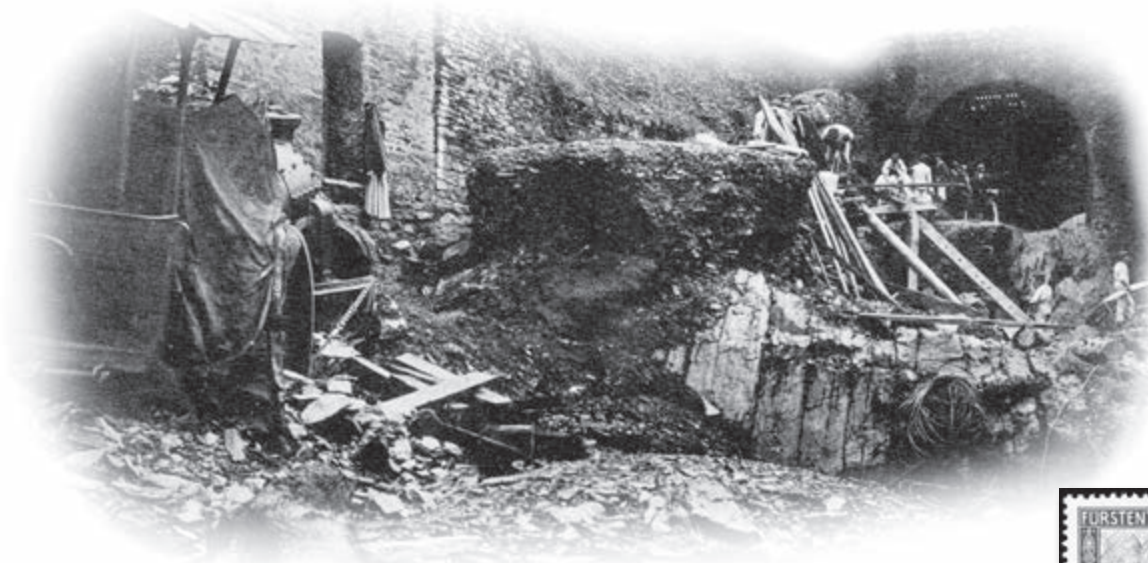
Abbildung oben: Wetterkatastrophe im Ahrtal 13. Juni 1910 - Altenahr Verwüstete Chaussee mit der in Abgrund gestürzten Dampfwalze

Alle Erlöse einschließlich Aufgeld und Losgebühr kommen den Flutopfern zu Gute.