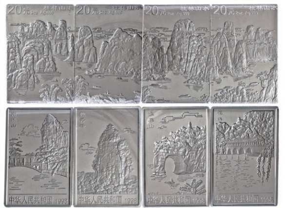
1301 Abbildung 50%