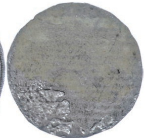
ss 23 50,—