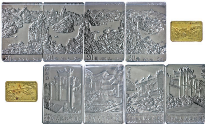
1294 Abbildung 50%