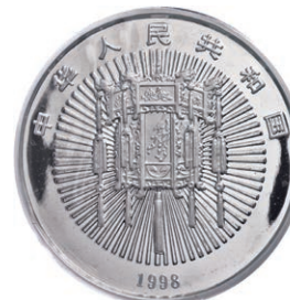
1302 Abbildung 50%