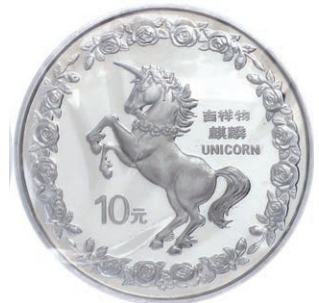
1279 Abbildung 50%