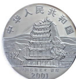
1305 Abbildung 50%