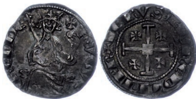
17P o.J.(1324-1359), Grosso, Hugo IV., Zypern, 4,56g, ss.....