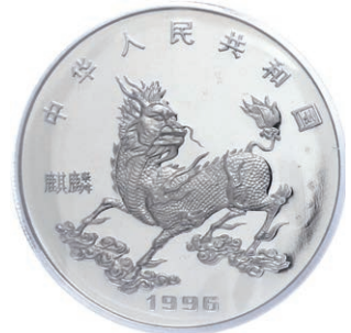
1275 Abbildung 50%