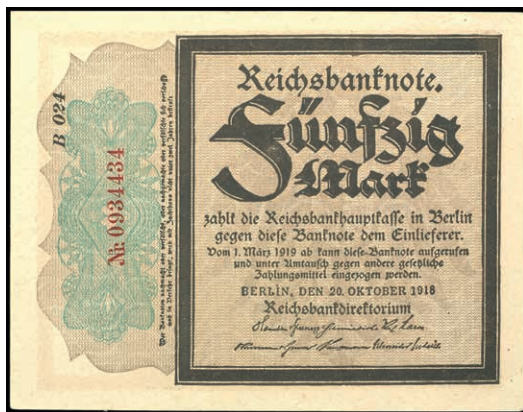
618 50 Mark, 20. Oktober 1918, Trauerschein, Wz. waagerechte Wellenlinien. KN 7-stellig rot, Serie B. Rosenberg 56b, Erhaltung I. (Abbildungen siehe Onlinekatalog) (Abbildung auf 50% verkleinert) 100,—