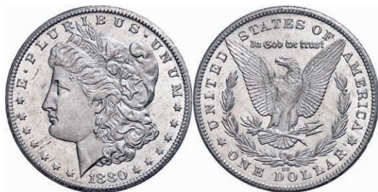
345 1 Dollar, 1880, Carson City, KM 110, kl. Kratzer, vz-st. Laut beiliegendem Unterlegzettel mit MS63 bewertet. 280,—