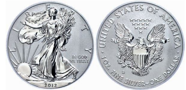
368 1 Dollar, 2012, S, Silver Eagle, in Slab der PCGS mit der Bewertung PR70, 75. Jahrestag SF Mint Set, Reverse Proof, First Strike, Mercanti- Flag Label. 130,—