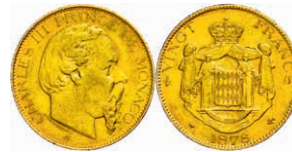
295 20 Francs, Gold, 1878, Charles III., Fb. 12, kl. Rf., ss. 300,—