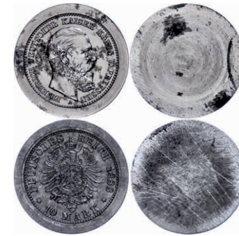
385 Preußen, Friedrich III., Dickabschläge des Avers und Revers des 10 Mark Stücks 1888 (J. 247) auf Eisenschrotlingen (ca. 14,7g bzw. 15,4g), leicht korrodiert, zaponiert, sehr selten! 200,—