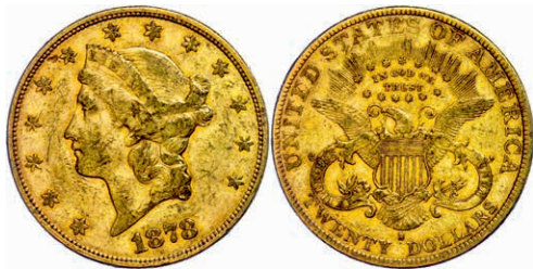
343 20 Dollars, Gold, 1878, San Francisco, Fb. 178, kl. Rf. und Kr., ss. 1200,—