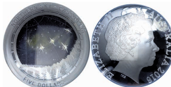
216 5 Dollars, 2016, Northern Sky - Cassiopeia, 1 Unze Silber, gewölbt, coloriert, Etui mit OVP und Zertifikat, PP. Auflage nur 5.000 Stück. 120,—