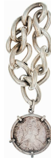
1022 Extravagantes Panzerkettenarmband mit Anhänger in Form eines Maria-Theresien-Talers in Fünf-Krappen-Fassung. 2. Hälfte 20. Jh. 925er Sterling Silber, gestempelt. Länge ca. 23,5 cm. Breite ca. 2,2 cm. Durchmesser des Anhängers ca. 4,6 cm. Ca. 263,25 gr. 190,—