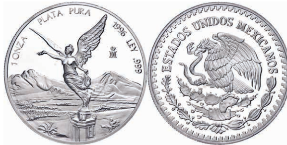
293 Set zu 1/20, 1/10, 1/4, 1/2 und 1 Onza, 1996, Libertad, in Kapseln, PP. 600,—