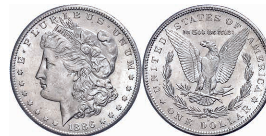
353 1 Dollar, 1886, San Francisco, KM 110, kl. Kratzer, vz-st. Laut beiliegendem Unterlegzettel mit MS63 bewertet. 120,—