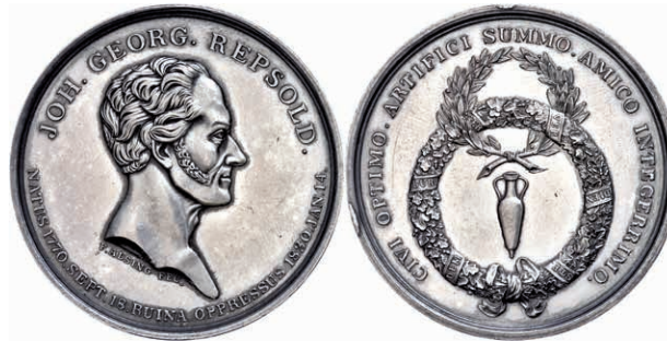
398 Hamburg, versilberte Bronzemedaille (Dm. ca. 43mm, ca 43,44g), 1830, von Alsing, auf den Tod von Johann Georg Repsold. Av: Kopf nach rechts, darum Umschrift. Amphore im doppelten Kranz, darum Umschrift. Wz. Rf., vz-st. 300,—