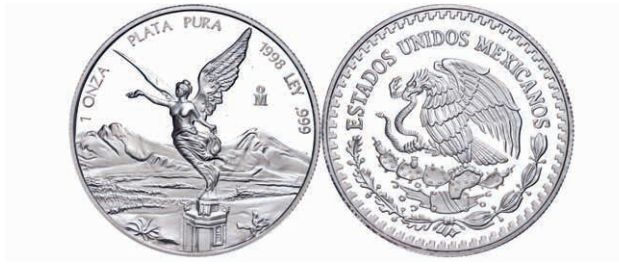
294 1998, Kompletter Satz Libertad. 1/20, 1/10, 1/4, 1/2 und 1 Onza. Sehr seltener Satz, der kaum einmal angeboten wird. Fehlt in fast jeder Sammlung. In Kapseln, PP. (Abbildung auf 88% verkleinert) 1500,—