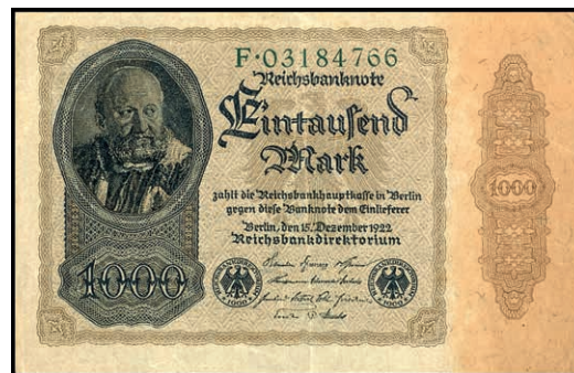
621 1000 Mark, 15. Dezember 1922, Wz. "Wertzahl 1000 im Spiralband", KN 8-stellig grün, Serie F. Rosenberg 81a, Erhaltung II. (Abbildung auf 50% verkleinert) 100,—