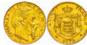
296 20 Francs, Gold, 1879, Charles III., Fb. 12, kl. Rf., ss. 220,—