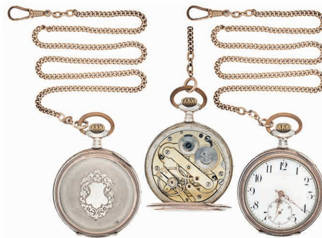
1053 Äußerst dekorative Herrentaschenuhr mit separater Sekunde und rückseitig floral umkränzter Wappenkartusche. Wohl 1. Viertel 20. Jh. Gehäuse und Rückdeckel 800er Silber, gestempelt. Reichssilberstempel und Silberstempel Schweiz. Staubdeckel aus Messing. Staubdeckel bez. "Cylindre 10 Rubis". Modellnr.: 27380-6 (Rückdeckel und Staubdeckel bez.). Die Uhr ist im Jahr 2020 komplett überarbeitet worden, hierbei wurde sie gereinigt und überholt, das Gehäuse gereinigt und poliert und das Uhrglas wieder eingeklebt. Dm. ca. 3,7/4,5 cm. Ca. 73,33 gr. Uhrwerk nicht geprüft. Dabei: nicht zugehörige Uhrenkette. Double. L. ca. 47,0 cm. (Abbildung auf 50% verkleinert) 160,—