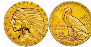
363 5 Dollars, Gold, 1912, Indian Head, Philadelphia, Fb. 150, ss. 300,—