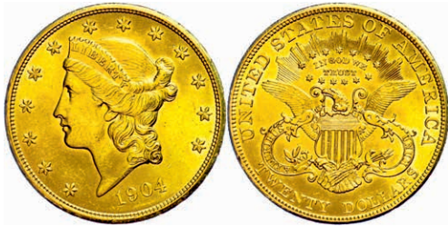
361 20 Dollars, Gold, 1904, Philadelphia, Fb. 177, kl. Kr., kl. Rf., vz-st. 1100,—

Goldmünzen ab 1800 sowie Goldbarren sind als Anlagegold ggf. umsatzsteuerfrei (auch für das Aufgeld), soweit der Zuschlagpreis inkl. Aufgeld und Losgebühr nicht höher als der Goldwert + 80% ist.