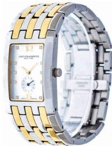
1071 Bicolor Damenarmbanduhr. ABELER & SÖHNE SEIT 1898. Modell: Elegance. Referenznummer: AS3138. Modellnr.: 70144. Mit Verlängerungselement. Uhrwerk nicht geprüft. 140,—