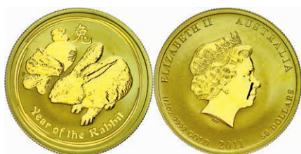
208 50 Dollars, Gold, 2011, Jahr des Hasen, 1/2 Oz, wz. roter Flecken und Druckstellen, in Kapsel, st. 550,—