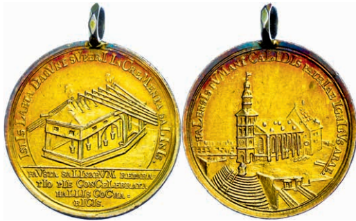
390 Schwäbisch-Hall, Stadt, tragbare, vergoldete Silbermedaille (Dm. ca. 36mm, ca. 15,60g), 1716, von Brunner, auf die Wiederherstellung des Salzwerkes. Av: Ansicht der Stadtkirche St. Michaelis. Rev: Ansicht des Schöpfwerks. Raff 123a, Randfehler, ss. 90,—