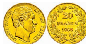
218 20 Francs, Gold, 1865, Leopold I., Fb. 411, kl. Rf., Kratzer, ss. 200,—