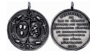
412 Düsseldorf, tragbare Silbermedaille (Dm. ca. 20mm, ca. 2,62g), 1869, auf das 25jährige Bestehen des Vereins Düsseldorfer Künstler zur gegenseitiger Unterstützung und Hilfe. Av: Doppelwappen. Rev: 10 Zeilen Schrift. Randfehler, ss-vz. Selten! 100,—