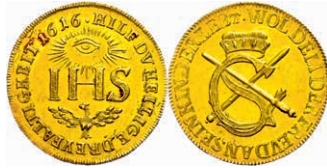
108 Sophiendukat, 1616 (Prägung des 19. Jh.), Fb. 2642, Kratzer im Feld, ss. 450,—