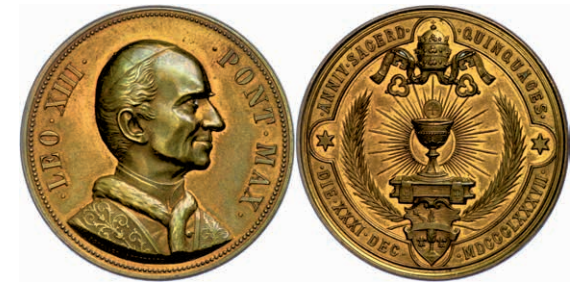
473 Kirchenstaat, Leo XIII., Bronzemedaille (Dm. ca. 38mm, ca. 25,17g), 1887, von Schiller, auf das 50jährige Amtsjubiläum. Av: Brustbild nach rechts, darum Umschrift. Rev: Tiara mit Schlüsseln, darunter strahlender Kelch mit Oblate, unten Wappen. Vz. 120,—