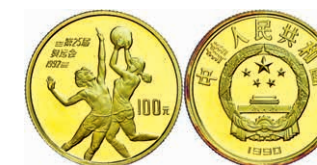
225 100 Yuan, Gold, 1990, Basketball, kl. Flecken, PP. 280,—