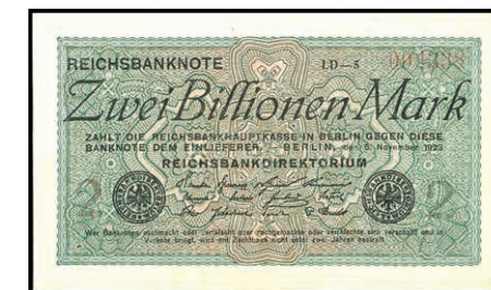
631 2 Bio. Mark, 05. Nov. 1923, Wz. Ringe, Firmendruck KN 6-stellig rot, FZ LD schwarz. Rosenberg 132b. Erhaltung I-. (Abbildung auf 50% verkleinert) 150,—