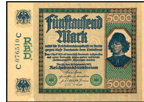
625 5.000 Mark, 16. September 1922, Wz. Dornen, KN 6-stellig blau, Serie C. Rosenberg 76, Erhaltung II. (Abbildung auf 50% verkleinert) 30,—