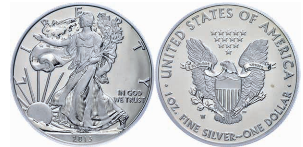
369 1 Dollar, 2013, W, Silver Eagle, in Slab der PCGS mit der Bewertung MS70, Enhanced Mint State, First Strike, West Point Mint Label. 130,—