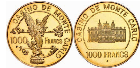
297 Chip zu 1000 Francs, Gold, 1979, Casino de Monte Carlo, 16g, 500er Gold, in Schatulle, PP (Fingerabdrücke). 350,—