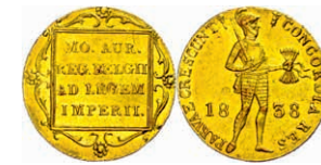
301 Dukat, 1838, Utrecht, Fb. 331, vz. 150,—

Alle Einzellose und Zertifikate/Gutachten sind unter www.rhenumis.de farbig abgebildet! Dort sind auch 417 weitere Lose zu finden, die nicht im gedruckten Katalog, sondern nur im Internet zu finden sind!