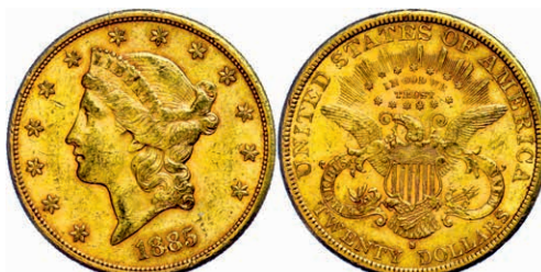
351 20 Dollars, Gold, 1885, San Francisco, Fb. 178, kl. Rf., ss. 1200,—