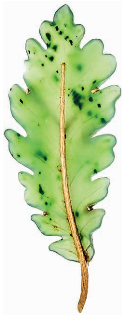
959 Hochwertige Brosche in Form eines Eichenblattes. Blatt wohl aus Nephrit, Fassung 750er GG, gestempelt. Sehr feine Ausführung. Eine Blattspitze unauffällig besch. 2. Hälfte 20. Jh. Länge ca. 8,1 cm. Breite ca. 3,0 cm. Ca. 13,05 gr. 320,—