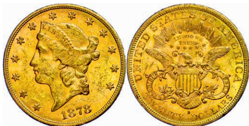
344 20 Dollars, Gold, 1878, San Francisco, Fb. 178, kl. Rf. und Kr., ss. 1200,—