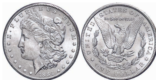
349 1 Dollar, 1884, Carson City, KM 110, vz-st. Laut beiliegendem Unterlegzettel mit MS63 bewertet. 100,—