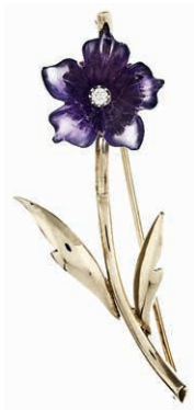
960 Dekorative Brosche in Form einer Blume, die Blütenblätter aus wohl Amethyst, nicht getestet, und der Butzen aus einem Brillanten, getestet, mit einem Durchmesser von ca. 2,0 mm mit ca. 0,03 ct. 20. Jh. 585er GG, gestempelt. Juwelierpunze, nicht aufgelöst. Blüte wohl ersetzt. L. ca. 4,8 cm. Ca. 4,74 gr. 170,—