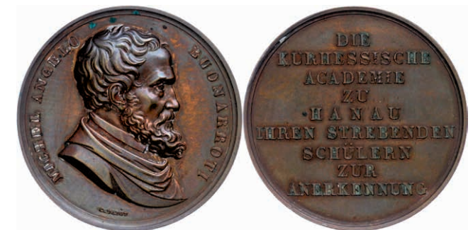
416 Hessen-Kassel, Bronzemedaille (Dm. ca. 49mm, ca. 56,73g), o.J., von Voigt, Prämienmedaille für die 1. Klasse der Zeichenakademie zu Hanau. Av: Brustbild Buonarrotis nach rechts, darum Umschrift. Rev: 9 Zeilen Schrift. Etwas Belag, f. vz. Selten. (Abbildung auf 89% verkleinert) 250,—