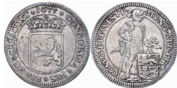
299 Westfriesland, Ducaton, 1677, Dav. 4910, ss-vz. 400,—