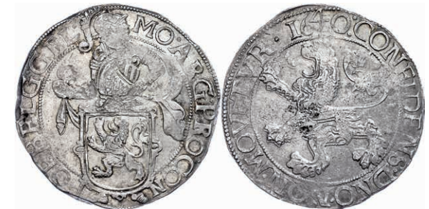
298 Gelderland, Löwentaler, 1640, Dav. 4849, Prägeschwäche, vz. 200,—