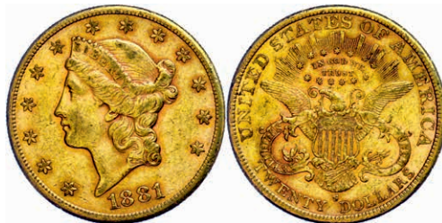
347 20 Dollars, Gold, 1881, San Francisco, Fb. 178, kl. Rf., Kratzer, ss. 1200,—