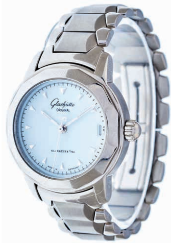
1070 Damenarmbanduhr Glashütte Original Lady Sport Automatik, Modellnr. 1724, ohne Originalbox und Papiere. 21. Jh. Länge ca. 15,5 cm, mit zusätzlichem Verlängerungselement. Min. Gebrauchsspuren. Ca. 77,75 gr. Uhrwerk nicht geprüft. 1400,—