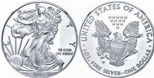
375 1 Dollar, 2015, W, Silver Eagle, in Slab der NGC mit der Bewertung PF70 Ultra Cameo, Chicago ANA, ANA Label. 150,—