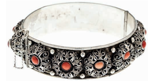
1017 Äußerst dekorativer und repräsentativer Armreif mit friesischem Filigrandekor und Besatz aus zwölf Korallencabochons mit schönem Steckschloß. Silber, getestet. Wohl ostfriesischer Raum. Wohl frühes 20. Jh. Gebrauchs- und Altersspuren, einige Buckel gedrückt. Dm. ca. 6,3 cm. Ca. 32,88 gr. 170,—