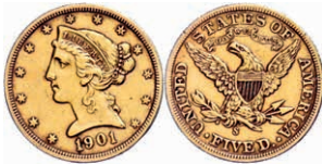
359 5 Dollars, Gold, 1901, Liberty Head, San Francisco, Fb. 145, Kratzer, kl. Rf., ss. 300,—