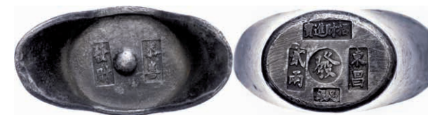
223 Sycee (139,92g), mit rechteckigen und einem runden Stempel, ss. (Abbildung auf 84% verkleinert) 200,—