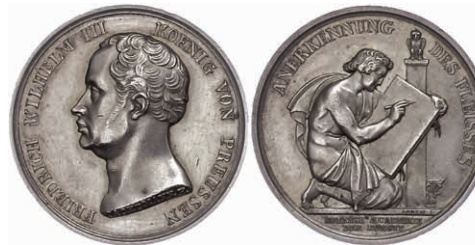
399 Preussen, Friedrich Wilhelm III., Silbermedaille (21,74g Durchmesser ca. 33,30 mm), o.J. (1830?), Prämie der Königlichen Akademie der Künste. Av: Büste nach links, darum "FRIEDRICH WILHELM III KOENIG VON PREUSSEN". Rev: Zeichnender Jüngling kniend vor Säule, darum "ANERKENNUNG DES FLEISSES", im Abschnitt 2 Zeilen Schrift. Vorderseite von F. Jachtmann, Rückseite von G. Goetze. Kleiner Randfehler, vz. 150,—