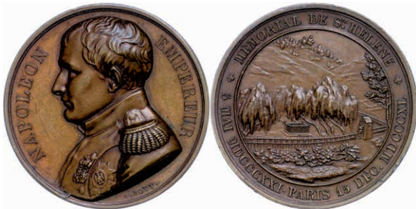
450 Frankreich, Napoleon I. Bonaparte, Bronzemedaille (Dm. ca. 41mm, ca. 31,40g), 1840, von Bovy, auf die Überführung seiner Leichnams in den Invalidendom in Paris. Av: Brustbild nach links, darum Umschrift. Rev: Grab Napoleons auf der Insel St. Helena, im Außenkranz Umschrift. Bramsen 1990, Julius 4009, kl. Rf., vz. 100,—