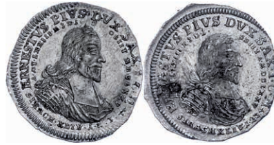
113 Zinnabschlag zweier 1/4 Taler-Aversstempel. Einer von 1729, Ernst I. (der Fromme), auf die Errichtung seines Denkmals in der Margarethenkirche zu Gotha. Vgl. Slg. Merseb. 3054. Schrötlingsfehler und kleine Druckstellen, vz. 200,—