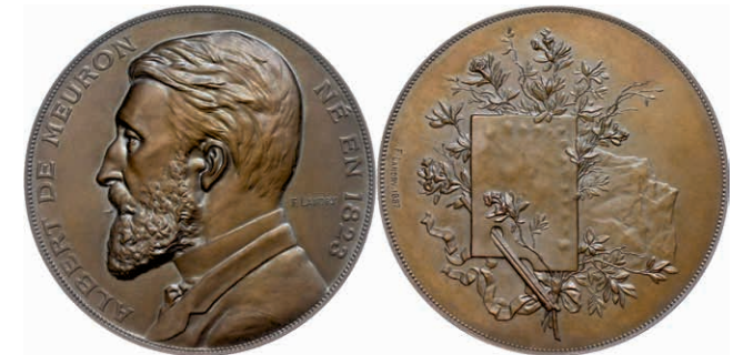
474 Schweiz, Bronzemedaille (Dm. ca. 69,00mm, ca. 187,02g), 1887, von F. Landry, auf den Maler Albert de Meuron. Av: Büste nach links, darum Umschrift. Rev: Farbmischpalette vor Zweigen und Berg. Rand punziert, st. (Abbildung auf 63% verkleinert) 150,—