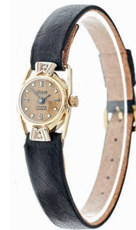
1069 Zierliche und äußerst dekorative Damenarmbanduhr des späten Art Deco mit zwei Altschliffdiamanten, nicht getestet, mit einem Durchmesser von ca. 1,5 mm von zusammen ca. 0,025 ct der Firma Condor. 585er GG, gestempelt. Dm. ca. 1,1/1,3 cm. Ca. 2,1 x 1,5 cm. Armband ersetzt, neuwertig. L. ca. 20,0 cm. Ca. 9,02 gr. Uhrwerk nicht geprüft. 250,—

Goldmünzen ab 1800 sowie Goldbarren sind als Anlagegold ggf. umsatzsteuerfrei (auch für das Aufgeld), soweit der Zuschlagpreis inkl. Aufgeld und Losgebühr nicht höher als der Goldwert + 80% ist.