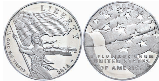
365 1 Dollar, 2012, P, Star Spangled Banner, in Slab der PCGS mit der Bewertung PR70DCAM, First Strike, Flag Label. 120,—