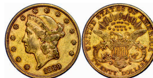
356 20 Dollars, Gold, 1889, San Francisco, Fb. 178, kl. Rf., Kratzer, ss. 1200,—