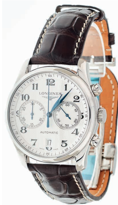
1085 Hochwertiger Herrenchronograph der Master Collection der Firma Longines mit silbernem Ziffernblatt mit Gerstenkornmuster und arabischen Ziffern, originalem dunkelbraunem Lederarmband und originaler Faltschließe in der Originalbox mit Garantiekarte, Kaufbeleg und Handbuch. Rückseitig ist die Schutzfolie noch aufgebracht. Diese Automatikuhr besitzt ein Edelstahlgehäuse sowie einen Saphirglasboden, der Durchmesser beträgt 40 mm. Modellnr.: L2.629.4, Gehäusenr.: 36597987. Kaufdatum: 15.06.2011. Kaufpreis: 1840,00 €. Listenpreis: 2560,00 €. Uhrwerk nicht geprüft. Während der Beschreibung lief die Uhr einwandfrei. 750,—

Goldmünzen ab 1800 sowie Goldbarren sind als Anlagegold ggf. umsatzsteuerfrei (auch für das Aufgeld), soweit der Zuschlagpreis inkl. Aufgeld und Losgebühr nicht höher als der Goldwert + 80% ist.