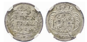
111 1/48 Taler, 1726, Friedrich August I., IGS, Merseburger 1627, Kahnt 201, Kohl 416, in Plastikholder der NGC mit der Bewertung "MS 64". 200,—