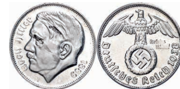
388 2 Reichsmark 1938, versilberte Æ-Medaille (ca.8,06g) in der Größe von 2 Reichsmark. Av: vgl. J. 366. Rev: Kopf Hitlers nach links. Vgl. KM X27. Rand bearbeitet, leicht angelaufen, PP. 50,—