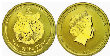
206 50 Dollars, Gold, 2010, Jahr des Tigers, 1/2 Oz, wz. roter Fleck, in Kapsel, st. 550,—