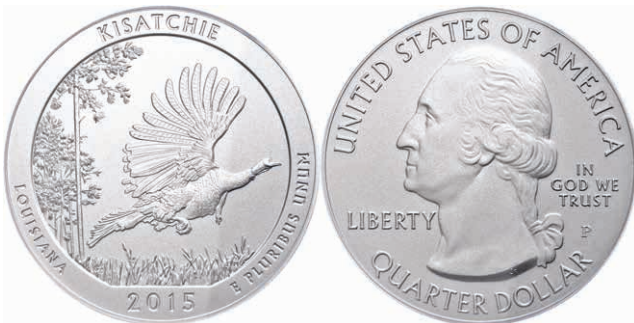
378 5 Unzen Silber, 2015, P, Kisatchie, in Slab der PCGS mit der Bewertung SP70, First Strike, Mercanti-Flag Label. (Abbildung auf 57% verkleinert) 250,—