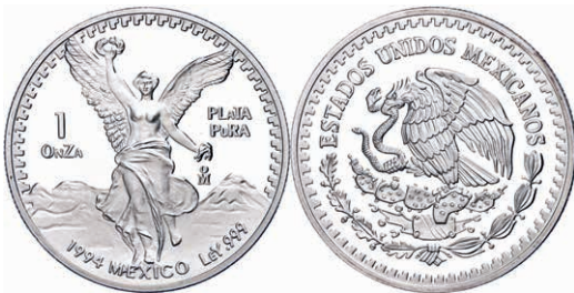
291 Set zu 1/20, 1/10, 1/4, 1/2 und 1 Onza, 1994, Libertad, in Kapseln, PP. 250,—