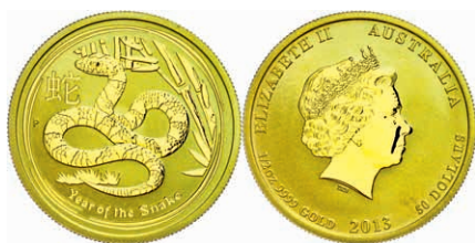
210 50 Dollars, Gold, 2013, Jahr der Schlange, 1/2 Oz, in Kapsel, st. 550,—