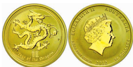
209 50 Dollars, Gold, 2012, Jahr des Drachen, 1/2 Oz, in Kapsel, st. 550,—