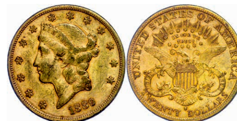
355 20 Dollars, Gold, 1889, San Francisco, Fb. 178, kl. Rf., Kratzer, ss. 1200,—