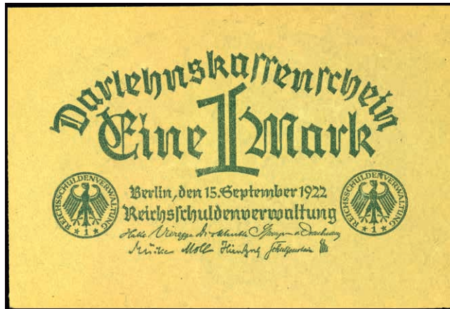
619 1 Mark, Darlehenskassenschein, 15. September 1922, Papier gelb, Druck grün, ohne KN und Serie, Rosenberg 73d. Erhaltung I. 100,—