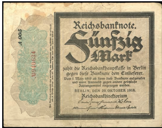
612 50 Mark, 20. Oktober 1918, Trauerschein, KN 6-stellig rot, Serie A, Wz. waagerechte Wellenlinien. Rosenberg 56a, Erhaltung III-IV. (Abbildung auf 50% verkleinert) 50,—