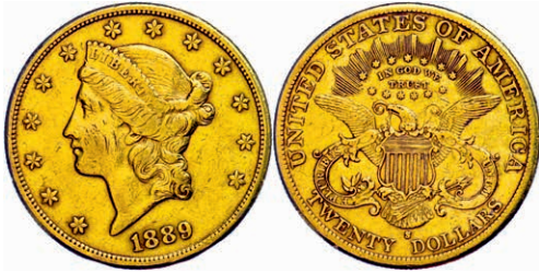
357 20 Dollars, Gold, 1889, San Francisco, Fb. 178, kl. Rf., Kratzer, ss. 1200,—