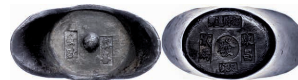
222 Sycee (136,99g), mit rechteckigen und einem runden Stempel, ss. (Abbildung auf 84% verkleinert) 200,—