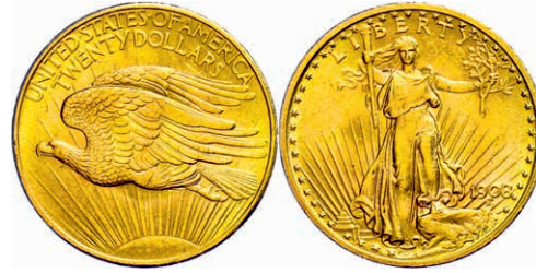
362 20 Dollars, Gold, 1908, Philadelphia, Fb. 183, kl. Kr., kl. Rf., vz. 1100,—