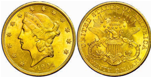
360 20 Dollars, Gold, 1904, Philadelphia, Fb. 177, Kratzer, vz-st. 1200,—