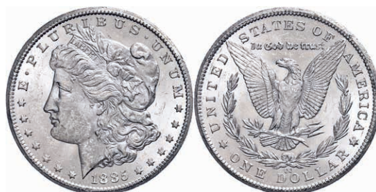
350 1 Dollar, 1885, Carson City, KM 110, kl. Rf., vz-st. Laut beiliegendem Unterlegzettel mit MS63 bewertet. 240,—