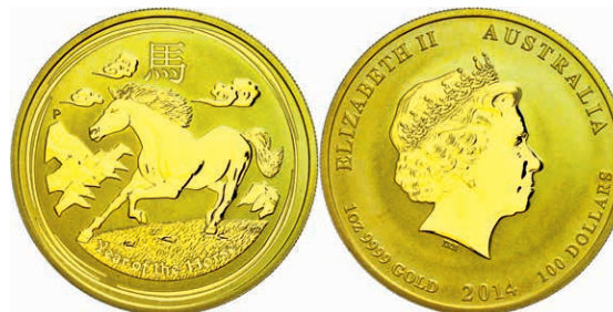
212 100 Dollars, Gold, 2014, Jahr der Pferdes, 1 Oz, st. 1100,—