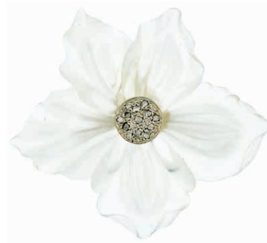
961 Dekorative Brosche in Form einer Blüte aus Bergkristall, das Innere der Blüte mit einem Besatz aus 13 Diamantsplittern, getestet. Wohl WG, ungestempelt. 20. Jh. Rückseitig unsachgemäß geklebt. Durchmesser ca. 5,0 cm. Ca. 11,25 gr. 160,—