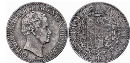
127 Taler, 1830, Friedrich Wilhelm III., AKS 17, J. 62, kl. Rf., vz. 50,—