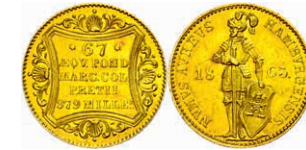
125 Dukat, 1863, AKS 10, J. 93a, leichte Knickspur, kl. Kratzer, vz. 400,—