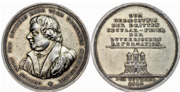
396 Hamburg, vergoldete Silbermedaille (Dm. ca. 41mm, ca. 25,28g), 1817, auf die 300jahrfeier der Reformation. Av: Brustbild Martin Luthers nach links, darum Umschrift. Rev: 7 Zeilen Schrift über Wappen, im Abschnitt darunter 2