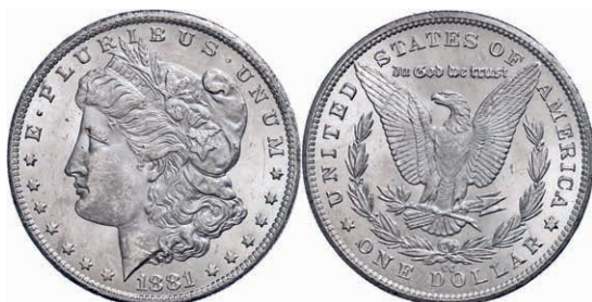
346 1 Dollar, 1881, Carson City, KM 110, kl. Rf. und Kratzer, vz-st. Laut beiliegendem Unterlegzettel mit MS63 bewertet. 280,—