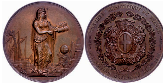
454 Frankreich, Marseille, Kupfermedaille (Dm. ca. 50,2mm, ca. 65,89g), 1846, von Roux, auf die 14. Sitzung des französischen Wissenschaftskongress in Marseille. Av: Stehende weibliche Gestalt mit Feder und aufgeschlagenem Buch nach rechts, daneben wissenschaftliche Geräte und ein Dampfschiff. Rev: Stadtwappen in Kartusche mit Mauerkrone im Eichenlaubkranz, darum Umschrift. Rand punziert "CUIVRE", kl. Rf., vz. (Abbildung auf 87% verkleinert) 50,—