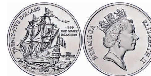
221 25 Dollars, Palladium, 1987, Sea Venture, KM 53, 1 Oz fein, PP. 1400,—