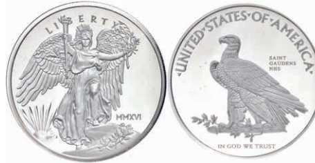
380 1 Unze Silber, 2016, National Park Foundation, in Slab der NGC mit der Bewertung PF70 Ultra Cameo, Saint Gaudens Label. Mit Zertifikat in Ausgabeschatulle. 150,—