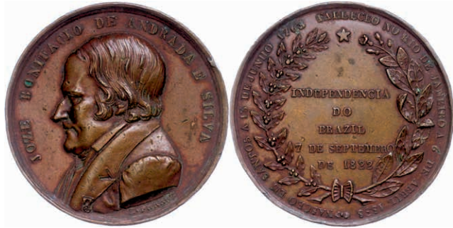
447 Brasilien, Pedro I., Bronzemedaille (Dm. ca. 46mm, ca. 44,76g), 1822, auf die Unabhängigkeit von Portugal am 07. Sep. 1822. Av: Brustbild Andradas nach links, darum Umschrift. Rev: 5 Zeilen Schrift, darum Umschrift und Kranz. Randfehler, ss. (Abbildung auf 95% verkleinert) 150,—