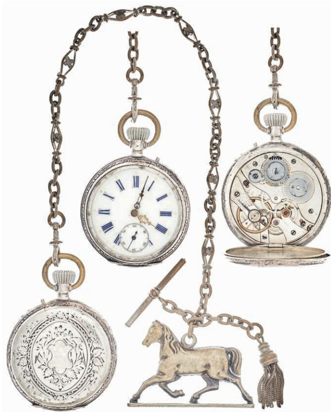
1052 Äußerst dekorative zierliche Herrentaschenuhr mit separater Sekunde und floralem Dekor, rückseitig mit Wappenkartusche. Römische Ziffern in Blau, Sekunde in schwarz, Minutenzeichen in zwei verschiedenen Goldfarben in Punktform bzw. im Fünfertakt als dunklere abstrahierte Sterne. Minuten- und Stundenzeiger in unterschiedlicher Farbigkeit und Dekor, Minutenzeiger eventuell hist. ersetzt. Ziffernblatt mit Krakelee. Wohl 1. Viertel 20. Jh. 800er Silber, gestempelt. Reichssilberstempel, Silberstempel Schweiz. Staubdeckel aus Messing. Rück- und Staubdeckel bez. "EXTRA". Modellnr. 12865 67 (Rück- und Staubdeckel bez.). Die Uhr wurde 2020 komplett überarbeitet, hierbei wurde das Werk gereinigt, überholt und repariert sowie Band und Gehäuse poliert und gereinigt. Dm. ca. 3,5/4,0 cm. Uhrwerk nicht geprüft. Mit dekorativer Uhrenkette mit Anhängern in Form eines Pferdes und einer Quaste. L. ca. 29,0 cm. Zusammen ca. 85,23 gr. (Abbildung auf 68% verkleinert) 160,—