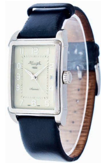
1057 Herrenarmbanduhr, Kienzle 1822 Automatic. Modellnr. V83091142360. Ca. 3,8 x 3,0 cm. Ca. 71,15 gr. Uhrwerk nicht geprüft. 120,—