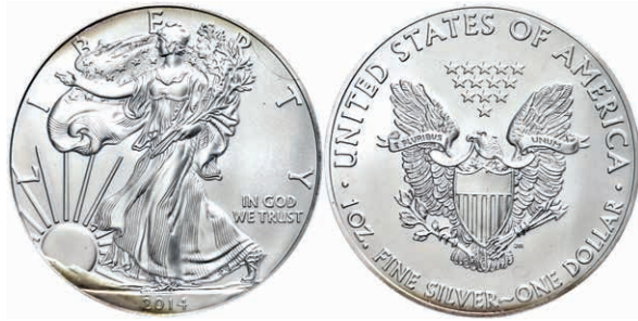
374 1 Dollar, 2014, Silver Eagle, in Slab der PCGS mit der Bewertung MS70, First Strike, Government Box #7, Mercanti Label, etwas angelaufen. 200,—