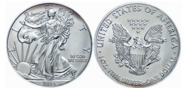
373 1 Dollar, 2014, Silver Eagle, in Slab der PCGS mit der Bewertung MS70, First Strike, Government Box #5, Mercanti Label, etwas angelaufen. 200,—

Bitte geben Sie realistische Gebote ab! Gebote deutlich unter Metallwert sind praktisch chancenlos und für alle Seiten Zeitverschwendung!