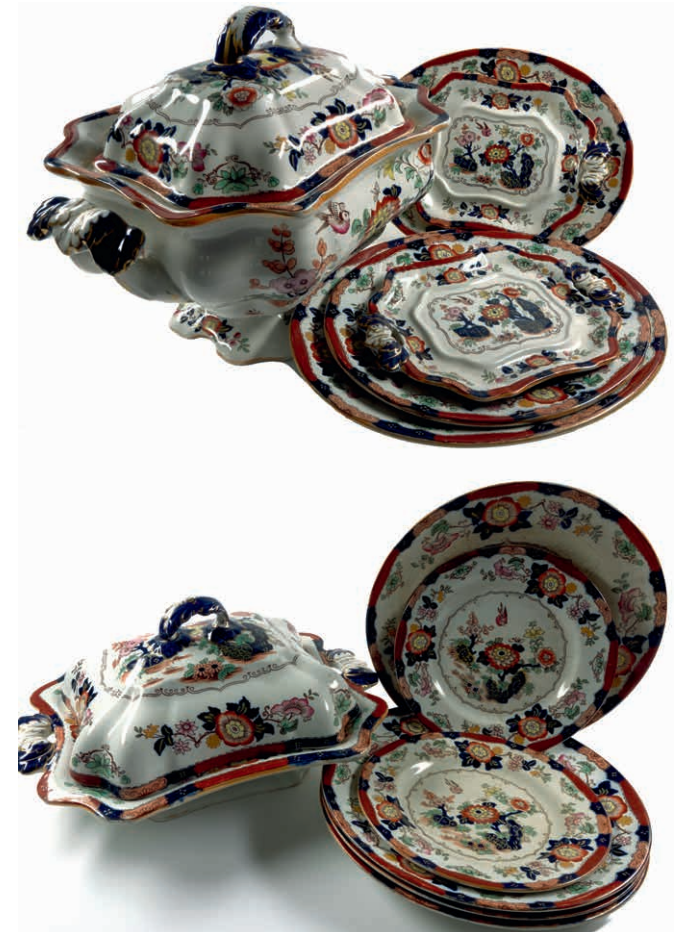
1097 Konvolut Imari-Pottery der Firma Ashworth Brothers, Hanley. Wohl 1862-ca. 1891. Bestehend aus: Einer Terrine, ca. 33,5 x 22,0 x 23,0 cm, einer Terrine, ca. 30,5 x 23,5 x 15,5 cm, einer Ovalplatte, ca. 29,5 x 23,5 cm, zwei Ovalplatten, ca. 25,5 x 21,0 cm, zwei Untersetzern, ca. 21,0 x 15,0 cm, vier Speisetellern, Dm. ca. 23,5 cm, und zwei Vorspeisetellern, Dm. ca. 17,5 cm. Gebrauchs- und Altersspuren, teilweise best., unterschiedlich stark ausgeprägtes Krakelee. (Abbildung auf 56% verkleinert) 160,—