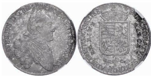
112 2/3 Taler, 1768, Xaver, EDC, hübsche Patina, im Plastiklab der NGC mit der Bewertung XF 45. 400,—