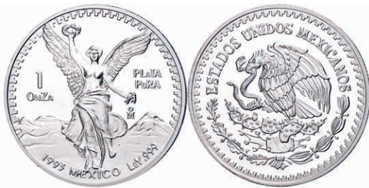
290 1993, Kompletter Satz Libertad. 1/20, 1/10, 1/4, 1/2 und 1 Onza. In Kapseln, PP. 250,—