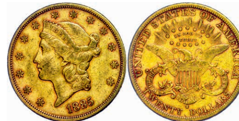
352 20 Dollars, Gold, 1885, San Francisco, Fb. 178, kl. Rf., ss. 1200,—