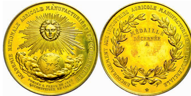
458 Frankreich, Paris, vergoldete Bronzemedaille (Dm. ca. 51,1mm, ca. 57,55g), o.J., unsigniert, Prämienmedaille der nationalen Landwirtschafts-, Produktions- und Handelsakademie. Av: Strahlender Medusenkopf über Globus in den Wolken, darum Umschrift. Rev: Lorbeerkranz mit 3 Zeilen Schrift im Inneren, darum Umschrift. Im Ausgabeetui, kl. Rf., kl. Kr., vz-st. (Abbildung auf 86% verkleinert) 50,—