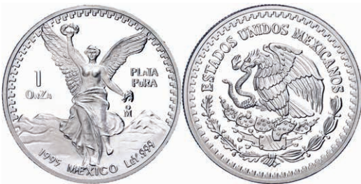
292 Set zu 1/20, 1/10, 1/4, 1/2 und 1 Onza, 1995, Libertad, in Kapseln, PP. 600,—