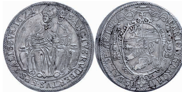
115 Taler, 1622, Paris Graf von Lodron, Zöttl 1464, Dav. 3497, kl. beriebene Stelle auf dem Avers, ss. 100,—