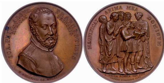
451 Italien, Bronzemedaille (Dm. ca. 39mm, ca. 38g), 1842, von Krüger, auf Giovanni Pierluigi da Palestrina. Av: Brustbild schräg rechts, darum Umschrift.