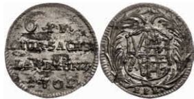
110 6 Pfennig, 1702, Friedrich August I., Kohl 418, Kahnt 196, Schrötlingsfehler, Riss, vz-st. 290,—