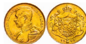
219 20 Francs, Gold, 1914, Albert, Fb. 421, kl. Rf., vz. 200,—