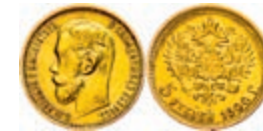
287 5 Rubel, Gold, 1900, Nikolaus II., Fb. 180, kl. Rf., ss. 150,—