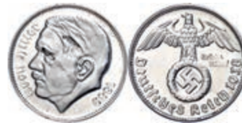
331 2 Reichsmark 1938, versilberte Æ-Medaille (ca.8,06g) in der Größe von 2 Reichsmark. Av: vgl. J. 366. Rev: Kopf Hitlers nach links. Vgl. KM X27. Rand bearbeitet, leicht angelaufen, PP. 50,—