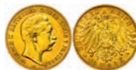
96 10 Mark, 1893, Wilhelm II., ss. J. 251 120,—