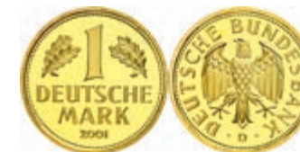
157 1 DM, 2001, D, Abschiedsmark, in Kapsel, st, J. 481. 500,—