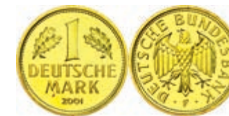
158 1 DM, 2001, F, Abschiedsmark, in Kapsel (beschädigt), kl. rote Flecken, st, J. 481. 500,—