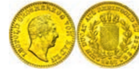
61 Dukat (Rheingolddukat), 1846, Carl-Leopold Friedrich 1830-1852, in der Jahreszahl "1" rückgewandt, keine Signatur "D" im Halsabschnitt, 3,68g, feine Kratzer im Aversfeld, f. vz, AKS 74, J. 52b., Fr. 153. Auflage 1950 Stück. 2000,—