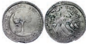
219 2 Reales, 1831, TF, KM 9.3, div. Kratzer, Schröttingsfehler am Rand, ss. 50,—