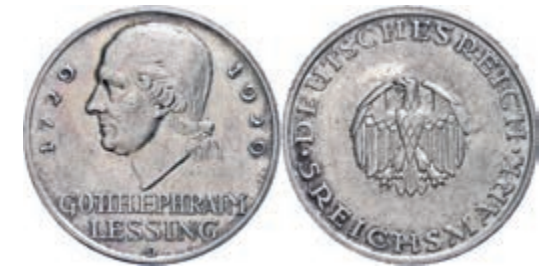
133 5 Reichsmark, 1929, Gotthold Ephraim Lessing, Mzz D, kleine Randfehler, berieben, ss. J. 336 50,—