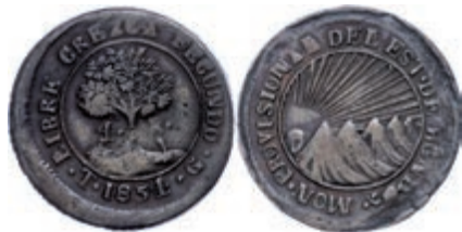
220 4 Reales, Kupfer, 1854, KM 20a, ss. 70,—