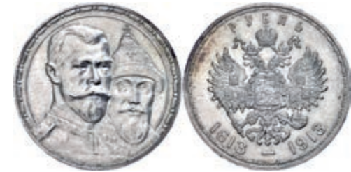
289 Rubel, 1913, Nikolaus II., St. Petersburg, 300 Jahre Romanov Dynastie, Bitkin 336, kl. Rf., vz. 80,—