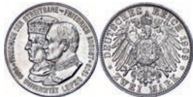
79 2 Mark, 1909, Friedrich August III., Universität Leipzig, wz. Kratzer, f. st. J. 138 60,—

Goldmünzen ab 1800 sowie Goldbarren sind als Anlagegold ggf. umsatzsteuerfrei (auch für das Aufgeld), soweit der Zuschlagpreis inkl. Aufgeld und Losgebühr nicht höher als der Goldwert + 80% ist.