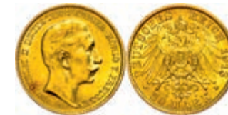
104 20 Mark, 1913, Wilhelm II., minimale Randfehler, ss-vz. J. 252 250,—