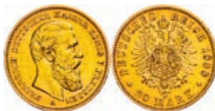
92 20 Mark, 1888, Friedrich III., kl. Kr., kl. Rf., ss-vz. J. 248. 250,—