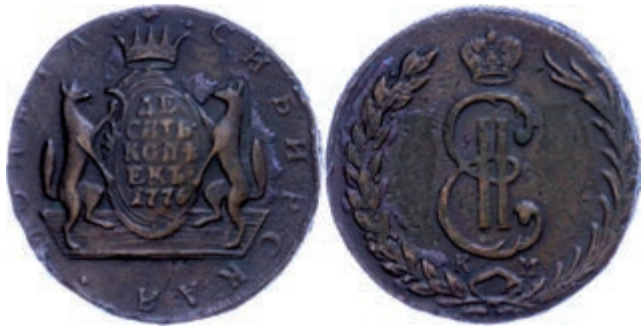
277 10 Kopeken (62,36g), 1776, Katharina II., Suzun, Bitkin 1035, Schröttingsfehler, ss. (Abbildung auf 95% verkleinert) 50,—