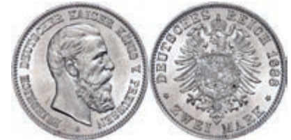
74 2 Mark, 1888, Friedrich III., vz-st. J. 98 50,—