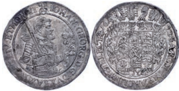
55 Taler, 1622, Johann Georg I., Schnee 818, Dav. 7591, etwas Belag, Präge- schwäche, leichter Prägeglanz, ss-vz. 180,—