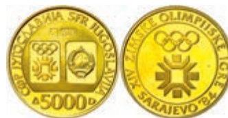
226 5000 Dinar 1982, 900er Gold, 8g, Rev.: Emblem der Olympiade Sarajevo 1984, mit Zertifikat und Etui, Exemplare 55.000, vz aus PP, KM 95. 330,—