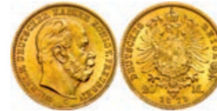
86 20 Mark, 1873, Wilhelm I., Mzz C, kleine Randfehler, vz. J. 243 250,—