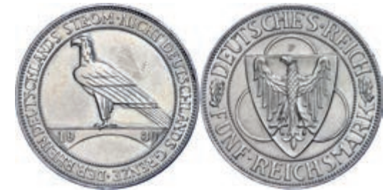
143 5 Reichsmark, 1930, Rheinlandräumung, Mzz F, Felder bearbeitet, kleine Randfehler, ss-vz. J. 346 50,—