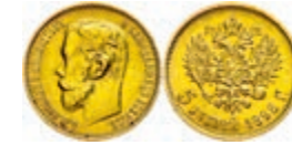
284 5 Rubel, Gold, 1898, Nikolaus II., Fb. 180, ss-vz. 150,—