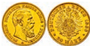
93 20 Mark, 1888, Friedrich III., kl. Rf., ss. J. 248 250,—