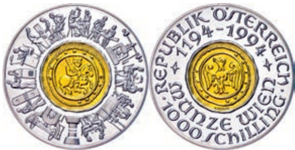
265 1000 Schilling, Bimetall Gold/Silber, 1994, 800 Jahre Münze Wien, Zentrum aus 13g Feingold, mit Zertifikat in Ausgabeschatulle, PP. 450,—