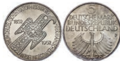
151 5 Mark, 1952, Germanisches Museum, kl. Rf. und Kr., f. st. J. 388 250,—