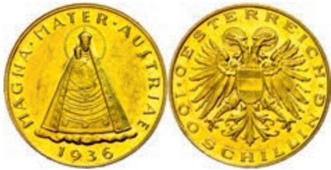
263 100 Schilling, Gold, 1936, Madonna von Mariazell, Fb. 522, Herinek 14, kleine Kratzer, vz. 1500,—