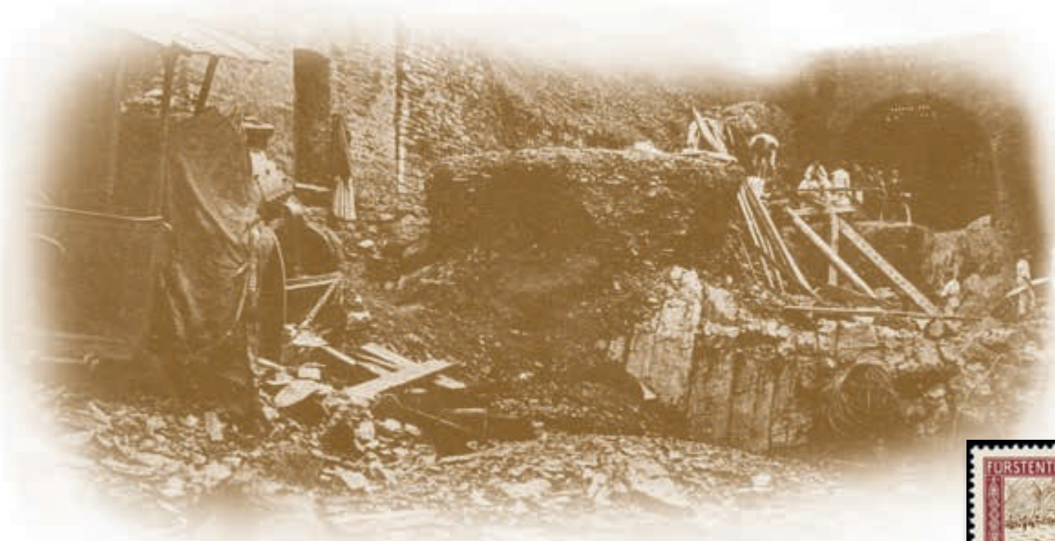
Abbildung oben: Wetterkatastrophe im Ahrtal 13. Juni 1910 - Altenahr Verwüstete Chaussee mit der in Abgrund gestürzten Dampfwalze

Alle Erlöse einschließlich Aufgeld und Losgebühr kommen den Flutopfern zu Gute.