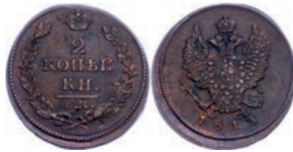
280 2 Kopeken, 1813, Alexander I., Ekaterinburg, Bitkin 353, Kratzer, ss-vz. 30,—