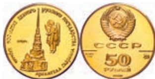
293 50 Rubel, Gold, 1990, Kirche des Erzengels Gabriel in Moskau, Parchimowicz 260, Fb. 204, in Kapsel, PP. 300,—