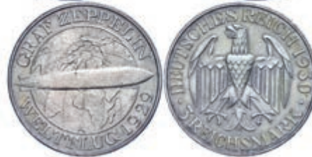
139 3 und 5 Reichsmark, 1930, A, Zeppelin, je kl. Rf., kl. Kr., vz. J. 342/343 100,—