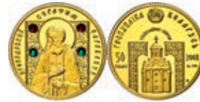
330 50 Rubel, Gold, 2008, in Kapsel, PP. 350,—