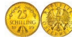
260 25 Schilling, Gold, 1929, Fb. 521, vz-st. 200,—