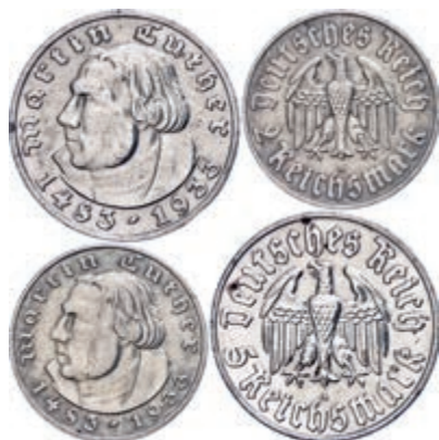
147 2 und 5 Reichsmark, 1933, Mzz A, Martin Luther, ss-vz, J. 352, 353. 100,—