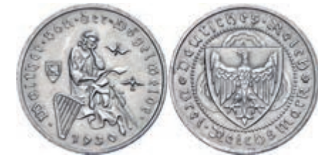
141 3 Reichsmark, 1930, Walther von der Vogelweide, Mzz A, kleine Randfehler, vz. J. 344 30,—