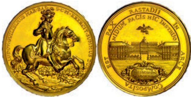
561 Baden, Goldmedaille (Dm. ca. 50,4mm, ca. 71,02g, 900er Gold), 1955, unsigniert, auf den 300. Geburtstag des Markgrafen Ludwig Wilhelm und den Frieden von Rastatt. Av: Der Markgraf zu Pferd nach rechts, darum Umschrift. Rev: Das Rastatter Schloss darüber Adler. Mit Randschrift, winzige Kratzer, f.st. (Abbildung auf 87% verkleinert) 3800,—