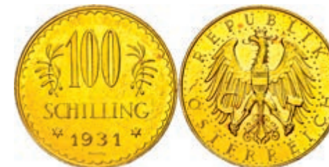
261 100 Schilling, Gold, 1931, Fb. 520, Kratzer, vz. 800,—