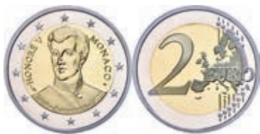
251 2 Euro, 2019, 200. Jahrestag der Thronbesteigung von Fürst Honoré V., in Kapsel, in Originalschatulle mit Zertifikat und Umverpackung, PP. 300,—