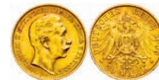
103 20 Mark, 1909 A, Wilhelm II., kl. Rf., vz. J. 252. 300,—