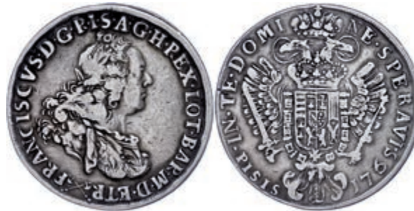
224 Toskana, Francescone (10 Paoli), 1765, Franz II., Dav. 1505, kl. Kratzer auf dem Avers, ss 160,—