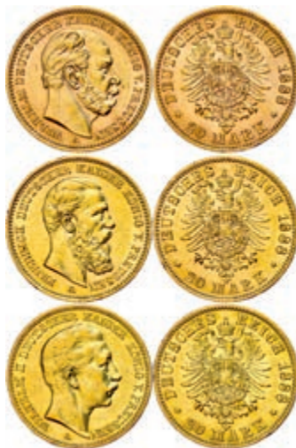
90 3x 20 Mark, 1888, Wilhelm I. bis Wilhelm II., in Holzschatulle, jeweils um ss bis vz. J. 246/248/250 800,—