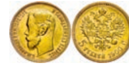
285 5 Rubel, Gold, 1900, Nikolaus II., Fb. 180, berieben, ss. 150,—