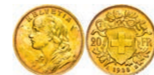
301 20 Franken, Gold, 1935, Vreneli, Fb. 499, kl. Rf., vz 180,—