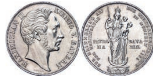
63 Doppelgulden, 1855, Maximilian II., Mariensäule München, AKS 168, J. 84, wz. Rf., vz. 50,—

Goldmünzen ab 1800 sowie Goldbarren sind als Anlagegold ggf. umsatzsteuerfrei (auch für das Aufgeld), soweit der Zuschlagpreis inkl. Aufgeld und Losgebühr nicht höher als der Goldwert + 80% ist.