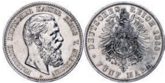
76 5 Mark, 1888, Friedrich III., kl. Kr., wz. Rf., f. vz. J. 99 80,—