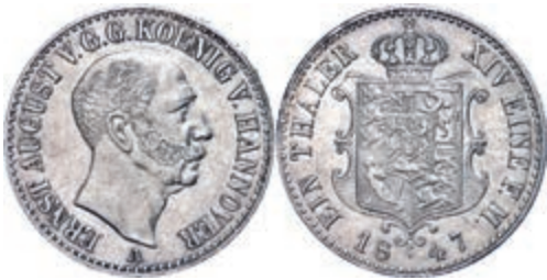
66 Taler, 1847, Ernst August, AKS 105, kleiner Randfehler, ss-vz. 70,—