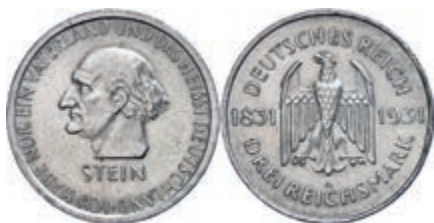
145 3 Reichsmark, 1931, Reichsfreiherr vom und zum Stein, kleine Randfehler, vz. J. 348 40,—