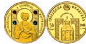
329 50 Rubel, Gold, 2008, PP. 350,—