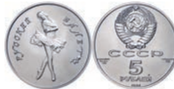
296 5 Rubel, Palladium, 1991, Ballerina, 1/4 oz, Fb. B10, in Kapsel, st. 450,—