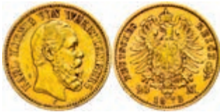
109 20 Mark, 1872, Karl, kleine Randfehler, kleiner Schrötlingsfehler, ss. J. 290 250,—