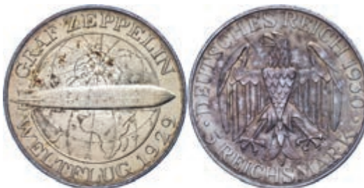
139 3 und 5 Reichsmark, 1930, A, Zeppelin, je kl. Rf., kl. Kr., vz. J. 342/343 100,—