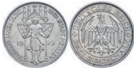
135 3 Reichsmark, 1929, Meißen 1000 Jahre Burg und Stadt, kleine Randfehler, ss-vz. J. 338 Gebot