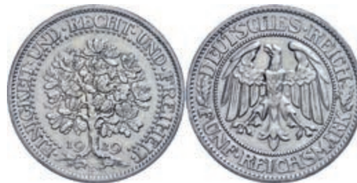
128 5 Reichsmark, 1929, Eichbaum, Mzz F, Randfehler, ss. J. 331 100,—