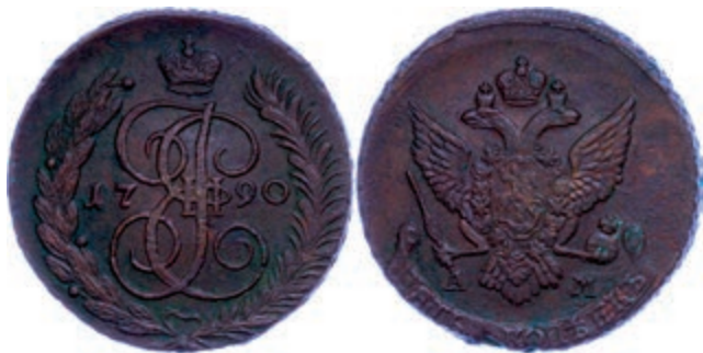
279 5 Kopeken, 1790, Katharina II., Anninskoye, Bitkin 860, Schröttingsfehler, vz. (Abbildung auf 96% verkleinert) 50,—