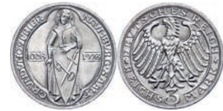
130 3 Reichsmark, 1928, Naumburg/Saale 900 Jahre Stadtrecht, vz. J. 333 60,—