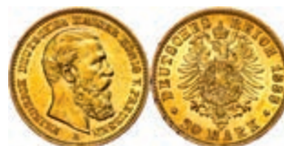
94 20 Mark, 1888, Friedrich III., kleine Randfehler, kleine Kratzer, ss-vz. J. 248 250,—