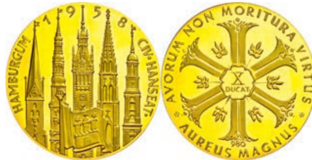
565 Goldmedaille zu 10 Dukaten (Dm. ca. 50,1mm, ca. 35,00g), unsigniert, 1958, auf die Hansestadt Hamburg. Punziert "980", kl. Kr., vz-st. (Abbildung auf 88% verkleinert) 1300,—