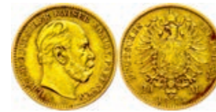
85 20 Mark, 1873, A, Wilhelm I., kl. Rf., ss. J. 243. 250,—