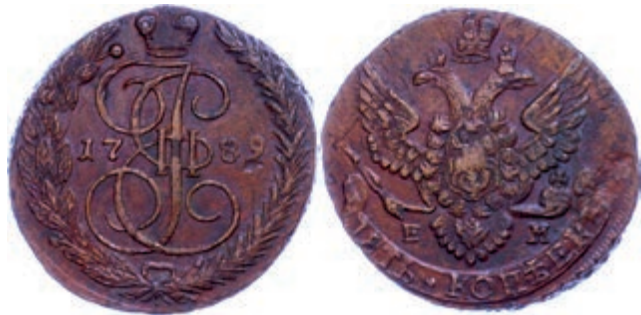
278 5 Kopeken, 1789, Katharina II., Ekaterinburg, Bitkin 643, ss-vz. 30,—