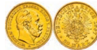
89 20 Mark, 1887, A, Wilhelm I., kl. Rf., ss-vz, J. 246. 300,—