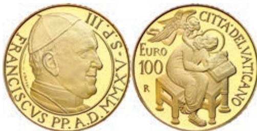
328 100 Euro, Gold, 2015, Franziskus, Die Evangelisten: Matthäus, 30g 917er Gold, mit Zertifikat in Ausgabeschatulle und Umverpackung, PP. Auflage 999 Stück. 1800,—