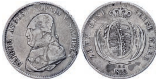
70 Taler, 1822, Friedrich August I., AKS 24, J. 33, Avers min. justiert, Rf., Fassungsspur. 50,—