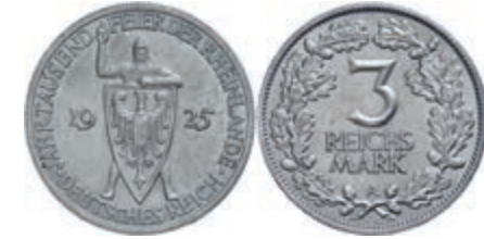
117 3 Reichsmark, 1925, 1000 Jahre Rheinlande, Mzz A, kleine Kratzer, winzige Randfehler, vz. J. 321 20,—