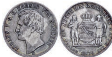
71 Taler, 1870, Johann, AKS 135, kl. Rf., ss. 60,—