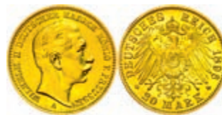
98 20 Mark, 1896, A, Wilhelm II., f. st. J. 252. 375,—