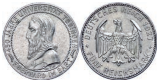
125 5 Reichsmark, 1927, 450-Jahrfeier der Gründung der Universität Tübingen, kleine Randfehler, f. vz. J. 329 180,—