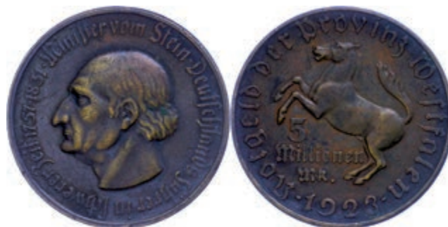
150 Provinz Westfalen, 5 Mill. Mark 1923, vom Stein, Wert Dreizeilig mit Mk, selten, kl. Rf., sehr schön - vorzüglich, J. N21, Funck 645.10C. 120,—