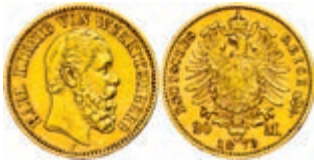
111 20 Mark, 1873, Karl, kleiner Randfehler, gutes ss. J. 290 250,—