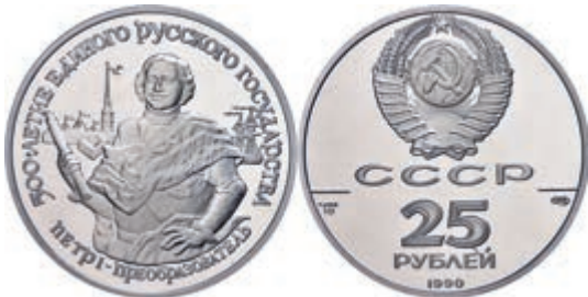
292 25 Rubel, Palladium, 1990, Zar Peter I., 1 oz, Parchimowicz 251, in Kapsel, PP. 1800,—