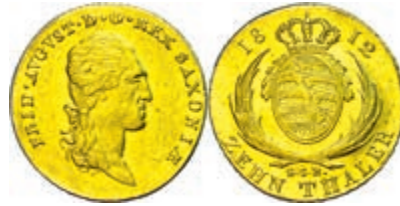
69 10 Taler, Gold, 1812, Friedrich August I., SGH, AKS 1, kl. Kratzer, Rand stellenweise bearbeitet, ss. 600,—