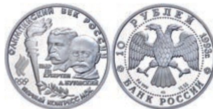
297 10 Rubel 1993, Palladium, "Väter der Olympischen Idee", 15,5g, Auflage 7500 Ex., mit Zertifikat in Ausgabeetui, KM 352, Parch. 1351, selten, PP. 950,—