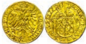
57 Dukat, 1577, Johann Jakob Khuen von Belasi-Lichtenberg, Fb. 637, wellig, ss. 1100,—