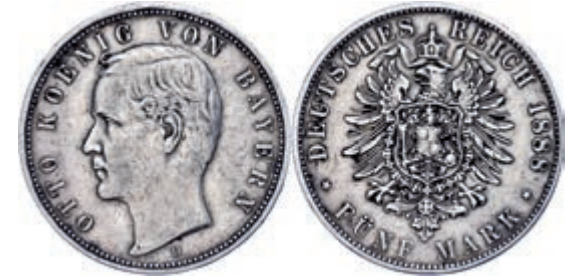
72 5 Mark, 1888, Otto, kl. Rf., berieben, ss. J. 44 200,—