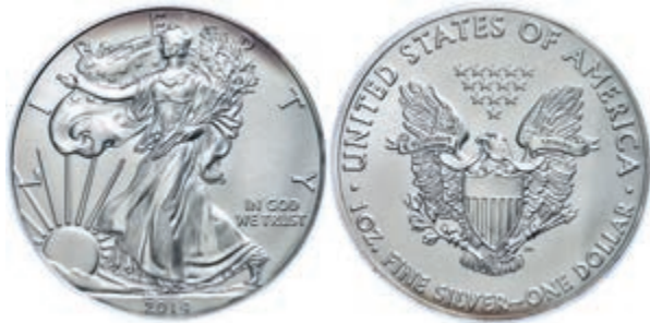
320 1 Dollar, 2014, Silver Eagle, in Slab der PCGS mit der Bewertung MS70, First Strike, Government Box #5, Mercanti Label, etwas angelaufen. 150,—