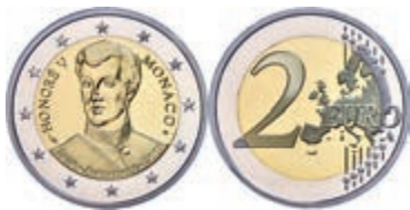
253 2 Euro, 2019, 200. Jahrestag der Thronbesteigung von Fürst Honoré V., in Kapsel, in Originalschatulle mit Zertifikat und Umverpackung, PP. 300,—

Alle Einzellose und Zertifikate/Gutachten sind unter www.rhenumis.de farbig abgebildet!