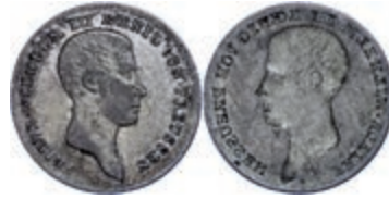
68 1/6 Taler, o.J. (1809-1818), Friedrich Wilhelm III., inkuse Vorderseitenprägung. AKS 24, J. 31, ss. Sehr selten! 180,—