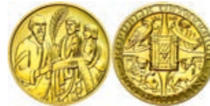
268 500 Schilling, Gold, 2001, Die Bibel, Fb. 935, 10g fein, mit Zertifikat in Ausgabeschatulle, st. 350,—