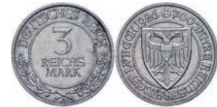
119 3 Reichsmark, 1926, Lübeck 700 Jahre Reichsfreiheit, ss-vz. J. 323 30,—