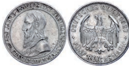
126 5 Reichsmark, 1927, Universität Tübingen, kl. Rf., vz. J. 329 200,—