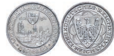
144 3 Reichsmark, 1931, Magdeburg, kleine Randfehler, vz. J. 347 100,—