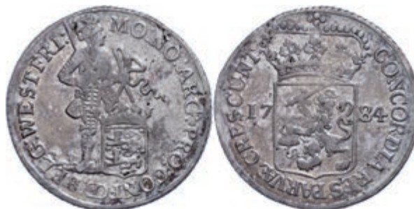
256 Westfriesland, Silberdukat, 1784, Delm. 971, kl. Schrötlingsfehler, ss. 70,—