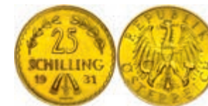
262 25 Schilling, Gold, 1931, Fb. 521, kleine Kratzer und Randfehler, vz. 200,—