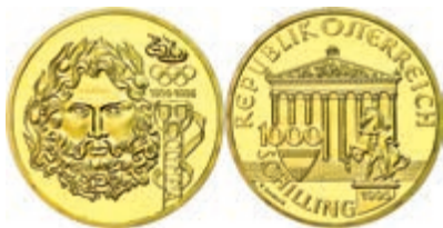
266 1000 Schilling, Gold, 1995, Zeus 100 Jahre Olympia, 16,97 g, 986er Gold, Fb. 922, in Kapsel, in Schatulle mit Zertifikat, PP. 600,—