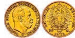
87 20 Mark, 1873, Wilhelm I., Mzz C, ss. J. 243 250,—