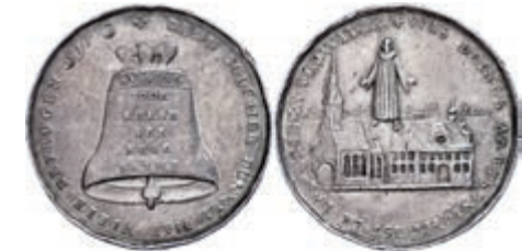
335 Hamburg, Silbermedaille (Dm. ca. 32mm, ca. 43g), o.J. (um 1708), un-sign., auf die von Pastor Christian Crumholz verursachten Unruhen. Av: Geistlicher über Kirche, darum Umschrift. Rev: Glocke mit Namen der Anführer, darum Umschrift. Gaedechens 1711, Randfehler, ss. 500,—

heit. Av: Männliche Gestalt pflanzt einen Baum. Rev: 2 trinkende Kartenspieler sich gegenüber sitzend. Felder bearbeitet, vz. 30,—