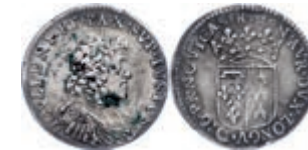
299 Neuenburg-Fürstentum, 10 Kreuzer, Silber, o.J (1648), Heinrich II 1595-1663, Nachahmung 1/12 Ecu von Ludvig XIII von Frankreich. Av.: Büste n. r. und Umschrift. Rev.: Wappen. HMZ 2-685, Kratzer im Aversfeld, Prüfhieb am Rand, wellig, selten, ss. 50,—