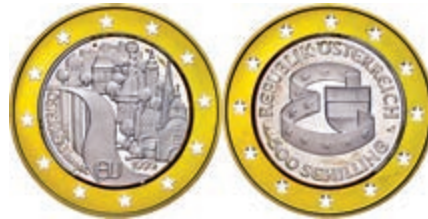
267 500 Schilling, Bimetall Gold/Silber, 1995, Österreich als Mitglied der EU, 986er Gold, 8,1 g, 900er Silber, 5,22 g, KM 3023, Schön 223, PP. 250,—