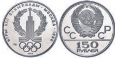
290 150 Rubel, Platin, 1977, Olympia-Emblem, Fb. 182, KM 152, berührte PP. 350,—