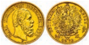
110 20 Mark, 1872, Karl, kleine Randfehler, ss. J. 290 250,—