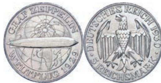
140 3 Reichsmark, 1930, Zeppelin, Mzz A, ss. J. 342 50,—