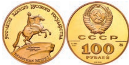
291 100 Rubel, Gold, 1990, Reiterdenkmal Peter I., Parchimowicz 272, Fb. 203, in Kapsel, mit Zertifikat, PP. 600,—