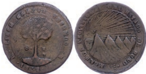
221 8 Reales, Kupfer, 1858, Variante mit "HOND", KM 21a, kl. Schröttingsriss und Schröttingsfehler, s-ss. 120,—