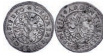
60 1/2 Gros, o.J. (17. Jh.), ss-vz. 45,—