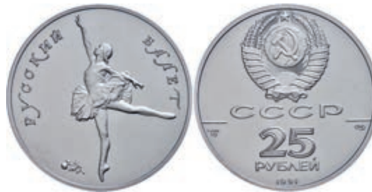
295 25 Rubel, Palladium, 1991, Ballerina, 1 oz, Fb. B8, in Kapsel, st. 1800,—