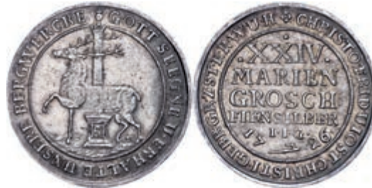
59 24 Mariengroschen, 1726, Christoph Friedrich, IIG, Dav. 1000, hübsche Pa- tina, ss+-. 100,—