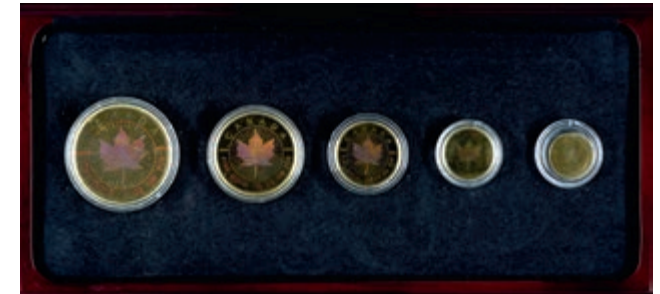
227 Set zu 50, 20, 10, 5, und 1 Dollar, Gold, 2001, Maple Leaf, 1, 1/2, 1/4, 1/10 und 1/20 oz, Hologramm-Motiv, mit Zertifikat in Ausgabeschatulle, st. Auflage nur 600 Stück! (Abbildung auf 46% verkleinert) 2700,—