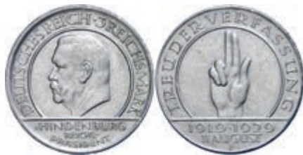
137 3 Reichsmark, 1929, Schwurhand, Mzz J, kleine Randfehler, ss-vz. J. 340 Gebot