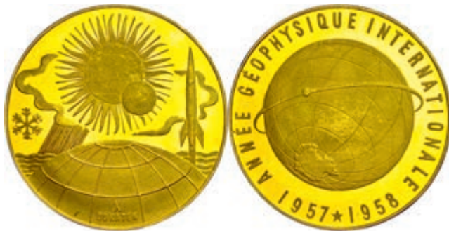
563 Goldmedaille zu 10 Dukaten (Dm. ca. 50,1mm, ca. 34,96g), unsigniert, 1958, auf das internationale geophysikalische Jahr. Av: Globus mit Satellitenorbit. Rev: Globus, im Hintergrund Mond und Sonne, daneben Rakete und Wolken. Ohne Punze, kl. Kr., vz-st. (Abbildung auf 88% verkleinert) 1300,—