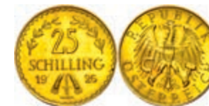
259 25 Schilling, Gold, 1926, Fb. 521, vz. 200,—