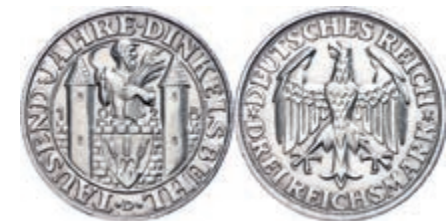
131 3 Reichsmark, 1928, 1000-Jahrfeier Dinkelsbühl, kleine Randfehler, ss-vz. J. 334 300,—