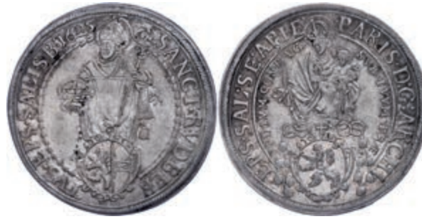
58 Taler, 1625, Paris Graf von Lodron, Zöttl 1476, Probszt 1199, f. vz. 150,—