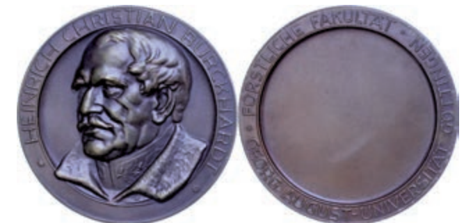
569 Göttingen, Bronzemedaille (Dm. ca. 70,8mm, ca. 127,7g), o.J., signiert "HD", Prämienmedaille der forstlichen Fakultät der Georg-August-Universität Göttingen für Verdienste um die Forstwirtschaft. Medaille wird in unregelmäßigen Abständen verliehen und ist dadurch sehr selten. Av: Kopf Burckhardts nach halblinks. Rev: Blankes Feld, darum Umschrift. Stellenweise etwas Belag, prägefrisch. (Abbildung auf 61% verkleinert) 50,—