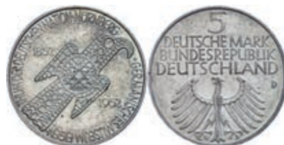
152 5 Mark, 1952, Germanisches Museum, wz. Rf., Patina, f. st. J. 388 200,—