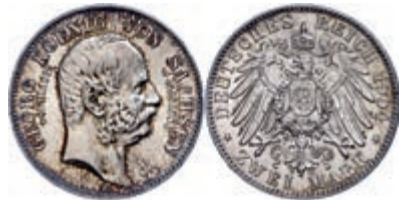
78 2 Mark, 1904, Georg, Auf seinen Tod, vz-st. J. 132 70,—