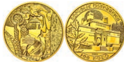
270 100 Euro, Gold, 2004, Wiener Secession, 16g fein, mit Zertifikat in Ausgabeschatulle, st. 650,—