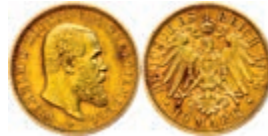
114 10 Mark, 1904, Karl, ss. J. 295 140,—