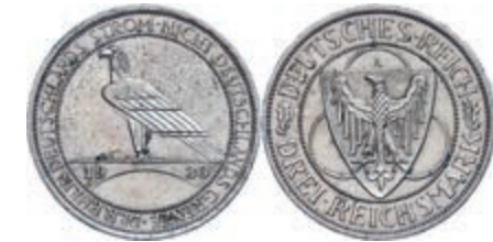
142 3 Reichsmark, 1930, Rheinlandräumung, Mzz A, kleine Randfehler, vz. J. 345 Gebot