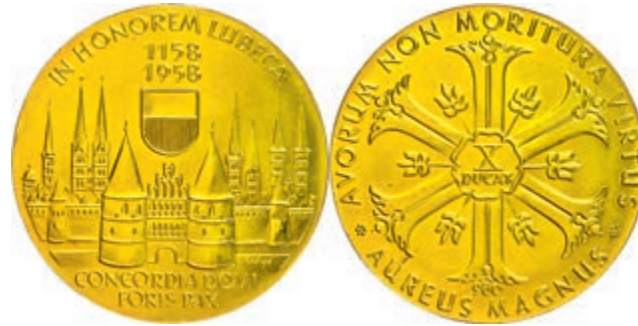
564 Goldmedaille zu 10 Dukaten (Dm. ca. 50,1mm, ca. 34,97g), unsigniert, 1958, 800 Jahre Holstentor. Punziert "980", kl. Rf., vz-st. (Abbildung auf 88% verkleinert) 1300,—