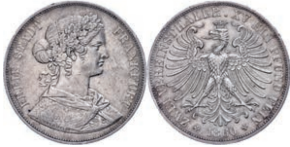
64 Doppeltaler, 1860, AKS 4, J. 43, kl. Rf., ss. 70,—