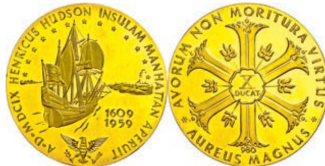
566 Goldmedaille zu 10 Dukaten (Dm. ca. 50,1mm, ca. 34,91g), unsigniert, 1959, auf die Entdeckung Manhattans durch Henry Hudson. Punziert "980", kleine Prüfspur, kl. Kr., vz-st. (Abbildung auf 88% verkleinert) 1300,—