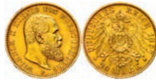
115 20 Mark, 1897, Wilhelm II., kleine Randfehler, ss-vz. J. 296 250,—