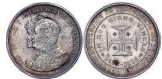
275 1000 Reis, 1898, Carlos I., 400 Jahre Entdeckung Indiens, kl. Rf. und Kr., vz+ 80,—