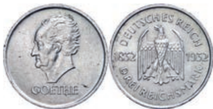
146 3 Reichsmark, 1932, Johann Wolfgang von Goethe, Mzz A, kleine Randfehler, ss-vz. J. 350 20,—