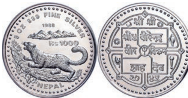
254 1000 Rupien, Silber, 1988, Schneeleopard, 5 oz, KM 1036, in Kapsel, mit Zertifikat des Anbieters, PP. (Abbildung auf 67% verkleinert) 100,—