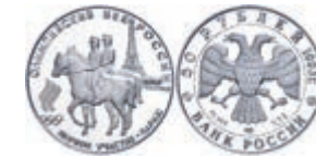
298 50 Rubel, Platin, 1993, Olympische Spiele 1900 in Paris, Parch. 1604, in Kapsel, 7,78g. Auflage 7500 Exemplare, PP. 350,—