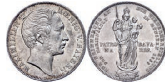
62 Doppelgulden, 1855, Maximilian II., Mariensäule München, AKS 168, J. 84, kl. Rf. und Kr., vz 45,—