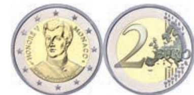
249 2 Euro, 2019, 200. Jahrestag der Thronbesteigung von Fürst Honoré V., in Kapsel, in Originalschatulle mit Zertifikat und Umverpackung, PP. 300,—