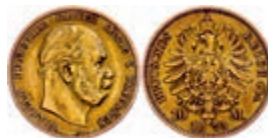
83 10 Mark, 1873 A, Wilhelm I., ss. J. 242. 150,—