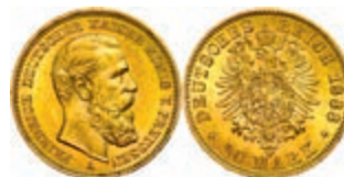
95 20 Mark, 1888, Friedrich III., kleine Randfehler, vz. J. 248 250,—