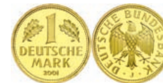
160 1 DM, 2001, J, Abschiedsmark, in Kapsel, st, J. 481. 500,—