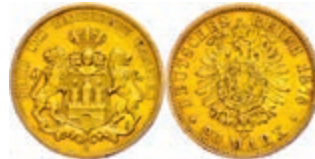
81 20 Mark, 1878, kl. Rf., ss. J. 210 250,—