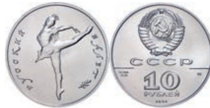
294 10 Rubel, Palladium, 1991, Ballerina, 1/2 oz, Fb. B9, in Kapsel, st. 900,—