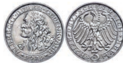
129 3 Reichsmark, 1928, Albrecht Dürer, minimale Randfehler, vz. J. 332 160,—