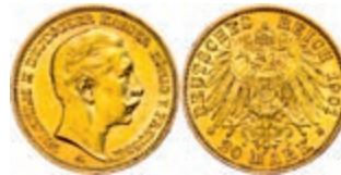
100 20 Mark, 1901, Wilhelm II., ss-vz. J. 252 250,—