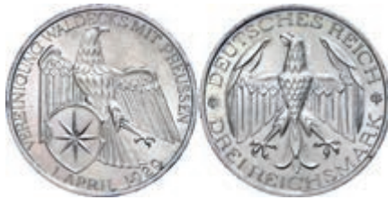
134 3 Reichsmark, 1929, Waldeck Vereinigung mit Preußen, kleine Randfehler, winzige Kratzer, vz. J. 337 40,—