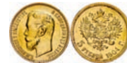
288 5 Rubel, Gold, 1904, Nikolaus II., Fb. 180, poliert, Randfehler, ss. 150,—