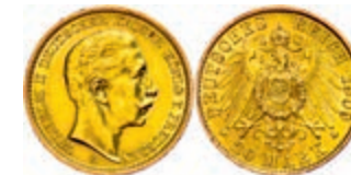
101 20 Mark, 1909 A, Wilhelm II., kl. Rf., kl. Kr., vz. J. 252 300,—