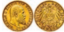
113 10 Mark, 1901, Karl, ss+. J. 295 140,—