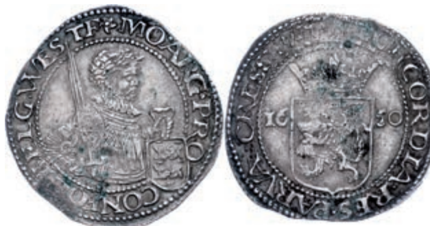
255 Westfriesland, Taler, 1650, Prägeschwäche, ss-vz. 90,—