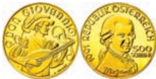
264 500 Schilling Gold, 1991, Mozart "Don Giovanni", 8 g, 986er Gold, Fb. 915, in Kapsel, in Samtschatulle mit Zertifikat, am Rand leicht angelaufen, PP. 300,—