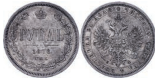
282 Rubel, 1878, Alexander II., St. Petersburg, Bitkin 92, kl. Rf., vz. 110,—