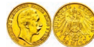
102 20 Mark, 1909 A, Wilhelm II., kl. Rf., kl. Kr., vz. J. 252. 300,—