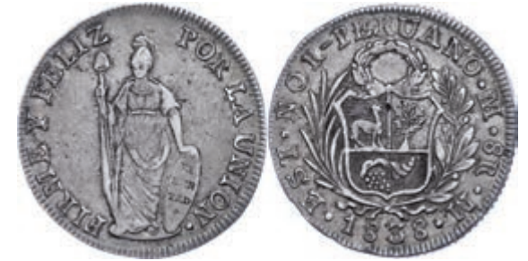
274 Nord Peru, 8 Reales, 1838, Lima, M, KM 155, ss. 70,—