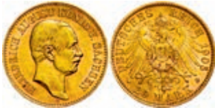
108 20 Mark, 1905, Friedrich August III., wz. Rf., f. vz. J. 268 300,—