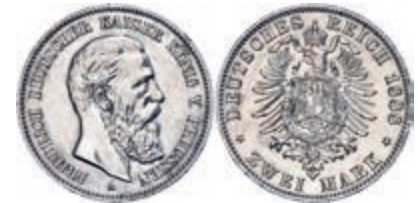
73 2 Mark, 1888, Friedrich III., berieben, vz+, J. 98 30,—