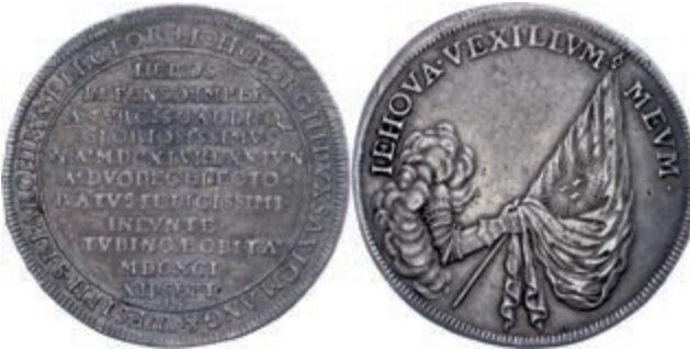
56 Taler, 1691, Johann Georg III., auf seinen Tod, Schnee 971, Dav. 7643, Slg. Merseb. 1271, justiert, ss-vz. 450,—