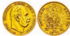
84 10 Mark, 1873, C, Wilhelm I., ss. J. 242 150,—