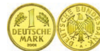
156 1 DM, 2001, A, Abschiedsmark, in Kapsel, st, J. 481. 500,—