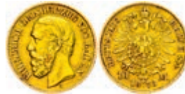
80 10 Mark, 1873, Friedrich I., kl. Rf., ss. J. 183 180,—