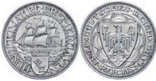
122 5 Reichsmark, 1927, Bremerhaven 100-Jahrfeier, kleine Randfehler, ss-vz. J. 325 180,—