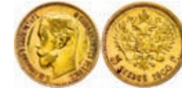
286 5 Rubel, Gold, 1900, Nikolaus II., Fb. 180, etwas Belag, kl. Rf., ss. 150,—