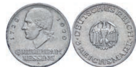
132 3 Reichsmark, 1929, Gotthold Ephraim Lessing, Mzz A, Randfehler, ss. J. 335 Gebot