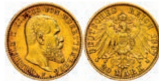
116 20 Mark, 1897, Wilhelm II., kleine Randfehler, ss. J. 296 250,—

Alle Einzellöse und Zertifikate/Gutachten sind unter www.rhenumis.de farbig abgebildet! Dort sind auch 258 weitere Lose zu finden, die nicht im gedruckten Katalog, sondern nur im Internet zu finden sind!