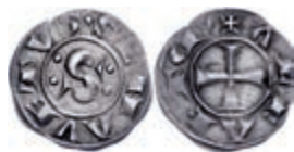
222 Siena, Grosso (1,76g), o.J. (12./13. Jh.). Av: "S" zwischen zwei Doppelpunkten, darum "SENAVETVS". Rev: Kreuz, darum "ALFAETM". Ss. 70,—