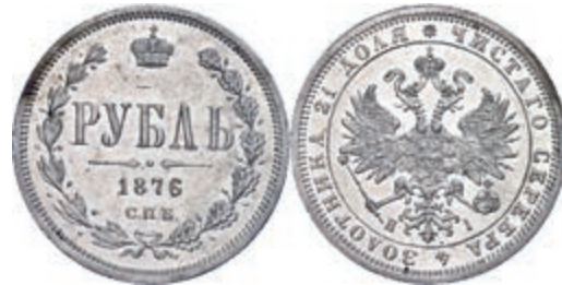
281 Rubel, 1876, Alexander II., St. Petersburg, Bitkin 89, kl. Kratzer, kl. Rf., vz. 200,—