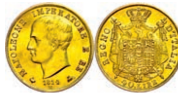
225 40 Lire, Gold, 1814, Napoleon, Mailand, Fb. 5, kl. Rf., bearbeitete Stellen, vz. 400,—