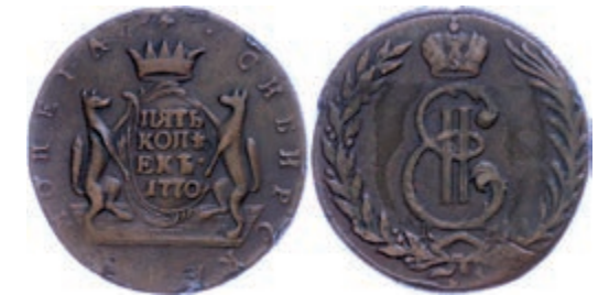
276 5 Kopeken (32,10g), 1770, Katharina II., Suzun, Bitkin 1066, Randfehler, ss. 30,—