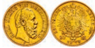
112 20 Mark, 1873, Karl, ss. J. 290. 250,—