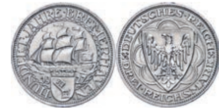
120 3 Reichsmark, 1927, Bremerhaven 100-Jahrfeier, kleine Randfehler, vz. J. 324 80,—