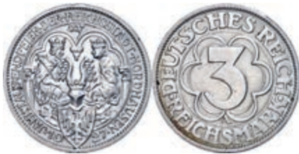
123 3 Reichsmark, 1927, Nordhausen 1000 Jahre Königspfalz, kleine Randfehler, vz. J. 327 40,—