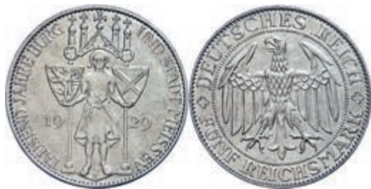
136 5 Reichsmark, 1929, Meißen 1000 Jahre Burg und Stadt, ss. J. 339 140,—