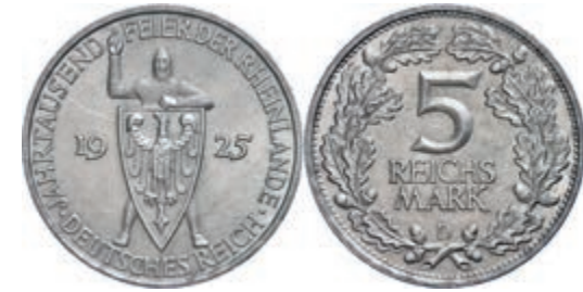
118 5 Reichsmark, 1925, 1000 Jahre Rheinlande, Mzz D, kleine Randfehler, vz. J. 322 40,—