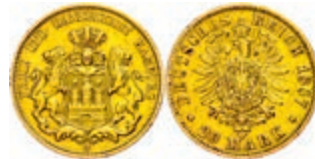
82 20 Mark, 1887, kl. Rf., ss. J. 210 250,—