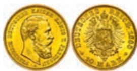
91 10 Mark 1888 A, Friedrich III., vz+, J. 247. 180,—