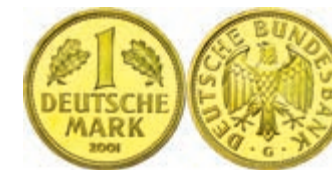
159 1 DM, 2001, G, Abschiedsmark, in Kapsel, st, J. 481. 500,—