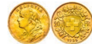
300 20 Franken, Gold, 1935, B, Vreneli, kl. Rf., Fb. 499, vz. 200,—