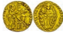
223 Venedig, Zecchino (3,39g), o.J. (1368-1382), Andrea Contarini, Fb. 1227, ss. 310,—