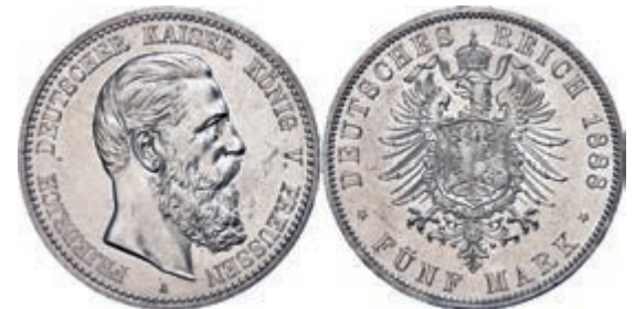
75 5 Mark, 1888, Friedrich III., Kratzer, kl. Rf., vz. J. 99 80,—