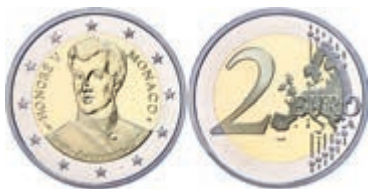
250 2 Euro, 2019, 200. Jahrestag der Thronbesteigung von Fürst Honoré V., in Kapsel, in Originalschatulle mit Zertifikat und Umverpackung, PP. 300,—