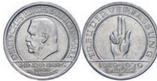
138 5 Reichsmark, 1929, Schwurhand, Mzz F, kleine Randfehler, ss. J. 341 50,—