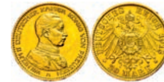
105 20 Mark, 1913, Wilhelm II. in Gardeuniform, kleine Randfehler, vz. J. 253 250,—