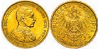
107 20 Mark, 1914, Wilhelm II. in Gardeuniform, kleine Randfehler, ss-vz. J. 253 250,—