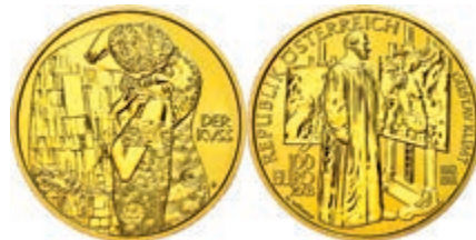
269 100 Euro, Gold, 2003, Malerei, 16g fein, mit Zertifikat in Ausgabeschatulle, st. 650,—