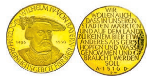
567 BAYERN, Goldmedaille zu 5 Dukaten o.J. (1960), 40,1 mm; 17,29 g, gestempelt 980er Gold, Stempel von Karl Roth, auf das bayerische Reinheitsgebot für Bier. Herzog Wilhelm IV von Bayern. Av.: Büste des Herzogs fast von vorn mit Barett. Rev: 12 Zeilen Schrift. Ehling 193., vz aus PP 700,—