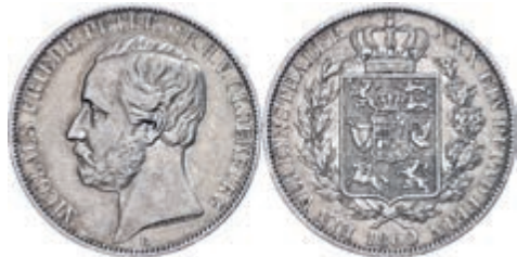
67 Taler, 1860, Nicolaus Friedrich Peter, AKS 25, J. 55, kl. Rf., ss. 50,—