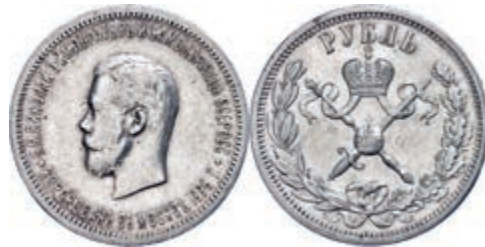
283 Rubel, 1896, Nikolaus II., St. Petersburg, Bitkin 322, kl. Rf., berieben, vz. 200,—