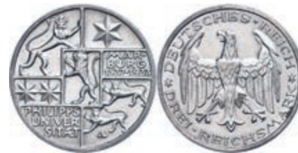
127 3 Reichsmark, 1927, 400-Jahrfeier der Gründung der Universität Marburg, f. vz. J. 330 50,—