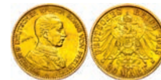
106 20 Mark, 1913, Wilhelm II., wz. Rf., vz. J. 253 250,—