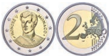
252 2 Euro, 2019, 200. Jahrestag der Thronbesteigung von Fürst Honoré V., in Kapsel, in Originalschatulle mit Zertifikat und Umverpackung, PP. 300,—