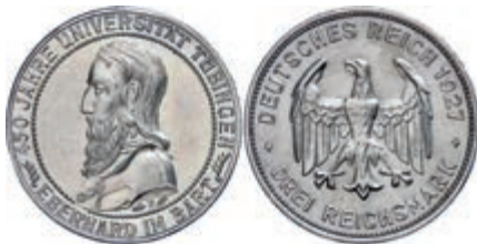
124 3 Reichsmark, 1927, 450-Jahrfeier der Gründung der Universität Tübingen, kleine Randfehler, Avers berieben, vz. J. 328 140,—