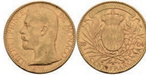
505 100 Francs, Gold, 1904, Albert, Fb. 13, Kratzer, kl. Rf., ss. 1250,—