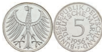
415 5 Mark, 1956, F, kl. Kr., wz. Rf., f. st. J. 387. 100,—