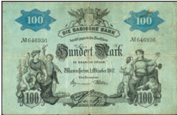
893 Baden, Lot 10 Banknoten; Baden, Ghzm. 3x 100 Mark, 1. Okt. 1902, 1907 (Ro. 705-706 a, b) und Baden Republik, 7 St. (Ro. 708-714), Erh. I-III. 100,—