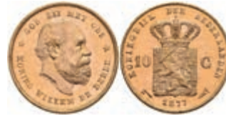
522 10 Gulden, Gold, 1877, Wilhelm III., Fb. 342, wz. Kr., vz-st. 270,—