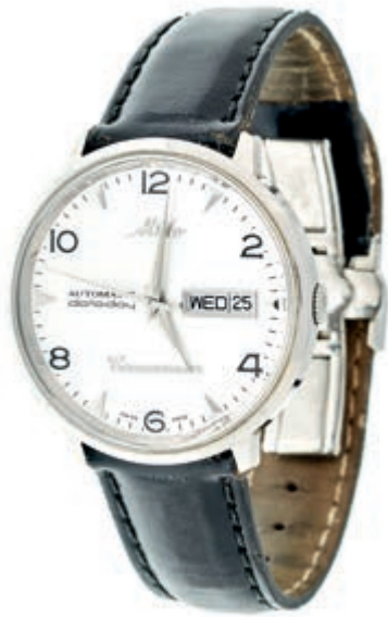
1319 Mido Commander Datoday Herren Armbanduhr. Ca. 37mm, Edelstahl, Hesalite-Glas, Automatik, Ref.-Nr.: 8419.451.8.1 Datumsanzeige, Zeiger fluoreszierend, Gebrauchsspuren auf Lünette. Schwarzes Lederarmband mit Mühle Glashütte Faltschließe. In Original Box mit Papieren. 300,—