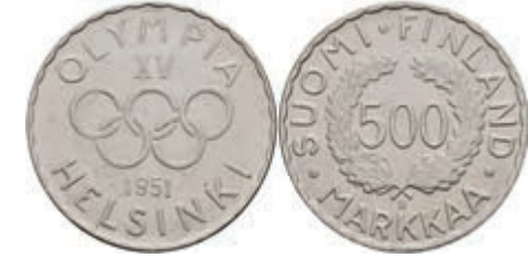
475 500 Markkaa 1951 und 1952, Silber, XV Olympiade in Helsinki 1952, KM 35, AKS 46, vz+ 250,—