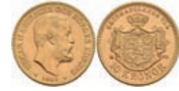
582 10 Kronen, Gold, 1901, Oskar II., Fb. 94b, vz. 170,—