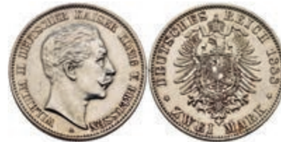
191 2 Mark, 1888, Wilhelm II., kl. Rf., poliert, ss-vz. J. 100 150,—