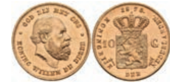
511 10 Gulden, Gold, 1875, Wilhelm III., Fb. 342, wz. Kr., vz-st. 250,—