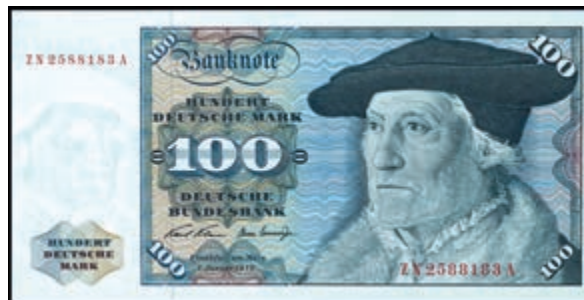
910 100 Deutsche Mark, 2.1.1970, Austauschnote zu Serie ZN/A, Ro. 273c, Erh. I (Abbildung auf 50% verkleinert) 300,—