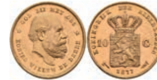
528 10 Gulden, Gold, 1877, Wilhelm III., Fb. 342, wz. Kr., vz. 250,—