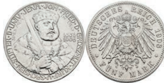
201 5 Mark, 1908, Wilhelm Ernst zur 350-Jahrfeier Universität Jena, kl. Rf., gereinigt, vz. J. 161. 100,—