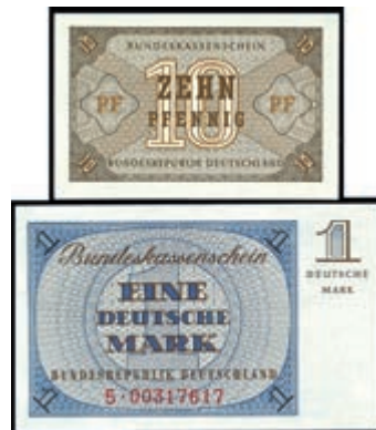
907 10 Pfennig und 1 Deutsche Mark, o. D (1967), Bundeskassenscheine, Ro. 315, 317a, Erh. I. (Abbildung auf 50% verkleinert) 60,—