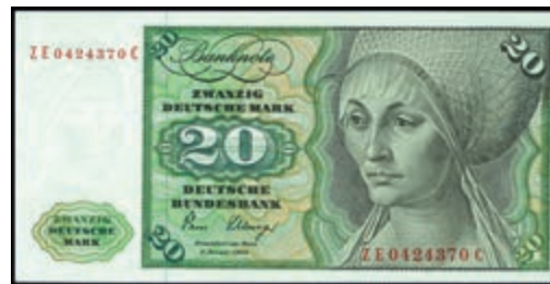
921 20 Deutsche Mark, 2.1.1980, Austauschnote Serie ZE/C Ro. 287b. Erh. I. (Abbildung auf 50% verkleinert) 300,—