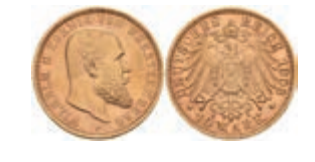
379 10 Mark, 1903, Wilhelm II., ss-vz. J. 295 160,—