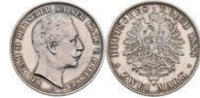
192 2 Mark, 1888, Wilhelm II., kleine Kratzer, vz. J. 100 250,—