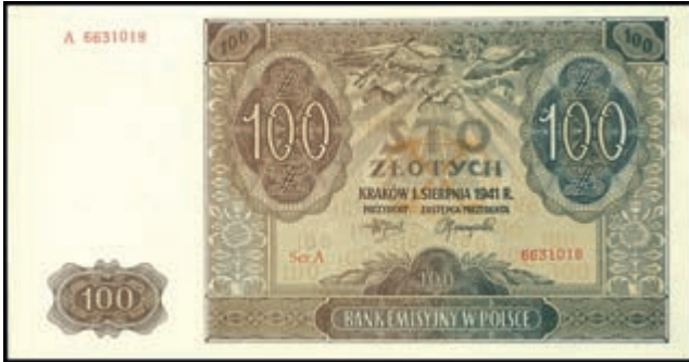
884 Generalgouvernement Polen, Emissionsbank, Ausgaben 1940 und 1941, 10, 20, 100, 500 Zlotych, 1. März. 1940 und 1, 2, 5, 50, 100 Zlotych 1.8.1941, Ro. 571-583, 9 St. Erh. II-III. (Abbildungen siehe Onlinekatalog) (Abbildung auf 46% verkleinert) 40,—