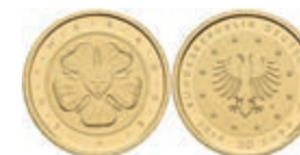
422 50 Euro Gold, 2017, J, Lutherrose, in Ausgabeschatulle, mit Zertifikat, in Kapsel, st. J. 618 330,—