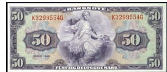
903 50 Deutsche Mark 1948, Kenn.- Bst. K/ Serie G, Ro. 242, Erh. I. (Abbildung auf 50% verkleinert) 1000,—