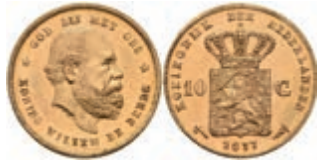
516 10 Gulden, Gold, 1877, Wilhelm III., Fb. 342, wz. Kr., f. st. 270,—