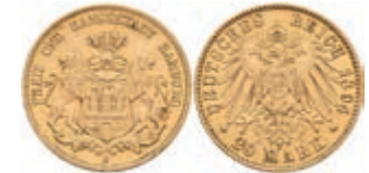
232 20 Mark, 1894, kl. Rf., ss. J. 212 250,—