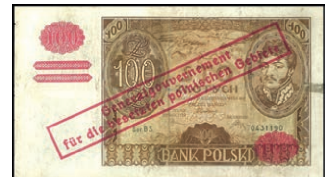
881 Generalgouvernement Polen, 100 Zlotych, 9.11.1934, Serie BS.,m Ro. 570a, Riss r., Erh. III (Abbildung auf 49% verkleinert) 30,—