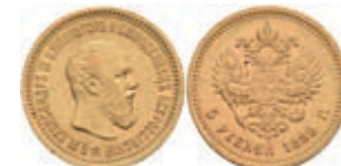
550 5 Rubel, Gold, 1889, Alexander III., Fb. 169, wz. Rf., ss-vz. 400,—