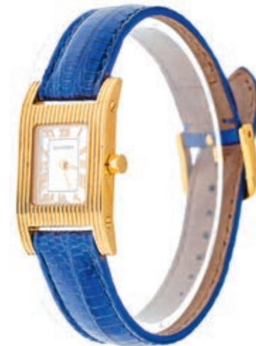
1329 Carl F. Bucherer Damenarmbanduhr Pathos, 18x31mm, 18K, leichte Gebrauchsspuren rückseitig. Kaufmann Handmade Armband in Eidechsen-Optik. Auf Echtheit geprüft. 2700,—

Goldmünzen ab 1800 sowie Goldbarren sind als Anlagegold ggf. umsatzsteuerfrei (auch für das Aufgeld), soweit der Zuschlagpreis inkl. Aufgeld und Losgebühr nicht höher als der Goldwert + 80% ist.