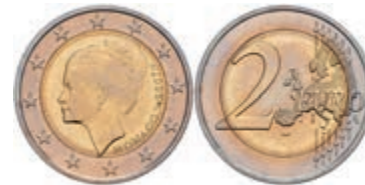
509 2 Euro, 2007, Grace Patricia Kelly zum 25. Todestag, KM 186, ohne Kapsel und Etui, kl. Kr., kl. Rf., vz-st. 2000,—