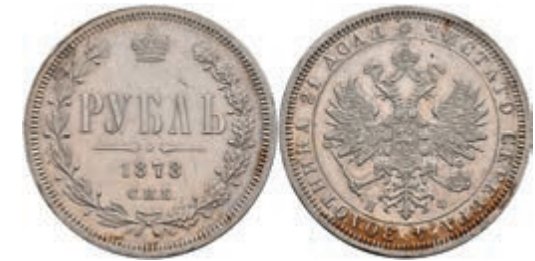
548 Rubel, 1878, Alexander II., St. Petersburg, Bitkin 92, kleine Kratzer und Randfehler, vz. 100,—