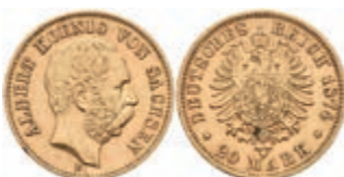
369 20 Mark, 1874, Albert, kl. Rf., ss. J. 262 300,—