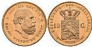
518 10 Gulden, Gold, 1877, Wilhelm III., Fb. 342, wz. Kr., f. st. 270,—