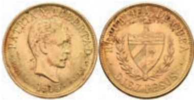
501 10 Pesos, Gold, 1915, Fb. 3, kl. Kratzer, ss-vz 750,—