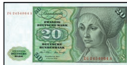
911 20 Deutsche Mark, 2.1.1970, Austauschnote zu Serie ZG/A, Ro. 271c., Erh. I. (Abbildung auf 50% verkleinert) 300,—