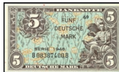
900 5 Deutsche Mark 1948, Kenn.-Bst. B/ Serie B, Ro. 236a, Erh. I. (Abbildung auf 50% verkleinert) 350,—