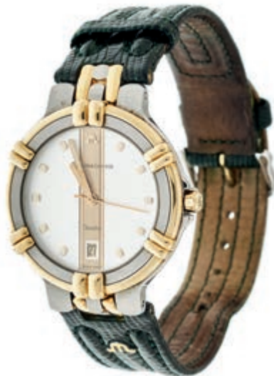
1315 Maurice Lacroix Calypso Herren Armbanduhr. Ca. 35mm, Stahl, Ref.-Nr.: 95346, Quarz. Datumsanzeige, weißes Ziffernblatt mit vergoldeten Details, Zeiger fluoreszierend. Guter Zustand, leichte Kratzer rückseitig. Originales Maurice Lacroix Armband in Eidechsenoptik mit Dornschnelle. 300,—