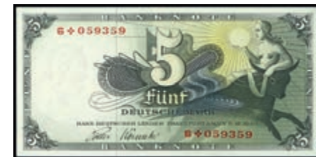
902 5 Deutsche Mark 9.12.1948, Europa auf dem Stier, Austauschnote, Serie 6 mit Kreuzstern vor der KN, Ro.252 d, Erh. I. (Abbildung auf 50% verkleinert) 700,—