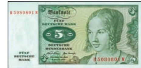
913 5 Deutsche Mark, 2.1.1970, Serie B/M, Ro. 269. a. Erh. I. 35,—