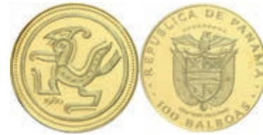
542 100 Balboas, 1980, Gold, Kondor, Fb. 10, in Coincard, mit Zertifikat in Ausgabeetui, PP. 350,—