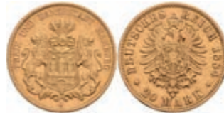
222 20 Mark, 1884, kl. Rf., ss. J. 210 300,—