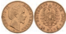
211 10 Mark, 1880, Ludwig II., Kratzer, Randfehler, ss. J. 196. 150,—