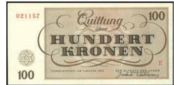
879 Drittes Reich- Jüdische Gettos: Theresienstadt, Serie zu 1, 2, 5, 10, 20, 50 und 100 Kronen-Scheine 1943, 7 St.. Erh. I. (Abbildungen siehe Onlinekatalog) (Abbildung auf 50% verkleinert) 100,—