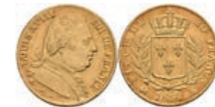
478 20 Francs, Gold, 1814, Louis XVIII., K (Bordeaux), Fb. 527, Gadoury 1026, ss. 250,—