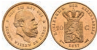
520 10 Gulden, Gold, 1877, Wilhelm III., Fb. 342, wz. Kr., vz-st. 270,—