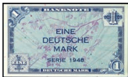
895 1 Deutsche Mark 1948, ohne Kenn. Bst. und Serie, Ro. 232, Erh. I. (Abbildung auf 50% verkleinert) 80,—