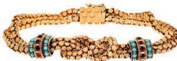
1243 Außergewöhnliches doppelreihiges Armband aus rechteckigen Ankerketten mit plastischem Blütendekor aller Sichtseiten, das bei normaler Sichtentfernung an Granulationsdekor erinnert. Das zentrale Kreuzknotenmotiv wird von Dekorelementen mit rotem und blauem Farbsteinbesatz flankiert. Mindestens 750er GG, wahrscheinlich höher legiert. Porto, gestempelt. Um 1900. L. ca. 20,0 cm. Ca. 39,80 gr. 1400,—