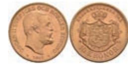
581 10 Kronen, Gold, 1901, Oskar II., Fb. 94b, vz-st. 170,—