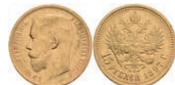
551 15 Rubel, Gold, 1897, Nikolaus II., Fb. 177, kl. Rf., ss. 700,—