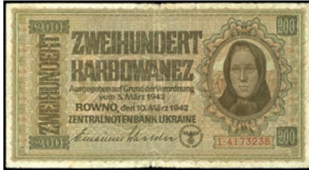
887 Zentralnotenbank Ukraine 1942, 1, 5, 10, 20, 50, 100 und 200 Karbowanez 10.3.1942 Ro. 591, 593-595, 596a, 597a, 598a, 7 St. Erh. II-III (Abbildungen siehe Onlinekatalog) (Abbildung auf 47% verkleinert) 100,—