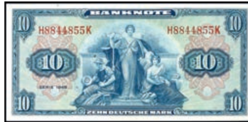
896 10 Deutsche Mark 1948, Kenn.- Bst. H/ Serie K, Ro. 238, Erh. I. (Abbildung auf 50% verkleinert) 300,—