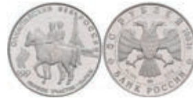
576 50 Rubel, Platin, 1993, Olympische Spiele 1900 in Paris, Parch. 1604, in Kapsel, PP. 180,—