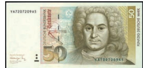
927 50 Deutsche Mark, 2.1.1989, Austauschnote Serie YA/A8, Ro. 293b. Erh. I 100,—