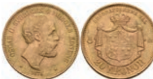
580 20 Kronen, Gold, 1875, Oskar II., Fb. 93, ss-vz 350,—