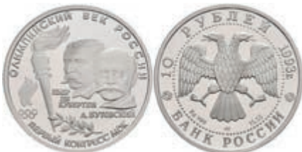
574 10 Rubel, Palladium, 1993, 100 Jahre olympische Bewegung, Parchimowicz 1351, in Kapsel, PP. 700,—