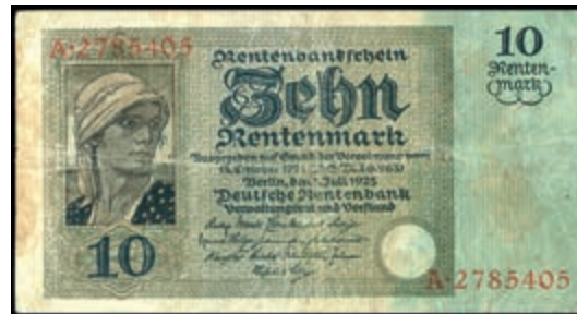
867 Deutsche Rentenbank, 10 Rentenmark 3.7.1923, KN 7stellig, Serie A. Ro. 163, Erh. III. (Abbildung auf 50% verkleinert) 200,—