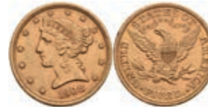
672 5 Dollars, Gold, 1908, Philadelphia, Fb. 143, kl. Rf., f. vz. 300,—