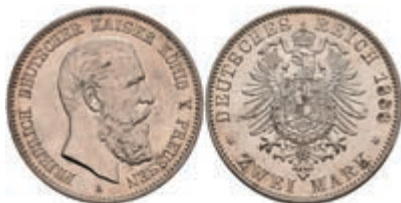
187 2 Mark, 1888, Friedrich III., wz. Rf., vz-st. J. 98 50,—