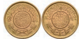
578 Pound, 1950, AH 1370, Fb. 1, vz-st. 330,—