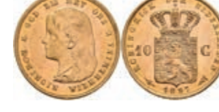
532 10 Gulden, Gold, 1897, Wilhelmina, Fb. 347, wz. Kr., vz-st. 270,—