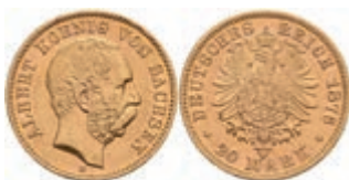
370 20 Mark, 1876, Albert, kl. Rf., ss.+ J. 262 350,—