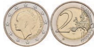
507 2 Euro, 2007, Grace Patricia Kelly zum 25. Todestag, KM 186, in Ausgabe-schatulle, kl. Flecken, vz-st. 2800,—