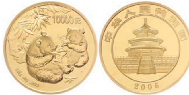
468 10.000 Yuan, Gold, 2006, Goldbarrenmünze zu 1 Kilo der Serie "Panda" Av: Tempel des Himmels in Beijing. Rev: Zwei Pandas mit Bambuszweigen. Auflage max. 200 Ex., Nr. 13, Fb. B72. In original Holzetui mit Zertifikat. Kleiner Fleck, PP. (Abbildungen siehe Onlinekatalog) (Abbildung auf 49% verkleinert) 55000,—