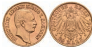
374 20 Mark, 1905, Friedrich August III., wz. Rf., vz. J. 268 300,—