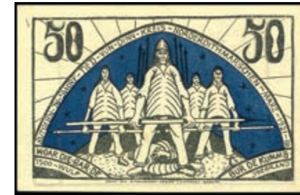
1042 Schleswig-Holstein, Norder-Dithmarschen (SH/SH) Kreis (Sitz in Heide), 2x 50 Pfg. o. D. ohne Aufdruck, mit KN.(1921) sehr selten. Grab./Mehl 983.2b, Erh. I und I- (Abbildungen siehe Onlinekatalog) (Abbildung auf 50% verkleinert) 130,—