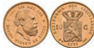
524 10 Gulden, Gold, 1877, Wilhelm III., Fb. 342, wz. Kr., vz-st. 270,—