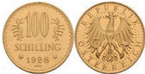
539 100 Schilling, Gold, 1928, Fb. 520, kl. Kratzer, vz. 850,—