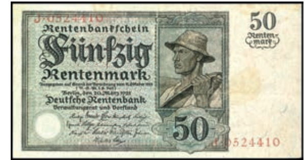
874 Deutsche Rentenbank, 50 Rentenmark 20.3.1925, "Sensemann", KN 7stellig, Serie J, fleckig. Ro. 162, Erh. III. (Abbildung auf 50% verkleinert) 200,—