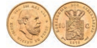
513 10 Gulden, Gold, 1876, Wilhelm III., Fb. 342, wz. Kr., vz-st. 250,—