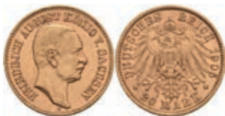
372 20 Mark, 1905, Friedrich August III., kl. Rf., ss-vz. J. 268 300,—