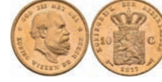
530 10 Gulden, Gold, 1877, Wilhelm III., Fb. 342, wz., Kr., vz-st. 270,—