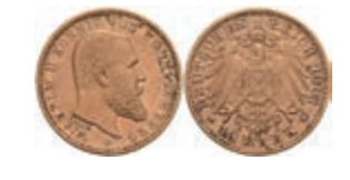
378 10 Mark, 1901, Wilhelm II., gutes ss. J. 295. 180,—