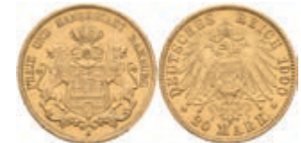
238 20 Mark, 1900, kl. Rf., ss. J. 212 280,—