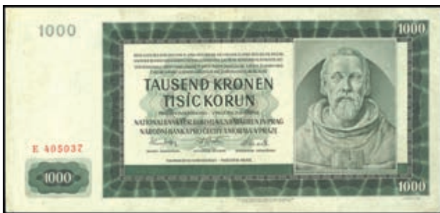
886 Nationalbank für Böhmen und Mähren 1942-1944, 500 Kronen 1942, 1000(2x) Kronen 1942 und 5000 Kronen 1944, Ro. 565a, 566a Serie E, 566 a Serie Hb, 568b, 4 St., Erh. II. (Abbildungen siehe Onlinekatalog) (Abbildung auf 43% verkleinert) 65,—