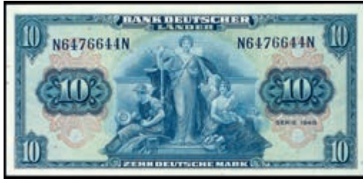
905 10 Deutsche Mark 22.8. 1949, Kenn.-Bst. N/Serie N, Ro. 258, Erh. I (Abbildung auf 50% verkleinert) 70,—