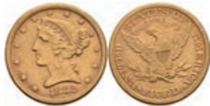
663 5 Dollars, Gold, 1882, Philadelphia, Fb. 143, kl. Rf., ss. 320,—