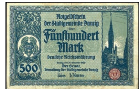
1047 Danzig, Stadtgemeinde, 500 Mark vom 31.10.1922, senkrechter Mittelknick, Ecken bestoßen, Ro. 793, Erh. III. (Abbildung auf 50% verkleinert) 100,—

Alle Einzellose und Zertifikate/Gutachten sind unter www.rhenumis.de farbig abgebildet! Dort sind auch 316 weitere Lose zu finden, die nicht im gedruckten Katalog, sondern nur im Internet zu finden sind!