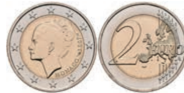
508 2 Euro, 2007, Grace Patricia Kelly zum 25. Todestag, KM 186, in Ausgabe-schatulle, vz-st. 2800,—