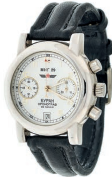
1321 Poljot MIG 29 Buran Wingman Chronograph Herren Armbanduhr. Ca. 38mm, Stahl, mechanischer Handaufzug. Weißes Ziffernblatt, Zeiger fluoreszierend, Datumsanzeige, Chronometer-Funktion. Guter Zustand. Schwarzes Lederarmband. 100,—