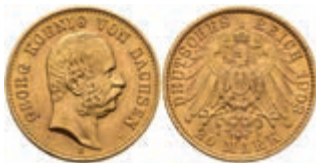
371 20 Mark, 1903, Georg, ss-vz. J. 266 300,—