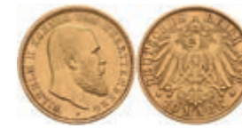
380 10 Mark, 1903, Wilhelm II., wz. Rf., ss+. J. 295 170,—