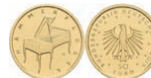
425 50 Euro Gold, 2019, J, Hammerflügel, in Ausgabeschatulle, mit Zertifikat, in Kapsel, st. J. 641. 400,—