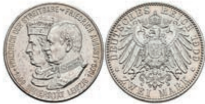
197 2 Mark, 1909, Friedrich August III., Universität Leipzig, f. st. J. 138. 50,—