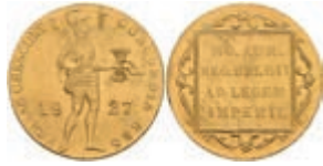
535 Dukat, 1927, Utrecht, Fb. 331, kl. kr., kl. Rf., vz. 140,—