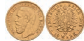
206 10 Mark, 1876, Friedrich I., kl. Rf., ss. J. 186. 180,—