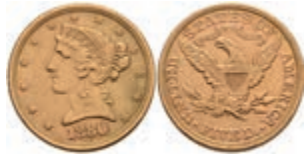
661 5 Dollars, Gold, 1880, Philadelphia, Fb. 143, Kratzer, ss. 300,—