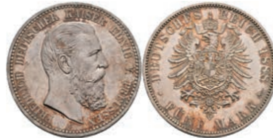
190 5 Mark, 1888, Friedrich III., vz-st. J. 99 80,—