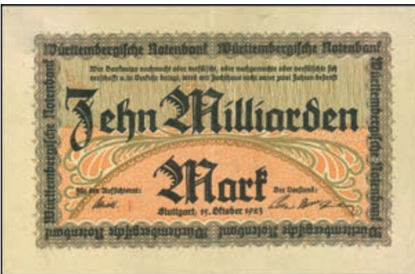
894 Württemberg, Lot 10 Banknoten; Königreich, 2x 100 Mark 1. Jan. 1911 (Ro. 771, a, b, Erh. III) und Volksstaat, (Ro. 772-779, 781-783), Erh. I und III. (Abbildungen siehe Onlinekatalog) 150,—