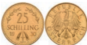
540 25 Schilling, Gold, 1930, Fb. 521, vz. 250,—