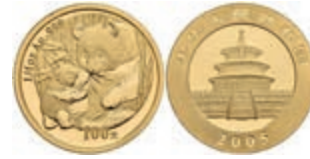
467 100 Yuan Gold, 2005, Panda, 1/4 oz, in Kapsel, st. 300,—