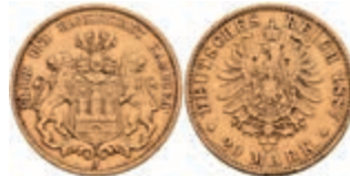
223 20 Mark, 1884, kl. Rf., ss. J. 210 300,—