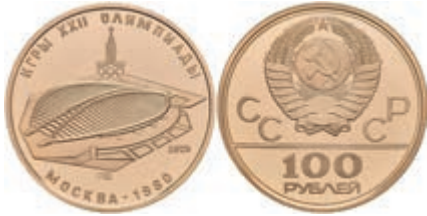
570 100 Rubel, Gold, 1979, Leningrad, Radrennbahn, KM 173, in Kapsel, PP 650,—