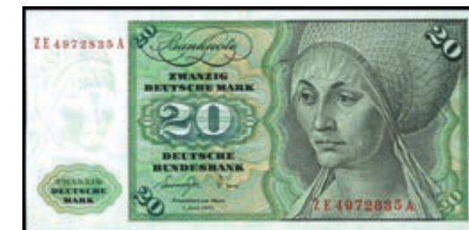
915 20 Deutsche Mark, 1.06.1977, Austauschnote Serie ZE/A, Ro. 273c, Erh. II-III. (Abbildung auf 50% verkleinert) 100,—

Alle Einzellose und Zertifikate/Gutachten sind unter www.rhenumis.de farbig abgebildet!