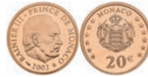
506 20 Euro, Gold, 2002, Rainer III., Fb. 36, in Kapsel, PP. 300,—