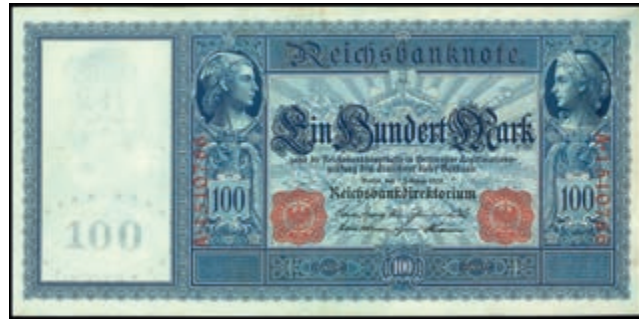
850 100 Mark 7.2.1908, Langer Hunderter, Serie A. Ro. 35, leicht wellig, Erh. I-. (Abbildung auf 83% verkleinert) 150,—