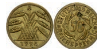
385 50 Reichspfennig, 1924, A, Schrötlingsfehler, ss. J. 318 450,—