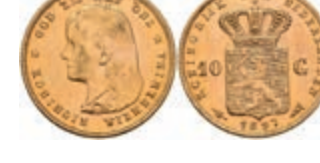
533 10 Gulden, Gold, 1897, Wilhelmina, Fb. 347, wz. Kr., vz-st. 270,—