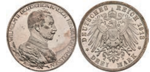
194 3 Mark, 1913, Wilhelm II., Regierungsjubiläum, kl. Kratzer, vz aus PP. J. 112 50,—