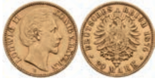
212 20 Mark, 1874, Ludwig II., kl. Rf., ss. J. 197 300,—