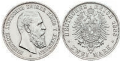
186 2 Mark, 1888, Friedrich III., gereinigt, vz-st, J. 98 30,—