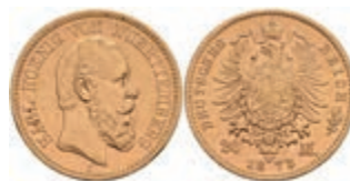
375 20 Mark, 1873, Karl, ss. J. 290 300,—