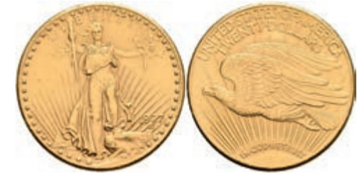
676 20 Dollars, Gold, 1927, Philadelphia, Fb. 185, kl. Rf., kl. Kr., vz. 1200,—