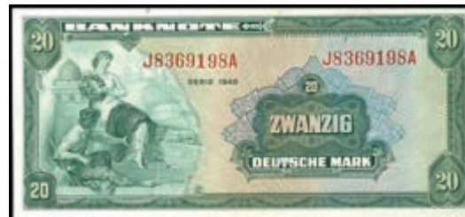
899 20 Deutsche Mark 1948, Kenn.- Bst. J/ Serie A, Ro. 240, Erh. I. (Abbildung auf 50% verkleinert) 350,—