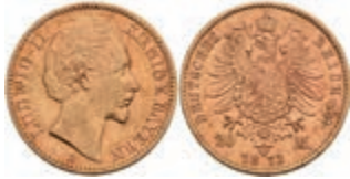
210 20 Mark, 1873, Ludwig II., kl. Rf., ss. J. 194 300,—