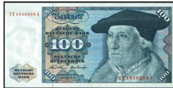
909 100 Deutsche Mark, 2.1.1970, Austauschnote zu Serie ZE/A, Ro. 273d, Erh. II-III. (Abbildung auf 50% verkleinert) 200,—