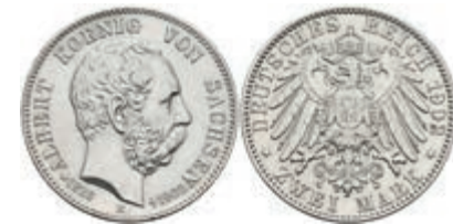
195 2 Mark, 1902, Albert, auf seinen Tod, wz. Kr., vz. J. 127. 30,—

Alle Einzellose und Zertifikate/Gutachten sind unter www.rhenumis.de farbig abgebildet! Dort sind auch 316 weitere Lose zu finden, die nicht im gedruckten Katalog, sondern nur im Internet zu finden sind!