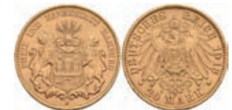
239 20 Mark, 1913, kl. Rf., vz. J. 212 300,—