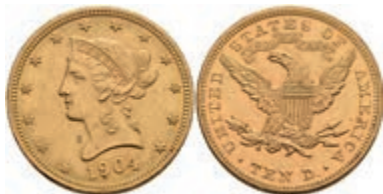
669 10 Dollars, Gold, 1904, Liberty Head, Philadelphia, Fb. 158, kl. Kr., vz 650,—