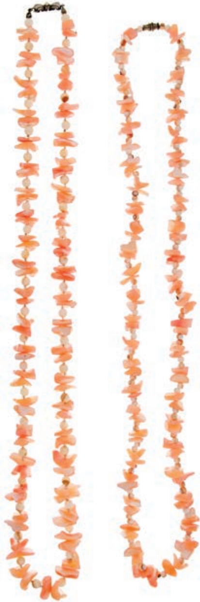
1303 Zwei Weiß-Rosa Perlmutterketten: mit Schleifenschließe 835 Silber mit kl. Perle, L= 37 cm, 103,80g und mit Drehschließe, L=36 cm, 83,94g. (Abbildung auf 87% verkleinert) 30,—