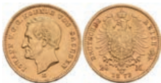
367 20 Mark, 1872, Johann, kl. Rf., ss. J. 258 350,—