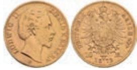
209 10 Mark, 1872, Ludwig II., Kratzer, kl. Rf., ss. J. 193 150,—