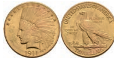
674 10 Dollars, Gold, 1911, Indian Head, Philadelphia, Fb. 166, ss-vz. 650,—