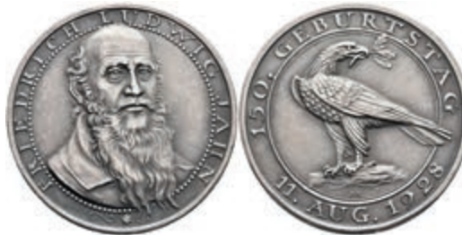
727 Silbermedaille (Dm. ca. 36mm, ca. 16,60g), 1928, von Hörnlein, auf den 150. Geburtstag von Friedrich Ludwig Jahn. Av: Büste im 3/4 Profil nach rechts, darum Umschrift. Rev: Adler mit Eichenzweig nach links, darum Umschrift. Rand punziert, vz. 45,—