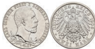
203 2 Mark, 1905, Karl Günther zum 25-jährigen Regierungsjubiläum, schmaler Randstab, gereinigt, Avers vz, Revers f. st. J. 169a. 50,—