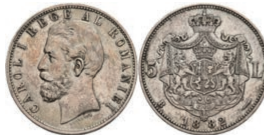
545 5 Lei, 1882, Karl I., Bukarest, Dav. 274, KM 17.1, ss. 100,—