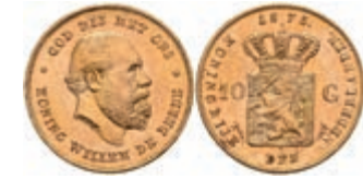
510 10 Gulden, Gold, 1875, Wilhelm III., Fb. 342, wz. Kr., vz-st. 250,—