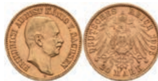
373 20 Mark, 1905, Friedrich August III., kl. Rf., ss. J. 268 300,—