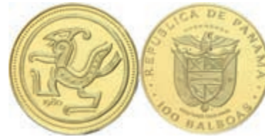
541 100 Balboas, 1980, Gold, Kondor, Fb. 10, in Coincard, mit Zertifikat in Ausgabeetui, PP. 350,—