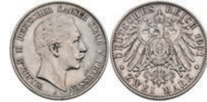
193 2 Mark, 1901, Wilhelm II., ss. J. 102 60,—