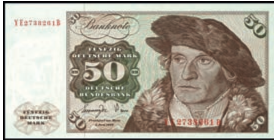
916 50 Deutsche Mark, 1.06.1977, Austauschnote Serie YE/B, Ro. 277b. Erh. I. (Abbildung auf 50% verkleinert) 250,—