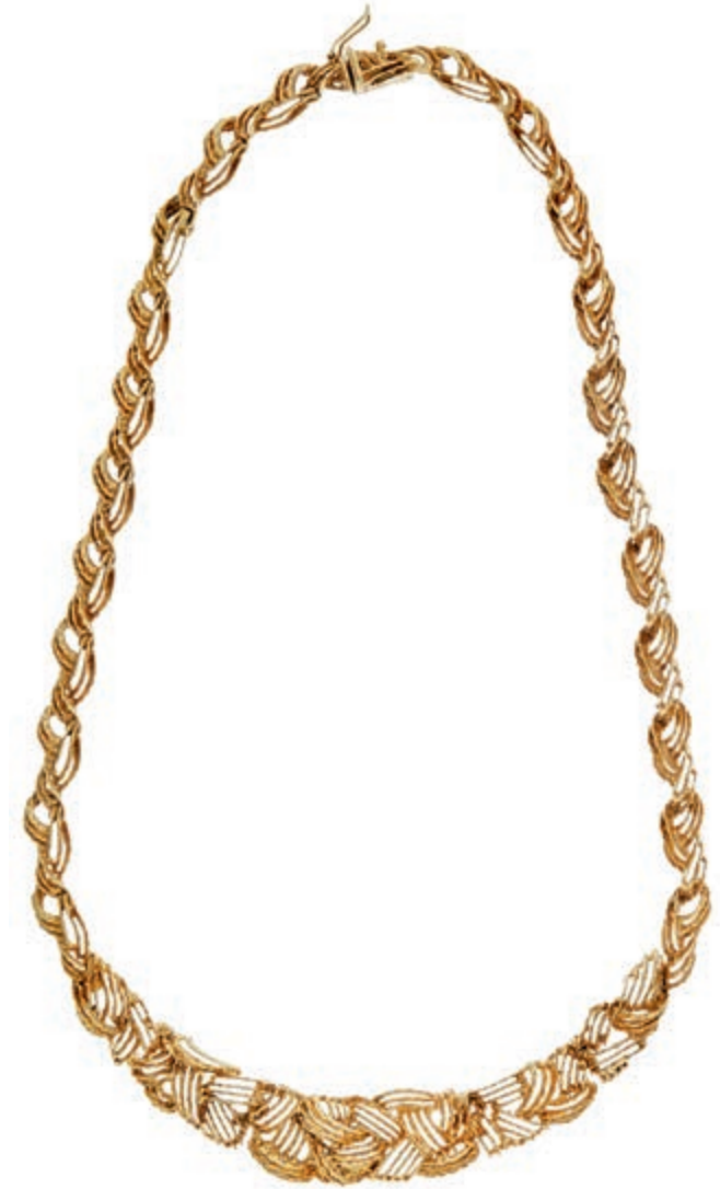
1237 Gold-Collier, 585 GG, zweifache Punze, gegliederter Zopfmuster im Verlauf, Kastenschloss, 41,89g. (Abbildung auf 79% verkleinert) 1250,—

Alle Einzellose und Zertifikate/Gutachten sind unter www.rhenumis.de farbig abgebildet!