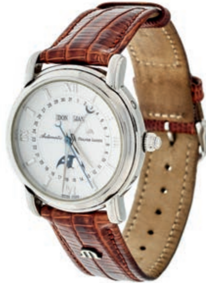
1316 Maurice Lacroix Masterpiece Phase de Lune Herren Armbanduhr. Ca. 37mm, Stahl, Saphirglas, Sichtboden, Ref.-Nr.: 37767, Automatik, weißes Ziffernblatt. Mondphase, Wochentagsanzeige, Datum, Monatsanzeige. Originales ML Lederarmband mit Dornschnelle. Nahezu neuwertiger Zustand, mit Original Box und großem ML Zertifikat. 1250,—