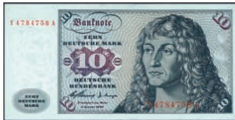
906 10 Deutsche Mark, 2.1.1960, Serie Y7A, Austauschnote, Ro. 263 d, Erh. I. 125,—