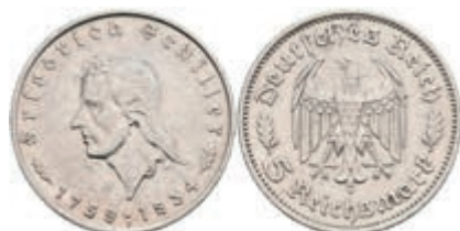
412 5 Reichsmark, 1934, F, Schiller, J. 359, kl. Kratzer, vz. 120,—