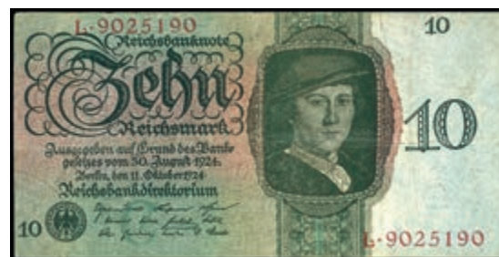
870 10 Reichsmark, 11.10.1924, KN 7stellig, Udr.-Bst. C, Serie L. Ro. 168, Erh. III. (Abbildung auf 50% verkleinert) 200,—