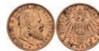
383 20 Mark, 1894, Wilhelm II., min. Randfehler, fleckig, ss-vz. J. 296 300,—