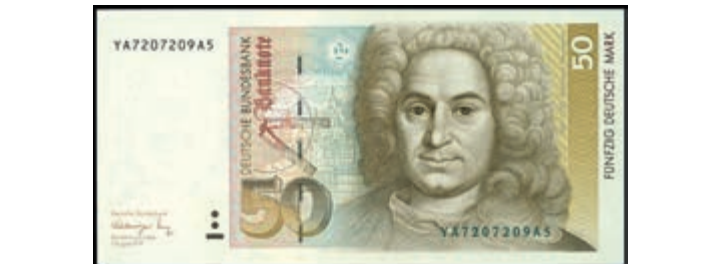
928 50 Deutsche Mark, 1.08.1991, Austauschnote, Serie YA/A2, Ro. 299b. Erh. I. 70,—