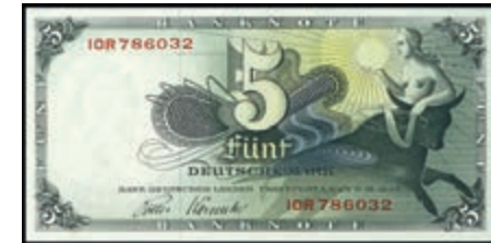
901 5 Deutsche Mark 9.12.1948 (Ausgabe 1956-1961), Europa auf dem Stier, Serie 10, Ro.252c/ Grab. BRD-1- 252e, Erh. I. (Abbildung auf 50% verkleinert) 150,—