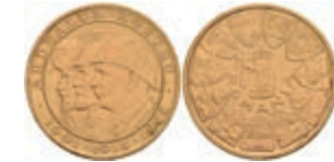
547 20 Lei, Gold, 1944, Michael I., auf die Wiedereingliederung Siebenbürgens, Fb. 21, vz. 280,—