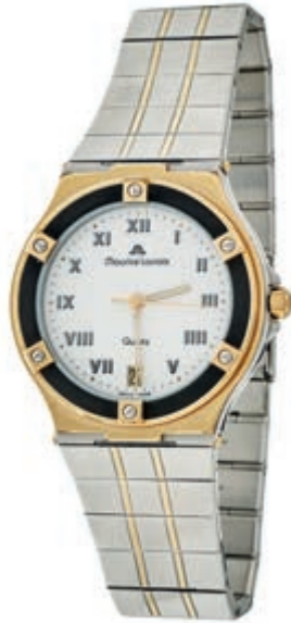
1314 Maurice Lacroix Calypso Herren Armbanduhr. Ca. 34mm, Stahl mit vergoldeten Details, Quarz, Ref.-Nr.: 95885. Datumsanzeige, Zeiger fluoreszierend, weißes Ziffernblatt im feinen Wabendesign. Guter Zustand mit leichten Gebrauchsspuren. Original Maurice Lacroix Armband mit Druckverschluss. 250,—