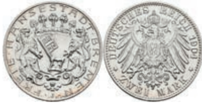
184 2 Mark, 1904, wz. Rf., vz-st. J. 59 50,—