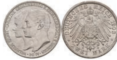
200 2 Mark, 1903, Wilhelm Ernst, auf die Vermählung, vz. J. 158 50,—