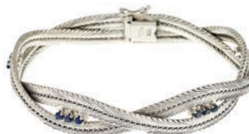
1244 Dekoratives doppelreihiges gedrehtes Armband mit Besatz aus zwölf Saphiren, nicht getestet. 20. Jh. 750er WG, gestempelt. L. ca. 18,5 cm. Ca. 25,35 gr. 900,—