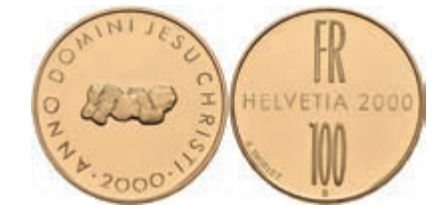
587 100 Franken, Gold, 2000, Zweitausend Jahre Christentum, 20,32 g fein, Fb. 519, mit Zertifikat, in Kapsel, PP. 1000,—