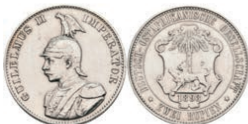
414 DOA, 2 Rupien, 1893, gereinigt, ss. J. N 714. 350,—