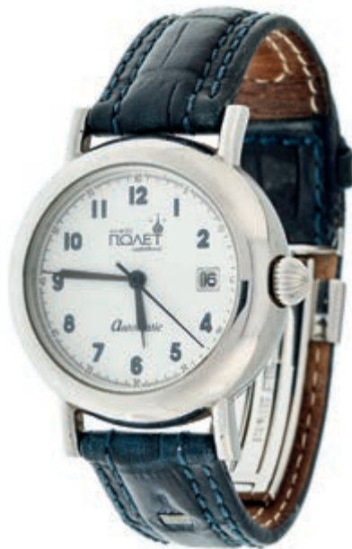
1320 Poljot International Simple Round Herren Armbanduhr. Ca. 37mm, Edelstahl, Glasboden, Automatik. Datumsanzeige, sehr gute Erhaltung. Dunkelblaues Lederarmband mit Original Poljot-Faltschließe. Mit Original-Box. 60,—