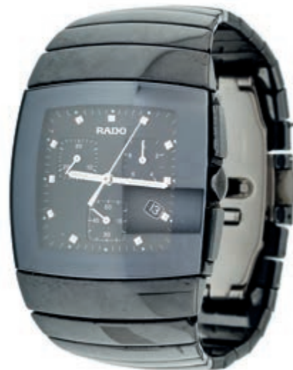
1322 Rado Diastar Sintra Chronograph Herren Armbanduhr. Ca. 35mm, Keramik, Rado Quarz, Ref.-Nr.: 538.0477.3. Schwarzes Ziffernblatt, Zeiger und Stunden mit Leuchtmass, Datumsanzeige, 3 Totalisatoren für Sekunde, 1/10 Sekunde, Minute. Guter Zustand. Schwarzes Rado Keramik Armband mit Original Rado Titan Faltschließe. 750,—

Alle Einzellose und Zertifikate/Gutachten sind unter www.rhenumis.de farblich abgebildet! Dort sind auch 316 weitere Lose zu finden, die nicht im gedruckten Katalog, sondern nur im Internet zu finden sind!