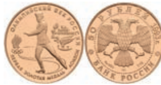
575 50 Rubel, Gold, 1993, Eiskunstlauf, Parchimowicz 1603, in Kapsel, 350,—