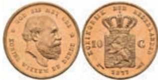
517 10 Gulden, Gold, 1877, Wilhelm III., Fb. 342, wz. Kr., f. st. 270,—