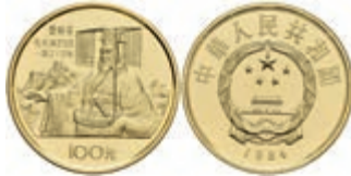
460 100 Yuan, Gold, 1984, Qin Shi Huang, KM 102, Fb. 16, in Kapsel, PP. 450,—