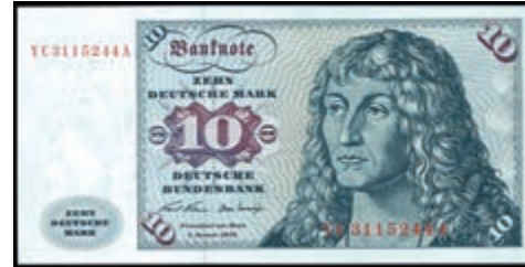
908 10 Deutsche Mark, 2.1.1970, Austauschnote, Serie YC/A, Ro.270c, Erh. I. (Abbildung auf 50% verkleinert) 100,—