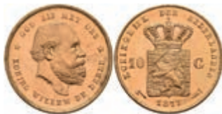
521 10 Gulden, Gold, 1877, Wilhelm III., Fb. 342, wz. Kr., vz-st. 270,—