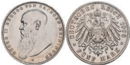
199 5 Mark, 1908, Georg II., kl. Rf., poliert, ss-vz. J. 153b 150,—