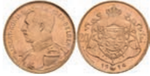
459 20 Francs, Gold, 1914, Albert, Fb. 421, wz. Kr., vz-st. 250,—