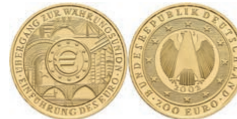
420 200 Euro Gold, 2002, Übergang zur Währungsunion, J, mit Zertifikat und Originalschatulle in Kapsel, st. J. 494. 1800,—