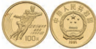
462 100 Yuan, Gold, 1991, Eispaarlauf, mit Zertifikat, in Kapsel, PP. 400,—