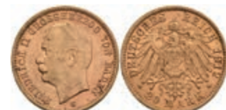
208 20 Mark, 1912, Friedrich II., kleinere Randfehler, ss-vz. J. 192 300,—