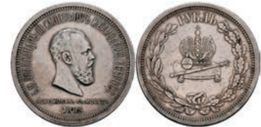
549 Rubel, 1883, Alexander III., St. Petersburg, auf seine Krönung, Bitkin 217, minimale Randfehler, ss. 120,—