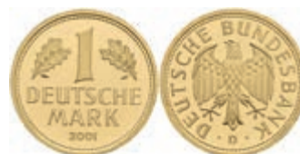
418 1 DM, 2001, D, Abschiedsmark, in Kapsel, st. J. 481. 500,—