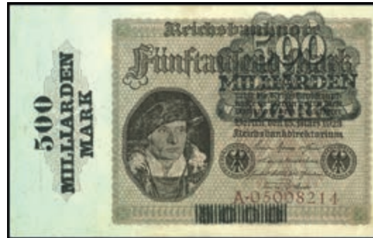
864 500 Milliarden Mark, 15.3. 1923, Serie A, Überdruck auf 5000 Mark (Ro.86), leicht wellig, Ro.121a, selten. Erh. I-II. 80,—