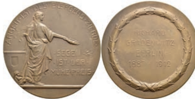
721 Berlin, Bronzemedaille (Dm. ca. 60,0mm, ca. 80,54g), 1912, geprägt bei AWES Berlin, auf Richard Gradenwitz. Av: Weibliche Gestalt von hinten nach rechts gehend, einen Lorbeerkranz in der rechten haltend. Rev: 4 Zeilen Schrift im Lorbeerkranz. Kl. Kr., vz-st. (Abbildung auf 72% verkleinert) 20,—