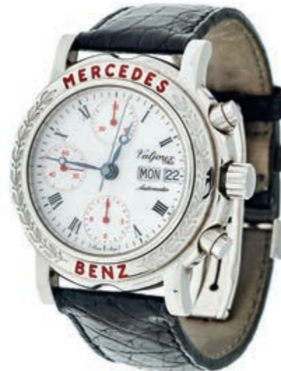
1317 Mercedes-Benz Collection Classic Valjoux 7750 Chronograph Herren Armbanduhr. Ca. 39mm, Edelstahl, Boden aus Saphirglas, gewölbtes Saphirglas auf Oberseite mit feiner Metallisation - durch Anhauchen wird der Mercedes-Stern sichtbar, Automatik. Weißes Ziffernblatt, temperaturregelebte Stahl-

zeiger, Datums und Tagesanzeige. 3 Totalisatoren mit Sekunde, 1/10 Sekunde und Minutenanzeige. Exemplar No. 646 von 1000 limitierten Stücken. Sehr guter Zustand. Original Mercedes Lederarmband in schwarz mit Original Mercedes Faltschnelle. Mit Bedienungsanleitung und Zertifikat. 500,—