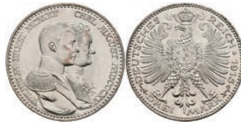
202 3 Mark, 1915, Wilhelm Ernst, Hundertjahrfeier des Großherzogtums, kl. Rf., kl. Kr., vz. J. 163 70,—