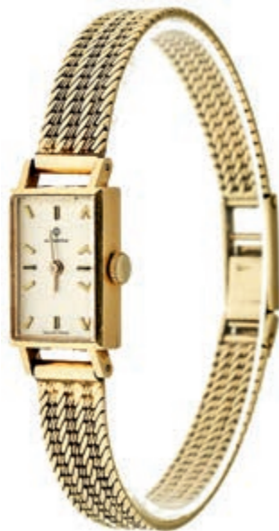
1325 Damenuhr "Candino", Mitte des 20. Jh., Ser. Nr. 4343, Gehäuse mit Helvetia 750er GG, Armband 585 GG gestempelt. Länge: Ca. 19,5 cm. Ca. 29,62 g, gehfähig. (Abbildungen siehe Onlinekatalog) 500,—