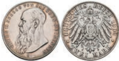
198 2 Mark, 1902, Georg II., kleiner Randfehler, ss-vz. J. 151b 150,—