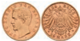
213 10 Mark, 1898, Otto, kl. Rf., ss. J. 199 150,—