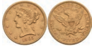
662 5 Dollars, Gold, 1881, San Francisco, Fb. 145, kl. Kr., f. vz 320,—