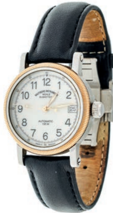
1326 Nautische Instrumente Mühle Glashütte Damen-Sport-Automatic Armbanduhr. Ca. 33,8mm, Ref.-Nr.: M1-31-70 Edelstahl mit Goldlunette, Saphirglas, Mineralglasboden, Automatik. Datumsanzeige, Zeiger fluoreszierend, leichte Gebrauchsspuren auf Lunette und rückseitig. Schwarzes Lederarmband mit originaler Mühle Faltschließe. In Box mit Original Papieren. 700,—