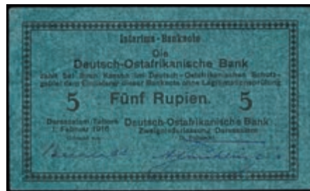
890 Deutsch-Ostafrika 1905-1917, 1, 5, 10 Rupien 1.11.1915 und 1 und 5 Rupien 1.2.1916. 5 St., Ro 912, 916e, 921, 928, 933d, Erh. II. (Abbildungen siehe Onlinekatalog) (Abbildung auf 50% verkleinert) 150,—