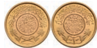
579 Pound, 1950, AH 1370, Fb. 1, vz-st. 300,—