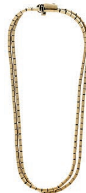
1246 Doppelreihiges Armband in 333 GG, flaches Glieder-Schlangenmuster, Kastenschloss mit Sicherheitsacht, Reparaturstelle, L= 20cm, 12,81g. 200,—