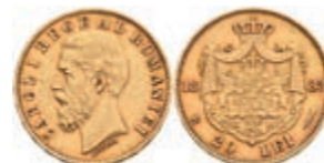
546 20 Lei, Gold, 1883, Karl I., Fb. 3, ss-vz 350,—