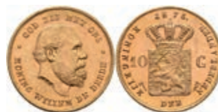
526 10 Gulden, Gold, 1877, Wilhelm III., Fb. 342, wz. Kr., vz-st. 270,—