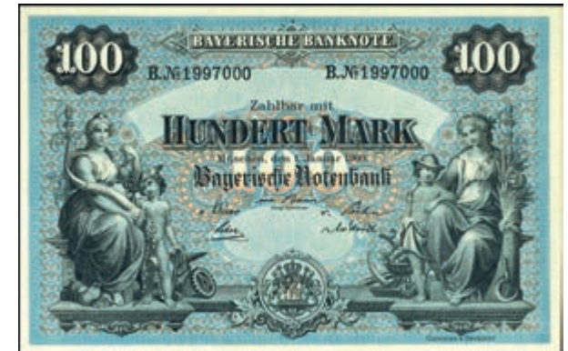
892 Bayern, Lot 16 Banknoten, Kgr. 100 Mark 1. Jan. 1900 (Ro. 718b) und Freistaat, Ro. 719- 726 und 728-734. Erh. I und III. (Abbildungen siehe Onlinekatalog) 100,—

Goldmünzen ab 1800 sowie Goldbarren sind als Anlagegold ggf. umsatzsteuerfrei (auch für das Aufgeld), soweit der Zuschlagpreis inkl. Aufgeld und Losgebühr nicht höher als der Goldwert + 80% ist.