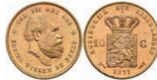
523 10 Gulden, Gold, 1877, Wilhelm III., Fb. 342, wz. Kr., vz-st. 270,—