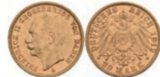
207 20 Mark, 1912, Friedrich II., kleine Randfehler und Kratzer, ss-vz. J. 192 300,—