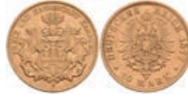
217 10 Mark, 1877, ss. J. 209 150,—