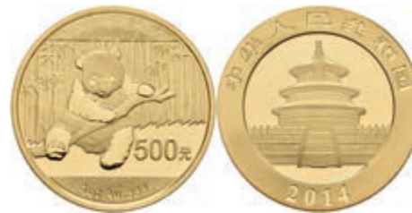
469 500 Yuan, Gold, 2014, Panda, in Kapsel, st. 1300,—