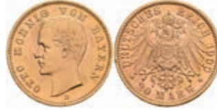
216 20 Mark, 1900, Otto, kl. Rf., ss-vz. J. 200 300,—