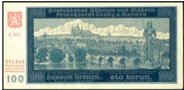
885 Protektorat Böhmen und Mähren 1940-1944, Behelfsausgaben und Staatsnoten, 1 (2x), 5, 100 (2x), 50, 10, 20, 50 Kronen, Ro. 556a, 558a, 559a, 560a (ohne Auflage), 560 (II. Auflage), 561a, 562-564 ohne Perforation, 9 St, Erh. II. (Abbildungen siehe Onlinekatalog) (Abbildung auf 50% verkleinert) 80,—