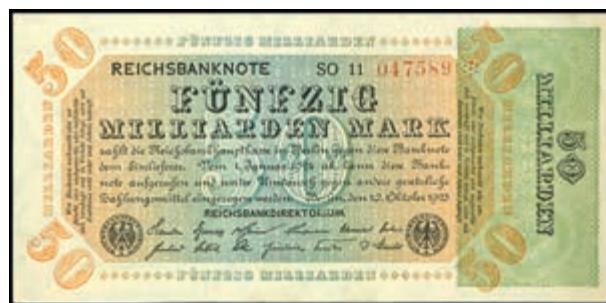
863 50 Mrd. Mark 10.10.1923, Reichsbanknote, drei Varianten (Ro. 116a, II), (Ro. 116h, I-) und (117b, I-). (Abbildung auf 50% verkleinert) 110,—