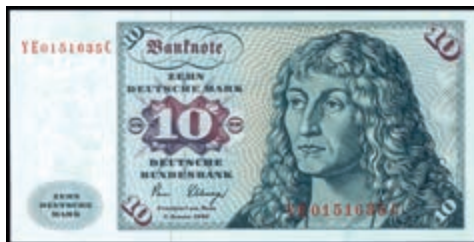
917 10 Deutsche Mark, 2.1.1980, Austauschnote Serie YE/C Ro. 281b. Erh. I. (Abbildung auf 50% verkleinert) 200,—