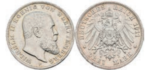
204 3 Mark, 1911, Wilhelm II., kl. Rf., vz. J. 175. 20,—