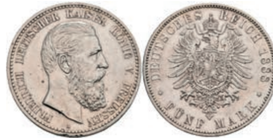
189 5 Mark, 1888, Friedrich III., kleine Kratzer, poliert, ss-vz. J. 99 50,—