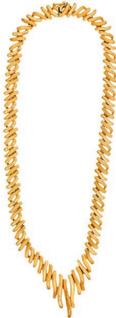
1236 Extravagantes unikates Collier in V-Form aus satinierten und polierten organisch anmutenden Stäben im Wechsel. 585er GG, gestempelt. Meisterpunze "ST", nicht aufgelöst. 2. Hälfte 20. Jh. L. ca. 46,0 cm. Ca. 56,30 gr. (Abbildung auf 73% verkleinert) 1700,—