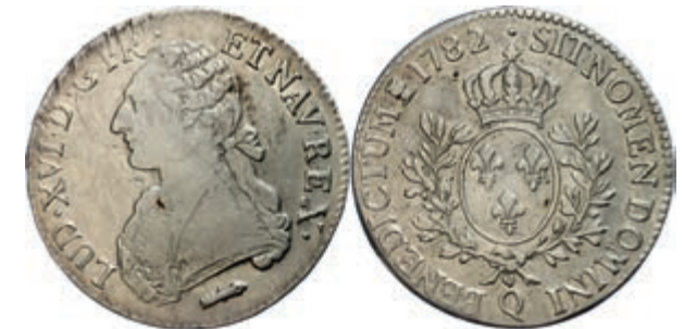
477 Ecu aux lauriers, 1782, Louis XVI., Q (Perpignan), Gadoury 356, etw. justiert, ss+. 100,—