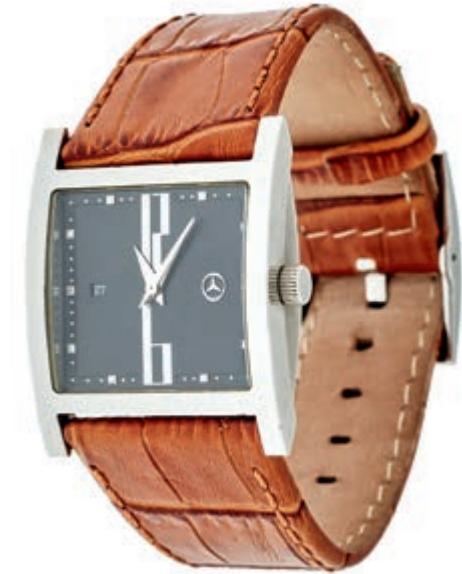
1318 Mercedes-Benz Collection Edition CLK Herren Armbanduhr. Ca. 32mm. Stahl, Quarz. Datumsanzeige, schwarzes Ziffernblatt. Guter Zustand. Braunes Lederarmband mit Mercedes Dornschnelle. 70,—