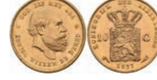
531 10 Gulden, Gold, 1877, Wilhelm III., Fb. 342, wz., Kr., vz-st. 270,—