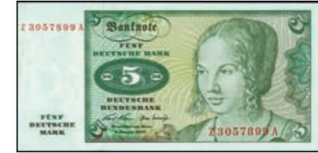
912 5 Deutsche Mark, 2.1.1970, Austauschnote, Serie Z/A, Ro. 269. b. Erh. I. 800,—