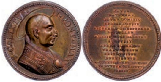
702 Kirchenstaat, Calixtus III., Bronzemedaille (Dm. ca. 37mm, ca. 23,93g), o.J. (ca. 18. Jhdt.). Av: Brustbild nach rechts, darum Umschrift. Rev: 15 Zeilen Schrift. Randfehler, ss-vz. Selten! 250,—