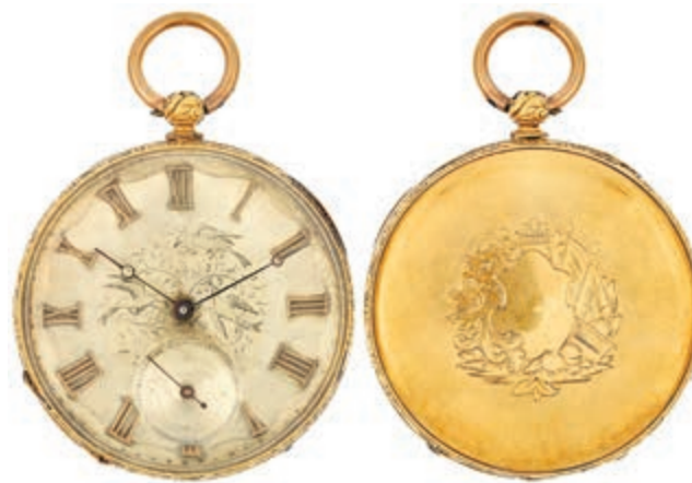
1306 Zylinderuhr mit Schlüsselaufzug und Stegwerk sowie separater Sekunde, handgraviert, erworben bei der Firma Abeler Anfang der 1960er Jahre (Wuppertal). Äußerst dekoratives Ziffernblatt mit graviertem Vogeldecor. Liverpool. 2920er-1930er Jahre. Unpunziert. Vorsichtiger Säuretest positiv auf 585er GG, auf Grund der Objektstruktur nicht tief ausführbar. Dm. ca. 42/46 mm. Ca. 61,1 gr. Dazu: Aufzugschlüssel, Uhrenständer aus Holz und Lederhülle. Das Werk wurde komplett überholt. (Abbildung auf 90% verkleinert) 500,—

Alle Einzellose und Zertifikate/Gutachten sind unter www.rhenumis.de farbig abgebildet!