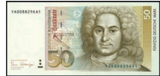
926 50 Deutsche Mark, 2.1.1989, Austauschnote Serie YA/A1, Ro. 293b. Erh. I. (Abbildung auf 50% verkleinert) 100,—