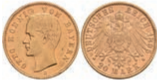
214 20 Mark, 1895, Otto, kl. Rf., ss. J. 200 300,—