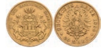
224 20 Mark, 1884, kl. Rf., ss. J. 210. 300,—