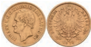
368 20 Mark, 1873, Johann, ss. J. 259 350,—