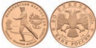
573 50 Rubel, Gold, 1993, Eiskunstlauf, Parchimowicz 1603, mit Zertifikat, in Kapsel, PP. 300,—