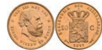
515 10 Gulden, Gold, 1877, Wilhelm III., Fb. 342, wz. Kr., f. st. 270,—