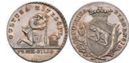
584 Bern, Gärtnerpfennig (7,47g), o.J. (um 1820). Av: gekröntes Wappen über gekreuztem Lorbeer- und Palmzweig mit Umschrift. Rev: Knieender Gärtner einen Baum einpflanzend, oben und unten Schrift. Kleine Kratzer, vz. 30,—