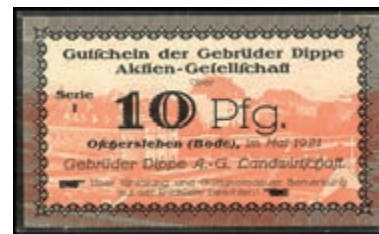
1029 Oschersleben (Sachsen), Gebrüder Dippe A.G. Landwirtschaft, 2x 10 Pfennig Mai 1921, Serie I. Erh. I und II. 30,—