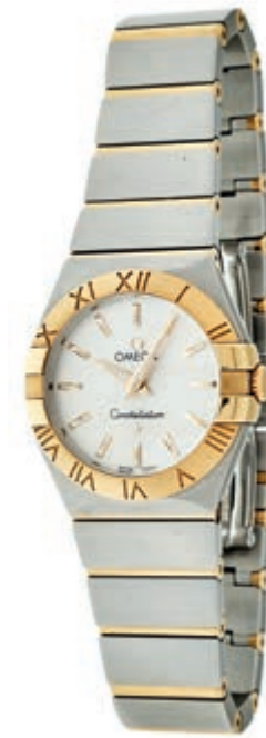
1327 Omega Constellation Damen Armbanduhr. Ca. 28mm, Edelstahl, entspiegeltes Saphirglas, Quarz, Ref.-Nr.: 91304922. Silbernes Ziffernblatt, Zeiger fluoreszierend. Sehr guter Zustand. Original Omega Armband, versilberter Stahl mit Omega Faltschließe. Armband erweiterbar, ein weiteres Element enthalten. 1500,—