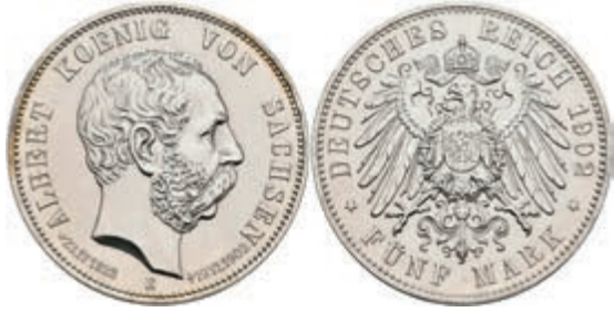
196 5 Mark, 1902, Albert, auf seinen Tod, gereinigt, vz. J. 128 80,—