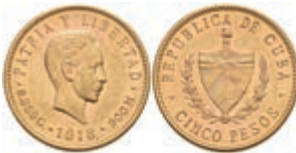
502 5 Pesos, Gold, 1916, Fb. 4, vz. 400,—