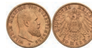
382 20 Mark, 1894, Wilhelm II., kl. Rf., ss-vz. J. 296 300,—