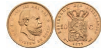
514 10 Gulden, Gold, 1877, Wilhelm III., Fb. 342, vz. 250,—