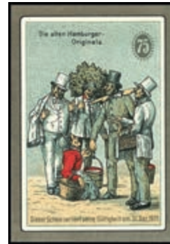
1024 Hamburg (Ham/Ha) Alte Diele, 5x 50 Pfennig und 1x 75 Pfennig o.D. (1921) ohne Wz., Rand weiß und 4x 50 Pfennig 1x 75 Pfennig o.D.-31.12.1921, Rand grau. Garb./Mehl 515.1 und 515.2, Erh. I. (Abbildungen siehe Onlinekatalog) (Abbildung auf 50% verkleinert) 80,—