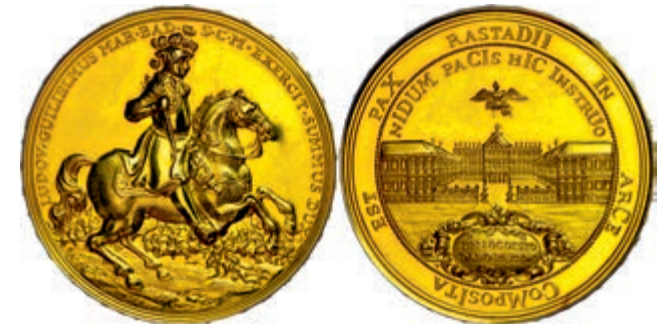
738 Baden, Goldmedaille (Dm. ca. 50,4mm, ca. 71,02g, 900er Gold), 1955, unsigniert, auf den 300. Geburtstag des Markgrafen Ludwig Wilhelm und den Frieden von Rastatt. Av: Der Markgraf zu Pferd nach rechts, darum Umschrift. Rev: Das Rastatter Schloss darüber Adler. Mit Randschrift, winzige Kratzer, f.st. (Abbildung auf 87% verkleinert) 3500,—