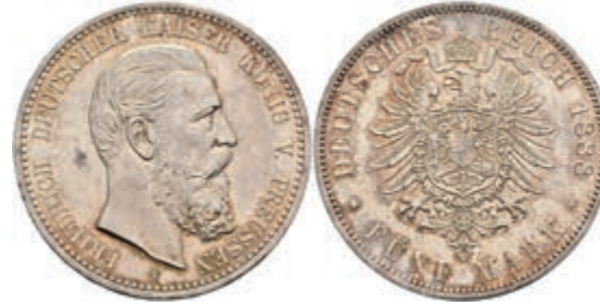
188 5 Mark, 1888, Friedrich III., kl. Rf., wz. Kr., vz. J. 99. 100,—