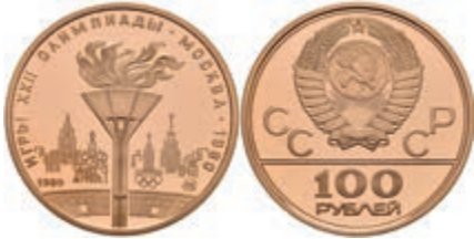
572 100 Rubel, Gold, 1980, Olymp. Feuer, KM 186, in Kapsel, PP. 650,—