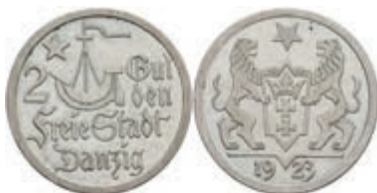
413 Danzig, 2 Gulden, 1923, Kogge, kl. Kr., vz. D 8. 80,—