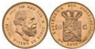
519 10 Gulden, Gold, 1877, Wilhelm III., Fb. 342, wz. Kr., f. st. 270,—