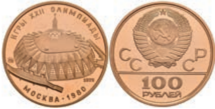
571 100 Rubel, Gold, 1979, Sporth. Luzhniki, KM 174, in Kapsel, PP. 650,—