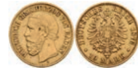
205 10 Mark, 1876, Friedrich I., kl. Rf., ss. J. 186 200,—