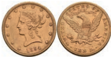
665 10 Dollars, Gold, 1894, Liberty Head, ohne Mzz Philadelphia, Fb. 158, un-sauberer Rand, ss. 600,—