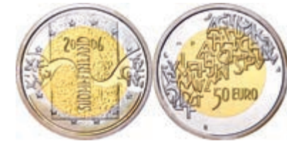
476 50 Euro, Bimetall Silber/Gold, 2006, Finnische EU Ratspräsidentschaft, 925er Silber 5,9 g, 750er Gold 6,9 g, Fb. 19, in Kapsel, in Originalausgabeetui, mit Zertifikat, PP. 230,—