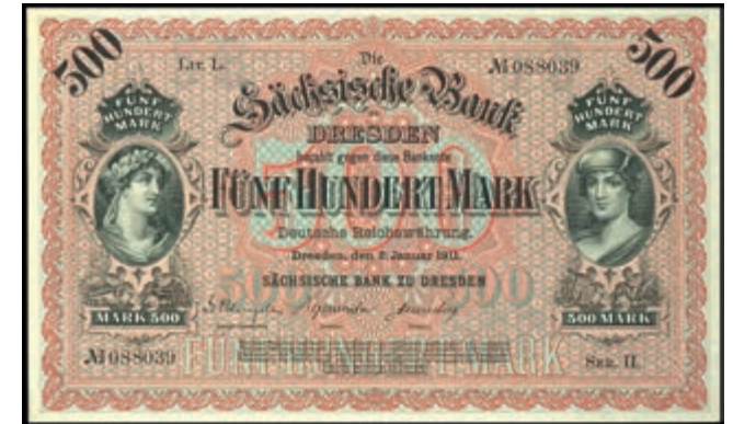
891 Sachsen, Sächsische Bank, Lot von 14 Banknoten 1890-1923: Ro. 744-749, 752-759, nicht durchgehend, Erh. I und III. (Abbildung auf 49% verkleinert) 100,—