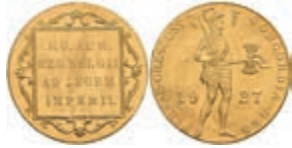
536 Dukat, 1927, Utrecht, Fb. 352, kl. Rf., vz. 150,—