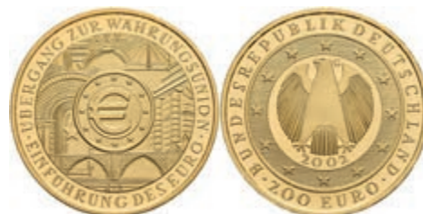
419 200 Euro Gold, 2002, Übergang zur Währungsunion, G, in Ausgabeetui ohne Zertifikat, st. J. 494. 1700,—