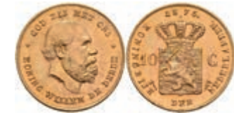
512 10 Gulden, Gold, 1875, Wilhelm III., Fb. 342, wz. Kr., vz-st. 250,—