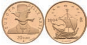
496 20 Euro, Gold, 2004, Europäische Kunst - René Magritte, Fb. 1545, in Kapsel, PP. 250,—