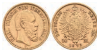
377 20 Mark, 1874, Karl, kl. Rf., ss. J. 293 280,—