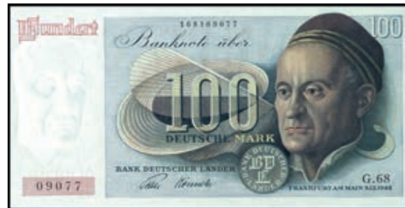
897 100 Deutsche Mark 9.12.1948 (Franzosenschein), Serie G/ Blockziffer 68, Ro. 256, Erh. I- (Abbildung auf 50% verkleinert) 200,—