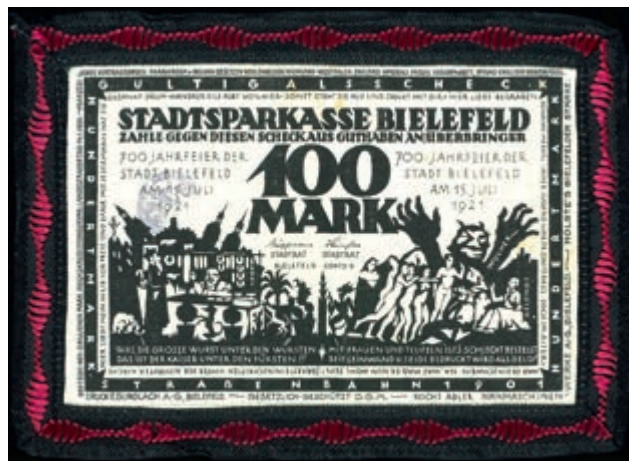
1022 Bielefeld, Stoffgeld, 5 St.: 3x 25 Mark und 2x 100 Mark 15. Juli 1921, Seide und Leinen, Grab. 18 c, d, 22a, 32d, 34b. Erh. I und II. (Abbildungen siehe Onlinekatalog) (Abbildung auf 50% verkleinert) 100,—