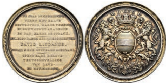
705 Belgien, Dendermonde, altvergoldete Æ-Medaille (Dm. ca. 45,4mm, ca. 32,42g), unsigniert, 1850, auf den 50. Jahrestag der Akademie für Zeichnung und Architektur in Dendermonde. Av: Stadtwappen, darüber Jahreszahl. Rev: 12 Zeilen Schrift. Hsp., kl. Kr., kl. Rf., ss-vz. (Abbildung auf 96% verkleinert) 100,—