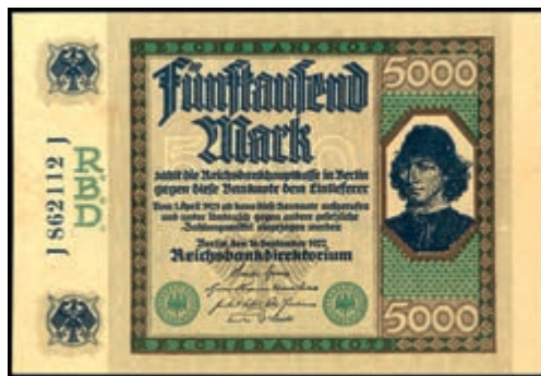
855 5000 Mark vom 16. September 1922, doppelte BZ, Serie J, rechte Kante mit 1mm Riss, links kl. Fleck, sonst einwandfrei Ro.76, Erh. I-. 80,—