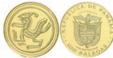
543 100 Balboas, 1980, Gold, Kondor, Fb. 10, in Coincard, mit Zertifikat in Ausgabeetui, PP. 350,—