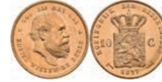
529 10 Gulden, Gold, 1877, Wilhelm III., Fb. 342, wz., Kr., vz-st. 270,—