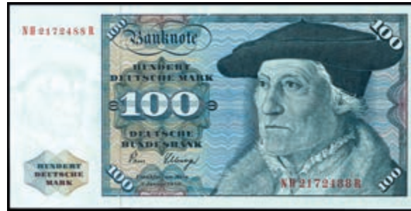
920 100 Deutsche Mark, 2.1.1980, Standardnote Serie NH/R Ro. 284a. Erh. I. (Abbildung auf 50% verkleinert) 150,—