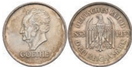
410 3 Reichsmark, 1932, A, Goethe, wz. Rf., vz. J. 350 30,—