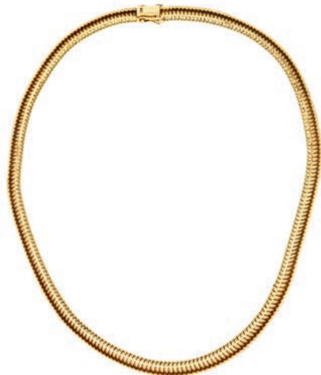
1238 Zeitloses Collier mit geometrischem Dekor. 2. Hälfte 20. Jh. 585er GG, gestempelt. L. ca. 41,0 cm. Ca. 56,35 gr. Das passende Armband wird ebenfalls in der Auktion angeboten. (Abbildung auf 64% verkleinert) 1600,—