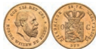
527 10 Gulden, Gold, 1877, Wilhelm III., Fb. 342, wz. Kr., vz-st. 270,—