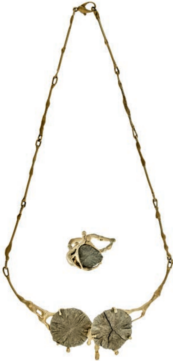
1234 Extravaganter Set aus Collier und Ring mit Pyritsonne, 585 Gold, gestempelt; Maße des Colliers (17,5x 12,5cm, 31,95g), Ring (Innen Dm= 19,4x20,5, 11,63g) Handarbeit, unbekannt. (Abbildung auf 95% verkleinert) 1100,—