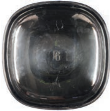
1331 Zeitlos elegante quadratische Schale mit abgerundeten Ecken und zentralem Monogram "PG". 835er Silber, gestempelt. Gottlieb Kurz, Schwäbisch Gmünd, gestempelt. Reichssilberstempel, gestempelt. Bez. "HANDARBEIT". 20. Jh. Ca. 29,5 x 29,5 x 6,0 cm. Ca. 668 gr. 350,—