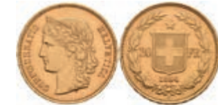
585 20 Franken, Gold, 1894, Fb. 495, kl. Rf., wz. Kr., vz. 250,—