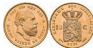
525 10 Gulden, Gold, 1877, Wilhelm III., Fb. 342, wz. Kr., vz-st. 270,—