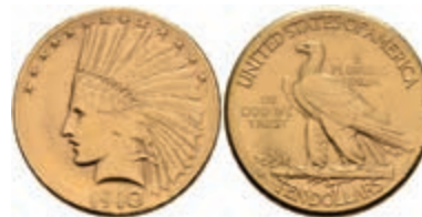
673 10 Dollars, Gold, 1910, Denver, Indian Head, Fb. 168, kl. Rf., ss. 600,—