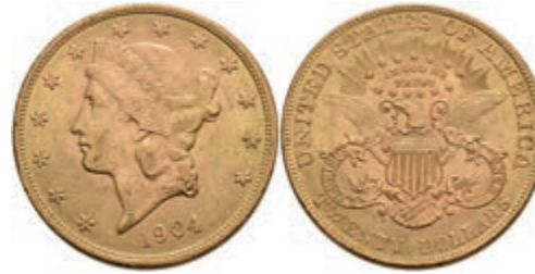
670 20 Dollars, Gold, 1904, Philadelphia, Fb. 177, ss-vz. 1300,—