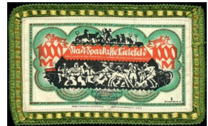
1046 Bielefeld, 1000 Mark, 15.12.1922 auf Leinen, mit Borte, Grab.IX 60c, Erh. I. (Abbildung auf 48% verkleinert) 180,—