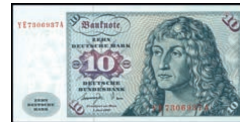
914 10 Deutsche Mark, 1.06.1977, Austauschnote Serie YE/A, Ro. 275b, Erh. I (Abbildung auf 50% verkleinert) 70,—