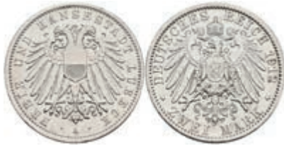
185 2 Mark, 1912, gereinigt, kl. Kr., ss-vz. J. 81 50,—