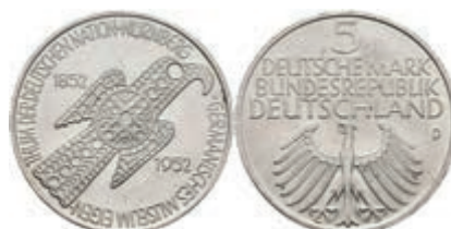
416 5 Mark, 1952, Germanisches Museum, wz. Kr., vz-st. J. 388. 250,—