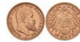
381 10 Mark, 1907, Wilhelm II., ss-vz. J. 295 160,—