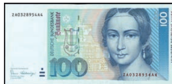
924 100 Deutsche Mark, 2.1.1989, Austauschnote Serie ZA/A4, Ro. 294b. Erh. I (Abbildung auf 50% verkleinert) 280,—