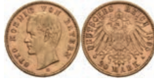
215 20 Mark, 1895, Otto, kleine Randfehler, ss. J. 200 300,—