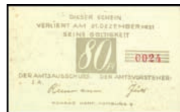
1038 Schleswig-Holstein, Brande-Hörnerkirchen (SH/SH) Gemeinde, 20, 30, 40, 60, 70, 80 Pfennig o. D. (1921)-31.12.1921 ohne Wz, Grab./Mehl 152.1, Erh. I. (Abbildung auf 50% verkleinert) 150,—