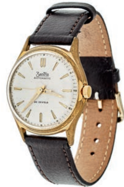
1323 ZentRa Automatic 26 Jewels Herren Armbanduhr. Ca. 34mm, Stahl, Automatik, weiß-silbriges Ziffernblatt. Gebrauchsspuren vor und rückseitig. Braunes Lederarmband mit Dornschnelle. 30,—