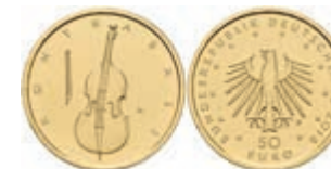
424 50 Euro Gold, 2018, D, Kontrabass, in Ausgabeschatulle, mit Zertifikat, in Kapsel, st. J. 630 330,—