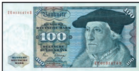
919 100 Deutsche Mark, 2.1.1980, Austauschnote Serie ZE/B Ro. 284b, Erh. II-III. (Abbildung auf 50% verkleinert) 250,—