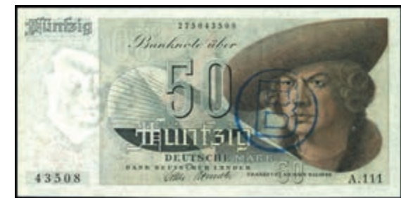
904 50 Deutsche Mark 9.12.1948 (Franzosenschein), mit B-Stempel (blau) Serie A, Ro. 255, P14b, Erh. I-. (Abbildung auf 50% verkleinert) 250,—