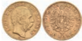
702 10 Mark, 1875, Albert, ss. J. 261 220,—