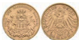
656 20 Mark, 1913, kl. Rf., vz. J. 212 380,—