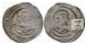
419 Brakteat (0,37g), Landfried, um 1170. Brustbild mit Krummstab nach links. Berger 2559 (Reichenau), Cahn 108a, ss. 50,—