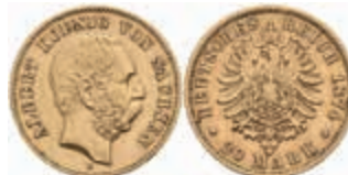
710 20 Mark, 1874, Albert, kl. Rf., ss. J. 262 400,—