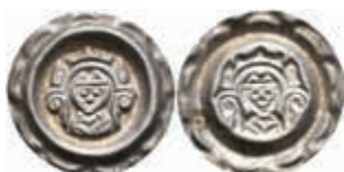
371 Brakteat (0,74g), Hartmann II., 1250-1286. Av: Brustbild des Bischofs zwischen zwei Krummstäben von vorn, darüber Bogen mit Zinnen und zwei Türmchen. Berger 2646, Slg. Bonhoff 1913, vz. 120,—