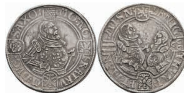
437 Taler, o.J. (1554-1557), Johann Friedrich II., Johann Wilhelm und Johann Friedrich III., Saalfeld, Koppe 265, Dav. 9745, kl. Graffito, ss+. 600,—