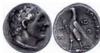
113 Tetrachme (13,82g), Ptolemaios II., 285-246 v. Chr. Av: Kopf nach rechts. Rev: Adler auf Blitz nach links. CPE 675, Svoronos 815, kl. Kratzer, ss. 300,—