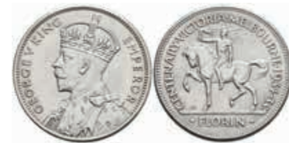
811 Florin, 1935, George V., Victoria-Melbourne, KM 33, Avers leicht berieben, vz-st. 150,—