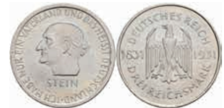
778 3 Reichsmark, 1931, Stein, kl. Rf., vz. J. 348 50,—

Goldmünzen ab 1800 sowie Goldbarren sind als Anlagegold ggf. umsatzsteuerfrei (auch für das Aufgeld), soweit der Zuschlagpreis inkl. Aufgeld und Losgebühr nicht höher als der Goldwert + 80% ist.