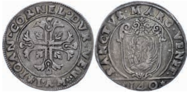
927 Venedig, Scudo, o.J. (1624-1629), Giovanni I. Corner, IAM, Dav. 4244, schöne Patina, ss. 250,—