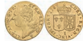
876 Louis d'or à la tête nue, 1787, Louis XVI., Limoges, Fb. 475, Gadoury 361, justiert, vz. 450,—