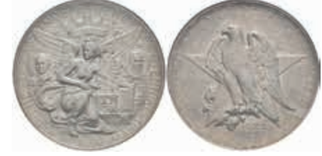
1198 1/2 Dollar, 1938, Texas, KM 167, NGC MS65. 180,—