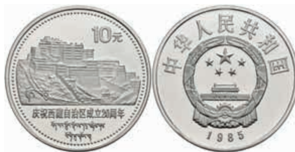
856 10 Yuan, Silber, 1985, 20 Jahre Autonome Region Tibet, KM 127, in Kapsel, minimal angelaufen, PP. 500,—

Bitte geben Sie realistische Gebote ab! Gebote deutlich unter Metallwert sind praktisch chancenlos und für alle Seiten Zeitverschwendung!