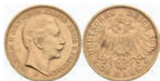
689 20 Mark, 1905, J, Wilhelm II., kl. Rf. und Kratzer, vz. J. 252 380,—