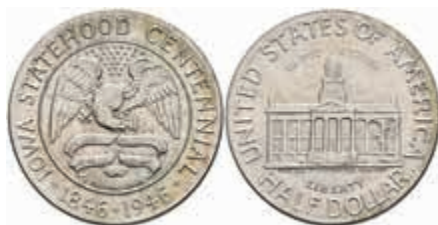
1206 1/2 Dollar, 1946, Iowa, KM 197, f. st. 80,—