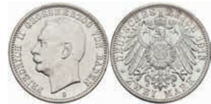
511 2 Mark, 1913, Friedrich II., kl. Rf., Avers vz, Revers vz-st. J. 38 250,—