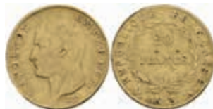
882 20 Francs, Gold, AN 13 (1804/05), Napoleon, Paris, Fb. 487a, kl. Rf., etwas wellig, s-ss 250,—