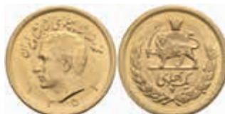
920 1 Pahlavi, Gold, 1973 (SH 1352), Mohammed Reza Pahlavi, Fb. 101, vz-st. 350,—