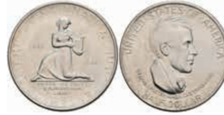
1140 1/2 Dollar, 1936, Cincinnati Music Center, KM 176, vz. 130,—