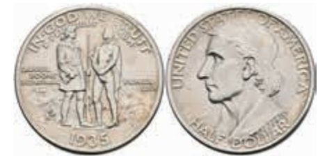
1128 1/2 Dollar, 1935, S, Boone, KM 165.1, kl. Rf., vz. 70,—