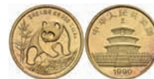
858 25 Yuan, Gold, 1990, Panda, st. 350,—