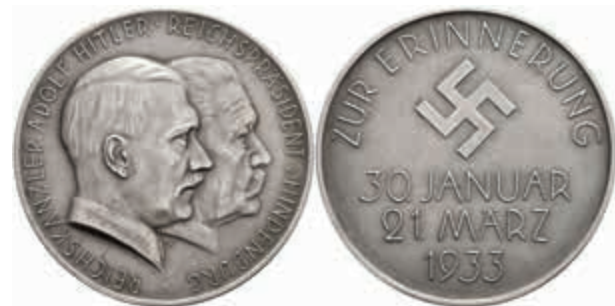
1415 Silbermedaille (Dm. ca. 45,20mm, ca. 29,97g), 1933, F.W. Hörnlein, auf die Machtergreifung durch Adolf Hitler. Av: Brustbilder Hitlers und Hin-