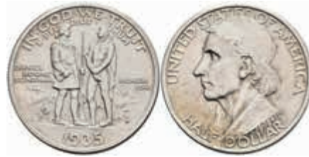
1122 1/2 Dollar, 1935, D, Boone, KM 165.1, wz. Kr., vz-st. 80,—