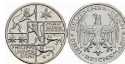
763 3 Reichsmark, 1927, Universität Marburg, feine Haarlinien, PP, J. 330. 250,—