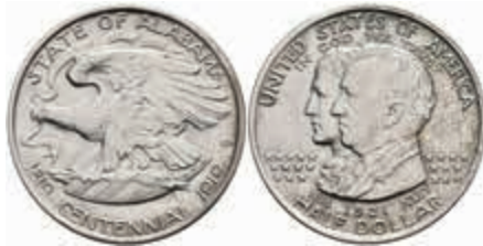
1085 1/2 Dollar, 1921, Alabama, KM 148.2, wz. Rf., Avers f. st, Revers vz. 80,—