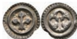
422 Brakteat (0,43g), 1295-1335. Dicker Lindenweig mit drei Blättern und zwölf Blüten in den Winkeln. Berger 2528, Randschlag, ss. 30,—