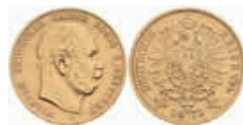
672 10 Mark, 1873, C, Wilhelm I., kl. Rf., ss. J. 242 200,—