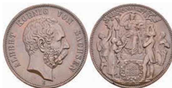
553 Kupfer-Gedenkmünze in 5 Mark Größe, 1889, Albert, zur 800-Jahrfeier des Hauses Wettin, Kratzer, Randfehler, Hsp., ss. J. 123a 100,—