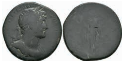
170 Hadrianus, 117-138 n. Chr., Bronze Sesterz (25,64g), 121-123 n. Chr., Rom. Av: HADRIANVS AVG COS III P P, belorbeerte Büste n. r. Rev: Spes n. links gehend, Blume haltend und Gewand hebend. RIC II 679, dunkle Patina, s-ss. 50,—