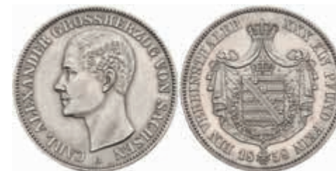
498 Taler, 1858, Carl Alexander, AKS 33, J. 535, zaponiert, kl. Kratzer und Rf., vz. 100,—