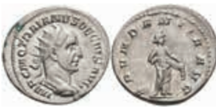
215 Trajanus Decius, 249-251, Antoninian (3,92g), Rom. Av: Büste nach rechts, darum Umschrift. Rev: Stehende Abundantia schüttet Füllhorn aus, darum "ABVNDANTIA AVG". RIC 10b, vz. 50,—