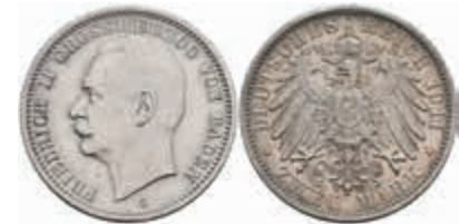
510 2 Mark, 1911, Friedrich II., kl. Rf., ss+. J. 38 150,—