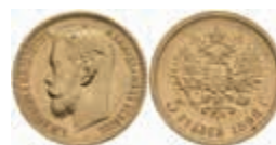
987 5 Rubel, Gold, 1898, Nikolaus II., St. Petersburg, Fb. 180, kl. Rf., vz. 200,—