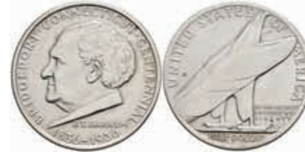
1139 1/2 Dollar, 1936, Bridgeport, KM 175, vz-st. 100,—