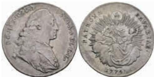
408 1/2 Taler, 1774, Maximilian III. Joseph, Hahn 305, ss+. 90,—