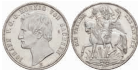
495 Taler, 1871, Johann, auf den Sieg über Frankreich, AKS 159, J. 132, zaponiert, wz. Kr., f. st. 100,—