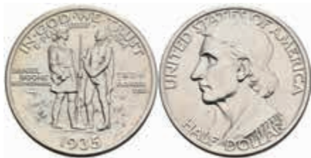
1129 1/2 Dollar, 1935, S, Boone, KM 165.2, wz. Kr., vz-st. 130,—