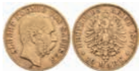
703 10 Mark, 1877, Albert, kl. Rf., ss. J. 261 250,—