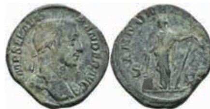
188 Severus Alexander, 222-235, Sesterz (17,49g), dat. 231 n. Chr., Rom. Av: IMP SEV ALEXANDER AVGV Büste des Severus Alexander mit Lorbeerkrantz n.r. Rev: ANNONA AVGVSTI im Feld S C, bekleidete Annona stehend, nach links gewandt, mit rechter Hand Kornähren über Modius haltend, in linker Hand Anker. RIC549b, hellgrüne Patina, ss+. 80,—