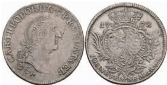
418 Taler, 1772, Karl Theodor, Dav. 2369, Noss 979, min. justiert, kl. Schrötlingsfehler, ss. 200,—