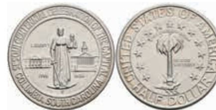
1161 1/2 Dollar, 1936, S, Columbia, KM 178, f. st. 150,—