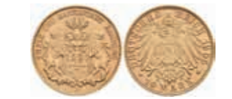
647 10 Mark, 1905, kl. Rf., ss. J. 211 200,—