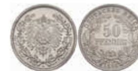
500 50 Pfennig, 1896, f. st. J. 15 250,—

Goldmünzen ab 1800 sowie Goldbarren sind als Anlagegold ggf. umsatzsteuerfrei (auch für das Aufgeld), soweit der Zuschlagpreis inkl. Aufgeld und Losgebühr nicht höher als der Goldwert + 80% ist.