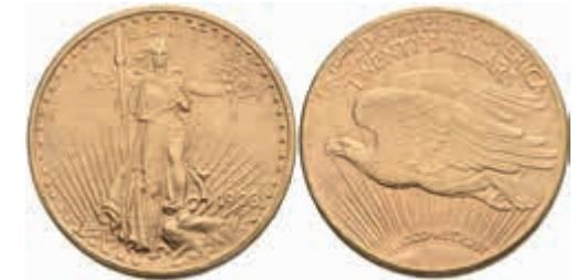
1076 20 Dollars, Gold, 1908, Philadelphia, Fb. 183, kl. Rf., vz. 1500,—