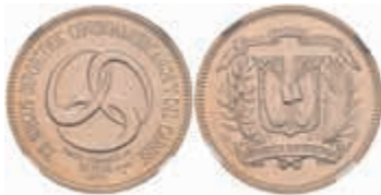
867 30 Pesos, Gold, 1974, Mittelamerikanische Spiele, KM 36, NGC - MS 68 600,—