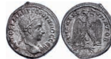
250 Syrien, Antiochia, Tetradrachme (12,80g), 238-244, Gordianus III. Av: Büste nach rechts, darum Umschrift. Stehender Adler mit ausgebreiteten Schwingen von vorn, darunter Mondsichel und Widder, darum Umschrift. Prieur 271, ss. 130,—