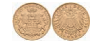
648 10 Mark, 1906, vz. J. 211 280,—