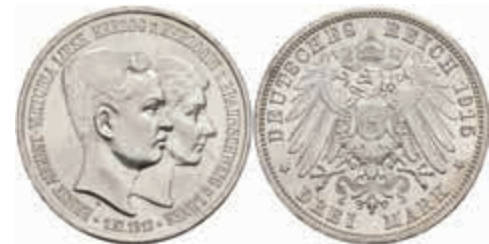
520 3 Mark, 1915, Ernst August, zum Regierungsantritt, kl. Rf., Kratzer, Zaplack, vz-st. J. 57 70,—