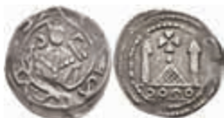
359 Österreich, Pfennig (0,98g), o.J.(1170-1200), Freisacher Pfennig vom Eriacnsis-Typ. Av: Brustbild des Bischofs mit Krummstab und Buch von vorn. Rev: Kirchenfassade. Ss. 30,—