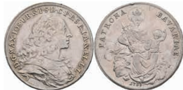
402 Taler, 1753, Maximilian III. Joseph, Madonna ohne Strahlenkranz, Hahn 306.1, Dav. 1952 var., Bohrstelle am Rand, Berieben/Kratzer, ss. 350,—