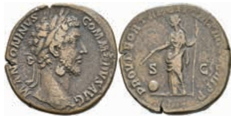
184 Commodus, 181-182, Sesterz (25,67g), Rom. Av: Kopf nach rechts, darum "M ANTONINVS COMMODVS AVGV". Rev: Stehende Providentia mit Stab über Globus und Zepter nach links, darum "PROV DEOR TR P VII IMP IIII COS III P P". RIC 330b, Fassungs Spuren, ss. 50,—