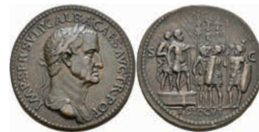
1291 Italien, Padua, Bronzemedaille (Dm. ca. 35,30mm, ca. 31,69g), 1500-1570, von G. Cavino. Av: Büste Galbas nach rechts, darum Umschrift. Rev: Stehender Galba auf Plattform, befehligt eine Gruppe von Soldaten. Klawans 3/4, ss. Mit Unterlegzettel des Sammlers. 150,—