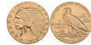
1077 5 Dollars, Gold, 1909, Denver, Indian Head, Fb. 151, vz. 400,—