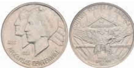
1203 1/2 Dollar, 1939, S, Arkansas, KM 168, NGC MS64. 200,—