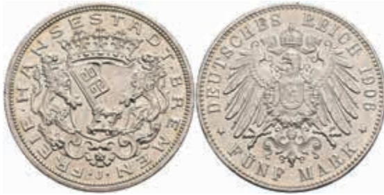
523 5 Mark, 1906, kl. Rf., vz. J. 60 200,—