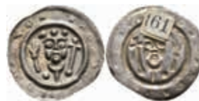
421 Brakteat (0,42g), um 1230. Brustbild der heiligen Hildegard mit Lilien- und Kreuzstab von vorn. Berger 2512, vz. 80,—