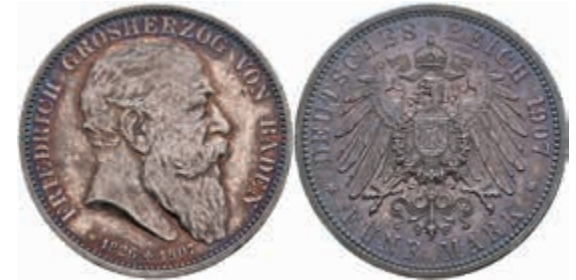
509 5 Mark, 1907, Friedrich I., auf seinen Tod, wz. Rf., schöne Patina, vz-st. J. 37 170,—