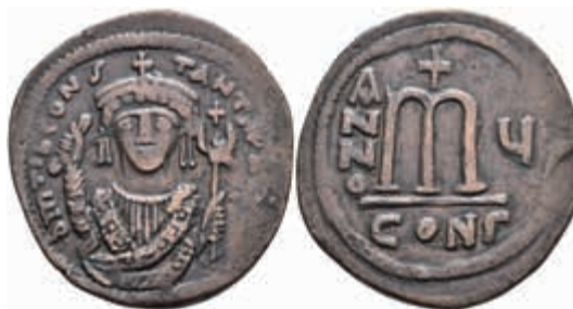
259 Tiberius II. Constantinus, 578-582, Follis (16,11g), Jahr 578/579. Av: Brustbild von vorn, darum Umschrift. Rev: Wertzeichen, darüber ein Kreuz. Sear 430, braune Patina, ss. Mit Unterlegzettel des Sammlers. 50,—