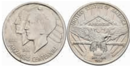
1135 1/2 Dollar, 1936, Arkansas, KM 168, f. st. 80,—