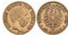
707 10 Mark, 1881, Albert, ss. J. 261 220,—