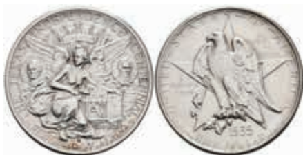
1131 1/2 Dollar, 1935, S, Texas, KM 167, vz-st. 100,—