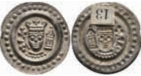
442 Brakteat (0,43g), Friedrich II., 1215-1250. Königskopf zwischen Blütenzweigen und Turm von vorn. Berger 2598, Cahn 186, kl. Randfehler, vz. 100,—