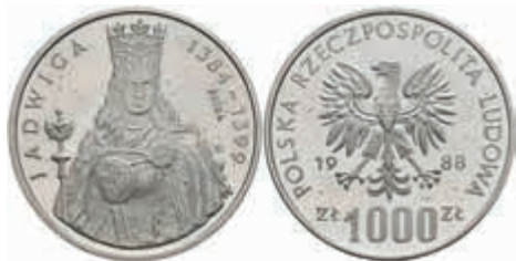
980 Polen, 1000 Zlotych 1988, Silber Probe, Königin Hedwig von Anjou, Auflage 2.500 St., Parchimowicz 495a, vz aus PP. 130,—