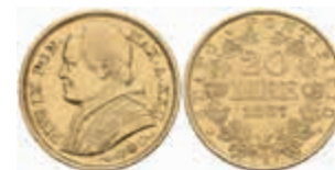
1230 20 Lire, Gold, 1867, Pius IX., Rom, Fb. 280, kl. Rf., ss-vz. 350,—