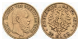
739 20 Mark, 1874, Karl, ss. J. 293 380,—