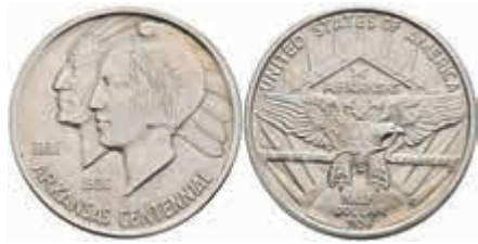
1143 1/2 Dollar, 1936, D, Arkansas, KM 168, Avers vz, Revers vz-st. 80,—