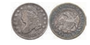
1051 10 Cents, 1827, KM 42, ss. 30,—