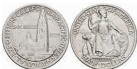
1130 1/2 Dollar, 1935, S, California-Expo, KM 171, vz. 50,—