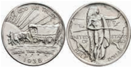
1192 1/2 Dollar, 1938, Oregon Trail, KM 159, f. st. 100,—