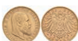
743 10 Mark, 1896, Wilhelm II., kl. Rf., ss. J. 295 220,—