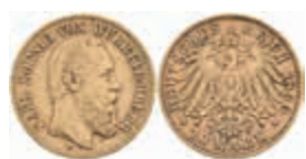
741 10 Mark, 1890, Karl, kl. Rf., ss. J. 294 350,—