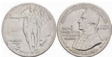
1105 1/2 Dollar, 1928, Hawaiian Sesquicentennial, KM 163, wz. Kr., vz. 1000,—