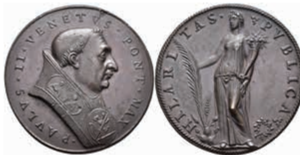
1310 Kirchenstaat, Paul II., Bronzemedaille (Dm. ca. 43,3 mm, ca. 43,8 g), o.J., unsigniert, Hilaritas Publica. Av: Büste nach rechts. Rev: Stehende weibliche Gestalt von vorn mit Füllhorn und Palmzweig. Spink 380, Schröttingsfehler, vz-st. (Abbildung auf 94% verkleinert) 200,—