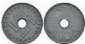
782 Besetzte Gebiete im 2. Weltkrieg, Ausgaben der Reichskreditkassen, 10 Reichspfennig, 1940, A, wz. Rf., vz. J. N619. 30,—