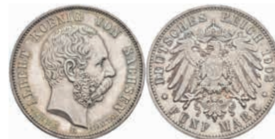
555 5 Mark, 1902, Albert, auf seinen Tod, vz+. J. 128 100,—