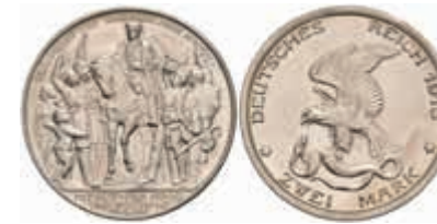
546 2 Mark, 1913, Wilhelm II., Jahrhundertfeier der Befreiungskriege, wz. Kratzer, zaponiert, PP. J. 109 30,—

Alle Einzellose und Zertifikate/Gutachten sind unter www.rhenumis.de farbig abgebildet!