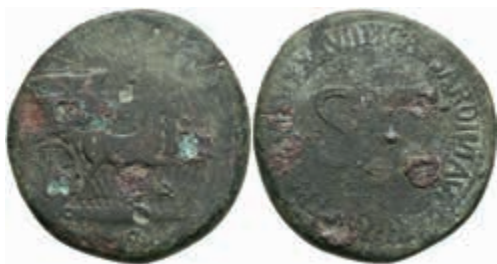
146 Tiberius, 35-34 n. Chr., Bronze (25,43g), Rom. Av: Quadriga n. r. beschnückt mit Trophäen und Gefangenen. Rev: TI CAESAR DIVI AVG F AVGVST PM TR POT XXXVII, mittig S C. RIC I 60, ss 100,—