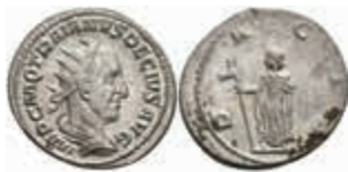
214 Trajanus Decius, 249-251, Antoninian (3,91g), Rom. Av: Büste nach rechts, darum Umschrift. Rev: Stehende Dacia nach links, darum "DACIA". RIC 12b, etw. Belag, ss-vz. 80,—