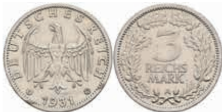
779 3 Reichsmark, 1931, A, kl. Rf., f. vz. J. 349 100,—