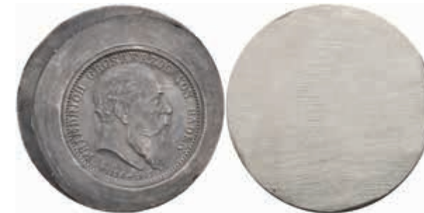
1243 Baden, Friedrich I., Abschlag des Aversstempels des 2 Mark Stücks, 1907, auf den Tod des Großherzogs, J. 36, auf Eisen/Stahl (magnetisch). 35,48g. 80,—