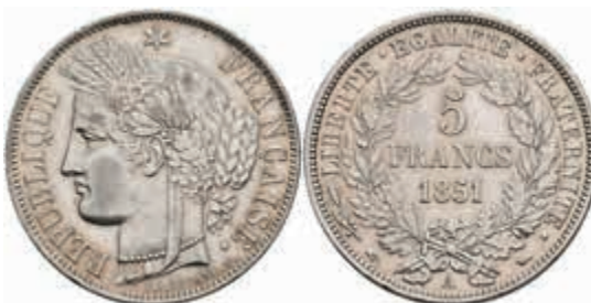
903 5 Francs, 1851, Paris, Dav. 93, kl. Rf., vz. 80,—