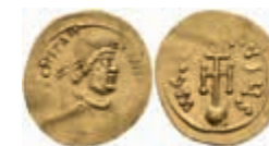
266 Constans II., 641-668, Semissis (2,17g), Konstantinopel. Av: Büste nach rechts, darum Umschrift. Rev: Kreuz auf Globus, darum Umschrift. Sear 984, Prägeschwäche, ss. 150,—