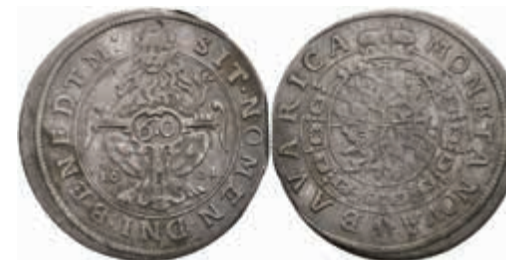
393 Kipper 60 Kreuzer (Gulden), 1621, Maximilian I., Hahn 75, kl. Zainende, ss. Selten! 400,—