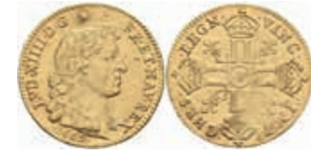
872 Louis d'or à la tête nue, 1669, Louis XIV., Paris, Gadoury 247, vz. 1400,—