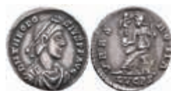
231 Theodosius I., 388-392, Siliqua (2,07g), Lugdunum. Av: Büste nach rechts, darum Umschrift. Rev: Sitzende Roma nach links, darum "VRBS ROMA - LVGPS". RIC 43, ss. 400,—