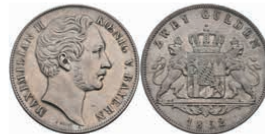
458 Doppelgulden, 1852, Maximilian II., AKS 150, J. 83, kl. Rf., vz. 100,—

Goldmünzen ab 1800 sowie Goldbarren sind als Anlagegold ggf. umsatzsteuerfrei (auch für das Aufgeld), soweit der Zuschlagpreis inkl. Aufgeld und Losgebühr nicht höher als der Goldwert + 80% ist.