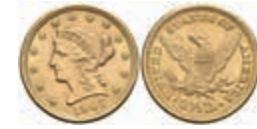
1075 2 1/2 Dollars, Gold, 1907, Philadelphia, Coronet Head, Fb. 114, kl. Rf., vz+. 250,—