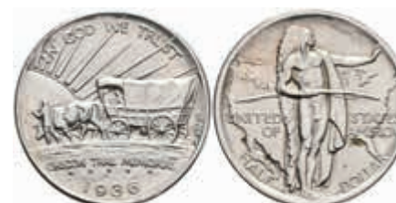
1162 1/2 Dollar, 1936, S, Oregon Trail, KM 159, f. st. 130,—