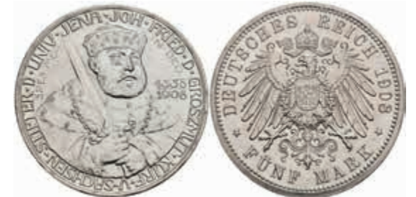
578 5 Mark, 1908, Wilhelm Ernst zur 350-Jahrfeier der Universität Jena, kl. Kratzer, f. st. J. 161. 150,—