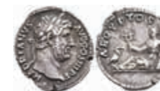
179 Hadrianus, 134-138, Denar (3,27g), Rom. Av: Büste mit Lorbeerkrone nach rechts, darum Umschrift. Rev: Liegende Aegyptos mit Sistrum nach links, davor Ibis, darum "AEGYPTOS". RIC 297, ss. 150,—