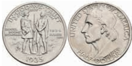
1118 1/2 Dollar, 1935, Boone, KM 165.2, wz. Rf., f. st. 100,—