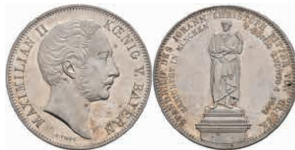
455 Geschichtsdoppeltaler, 1848, Maximilian II., Standbild von Johann Christoph Ritter von Gluck, AKS 164, J. 87, kl. Kratzer und wz. Rf., vz-st. 1000,—