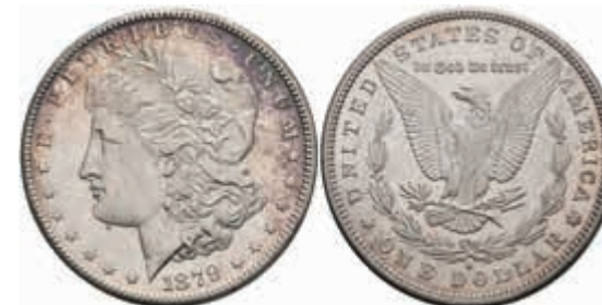
1061 Dollar, 1879, San Francisco, KM 110, kl. Rf., f. st. 30,—