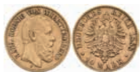
737 10 Mark, 1888, Karl, ss. J. 292 250,—