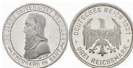
760 3 Reichsmark, 1927, Tübingen, wz. Kratzer, PP. J. 328 250,—