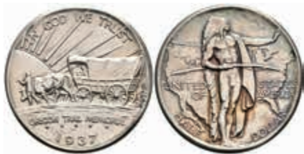
1177 1/2 Dollar, 1937, D, Oregon Trail, KM 159, Patina, f. st. 130,—