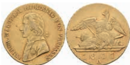
471 Doppelter Friedrichs d'or, 1811, A, Friedrich Wilhelm III., AKS 1, J. 105, ss. 1800,—