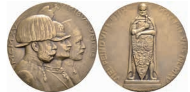
1388 Bronzemedaille (Dm. ca. 40 mm, ca. 26,9 g), 1915, von Weinberger, auf das Waffenbündnis der Mittelmächte. Av: Brustbilder Wilhelm II., Franz Josefs und Mohammed V. gestaffelt nach rechts. Rev: Stehender Ritter von vorn auf Podest mit Schild mit den Wappen der Verbündeten. Kl. Kr., vz-st. 50,—