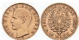
618 10 Mark, 1888, Otto, ss. J. 198 300,—