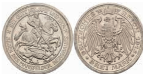
550 3 Mark, 1915, Mansfeld, zaponiert, PP. J. 115 500,—