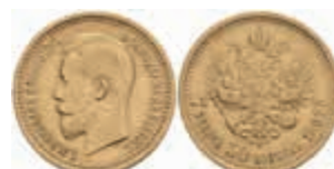
986 7 1/2 Rubel, Gold, 1897, Nikolaus II., Fb. 178, kl. Rf., ss. 650,—