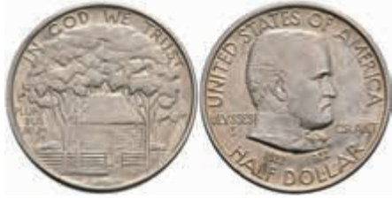
1092 1/2 Dollar, 1922, Grant, KM 151.2, Variante mit Stern, ss-vz. 350,—