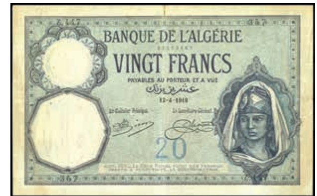
1659 Algerien, 20 Francs 12.4.1919, Frühe Ausgabe. P-78a, Einrisse, Stiche, Erh. IV. (Abbildung auf 50% verkleinert) 80,—