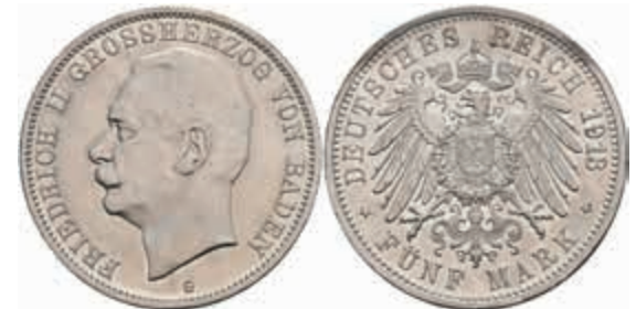
512 5 Mark, 1913, Friedrich II., kl. Rf. und Kratzer, vz. J. 40 50,—