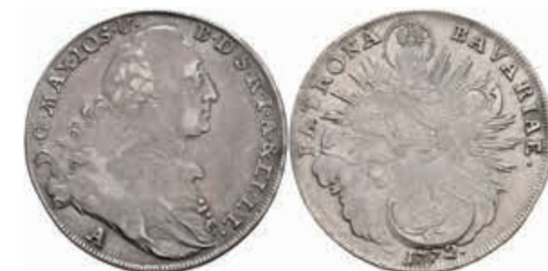
406 Taler, 1772, Maximilian III. Joseph, Hahn 330, justiert, ss-vz. 80,—