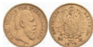
729 20 Mark, 1873, Karl, ss. J. 290 380,—