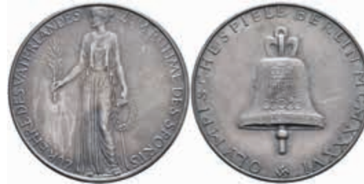
1417 Silbermedaille (Dm. ca. 36,80mm, ca. 22,20g), 1936, K. Roth, auf die XI. Olympischen Sommerspiele in Berlin. Av: Stehende Siegesgöttin mit Öl-zweig und Lorbeerkrantz, darum Umschrift. Rev: Olympiaglocke, darum Umschrift. Rand punziert, wz. Rf., Kratzer, vz-st. 30,—

denburgs nebeneinander nach rechts, darum Umschrift. Rev: Hakenkreuz, darunter 3 Zeilen Schrift, darüber "ZUR ERINNERUNG". Rand punziert, vz. (Abbildung auf 92% verkleinert) 500,—