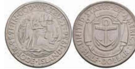
1164 1/2 Dollar, 1936, S, Rhode Island, KM 185, vz-st. 80,—