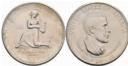
1160 1/2 Dollar, 1936, S, Cincinnati Music Center, KM 176, vz. 130,—