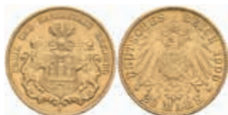
655 20 Mark, 1910, vz. J. 212 380,—