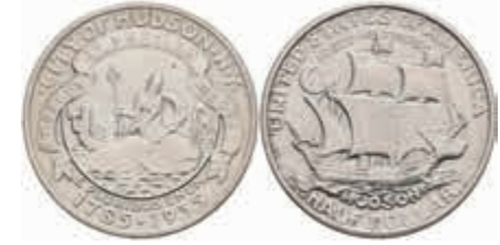
1125 1/2 Dollar, 1935, Hudson N.Y., KM 170, minimal berieben, vz. 300,—