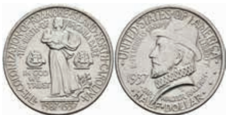
1179 1/2 Dollar, 1937, Roanoke Island, KM 186, f. st. 120,—