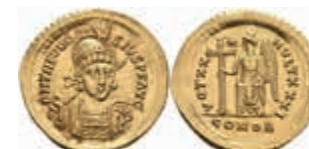
235 Theodosius II., 423-424, Solidus (4,44g), Constantinopel. Av: Büste mit Schild und Speer von vorn, darum "DN THEODO-SIVS PF AVG". Rev: Stehende Victoria mit Kreuzstab nach links, daneben Stern, darum "VOT XX - MVLT XXXI". RIC 225, ss. 700,—