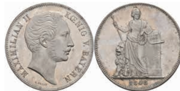
456 Geschichtsdoppeltaler, 1848, Maximilian II., Verfassung, AKS 163, J. 86, kl. Kratzer und wz. Rf., kl. Justierspur, vz-st. 700,—