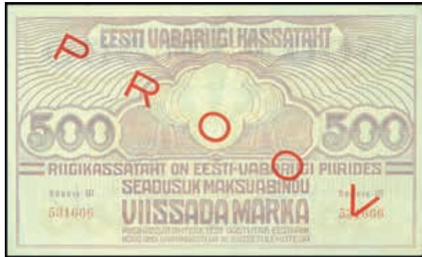
1649 Estland, Eesti Kassatäht, 500 Marka, o. D. (1920-21), Probe mit rotem Überdruck RROOV beidseitig, P 49s, Erh. II. (Abbildung auf 48% verkleinert) 75,—