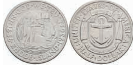
1148 1/2 Dollar, 1936, D, Rhode Island, KM 185, wz. Rf., vz. 50,—