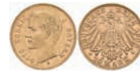
627 10 Mark, 1903, Otto, ss+. J. 201 220,—