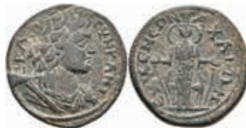
246 Phrygien, Eumaneia, Æ(8,34g), ca. 2. Jh. Av: Senatsbüste nach rechts. Rev: Kultbild der Artemis von vorn. SNG von Aulock 3586, ss. Aus einer rheinischen Privatsammlung. Erworben in den 1980/90er Jahren im rheinischen Münzhandel. 100,—