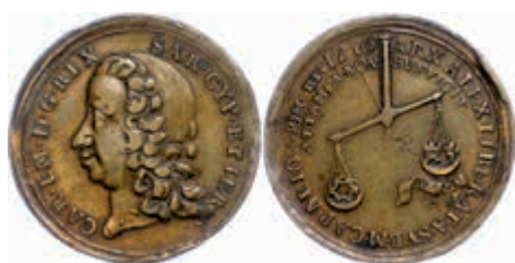
1308 Italien, Sardinien, Karl Emanuele III., Bronzemedaille (Dm. ca. 33mm, ca. 9,92g), 1746, satirische Medaille auf die Wiedereroberung von Alexandria. Av: Kopf nach links, darum Umschrift. Rev: Schiefe Balkenwaage, darum Umschrift. Wurzbach 4497, ss. Selten! 180,—