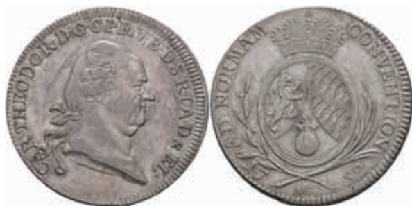
410 Taler, 1782, Karl Theodor, Mannheim, Hahn 393, ss-vz. 250,—