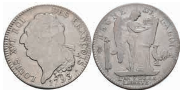
879 Ecu de 6 Livres, 1793, Louis XVI., Paris, Gadoury 55, s-ss. 100,—