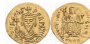
264 Phocas, 602-610, Solidus (4,45g), Konstantinopel. Av: Brustbild mit Kreuzglobus von vorn, darum Umschrift. Rev: Stehende Viktoria mit Kreuzglobus von vorn, darum Umschrift. Sear 620, ss+. 400,—