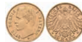
630 10 Mark, 1906, Otto, ss-vz. J. 201 240,—