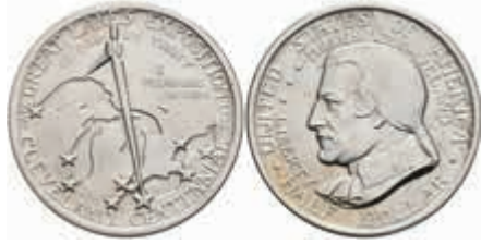
1141 1/2 Dollar, 1936, Cleveland, KM 177, vz-st. 70,—