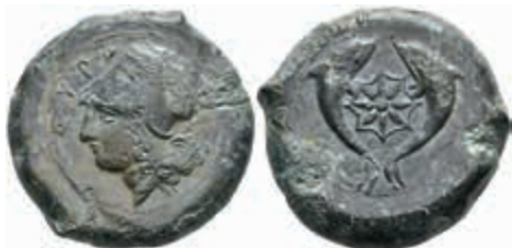
14 Syrakus, Æ-Drachme (32,53g), Anfang 4. Jh. v. Chr. Av: Athenakopf mit korinthischem Helm nach links. Rev: Seestern zwischen zwei Delphinen. SNG ANS 454-469, vz. 230,—