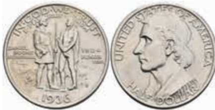
1159 1/2 Dollar, 1936, S, Boone, KM 165.2, wz. Rf., vz-st. 100,—