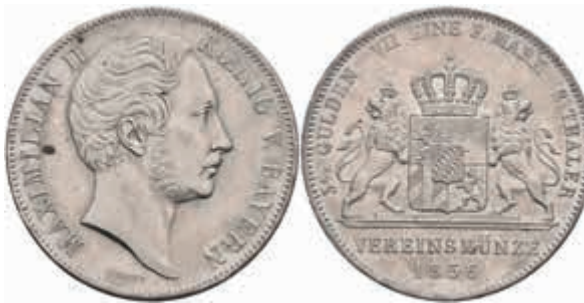
462 Doppeltaler, 1856, Maximilian II., AKS 146, J. 85, f. vz. 250,—