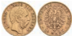
704 10 Mark, 1878, Albert, ss. J. 261 220,—