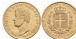
933 Sardinien, 20 Lire, Gold, 1849, Carlo Alberto, Anker, Fb. 1143, kl. Rf., ss. 280,—