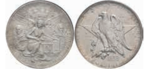
1197 1/2 Dollar, 1938, S, Texas, KM 167, NGC MS66. 200,—