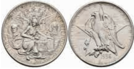
1165 1/2 Dollar, 1936, S, Texas, KM 167, vz. 80,—