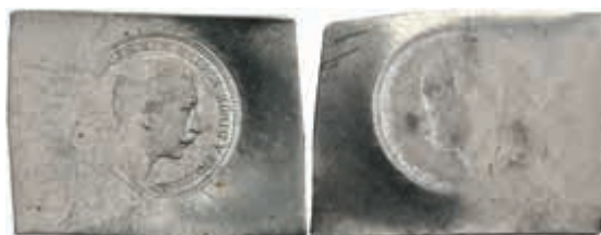
1240 Preußen, Wilhelm II., Abschlag eines Aversstempels zu 20 Mark auf Zinnblech. 7,20g, Prägeschwäche. 50,—