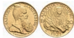
808 20 Franken, 1927, Zogu I., Fb. 6, Avers vz-st, Revers f. st. 700,—