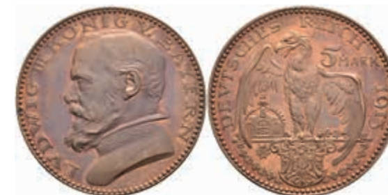
1245 Bayern, 5 Mark, 1913, Probe, Bronze, Ludwig III., von. K. Goetz, Schaaf 53 G1, st. 100,—