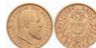
752 20 Mark, 1898, Wilhelm II., kl. Rf., ss+v. J. 296 350,—