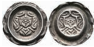
341 Schongau, Brakteat (0,74g), Konradin, 1258-1268. Brustbild des Königs umgeben von Ranken. Berger 2681, vz. 150,—