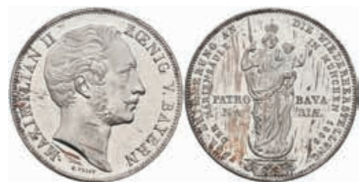
461 Doppelgulden, 1855, Maximilian II., Mariensäule München, AKS 168, J. 84, wz. Kr., f. st. 120,—