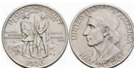
1158 1/2 Dollar, 1936, S, Boone, KM 165.2, f. st. 120,—