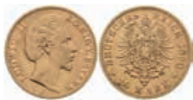
614 10 Mark, 1880, Ludwig II., ss-vz. J. 196 220,—