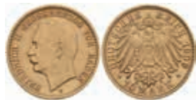
600 10 Mark, 1909, Friedrich II., f. vz. J. 191 500,—