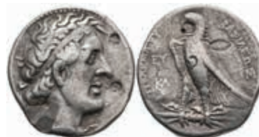
112 Tetrachme (14,12g), Ptolemaios I. Soter, 305-282 v. Chr., unbestimmte Münzstätte auf Zypern. Av: Kopf nach rechts. Rev: Adler auf Blitz nach links. CPE 225, Svoronos 355, Punzen, s-ss. Mit Unterlegzettel / Echtheitsexpertise der Firma I.B. Greiser GmbH, Hannover. 150,—