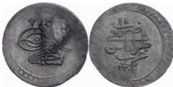
1030 2 Kurush (80 Para), AH 1203/18, Selim III., Tripolis, vgl. KM 66 (Libyen), Uslu/Beyazit/Kara S. 231 (dieses Exemplar), Pere-, Sultan-, Revers justiert, ss. Äußerst selten! Nur wenige Exemplare bekannt. (Abbildung auf 97% verkleinert) 4000,—