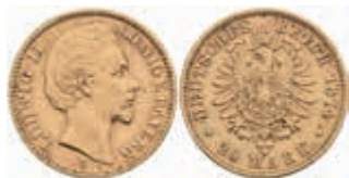
616 20 Mark, 1874, Ludwig II., kl. Rf., ss. J. 197 380,—