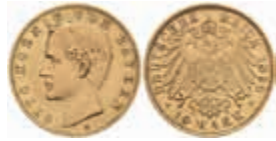
621 10 Mark, 1896, Otto, kl. Kr., ss-vz. J. 199 220,—