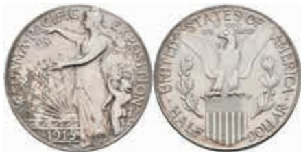
1080 1/2 Dollar, 1915, Panama Pacific Expo, KM 135, wz. Kr., f. st. 300,—