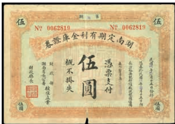
1670 China, Provinz Hunan, 5 Yuan 15.2.1920, P-S2018. Erh. III-IV. (Abbildung auf 48% verkleinert) 150,—