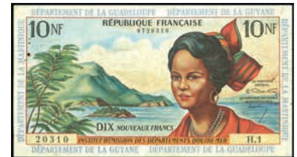
1662 Französische Antillen, 10 Nouveaux Francs o. D. (1964), kl. Rostlöcher P.5a, Erh. III. (Abbildung auf 50% verkleinert) 150,—