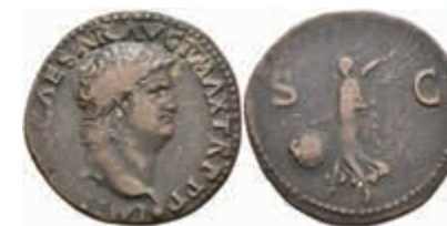
154 Nero, 54-68, As (9,94g), Lugdunum. Av: Büste nach rechts, darum Umschrift. Rev: Victoria mit Schild nach links. RIC 543, ss. 70,—