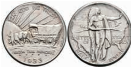
1109 1/2 Dollar, 1933, D, Oregon Trail, KM 159, vz. 120,—