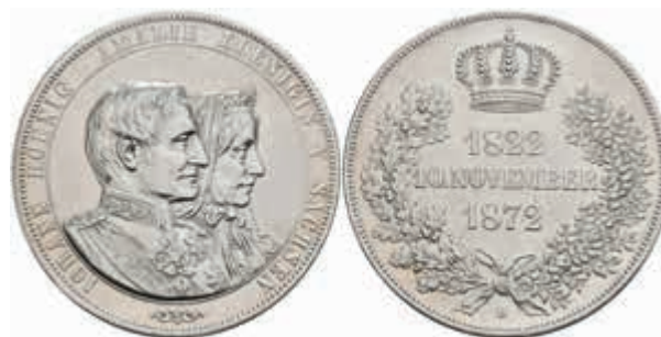
496 Doppeltaler, 1872, Johann, auf die Goldene Hochzeit, AKS 160, J. 133, gereinigt, ss. 120,—