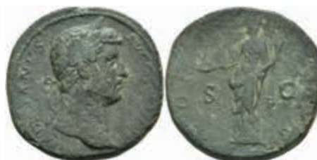
175 Hadrianus, 134-138 n. Chr., Bronze Sesterz (23,41g), dat. 134-138, Rom. Av: HADRIANVS - AVG COS III P P. Büste des Hadrianus nach rechts mit Lorbeerkrone. Rev: FORTVNA AVG; S - C. Fortuna steht nach links, hält Patera und Cornucopiae (Füllhorn), RIC II, 760f; Str II, 670, ss. 80,—