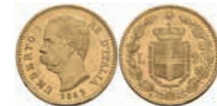
937 20 Lire, Gold, 1882, Umberto I., Fb. 21, kl. Rf., vz. 250,—