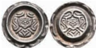
342 Schongau, Brakteat (0,74g), Konradin, 1258-1268. Brustbild des Königs umgeben von Ranken. Berger 2681, vz. 150,—