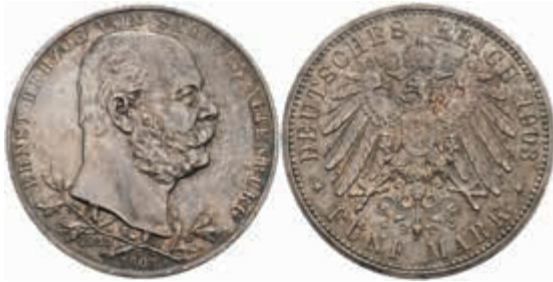
569 5 Mark, 1903, Ernst I., zum 50jährigen Regierungsjubiläum, kl. Rf., ss. J. 144 180,—