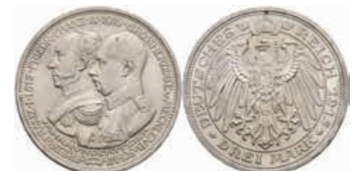
534 3 Mark, 1915, Friedrich Franz IV. zur 100-Jahrfeier des Großherzogtums, kl. Rf., zaponiert, vz-st. J. 88 100,—