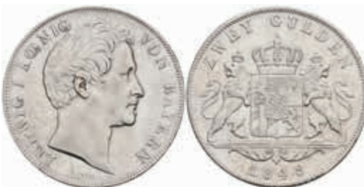
454 Doppelgulden, 1848, Ludwig I., kl. Rf., f. vz. 80,—