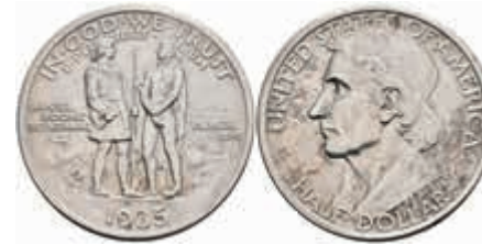
1116 1/2 Dollar, 1935, Boone, KM 165.1, st. 150,—