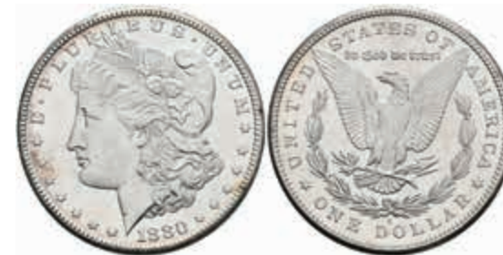
1062 Dollar, 1880, San Francisco, KM 110, wz. Rf., vz-st. 40,—