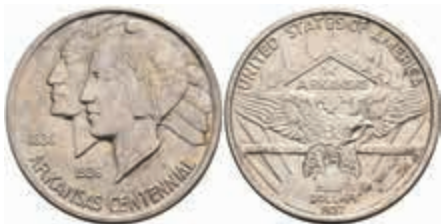
1180 1/2 Dollar, 1937, S, Arkansas, KM 168, vz-st. 80,—