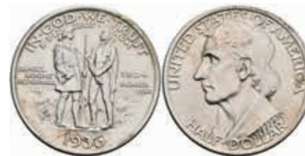
1137 1/2 Dollar, 1936, Boone, KM 165.2, f. st. 100,—