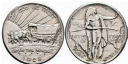
1106 1/2 Dollar, 1928, Oregon Trail, KM 159, wz. Kr., f. st. 120,—