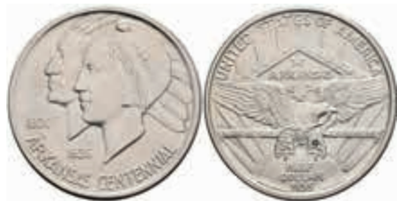
1120 1/2 Dollar, 1935, D, Arkansas, KM 168, kl. Kr., Avers f.st, Revers vz. 80,—