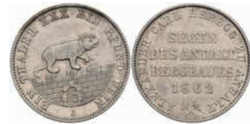
445 Taler, 1862, Alexander Carl, AKS 17, kl. Rf., ss. 70,—