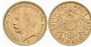
605 20 Mark, 1914, Friedrich II., vz. J. 192 450,—