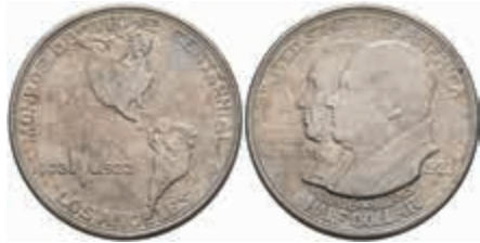
1093 1/2 Dollar, 1923, Monroe Doctrine, KM 153, vz. 30,—