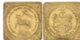
426 Dukatenklippe, o.J. (1700), IMF, Fb. 1886, Kellner 74, Kratzer, wellig, vz. 400,—