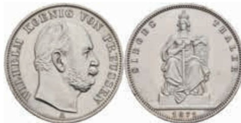
474 Taler, 1871, Wilhelm I., AKS 118, wz. Rf., vz+ 30,—