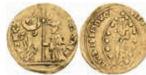
930 Venedig, Zecchino (3,34g), o.J. (1789-1797), Ludowico Manin, Prägeschwäche am Rand, wellig, ss. 250,—