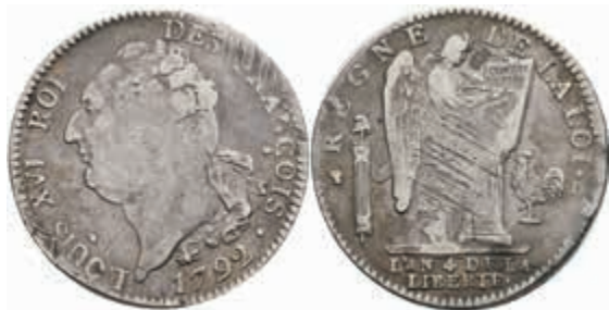
878 Ecu de 6 Livres, 1792, Louis XVI., Lyon, Gadoury 55, justiert, ss. 120,—