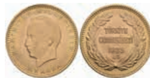
1045 100 Kurush, Gold, 1946, Ismet İnönü, Fb. 101, vz-st. 350,—