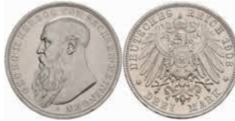
573 3 Mark, 1908, Georg II., PP, J. 152. 200,—