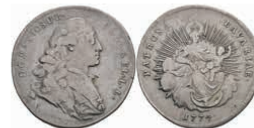
407 1/2 Taler, 1774, Maximilian III. Joseph, Hahn 305, etw. justiert, ss. 70,—

Alle Einzellose und Zertifikate/Gutachten sind unter www.rhenumis.de farbig abgebildet! Dort sind auch 304 weitere Lose zu finden, die nicht im gedruckten Katalog, sondern nur im Internet zu finden sind!