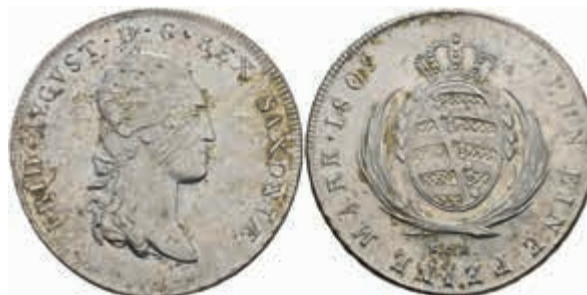
476 Taler, 1809, Friedrich August I., AKS 12b, etw. justiert, vz. 100,—