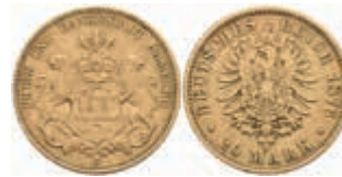
639 20 Mark, 1876, kl. Rf., ss. J. 210. 400,—