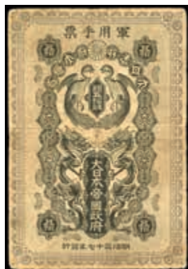
1669 Japan, Russisch-Japanischer Krieg, 50 Sen 1904. Mit Seriennummer auf RS (selten). Rückseitig handschriftlich "Sen 50", P-M3a. Erh. III-IV. (Abbildung auf 50% verkleinert) 150,—