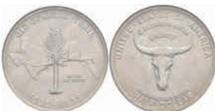
1132 1/2 Dollar, 1935, Spanish Trail, KM 172, NGC MS66. 1000,—