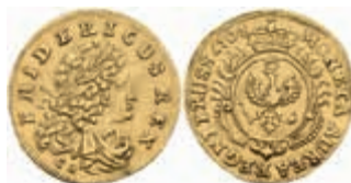
412 Dukat (3,47g), 1707, Friedrich I., Königsberg, Fb. 2309, etwas wellig, ss-vz. Sehr selten! 5000,—