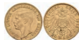
665 20 Mark, 1911, Ernst Ludwig, kl. Rf. und Kratzer, vz. J. 226 550,—