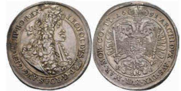
1047 Taler, 1691, Leopold I., Kremnitz, Dav. 3261, Herinek 734, Hsp., ss+. (Abbildung auf 93% verkleinert) 150,—