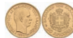
907 20 Drachmen, Gold, 1884, Georg I., Fb. 18, kl. Rf., ss+ 350,—