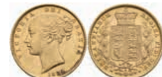
810 Sovereign, 1884, Victoria, Sydney, Fb. 11, vz. 350,—