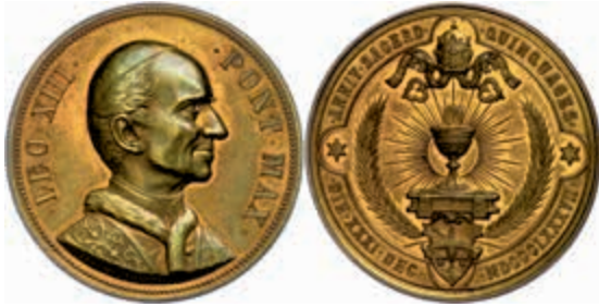
1356 Kirchenstaat, Leo XIII., Bronzemedaille (Dm. ca. 38mm, ca. 25,17g), 1887, von Schiller, auf das 50jährige Amtsjubiläum. Av: Brustbild nach rechts, darum Umschrift. Rev: Tiara mit Schlüsseln, darunter strahlender Kelch mit Oblate, unten Wappen. Vz. 120,—