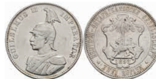
790 DOA, 2 Rupien, 1893, gereinigt, kl. Rf., ss. J. N 714 300,—