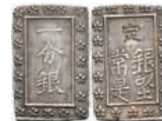
939 Bu (Ichibu), o.J. (1837-1854), mit Gegenstempel, Tempo Ära, KM 16, ss-vz. 50,—