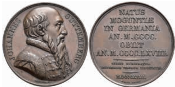
1262 Bronzemedaille (Dm., ca. 40,70mm, ca. 38,35g), 1818, von Gayrard, auf Johannes Gutenberg. Av: Büste nach rechts, darum Umschrift. Rev: 9 Zeilen Schrift. Vz. 70,—