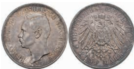
526 5 Mark, 1895, Ernst Ludwig, kl. Rf., ss. J. 73 120,—