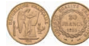
905 20 Francs, Gold, 1895, A, stehender Genius, Fb. 592, kl. Rf., ss-vz. 280,—