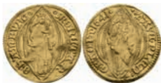
417 Dukat, 1641, Fb. 2000, wellig, ss. 400,—