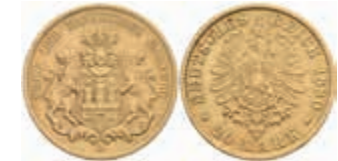
643 20 Mark, 1880, wz. Rf., ss. J. 210 380,—