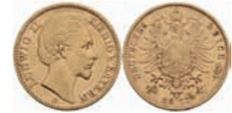
608 20 Mark, 1873, Ludwig II., kl. Rf., ss. J. 194 380,—