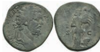
187 Septimius Severus, 194 n. Chr., Bronze Sesterz (22,95g), Rom. Av: L SEPT SEV PE-RT AVGV IMP III. Kopf des Septimius Severus mit Lorbeerkrantz nach r. Rev: [AFRICA]. Africa mit Elefantenhaube in der Vorderansicht, den Kopf nach r. Mit der r. Hand hält sie Kornähren in ihrem Gewand. R. davor ein Löwe. Beiderseits S - C. RIC IV-1 Nr. 668 a, grüne Patina, schönes Porträt, selten, ss+ 150,—