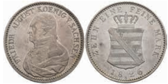
482 Taler, 1826, Friedrich August I., AKS 30, J. 41, ss. 80,—