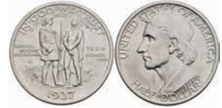
1173 1/2 Dollar, 1937, Boone, KM 165.2, f. st. 100,—