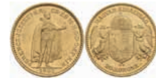
1049 20 Kronen, Gold, 1903, Franz Joseph I., Fb. 250, vz. 300,—