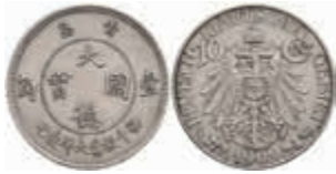
794 Kiautschou, 10 Cent, 1909, vz. J. N 730 250,—