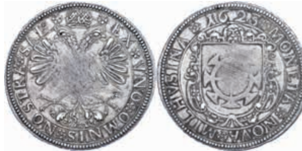
870 Mülhausen, Taler, 1623, Dav. 5588, justiert, vz. 800,—