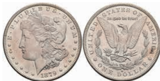
1060 Dollar, 1879, San Francisco, KM 110, kl. Rf., f. st. 50,—