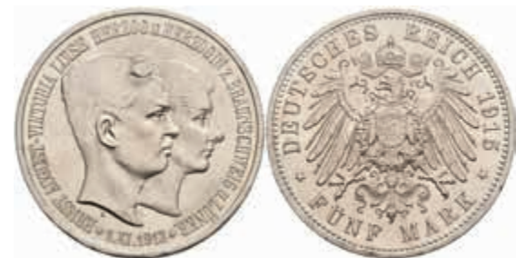
521 5 Mark, 1915, Ernst August, zum Regierungsantritt, kl. Rf., zaponiert, vz-st. J. 58 350,—