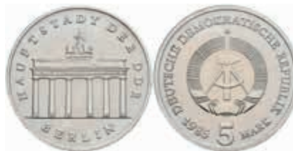
806 5 Mark, 1985, Brandenburger Tor, kl. Kr., f. st. Auflage nur 3.000 Stück. J. 1536. 300,—