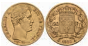
896 20 Francs, Gold, 1830, Karl X., Paris, Fb. 549, kl. Rf., ss. 280,—