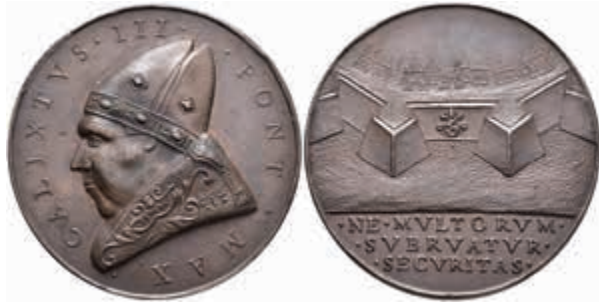
1316 Kirchenstaat, Calixtus III., Bronzemedaille (Dm. ca. 42 mm, ca. 39,6 g), o.J., unsigniert (von Andrea Guazzalotti), auf die Verbesserung der Festungsanlagen. Av: Büste nach links. Rev: Ansicht Stadtmauer, im Abschnitt 3 Zeilen Schrift. Kl. Rf., vz+. 150,—