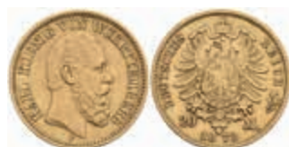
727 20 Mark, 1872, Karl, ss. J. 290 380,—