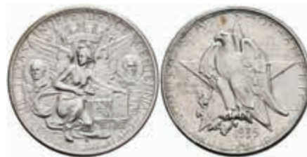
1124 1/2 Dollar, 1935, D, Texas, KM 167, f. st. 120,—