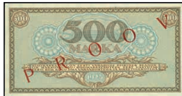
1654 Estland, Eesti Vabariigi, 500 Marka, 1923, Probe, einseitiger Druck mit rotem Überdruck RROOV, P 52 p, Erh. II. (Abbildung auf 47% verkleinert) 250,—