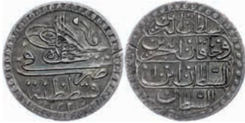
1036 Kurush, AH 1223/1, Mahmud II., Konstantinopel, KM 554, kl. Schrötlingsriss, vz. Sehr selten! 500,—