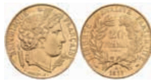
902 20 Francs, Gold, 1851, Ceres, Paris, Fb. 566, wz. Rf., ss-vz. 280,—