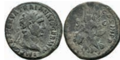
163 Traianus, 98-117, Kupfer As (12,05 g), dat. 100 n. Chr., Rom. Av: IMP CAES NERVA TRAIANVS AVG GERM P M. Büste des Traianus nach rechts mit Lorbeerkrantz und Paludamentresten auf beiden Schultern. Rev: TR POT - COS III P P; S - C. Victoria geht nach links mit Schild, darauf SP / QR. RIC II, 417; Str I, 329, ss+. 50,—