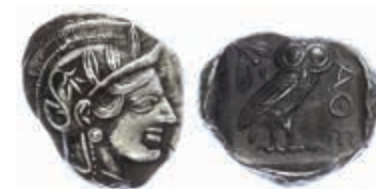
42 Athen, Tetradrachme (17,22g), ca. 403-365 v. Chr., Av: Athenekopf mit attischem Helm nach rechts, Rev: Eule nach rechts, dahinter Ölweig und Mondsichel, davor "AOE". Svoronos Pl. 15, kl. Kratzer auf Avers, z.T. dunkle Patina, vz. 500,—