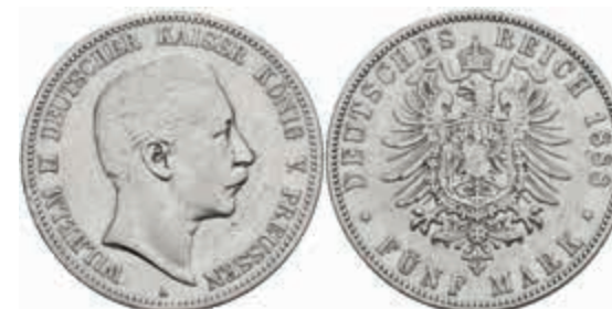
544 5 Mark, 1888, Wilhelm II., kl. Rf., Kratzer, ss. J. 101 150,—