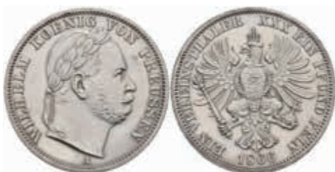
473 Taler, 1866, Wilhelm I., AKS 117, J. 98, leicht berieben, vz+. 50,—