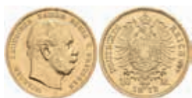
669 10 Mark, 1872, A, Wilhelm I., kl. Rf., vz-st. J. 242 220,—