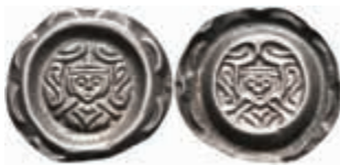
343 Schongau, Brakteat (0,74g), Konradin, 1258-1268. Brustbild des Königs umgeben von Ranken. Berger 2681, vz. 150,—