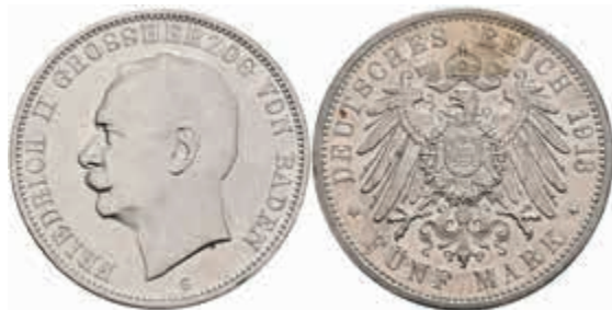
513 5 Mark, 1913, Friedrich II., wz. Rf., vz. J. 40 50,—