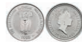
813 25 Dollars, Platin, 1988, Koala, KM 109, st 200,—