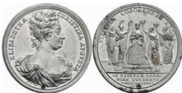
1306 RDR, Karl VI., Zinnmedaille (Dm. ca. 43mm, ca. 23,92g), 1723, von P. P. Werner, auf die Krönung in Prag. Av: Brustbild nach rechts, darum Umschrift. Krönungsszene. Slg. Mont. 1583 (AE), Kupferstift, leicht berieben, kl. Rf., vz. (Abbildung auf 96% verkleinert) 80,—