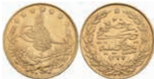
1039 100 Kurush, Gold, AH 1277/9, Abdülaziz, Fb. 127, kl. Rf., ss. 350,—

Alle Einzellose und Zertifikate/Gutachten sind unter www.rhenumis.de farbig abgebildet!