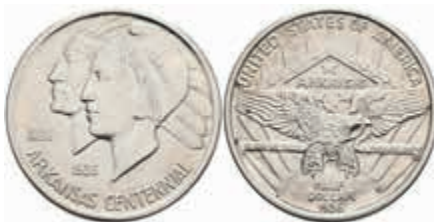
1157 1/2 Dollar, 1936, S, Arkansas, KM 168, f. st. 120,—