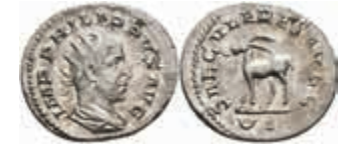
189 Philippus I. Arabs, 244-249, Antoninian (2,44g), Rom. Av: Büste nach rechts, darum Umschrift. Rev: Antiope nach links, darum "SAECVLARES AVGG - UI". RIC 21, vz. 70,—