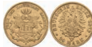
641 20 Mark, 1878, ss. J. 210. 400,—