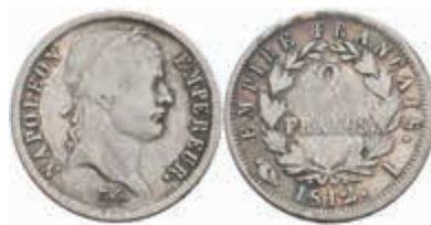
886 2 Francs, 1812, Napoleon I., Limoges, Gadoury 501, kl. Rf., ss. 100,—