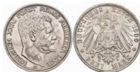
552 3 Mark, 1909, Heinrich XXIV., wz. Rf. und Kratzer, zaponiert, f. st. J. 119 300,—