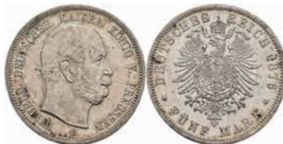
541 5 Mark, 1876, B, Wilhelm I., kl. Rf., kl. Kr., f. vz. J. 97. 50,—