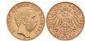
713 10 Mark, 1893, Albert, f. vz. J. 263 300,—