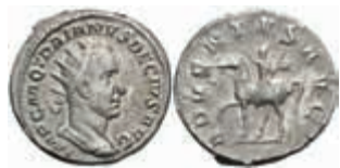
216 Trajanus Decius, 249-251, Antoninian (4,38g), Rom. Av: Büste nach rechts, darum Umschrift. Rev: Der Kaiser zu Pferd nach links, darum "ADVENTVS AVG". RIC 11, ss. 50,—