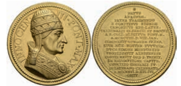
1303 Kirchenstaat, Benedikt VII., vergoldete Bronze- Jesuitenmedaille (Dm. ca. 38 mm, ca. 23,3 g), o.J. (1712), unsigniert bei Lauffer, auf Innozenz III. Av: Brustbild nach rechts. Rev: 17 Zeilen Schrift. Lauffer 178, Förschner 56,179, kl. Rf., vz-st. 100,—

Alle Einzellose und Zertifikate/Gutachten sind unter www.rhenumis.de farbig abgebildet!