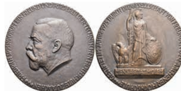
1403 Aachen, Bronzegussmedaille (Dm. ca. 91,4 mm, ca. 279,8 g), 1925, von Bagdons, auf Friedrich Springorum (Freund und Förderer der TH Aachen). Av: Kopf nach links. Rev: Stehende weibliche Gestalt mit Schild und Speer neben Adler auf Sockel mit Spruch. Hsp., vz. (Abbildung auf 45% verkleinert) 50,—

Eichen- Lorbeerzweig, darunter 3 Zeilen Schrift. Kl. Rf., vz-gussfrisch. 50,—