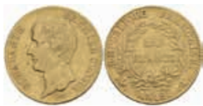
881 20 Francs, Gold, AN 12 (1803/1804), Napoleon, Paris, Fb. 487, kl. Kratzer, ss. 300,—