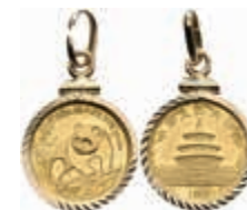
859 5 Yuan, Gold, 1990, Panda, in Goldfassung, vz. 120,—