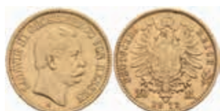
657 20 Mark, 1872, Ludwig III., ss. J. 214 450,—