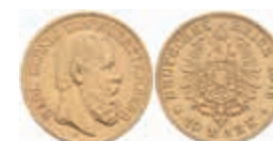
733 10 Mark, 1876, Karl, ss. J. 292 180,—