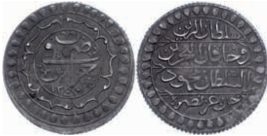
1037 2 Budju, AH 1243, Mahmud II., Jazayir, KM 75 (Algerien), ss. Selten! 110,—