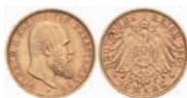
745 10 Mark, 1901, Wilhelm II., f. vz. J. 295 300,—