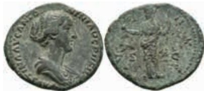
182 Antoninus Pius für Faustina II., Bronze As (9,8g) 145/161, Rom. Av: Drapierte Büste der Faustina n. r. Rev: Umschrift, Venus mit Apfel und Zepter. RIC 1408, C. 253, sehr schönes Porträt, hellgrüne Patina, leicht korrodiert, ss. 200,—