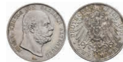
567 2 Mark, 1901, Ernst I., Avers min. berieben, f. vz, J. 142. 300,—