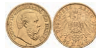
661 20 Mark, 1892, Ludwig IV., kl. Rf. und Kratzer, f. vz. J. 221 2800,—