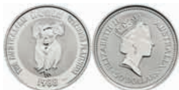
814 50 Dollars, Platin, 1988, Koala, KM 110, st. 400,—