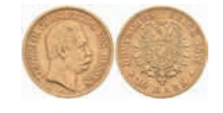
659 10 Mark, 1876, Ludwig III., ss. J. 216 250,—