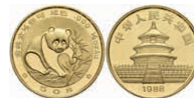
857 50 Yuan, Gold, 1988, Panda, st. 700,—