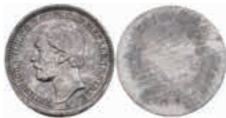
1235 Mecklenburg-Strelitz, Friedrich Wilhelm, Stempelpatrize aus Eisen/Stahl (magnetisch) zu 20 Mark. 14,78g, zaponiert, selten. 100,—