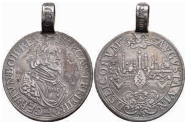
388 Taler, 1641, mit Titel Ferdinand III., Dav. 5039, Forster 286, an altem Henkel, ss. (Abbildung auf 95% verkleinert) 150,—