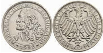
767 3 Reichsmark, 1928, Dürer, vz. J. 332. 180,—