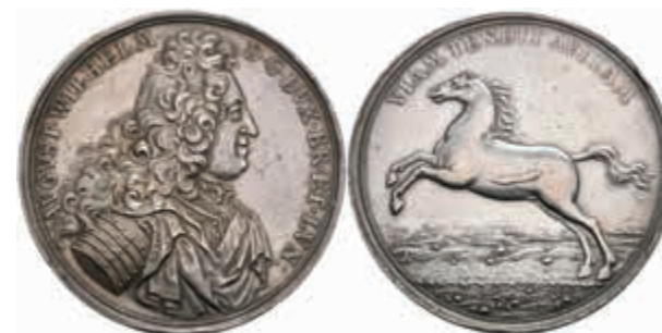
1255 Braunschweig-Wolfenbüttel, August Wilhelm, Silbermedaille (Dm. ca. 58mm, ca. 87,30g), o.J., unsign. Av: Brustbild nach rechts, darum Umschrift. Rev: springendes Ross nach links, darüber "VIAM TENDIT AVITAM". Brockmann 286, Rand- und Stempelfehler, ss. (Abbildung auf 71% verkleinert) 400,—