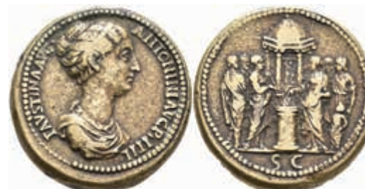
1292 Italien, Padua, Bronzemedaille (Dm. ca. 36,20mm, ca. 37,73g), 1500-1570, von G. Cavino. Av: Büste Faustina I. nach rechts, darum Umschrift. Rev: Opferszene, darum Perikranz. Klawans 2, ss. Mit Unterlegzettel des Sammlers. 150,—