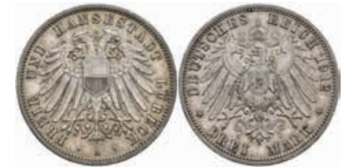
532 3 Mark, 1913, ss-vz. J. 82 70,—