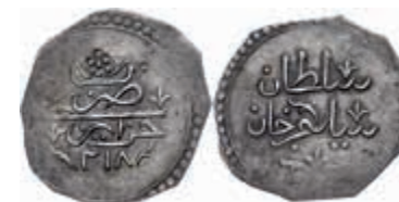
1034 1/2 Budju, AH 1218, Selim III., KM 45 (Algerien), Prägeschwäche am Rand, ss-vz. 110,—