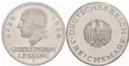
769 3 Reichsmark, 1929, F, Lessing, Kratzer, vz. J. 335 200,—