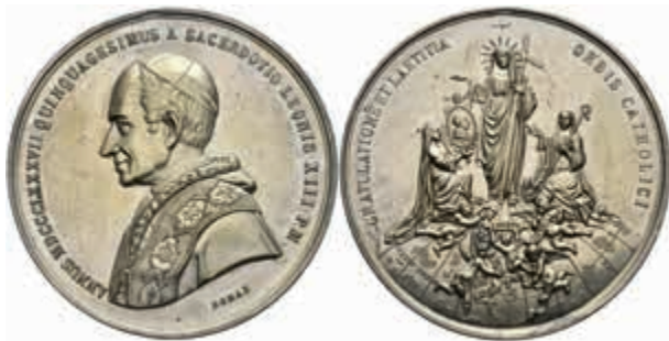
1357 Kirchenstaat, Leo XIII., Zinnmedaille (Dm. ca. 46,7 mm, ca. 45,3 g), 1887, unsigniert, auf sein Priesterjubiläum. Av: Brustbild nach links. Rev: Religio, Putti und weibliche Allegorien auf Globus. Altvergoldet, Hsp., kl. Kr., vz. (Abbildung auf 88% verkleinert) 30,—