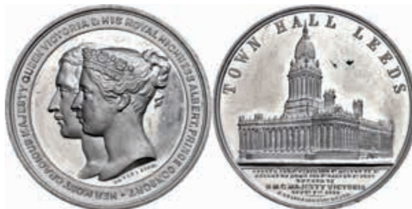
1340 Großbritannien, Zinnmedaille (Dm. ca. 49,10mm, ca. 34,82g), 1858, von J. Davis, auf die Eröffnung der Stadthalle in Leeds. Av: Die Köpfe von Prinz Albert und Königin Victoria nebeneinander nach links, im Außenkranz Umschrift. Rev: Ansicht der Stadthalle, im Abschnitt darunter 6 Zeilen Schrift. Brown 2641 (RRR), kl. Randfehler und Kratzer, vz. (Abbildung auf 85% verkleinert) 200,—

Vergoldet (abgegriffen), Randfehler, ss. (Abbildung auf 81% verkleinert) 70,—