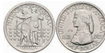
1088 1/2 Dollar, 1921, Missouri, KM 149.2, Variante mit 2*4, kl. Rf., vz-st. 300,—