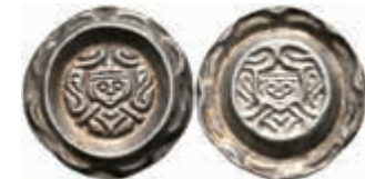
351 Schongau, Brakteat (0,81g), Konradin, 1258-1268. Brustbild des Königs umgeben von Ranken. Berger 2681, vz. 150,—