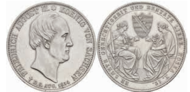
489 Doppeltaler, 1854, Friedrich August II., auf seinen Tod, AKS 116, J. 96, leicht berieben, kl. Rf., zaponiert, vz. 150,—