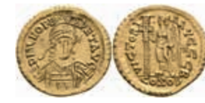
237 Leo I., 457-474, Solidus (4,48g), Constantinopel. Av: Brustbild mit Helm, Schild und Speer von vorn, darum Umschrift. Rev: Victoria mit langem Kreuz nach links stehend, darum "VICTORIA AVGGG". RIC 605, kl. Kratzer, ss. 500,—

Alle Einzellose und Zertifikate/Gutachten sind unter www.rhenumis.de farbig abgebildet!