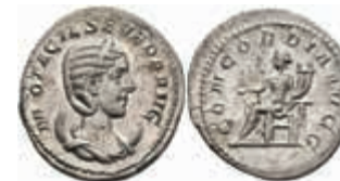
208 Otacilia Severa, 244-249, Antoninian (4,80g), Rom. Av: Büste nach rechts, darum Umschrift. Rev: Sitzende Concordia nach links, darum "CONCORDIA AVGG". RIC 125c, vz+. 80,—