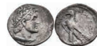
116 Drachme (6,51g), Ptolemaios V. Epiphanes, 3./2. Jh v. Chr., Aradus? Av: Kopf nach rechts. Rev: Adler nach links. Vgl. SNG Cop. 550, s-ss. 50,—