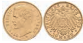
633 10 Mark, 1909, Otto, kl. Rf., ss. J. 201 180,—