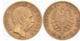
706 10 Mark, 1879, Albert, ss. J. 261 220,—