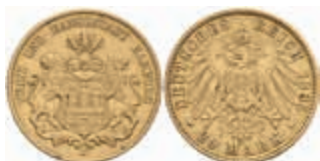
652 20 Mark, 1895, ss. J. 212 380,—