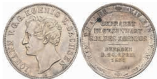
494 Taler, 1855, Johann, auf seinen Besuch bei der Dresdener Münze, AKS 156, J. 99, kl. Rf., ss-vz. 80,—