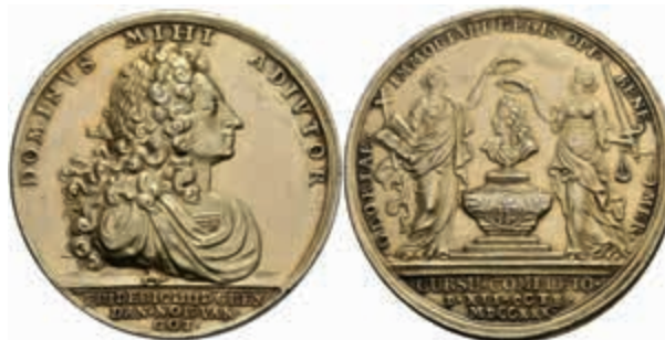
1307 Dänemark, Friedrich IV., vergoldete Silbermedaille (Dm. ca. ca. ), 1730, unsign. (von ). Av: Büste nach rechts, darum "DOMINVS MIHI ADIVTOR", im Abschnitt darunter "FRIDERIC III D G REX / DAN NOR VAN / GOT". Rev: Zwei stehende weibliche Gestalten bekränzen eine Büste, darum "GLORIAE IMMORTALI REGIS OPT BENE MER", im Abschnitt darunter "CURSO COMPLETO / D XII OCTB / MDCCXXX". Felder bearbeitet, Randfehler, ss-vz. Selten! (Abbildung auf 84% verkleinert) 250,—