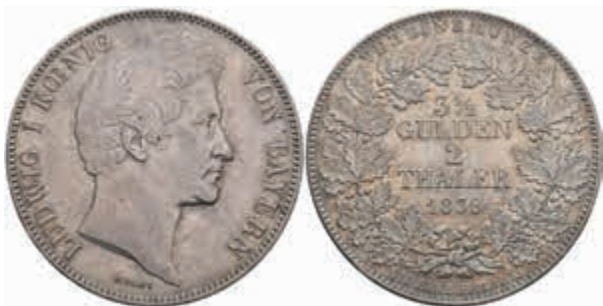
452 Doppeltaler, 1839, Ludwig I., AKS 73, J. 64, wz. Rf., f. vz. 300,—