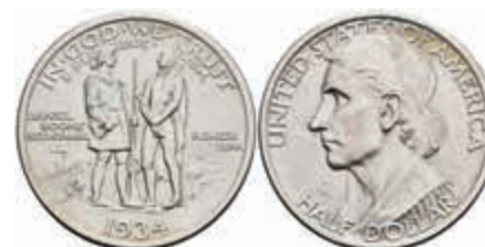
1114 1/2 Dollar, 1934, Boone, KM 165.1, wz. Kr., f. st. 80,—