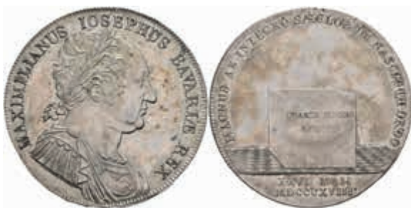
451 Taler, 1818, Maximilian I. Joseph, AKS 59, J. 15, kl. Schrötlingsfehler am Rand, vz-st. Mit altem Unterlegzettel. 300,—