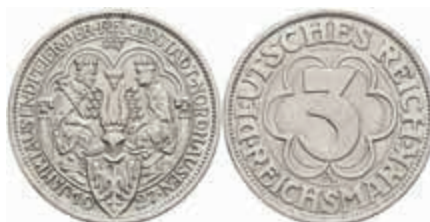
759 3 Reichsmark, 1927, Nordhausen, kl. Rf., vz. J. 327 70,—