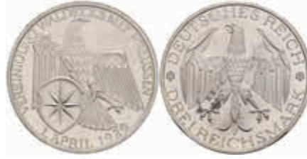
772 3 Reichsmark, 1929, Waldeck, kl. Kratzer, PP. J. 337 100,—