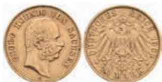
720 20 Mark, 1903, Georg, kl. Rf., ss-vz. J. 266 400,—