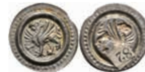
353 Überlingen, Brakteat (0,39g), 1230/1250. Greif nach links. Berger 2582, Cahn 118, vz. Selten! 700,—