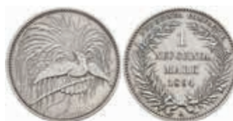
786 Neuguinea, 1 Mark, 1894, min. berieben, ss-vz J. N 705 400,—