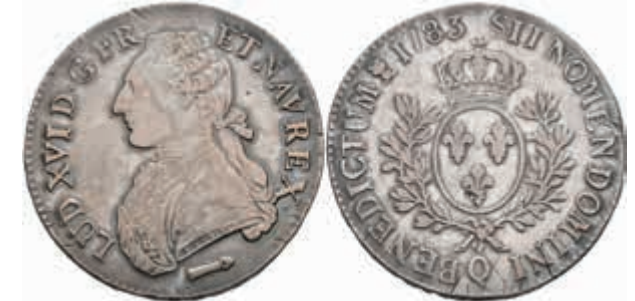
875 Ecu, 1783, Louis XVI., Perpignan, Gadoury 356, justiert, ss. 80,—