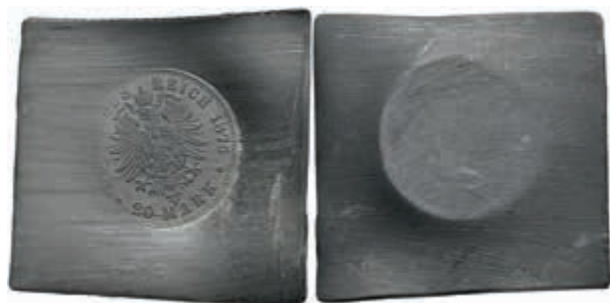
1238 Kaiserreich, Abschlag eines Reversstempels zu 20 Mark, 1875, auf Bleiblech. 21,21g, Prägeschwäche. 30,—