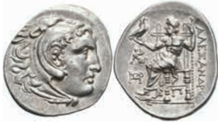
27 Tetradrachme (17,00g), 270-220 v. Chr., posthum, Alexander III., Chios. Av: Herakleskopf mit Löwenfell nach rechts. Rev: Thronender Zeus nach links, daneben Sphinx. Price 2362A var., ss. 500,—