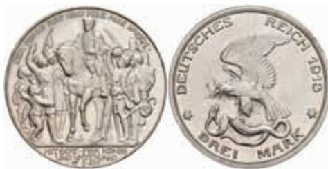
547 3 Mark, 1913, Wilhelm II., Jahrhundertfeier der Befreiungskriege, kl. Kratzer, PP. J. 110 50,—