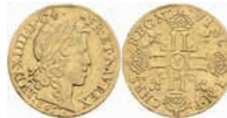
871 Louis d'or à la mèche longue, 1653, Paris, Gadoury 245, Schlagspur, ss. 900,—