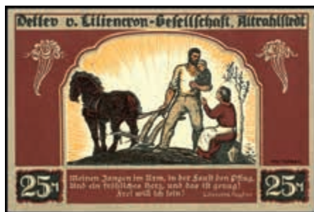
1716 Hamburg, Altrahlstedt (SH/RP), Liliencron-Gesellschaft, 8 St.: 1, 5, 10 und 25 Mark o. D. Spendscheine mit und ohne Aufdruck, Grab./Mehl 31.1, Erh. I-III (Abbildungen siehe Onlinekatalog) (Abbildung auf 50% verkleinert) 130,—