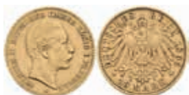
687 10 Mark, 1895, Wilhelm II., ss. J. 251 800,—