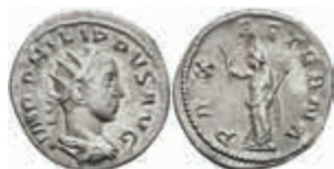
195 Philippus II., 244-249, Antoninian (4g), Rom. Av: Büste nach rechts, darum Umschrift. Rev: Stehende Pax nach links, darum "PAX AETERNA". RIC 231c, ss. 30,—