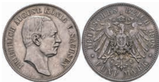
562 5 Mark, 1908, Friedrich August III., kl. Rf., f. vz. J. 136 50,—