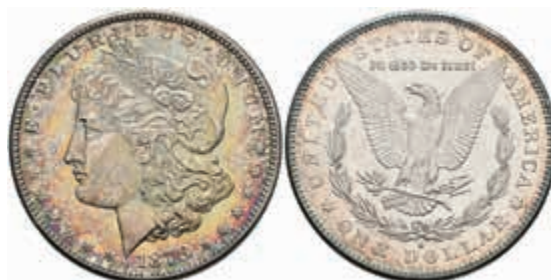
1059 Dollar, 1878, San Francisco, KM 110, kl. Rf., schöne Patina, vz-st. 40,—