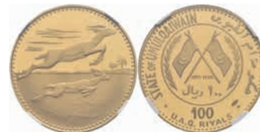
1006 Umm al-Quaiwain, 100 Riyals, Gold, 1970, Gazellen, KM 8, NGC - PF 67 Ultra Cameo. Auflage nur 300 Stück! 1200,—