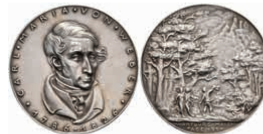
1405 Silbermedaille (Dm. ca. 36mm, ca. 19,36g), 1926, von K. Goetz, auf die fünften Wartburger Maientage. Av: Büste Webers halbrechts, darum Umschrift. Rev: Menschengruppe im Wald, im Hintergrund auf dem Hügel die Wartburg. Kienast 396, Rand punziert, vz. 100,—