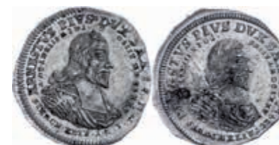
438 Zinnabschlag zweier 1/4 Taler-Aversstempel. Einer von 1729, Ernst I. (der Fromme), auf die Errichtung seines Denkmals in der Margarethenkirche zu Gotha. Vgl. Slg. Merseb. 3054. Schrötlingsfehler und kleine Druckstellen, vz. 200,—