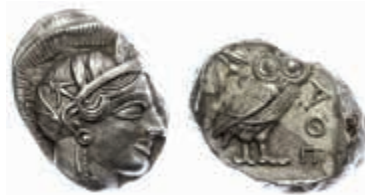
38 Athen, Tetradrachme (17,23g), ca. 421-415 v. Chr., Av: Athenekopf mit attischem Helm nach rechts, Rev: Eule nach rechts, dahinter Ölweig und Mondsichel, davor "AOE". Svoronos Pl. 12-13, vz. 500,—