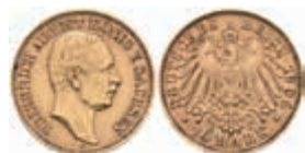
721 10 Mark, 1905, Friedrich August II., kl. Rf., f. vz. J. 267 350,—