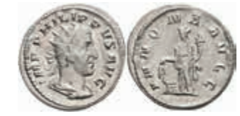
192 Philippus I. Arabs, 244-249, Antoninian (3,70g), Rom. Av: Büste nach rechts, darum Umschrift. Rev: Stehende Annona nach links, darum "ANNONA AVGV". RIC 28c, vz. 50,—