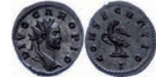
221 Divus Carus, 283, Antoninian (4,16g), Lugdunum. Av: Kopf nach rechts, darum Umschrift. Rev: Adler nach rechts, darum Umschrift. RIC 29, Cohen 18, prägefrisch. Exemplar der James Fox Collection, CNG Auktion 40, 1996, Los 1712. Exemplar der Sammlung Dr. Neussel. Mit Unterlegzettel des Sammlers. 500,—