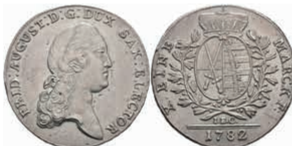
435 Taler, 1782, Friedrich August III., IEC, Dav. 2695, Schnee 1079, ss-vz. 100,—