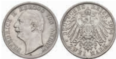
502 2 Mark, 1904, Friedrich II., kl. Rf., ss+. J. 22 200,—