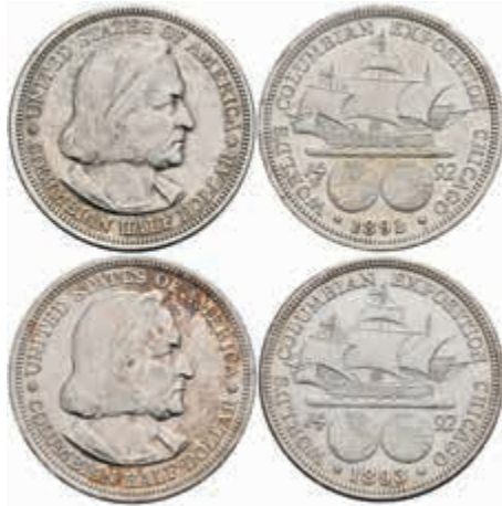
1068 2x 1/2 Dollar, 1892 und 1893, Christoph Kolumbus, KM 115, f. st. 30,—