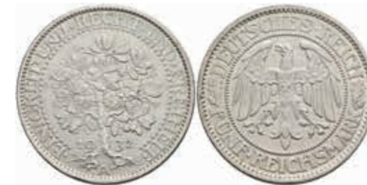
766 5 Reichsmark, 1932, A, Eichbaum, Kratzer, vz. J. 331 70,—

Alle Einzellose und Zertifikate/Gutachten sind unter www.rhenumis.de farbig abgebildet!