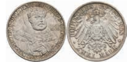
577 2 Mark, 1908, Universität Jena, kl. Rf., vz-st. J. 160. 50,—