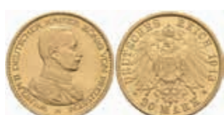
692 20 Mark, 1913, Wilhelm II., kl. Rf., kl. Kr., vz+. J. 253 380,—