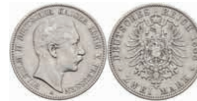
543 2 Mark, 1888, Wilhelm II., kl. Rf., zaponiert, ss. J. 100 100,—