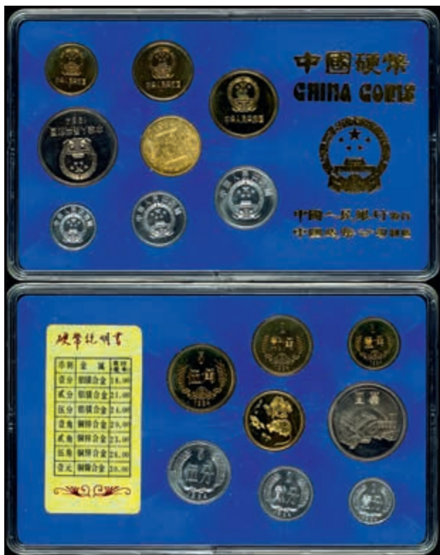
854 1 Fen bis 1 Yuan, 1984, Kursmünzensatz, Jahr der Ratte, im Blister mit Umverpackung (beschriftet), etwas fleckig, PP. (Abbildung auf 50% verkleinert) 2000,—