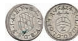
395 30 Kreuzer, 1624, Maximilian I., Hahn 93, vz. 30,—