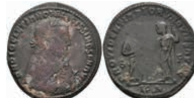
223 Diocletianus, 284-305, Bronze Follis (8,75g) dat. 305-313, Kyzikus. Av: Umschrift, Büste mit Lorbeerkrantz, Konsularsrobe, Zweig und Mappa Rev: Umschrift, Providentia mit erhobener Hand sowie Quies mit Zweig und Szepter. RIC VI 22a., ss. 30,—