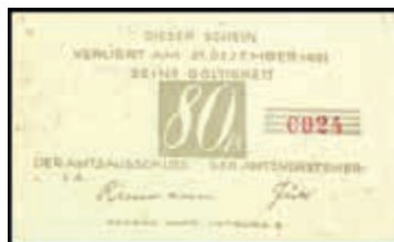
1733 Schleswig-Holstein, Brande-Hörnerkirchen (SH/SH) Gemeinde, 20, 30, 40, 60, 70, 80 Pfennig o. D. (1921)-31.12.1921 ohne Wz, Grab./Mehl 152.1, Erh. I. (Abbildung auf 50% verkleinert) 100,—