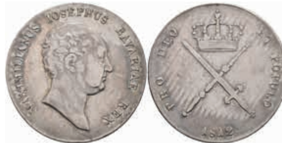
446 Taler, 1812, Maximilian I. Joseph, AKS 44, J. 14, ss. 90,—