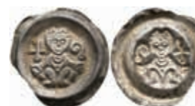
366 Brakteat (0,55g), Hartmann II., 1250-1286. Av: Thronender Bischof mit Kreuzstab und Krummstab von vorn. Berger 2644, Randausbruch, ss. 60,—