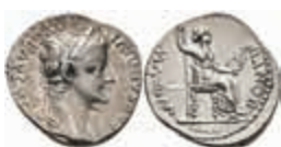
147 Tiberius, 36-37, Denar (3,59g), Lugdunum. Av: Kopf nach rechts, darum Umschrift. Rev: Thronende weibliche Gestalt nach rechts, darum "PONTIF MAXIM". RIC 30, ss-vz. 500,—