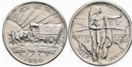
1193 1/2 Dollar, 1938, Oregon Trail, KM 159, st. 130,—