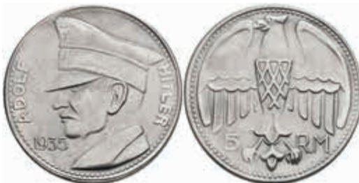
1250 5 Reichsmark, 1935, Silber, Adolf Hitler, Adler, private Anfertigung, 36 mm, 19,62 g, vz. 30,—