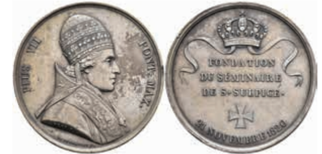
1326 Vatikan, Pius VII., versilberte Bronzemedaille (Dm. ca. 41,0 mm, ca. 35,31g), 1820, von Droz, auf die Gründung des Saint Sulpice Seminars. Av: Brustbild Pius VII. nach rechts. Rev: 3 Zeilen Schrift zwischen Krone und Kreuz. Rf. vz. 50,—