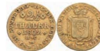
466 2 1/2 Taler, Gold, 1802, M.C., Fb. 727, ss. 600,—