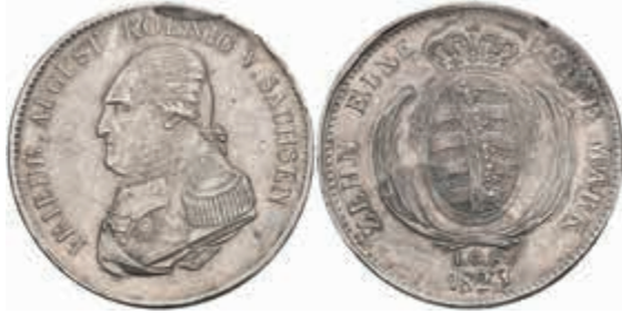
481 Taler, 1823, Friedrich August I., IGS, AKS 24, J. 33, kl. Rf., ss-vz. 80,—