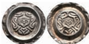
349 Schongau, Brakteat (0,78g), Konradin, 1258-1268. Brustbild des Königs umgeben von Ranken. Berger 2681, vz. 150,—