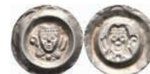
380 Brakteat (0,62g), 1290-1330. Bischofskopf mit Krummstab und Buch von vorn. Berger 2656, ss-vz. 50,—