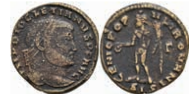
222 Diocletian, 284-305, Bronze follis (7,33 g), at. 296, Siscia. Av: IMP C DIOCLETIANVS P F AVG, belorbeter Kopf n. r. Rev: GENIO POPVLI ROMANI, Genius n. I stehend, haltend Patera and Füllhorn. RIC 95a, ss+ 40,—