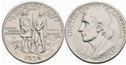
1195 1/2 Dollar, 1938, S, Boone, KM 165.2, wz. Rf., vz-st. 150,—