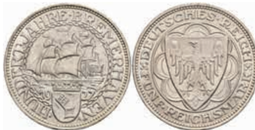
758 5 Reichsmark, 1927, Bremerhaven, kl. Rf., vz. J. 326 200,—