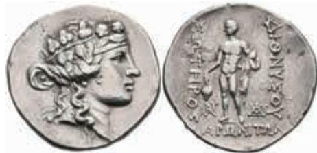
31 Maroneia, Tetradrachme (16,86g), ca. 2./1. Jhdt v. Chr. Av: Dyonisokopf nach rechts. Rev: Stehender Dyonisos nach links. Ss 200,—