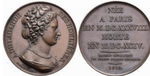
1323 Frankreich, Bronzemedaille (Dm. ca. 41 mm, ca. 37,04g), 1819, von F. Grandjean, auf Antoinette Deshoulières. Av: Büste nach rechts, darum Umschrift. Rev: 8 Zeilen Schrift. Wurzbach 1625, vz. 30,—