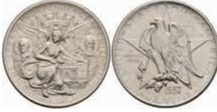
1184 1/2 Dollar, 1937, Texas, KM 167, f. st. 120,—