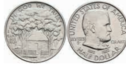
1091 1/2 Dollar, 1922, Grant Memorial, KM 151.1, vz. 50,—