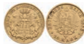
638 10 Mark, 1888, ss. J. 209 220,—