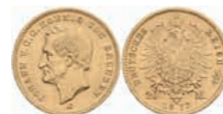
699 20 Mark, 1872, Johann, kl. Rf., ss. J. 258 380,—

Alle Einzellose und Zertifikate/Gutachten sind unter www.rhenumis.de farbig abgebildet! Dort sind auch 304 weitere Lose zu finden, die nicht im gedruckten Katalog, sondern nur im Internet zu finden sind!