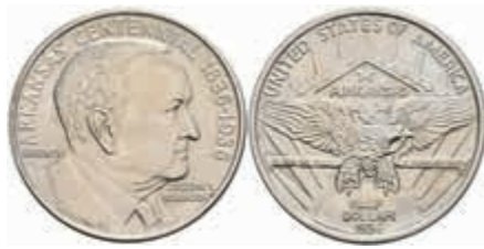
1136 1/2 Dollar, 1936, Arkansas, KM 187, vz. 80,—