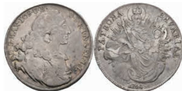
403 Taler, 1764, Maximilian III. Joseph, Hahn 307, justiert, ss-vz. 80,—