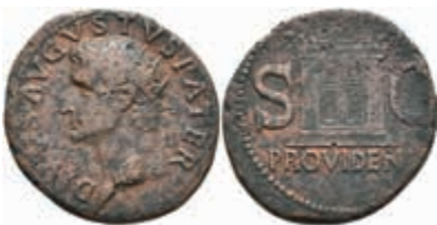
145 Augustus, 27 v. Chr. - 14. n. Chr., As (10,36g), Rom, geprägt unter Tiberius. Av: Kopf nach links, darum Umschrift. Rev: Altar zwischen "SC", darunter "PROVIDENT". Cohen 228, RIC 81, etw. korrodiert, ss 40,—