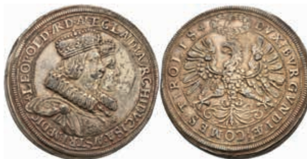
362 Doppeltaler (57,26g), o.J. (1635), Leopold, Hall, Hochzeit mit Claudia Medici, Dav. 3331, Kratzer, Rand bearbeitet, Zainende, altvergoldet, ss. (Abbildung auf 88% verkleinert) 200,—