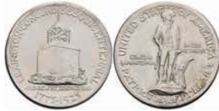
1097 1/2 Dollar, 1925, Lexington, KM 156, vz-st. 50,—