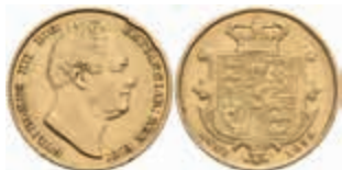
910 1 Sovereign, 1832, William IV., Fb. 383, kl. Rf., ss-vz. 700,—