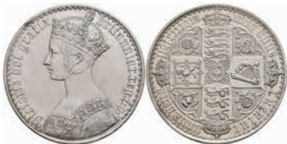
911 Crown, 1847, Victoria, Gothic Crown, Seaby 3883, kl. Rf., Kratzer/be- rieben, zaponiert, vz. 800,—