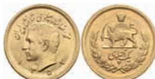
921 1 Pahlavi, Gold, 1974 (SH 1353), Mohammed Reza Pahlavi, Fb. 101, vz-st. 350,—