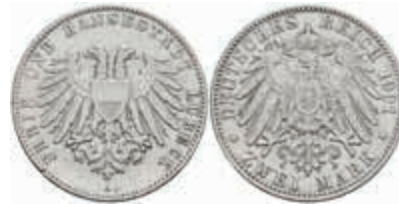
528 2 Mark, 1901, ss, J. 80. 90,—