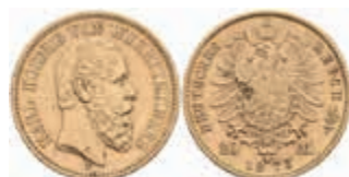
728 20 Mark, 1873, Karl, kl. Rf., ss+. J. 290 350,—