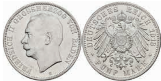
514 5 Mark, 1913, Friedrich II., kl. Rf., vz. J. 40 80,—