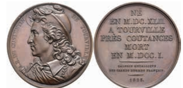
1327 Frankreich, Constantin de Tourville, Bronzemedaille (Dm. ca. 41 mm, ca. 36,67g), 1823, von Pingret. Av: Brustbild nach links, darum Umschrift. Rev: 9 Zeilen Schrift. Vz-st. 30,—