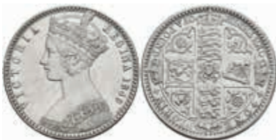
912 Florin, 1849, Victoria, Seaby 3890, kl. Rf., ss-vz. 100,—