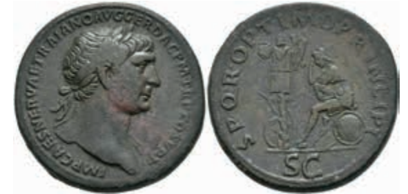
165 Trajanus, 98-117, Sesterz (26,35g), Rom. Av: Büste nach rechts, darum Umschrift. Rev: Trauernde Dacia vor Tropaeum, darum "SPQR OPTIMO PRINCIPI - SC". RIC 564, ss. Los 285 der 81. Auktion, Emporium Hamburg, 2018. 200,—