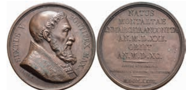
1328 Kirchenstaat, Sixtus V., Bronze- Suitenmedaille (Dm. ca. 41,5 mm, ca. 36,5 g), 1823, von Caque. Av: Brustbild nach rechts. Rev: 9 Zeilen Schrift. Kl. Rf., vz. 50,—