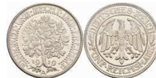
765 5 Reichsmark, 1929, A, Eichbaum, PP. J. 331 500,—