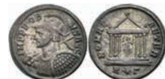
220 Probus, 276-282, Antoninian (3,53g), Rom. Av: Brustbild mit Schild und geschultertem Speer nach links, darum Umschrift. Rev: Sitzende Roma in Tempel, darum "ROMAE AETER". RIC 186, ss. 50,—