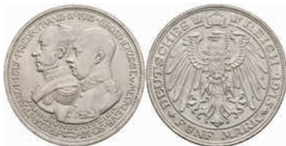
536 5 Mark, 1915, Friedrich Franz IV. zur 100-Jahrfeier des Großherzogtums, kl. Rf., zaponiert, vz. J. 89 300,—