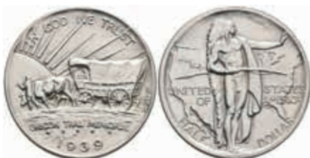
1202 1/2 Dollar, 1939, Oregon Trail, KM 159, st. 300,—