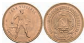
995 10 Rubel, Gold, 1975, Tschernonetz, Fb. 181a, f. st. 400,—