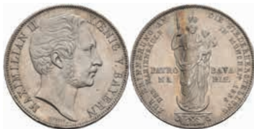
460 Doppelgulden, 1855, Maximilian II., Mariensäule München, AKS 168, J. 84, vz. 90,—