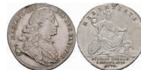
405 Schulprämien-gulden, 1772, Maximilian III. Joseph, Hahn 444, Felder bearbeitet, Hsp., ss-vz. 400,—