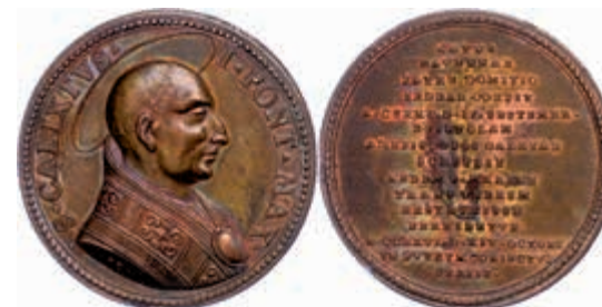
1314 Kirchenstaat, Calixtus III., Bronzemedaille (Dm. ca. 37mm, ca. 23,93g), o.J. (ca. 18. Jhdt.). Av: Brustbild nach rechts, darum Umschrift. Rev: 15 Zeilen Schrift. Randfehler, ss-vz. Selten! 250,—