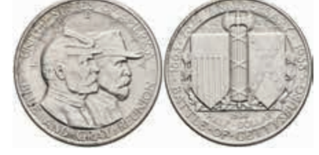
1152 1/2 Dollar, 1936, Gettysburg, KM 181, vz. 200,—