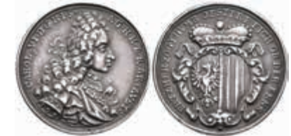
1301 RDR, Silbermedaille (Dm. ca. 27,5mm, ca. 6,7g), o.J., signiert I.G.S. (Johann Georg Seidlitz). Av: Brustbild Karl VI. nach rechts. Rev: Wappen Oberösterreichs. Kl. Rf., vz. Selten. 350,—