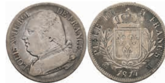
888 5 Francs, 1814, Louis XVIII., Toulouse, Gadoury 591, kl. Rf., ss. 100,—