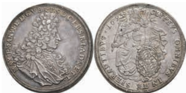
398 Taler, 1694, Maximilian II. Emanuel, Dav. 6099, Hahn 199, Rand bearbeitet, schöne Patina, vz. Mit altem Unterlegzettel. (Abbildung auf 97% verkleinert) 400,—