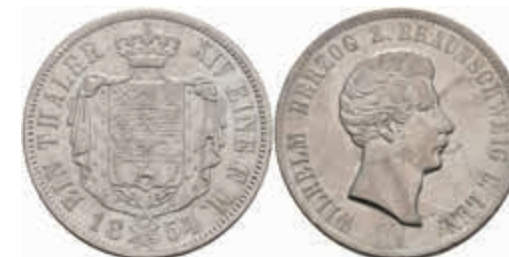
415 Taler, 1854, Wilhelm, AKS 80, J. 250, Dav. 634, ss-vz. 90,—