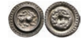
354 Überlingen, Brakteat (0,47g), nach ca. 1290. Gekrönter Löwe mit gepunktetem Fell nach rechts, davor eine Kugel. Berger 2589, Cahn 134, s-ss. 100,—