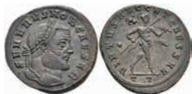
226 Severus II., 305-306, Follis (11,94g), Ticinium. Av: Kopf nach rechts, darum Umschrift. Rev: Mars mit Speer und geschulterter Trophäe nach rechts, darum "VIRTVS AVGG ET CESS NN". RIC 60, vz. 70,—