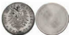
1237 Stempelmatrize aus Eisen/Stahl (magnetisch) zu 10 Mark, 1874. 8,88g. 70,—