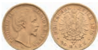
617 20 Mark, 1876, Ludwig II., kl. Rf., ss. J. 197 400,—