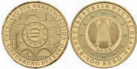
798 200 Euro, Gold, 2002, A, Währungsunion, mit Zertifikat in Ausgabeschatulle (beschädigt), st. J. 494 1900,—