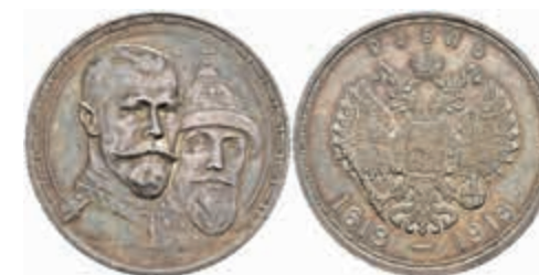
992 Rubel, 1913, Nikolaus II., St. Petersburg, 300 Jahre Romanov Dynastie, Bitkin 336, kl. Rf., schöne Patina, vz. 70,—

Alle Einzellose und Zertifikate/Gutachten sind unter www.rhenumis.de farbig abgebildet!