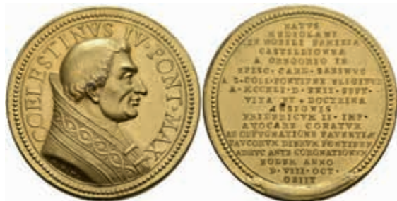
1304 Kirchenstaat, Coelestin IV., vergoldete Bronze- Jesuitenmedaille (Dm. ca. 38 mm, ca. 23,4 g), o.J. (1712), von P.H. Müller bei Lauffer, auf Coelestin IV. Av: Brustbild mit Heiligenschein nach rechts. Rev: 18 Zeilen Schrift. Lauffer 181, Förchner 56,182, kl. Rf., Stempelfehler, vz. 100,—