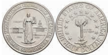
1142 1/2 Dollar, 1936, Columbia, KM 178, vz-st. 120,—