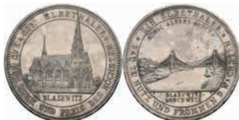
1285 Sachsen, Silbermedaille (Dm. ca. 33,20mm, ca. 17,86g), 1893, von L. Diller, auf den Bau der König-Albert-Brücke in Dresden. Av: Ansicht der Brücke, darum Umschrift. Rev: Ansicht der Kirche in Blasewitz, darum Umschrift. Mit Randschrift, Slg. Merseb. -, kl. Kratzer, f. st. 250,—