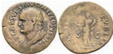
158 Vespasianus, 69-79, Dupondius (11,24g), Rom. Av: Kopf nach links, darum Umschrift. Rev: Stehende Felicitas nach links, darum "FELICITAS PVBLICA S - C". RIC 716, ss. 50,—