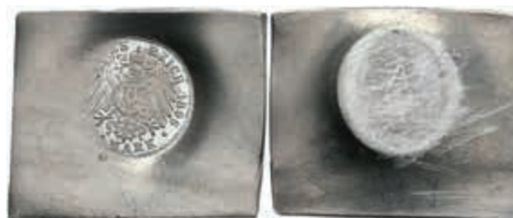
1242 Kaiserreich, Abschlag eines Reversstempels zu 10 Mark, 1896, auf Zinnblech. 7,98g, Prägeschwäche. 30,—

Alle Einzellose und Zertifikate/Gutachten sind unter www.rhenumis.de farbig abgebildet! Dort sind auch 304 weitere Lose zu finden, die nicht im gedruckten Katalog, sondern nur im Internet zu finden sind!