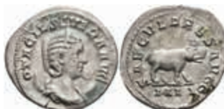
206 Otacilia Severa, 244-249, Antoninian (3,40g), Rom. Av: Büste nach rechts, darum Umschrift. Rev: Nilpferd nach rechts, darum "SAECVLARES AVGG - IIII". RIC 116b, ss-vz. 100,—