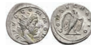
211 Trajanus Decius, 249-251, Antoninian (3,16g), Rom. Av: Kopf nach rechts, darum "DIVO COMMODO". Rev: Adler, darum "CONSECRATIO". RIC 93, ss+. 120,—

Goldmünzen ab 1800 sowie Goldbarren sind als Anlagegold ggf. umsatzsteuerfrei (auch für das Aufgeld), soweit der Zuschlagpreis inkl. Aufgeld und Losgebühr nicht höher als der Goldwert + 80% ist.