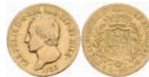
932 Sardinien, 20 Lire, Gold, 1823, Karl Felix, Fb. 1136, kl. Rf., ss. 270,—