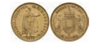
1050 10 Kronen, Gold, 1909, Franz Joseph I., Fb. 252, ss. 140,—