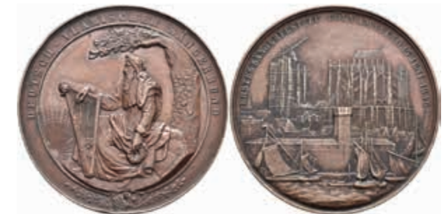
1272 Köln, Bronzemedaille (Dm. ca. 50,2 mm, ca. 49,6 g), 1846, von Wiener, auf das erste Sängerfest zu Köln am 14. und 15. Juni 1846 des Deutsch-Vlämischen Sängerbundes. Av: Sitzender Barde mit Harfe unter Baum. Rev: Segelboote auf dem Rhein vor dem Kölner Dom. Weiler 56, kl. Rf., ss-vz. (Abbildung auf 82% verkleinert) 50,—