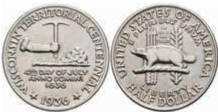
1168 1/2 Dollar, 1936, Wisconsin, KM 188, f. st. 120,—