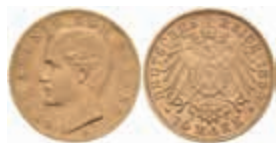
620 10 Mark, 1893, Otto, ss. J. 199 220,—