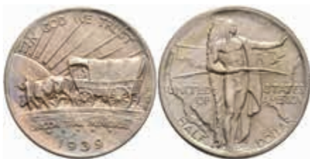
1204 1/2 Dollar, 1939, S, Oregon Trail, KM 159, f. st. 250,—