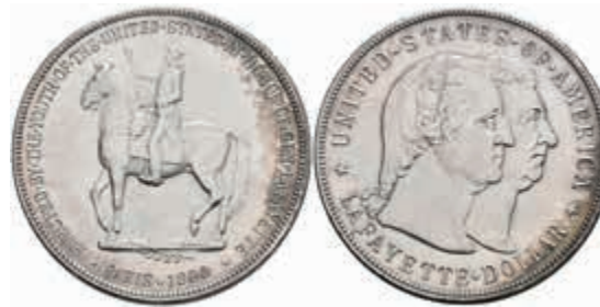
1072 Dollar, 1900, Lafayette-Dollar, KM 118, wz. Rf., kl. Kr., vz-st. 600,—