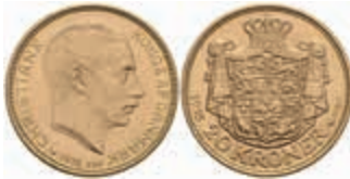
866 20 Kronen, Gold, 1915, Christian X., Fb. 299, kl. Kratzer, Avers vz, Revers vz-st. 380,—