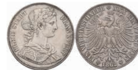
469 Taler, 1862, AKS 10, J. 42b, vz. 80,—

Alle Einzellose und Zertifikate/Gutachten sind unter www.rhenumis.de farbig abgebildet!