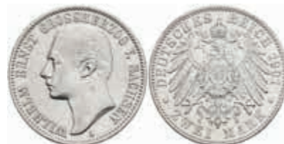
575 2 Mark, 1901, Wilhelm Ernst, kl. Rf., zaponiert, ss. J. 157 100,—