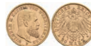
753 20 Mark, 1900, Wilhelm II., wz. Rf., ss-vz. J. 296 400,—