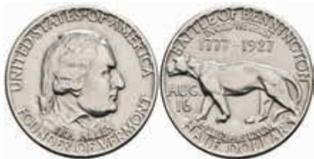
1104 1/2 Dollar, 1927, Vermont, KM 162, vz-st. 150,—