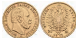
673 20 Mark, 1871, Wilhelm I., kl. Rf., ss. J. 243 650,—