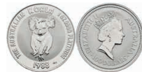
812 100 Dollars, Platin, 1988, Koala, KM 111, Fb. B20, wz. Kr., f. st. 800,—