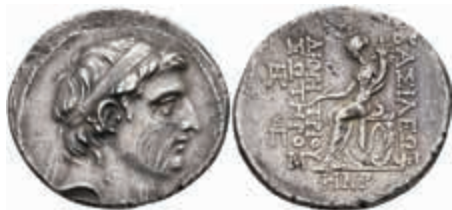
107 Tetrachme (16,70g), ca. 155-154 v. Chr., Demetrios I. Soter, Antiochia. Av. Kopf nach rechts, darum Kranz. Rev: Thronende Tyche mit Füllhorn nach links. SC 1641.3, Schürfspuren, ss. 200,—