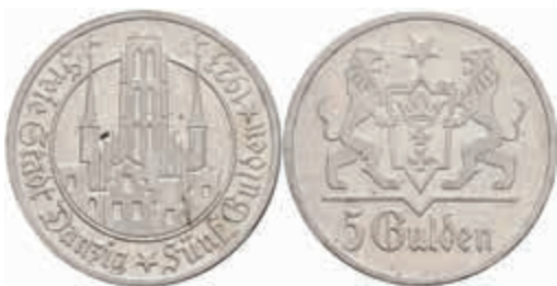
781 Danzig, 5 Gulden, 1923, Marienkirche, kl. Rf., ss. J. D 17 150,—