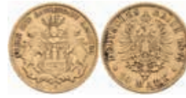
637 10 Mark, 1875, Kratzer, kl. Rf., ss. J. 209 230,—