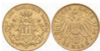
651 20 Mark, 1894, ss. J. 212 380,—