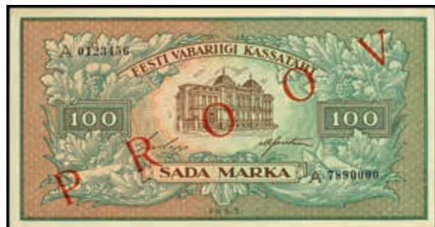
1651 Estland, Eesti Vabariigi, 100 Marka, 1923, Probe, Ser. A 7890000, einseitiger Druck mit rotem Überdruck RROOV, P 51p, Erh. I. (Abbildung auf 49% verkleinert) 150,—