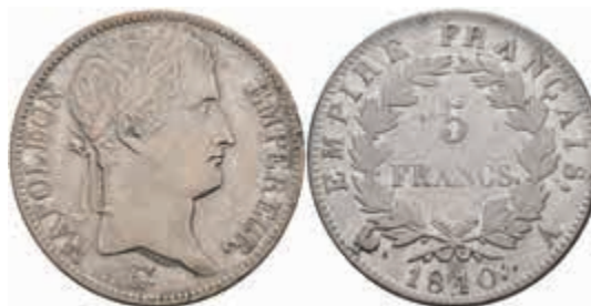
884 5 Francs, 1810, Napoleon I., Paris, Gadoury 584, kl. Rf., ss. 80,—