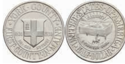
1169 1/2 Dollar, 1936, York County, KM 189, f. st. 150,—