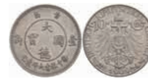
793 Kiautschou, 10 Cent, 1909, ss-vz. J. N 730 250,—