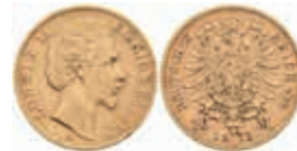
606 10 Mark, 1873, Ludwig II., ss. J. 193 220,—