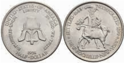
1191 1/2 Dollar, 1938, New Rochelle, KM 191, f. st. 200,—