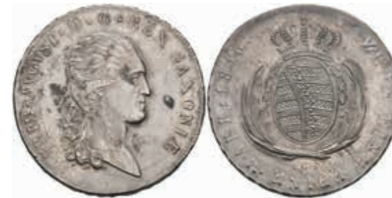
478 Taler, 1816, Friedrich August I., IGS, AKS 12b, f. vz. 130,—