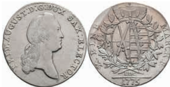
434 Taler, 1775, Friedrich August III., EDC, Dav. 2690, Kahnt 1074, ss-vz. 70,—