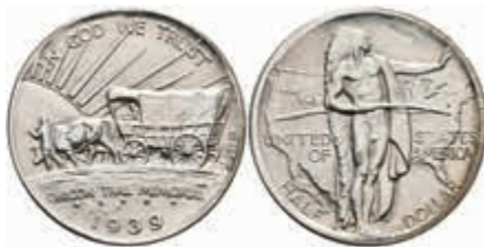
1205 1/2 Dollar, 1939, S, Oregon Trail, KM 159, st. 300,—