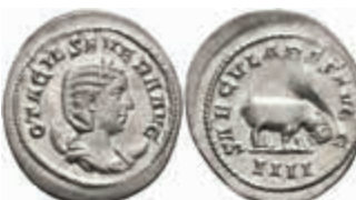
207 Otacilia Severa, 244-249, Antoninian (3,53g), Rom. Av: Büste nach rechts, darum Umschrift. Rev: Nilpferd nach rechts, darum "SAECVLARES AVGG - IIII". RIC 116b, vz-st. 150,—