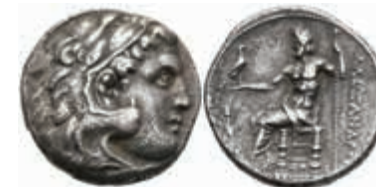
24 Tetradrachme (16,24g), ca. 323-316 v. Chr., Alexander III., Memphis oder Alexandria. Av: Herakleskopf mit Löwenfell nach rechts. Rev: Thronender Zeus nach links, links daneben ein Blitzbündel. Price 3976, ss. Mit Unterlegzettel des Sammlers. 200,—