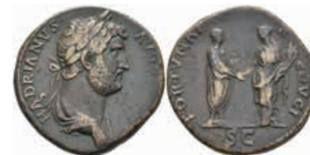
180 Hadrianus, 134-138, Sesterz (23,77g), Rom. Av: Büste nach rechts, darum Umschrift. Rev: Stehender Hadrian und Fortuna einander gegenüber, darum Umschrift. RIC 761, geplättet, ss. 150,—