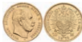
671 10 Mark, 1873, A, Wilhelm I., wz. Rf., vz-st. J. 242 220,—