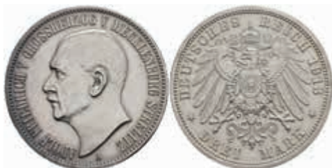
538 3 Mark, 1913, Adolf Friedrich V. zum 65. Geburtstag, mit Gutachten, vz. J. 92. 900,—