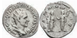
213 Trajanus Decius, 249-251, Antoninian (3,68g), Rom. Av: Büste nach rechts, darum Umschrift. Rev: Zwei Pannoniae, darum "PANNONIAE". RIC 21b, ss. 30,—