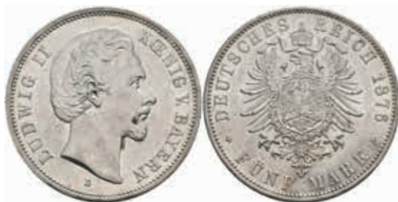
515 5 Mark, 1876, Ludwig II., wz. Rf., vz+. J. 42 250,—

Goldmünzen ab 1800 sowie Goldbarren sind als Anlagegold ggf. umsatzsteuerfrei (auch für das Aufgeld), soweit der Zuschlagpreis inkl. Aufgeld und Losgebühr nicht höher als der Goldwert + 80% ist.