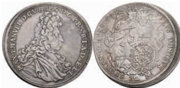
400 Taler, 1694, Maximilian II. Emanuel, Dav. 6099, Hahn 199, ss. (Abbildung auf 94% verkleinert) 300,—