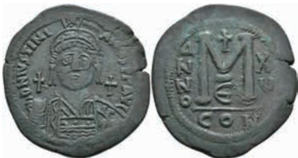
255 Justinianus I., 527-565, Follis (22,80g), Konstantinopel. Av: Brustbild von vorn, darum Umschrift. Rev: Wertzeichen, darüber ein Kreuz. Sear 163, f. vz. Mit Unterlegzettel des Sammlers. 50,—