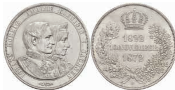
497 Doppeltaler, 1872, Johann, auf die Goldene Hochzeit, AKS 160, J. 133, leicht berieben, zaponiert, vz. 120,—