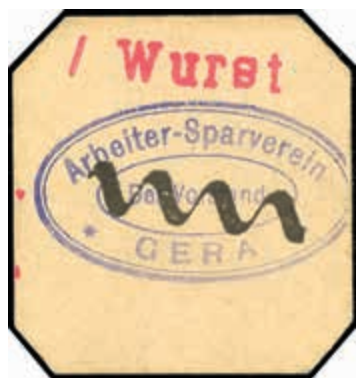
1724 Gera, Wertmarke (Kleingeldersatz) des „Arbeiter-Sparverein Gera /Der Vorstand“: 10 , 25 u. 50 Pf., 1/8, 1/4 ,1/2, 1 und 2 Mark o. D. (um 1918), einige Werte mit rotem Stempel „Wurst“, selten, Erh. I u. II (Abbildungen siehe Onlinekatalog) 130,—