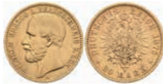
634 20 Mark, 1875, Wilhelm, f. vz. J. 203 1500,—