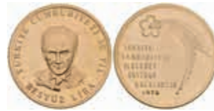
1046 500 Lira, Gold, 1973, 50 Jahre Republik, Fb. 223, vz. 250,—