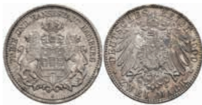
524 2 Mark, 1900, wz. Rf., vz-st. J. 63 80,—