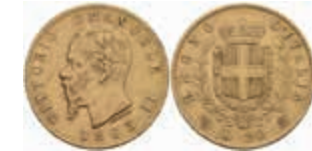
935 20 Lire, Gold, 1863, Vittorio Emanuele II., Fb. 11, kl. Rf., ss. 250,—