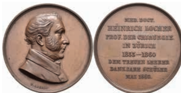
1343 Schweiz, Zürich, Bronzemedaille (Dm. ca. 45,0 mm, ca. 46,2 g), 1860, von F. Aberli, auf die Emeritierung von Heinrich Locher, Prof. d. Chirurgie in Zürich von 1833 bis 1860. Av: Brustbild nach links. Rev: 8 Zeilen Schrift. Slg. Brettauer 700, vz-st. (Abbildung auf 90% verkleinert) 50,—