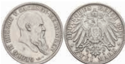
572 2 Mark, 1901, Georg II. zum 75. Geburtstag, zaponiert, leicht berieben, ss-vz. J. 149 150,—