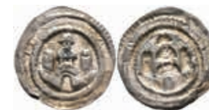
428 Brakteat (0,43g), 1185-1200. Toranlage mit drei Türmen. Berger 2533, ss. 70,—