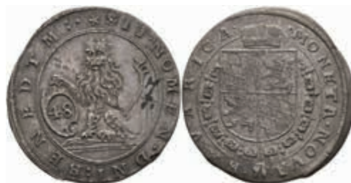
390 Kipper 48 Kreuzer (Zwölfbätzner), o.J. (1620/1621), Maximilian I., Hahn 74, Schrötlingsfehler, Kratzer und Tintensignatur, ss. 200,—