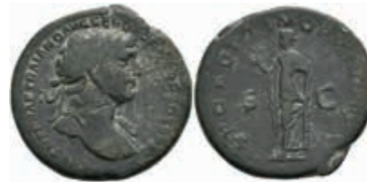
162 Traianus, 98-117, Bronze As (11,46g) dat. 10-111 n. Chr., Rom. Av: IMP CAES NERVAE TRAIANO AVG GER DAC P M TR P COS V P P, Büste des Trajan mit Lorbeerkrantz nach rechts, Gewand über linker Schulter. Rev: S P Q R OPTIMO PRINCIPI, im Feld, S C, Bekleidete Spes nach links schreitend, in rechter Hand Blume, mit linker Hand Gewand hebend. RIC 519, schwarze Patina, ss. 75,—