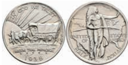
1196 1/2 Dollar, 1938, S, Oregon Trail, KM 159, st. 130,—