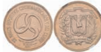
868 30 Pesos, Gold, 1974, Mittelamerikanische Spiele, KM 36, NGC - MS 68 600,—