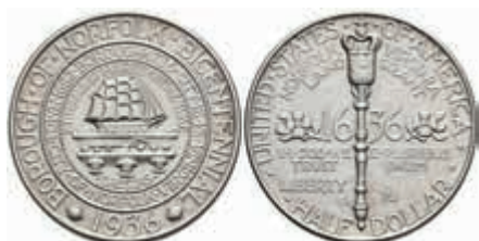
1154 1/2 Dollar, 1936, Norfolk, KM 184, st. 250,—