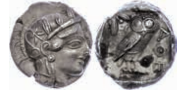
39 Athen, Tetradrachme (17,12g), ca. 415 v. Chr., Av: Athenekopf mit attischem Helm nach rechts, Rev: Eule nach rechts, dahinter Ölweig und Mondsichel, davor "AOE". Svoronos Pl. 13, Schrötlingsrisse, vz. 500,—