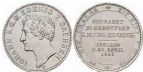
493 Taler, 1855, Johann, AKS 156, J. 99, kl. Rf., kl. Kr., ss-vz. 50,—