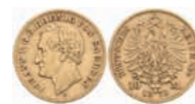
696 10 Mark, 1873, Johann, ss. J. 257 220,—