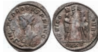
219 Probus, 276-282 n. Chr., Billon Antoninian (3,48g), Ticinum. Av: Büste v. Probus n. I in Konsularrobe. Rev: IOVI CONSERVAT/ Legende VXXT, Jupiter mit Szepter überreicht Globus an Kaiser mit Adlerszepter, RIC 386 var., vz. 50,—