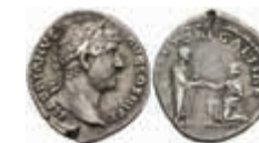
177 Hadrianus, 134-138, Denar (2,97g), Rom. Av: Drapierte Büste nach rechts, darum Umschrift. Rev: Stehender Kaiser vor kniender Gallia, darum "RESTITVTORI GALLIAE". BMC 880, ss. 50,—