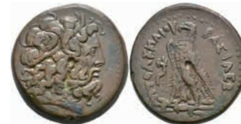
114 Æ-Triobol (34,77g), Ptolemaios II. Philadelphos, 285-246 v. Chr., Alexandria. Av: Kopf nach rechts. Rev: Adler auf Blitzbündel nach links, darum Umschrift. Svoronos 1127, SNG Cop. 201-202, CPE B496, ss. 100,—