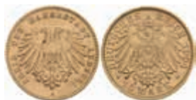
666 10 Mark, 1904, wz. Kr., f. vz. J. 227. 1400,—