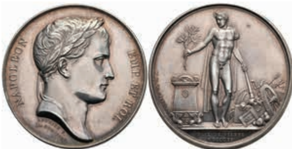
1320 Frankreich, Napoleon I., Silbermedaille (Dm. ca. 41 mm, ca. 35,04g), 1809, von Andrieu, auf den Frieden von Wien. Av: Kopf nach rechts, darum Umschrift. Rev: Nackter, stehender Napoleon mit Fackel und Lorbeerzweig von vorn. Bramsen 876, vz. 1400,—