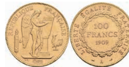
906 100 Francs, Gold, 1909, Stehender Genius, Paris, Fb. 590, Randfehler, kl. Kratzer, ss-vz. 1600,—