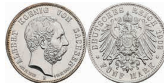
554 5 Mark, 1902, Albert, auf seinen Tod, kl. Rf., kl. Kr., vz-st. J. 128. 120,—