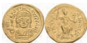
257 Justinus II., 565-578, Solidus (4,44g), Konstantinopel. Av: Brustbild mit Victoria und Schild von vorn, darum Umschrift. Rev: Konstantinopolis mit Schild und Speer frontal thronend, darum Umschrift. Sear 344, vz. 450,—