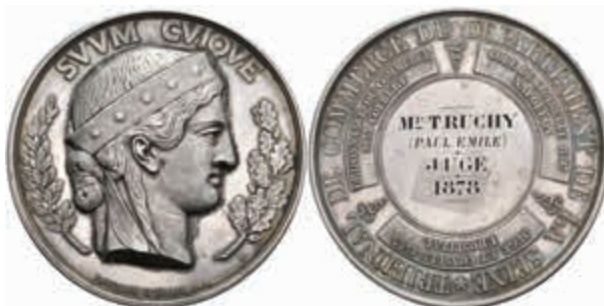
1337 Frankreich, Silbermedaille (Dm. ca. 57mm, ca. 88,29g), 1849, von J. Cavalier et Borrel. Av: Kopf der Marianne zwischen zwei Zweigen nach rechts, darüber "SVM CVIQVE". Rev: 4 Zeilen Schrift, darum drei Schrifttafeln und Umschrift. Rand punziert. Vz. (Abbildung auf 72% verkleinert) 150,—