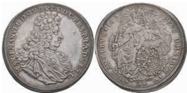
399 Taler, 1694, Maximilian II. Emanuel, Dav. 6099, Hahn 199, ss-vz. (Abbildung auf 96% verkleinert) 350,—