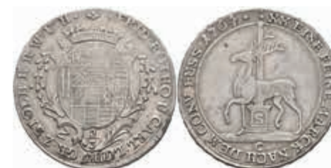
439 2/3 Taler, 1764, Friedrich Botho und Karl Ludwig, Friedrich 1986, ss. 80,—