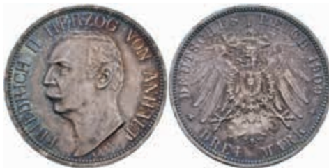
503 3 Mark, 1909, Friedrich II., kl. Rf., schöne Patina, vz-st. J. 23 50,—