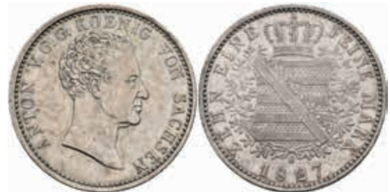
483 Taler, 1827, Anton, AKS 64, J. 54, ss+. 80,—