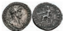
169 Hadrianus, 117, Denar (3,31g), Rom. Av: Büste nach rechts, darum Umschrift. Rev: Sitzende Fortuna mit Ruder nach links, darum Umschrift. RIC 10, BMC 20 var., ss-vz. 80,—