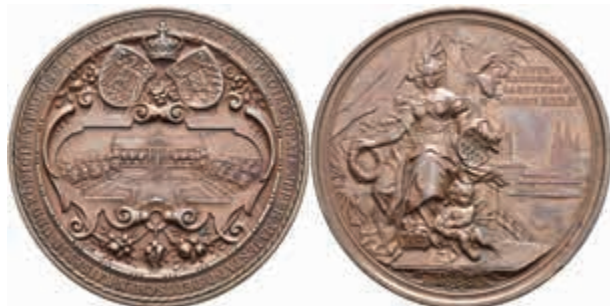
1282 Preußen, Köln, Bronzemedaille (Dm. Ca. 50,1 mm, ca. 49,0 g), 1888, von Lauer, auf die internationale Gartenbauausstellung in Köln. Av: Sitzende weibliche Gestalt mit Lorbeerkranz und Wappenschild, im Hintergrund rechts Stadtansicht. Rev: Zwei Wappen unter Krone über Kartusche mit Gebäude- und Gartenansicht, darum Umschrift. Weiler 2811, kl. Rf., ss-vz. (Abbildung auf 82% verkleinert) 60,—