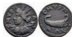
248 Ionien, Smyrna, Æ (3,09g), ca. 2. Jh. Av: Brustbild mit Mauerkrone nach links. Rev: Galeere. Ss. Aus einer rheinischen Privatsammlung. Erworben in den 1980/90er Jahren im rheinischen Münzhandel. Mit Unterlegzettel des Sammlers. 100,—