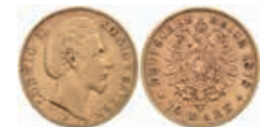
613 10 Mark, 1878, Ludwig II., ss. J. 196 220,—

Alle Einzellose und Zertifikate/Gutachten sind unter www.rhenumis.de farbig abgebildet! Dort sind auch 304 weitere Lose zu finden, die nicht im gedruckten Katalog, sondern nur im Internet zu finden sind!