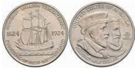
1094 1/2 Dollar, 1924, Hugueno-Walloon, KM 154, f. st. 70,—