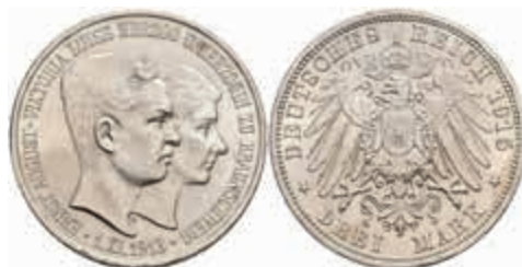
518 3 Mark, 1915, Ernst August, zum Regierungsantritt, ohne Lüneburg, kl. Rf., zaponiert, vz-st. J. 55 1200,—