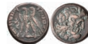
117 Æ (8,21g), Kleopatra III. und Ptolemaios IX - Ptolemaios XII., 116-51 v. Chr., Alexandria. Av: Kopf des Zeus Ammon nach rechts. Rev: Zwei Adler auf Blitzbündel nebeneinander nach links, davor Füllhorn. Svoronos 1426, SNG Cop. 311 (Gemeinsame Regierung von Ptolemaios VI und VIII), ss. 40,—

Alle Einzellose und Zertifikate/Gutachten sind unter www.rhenumis.de farbig abgebildet! Dort sind auch 304 weitere Lose zu finden, die nicht im gedruckten Katalog, sondern nur im Internet zu finden sind!