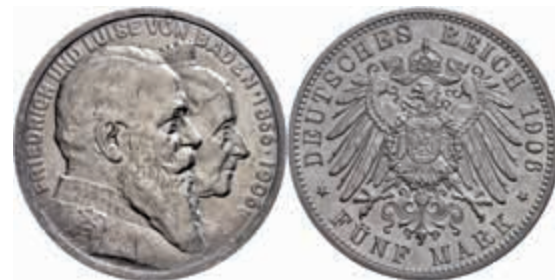
508 5 Mark, 1906, Friedrich I. zur Goldenen Hochzeit, kl. Rf., vz-st. J. 35 150,—