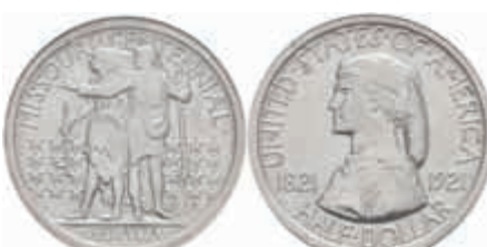
1086 1/2 Dollar, 1921, Missouri, KM 149.1, Slab NNC MS64, vz. 150,—