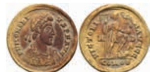
233 Honorius, 393-424, Solidus (4,42g), Mediolanum. Av: Büste nach rechts, darum Umschrift. Rev: Kaiser mit Viktoria und Labarum steht auf Gefangenen, darum Umschrift. RIC 1206, Belag, ss. 450,—