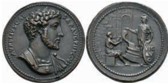
1295 Italien, Padua, Bronzemedaille (Dm. ca. 38,50mm, ca. 31,07g), ca. 16. Jh., nach Art Giovanni da Cavino. Av: Büste Marc Aurels nach rechts, darum Umschrift. Rev: An einem Schiffsvorderteil arbeitender Argos nach rechts, daneben stehende Minerva mit Schild nach links, darum Perlkranz. Klawans 4, Lawrence 58, ss+. 250,—