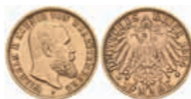
746 10 Mark, 1904, Karl, f. vz. J. 295 220,—