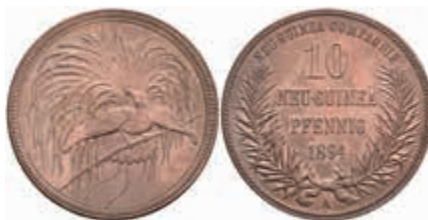
785 Neuguinea, 10 Pfennig, 1894, Kratzer, vz-st. J. N 703 250,—