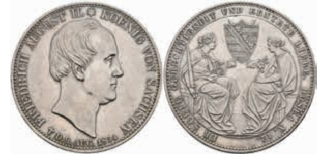
488 Doppeltaler, 1854, Friedrich August II., auf seinen Tod, AKS 116, J. 96, berieben, vz. 250,—