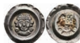
368 Brakteat (0,60g), Hartmann II., 1250-1286. Kopf des Bischofs zwischen zwei Ringen von vorn. Berger 2652, vz. 100,—