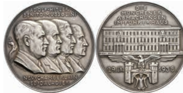
1418 Silbermedaille (Dm. ca. 59,80mm, ca. 58,33g), 1938, von K. Goetz, auf die Münchener Abmachung im Führerhaus. Av: Köpfe von Hitler, Mussolini, Chamberlain und Daladier nach rechts, Rev: Führerhaus, darüber 4 Zeilen Schrift. Kienast 549, Rand punziert, in Schatulle (beschädigt), mattiert, st. (Abbildung auf 70% verkleinert) 800,—