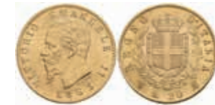
936 20 Lire, Gold, 1863, Vittorio Emanuele II., Turin, Fb. 11, vz+. 280,—