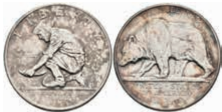
1095 1/2 Dollar, 1925, California, KM 155, kl. Kr., vz. 70,—