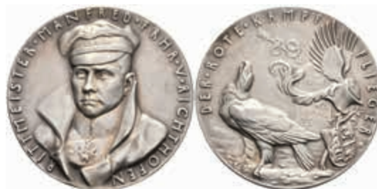
1396 Silbermedaille (Dm. ca. 36,6mm, ca. 19,81g), 1918, von Karl Goetz, auf Manfred Freiherr von Richthofen. Av: Brustbild von vorn, darum Umschrift. Rev: Adler vor Grabstein, darum Umschrift. Kienast 288, Rand punziert, vz. 130,—