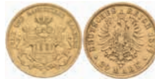
640 20 Mark, 1877, ss-vz. J. 210. 400,—