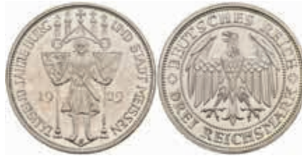
773 3 Reichsmark, 1929, Meissen, wz. Kr., PP. J. 338 150,—