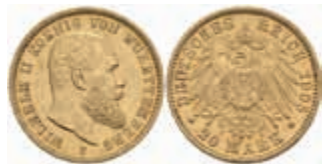
754 20 Mark, 1905, Wilhelm II., kl. Rf., ss-vz. J. 296 380,—