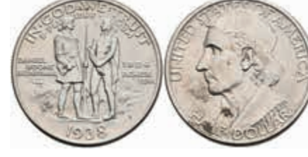
1188 1/2 Dollar, 1938, D, Boone, KM 165.2, kl. Kr., vz-st. 150,—