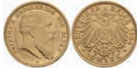
599 10 Mark, 1904, Friedrich I., f. vz. J. 190 300,—