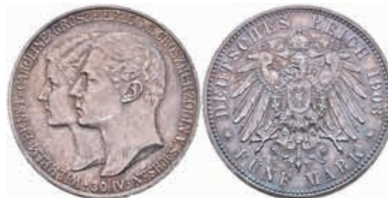
576 5 Mark, 1903, Wilhelm Ernst, auf die Vermählung, kl. Rf., schöne Patina, vz. J. 159 150,—