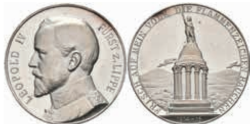
1392 Silbermedaille (Dm. ca. 33,20mm, ca. 17,70g), 1916, von Wolf, auf das zweite Kriegsjahr. Av: Büste nach links, darum "LEOPOLD IV - FÜRST Z. LIPPE". Rev: Hermannsdenkmal, darum "FRISCH AUF MEIN VOLK DIE FLAMMENZEICHENRAUCHEN". Rand punziert, kl. Rf. und kl. Kratzer/berieben, PP. 150,—