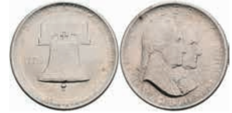
1100 1/2 Dollar, 1926, Independence, KM 160, vz. 30,—