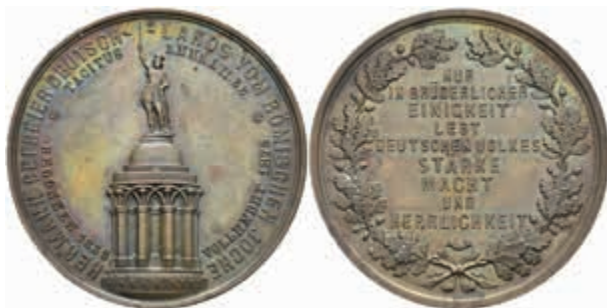
1278 Bronzemedaille (Dm. ca. 41,3mm, ca. 33,44g), 1875, von Bandel, auf die Vollendung des Hermannsdenkmals. Av: Ansicht des Denkmals, darum Umschrift. Rev: 9 Zeilen Schrift im Eichenlaubkranz. Kl. Rf., leichte Patina, vz-st. 30,—