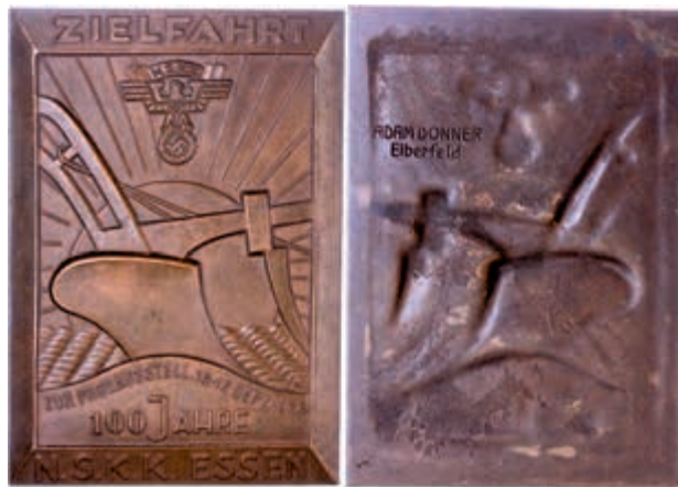
1414 Rechteckige Bronzeplakette (ca. 100,10 x 70,00mm, ca. 152,39g), von A. Donner. Av: Pflug, im Hintergrund strahlende Sonne, im Abschnitt darunter "ZUR PROV. AUSSTELLUNG 16.-17. SEP. 1933 / 100 JAHRE / N.S.K.K. ESSEN", darüber Wappen. Rev: Signatur. Vz. (Abbildung auf 59% verkleinert) 150,—