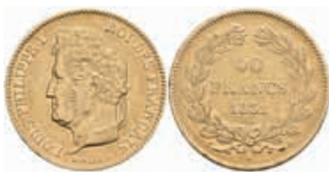
897 40 Francs, Gold, 1831, Louis Philippe I., Paris, Fb. 557, kl. Rf., ss+. 550,—