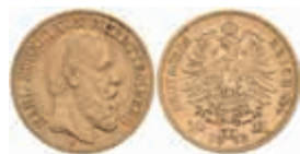
724 10 Mark, 1872, Karl, kl. Rf., ss. J. 289 220,—