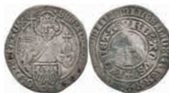
363 Turnosgroschen (1,79g), 1420, Menadier 117, etw. wellig, sehr schön. 150,—

Alle Einzellose und Zertifikate/Gutachten sind unter www.rhenumis.de farbig abgebildet! Dort sind auch 304 weitere Lose zu finden, die nicht im gedruckten Katalog, sondern nur im Internet zu finden sind!