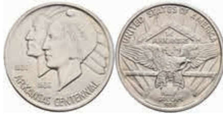
1194 1/2 Dollar, 1938, S, Arkansas, KM 168, vz-st. 150,—