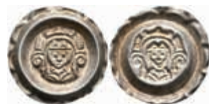
375 Brakteat (0,76g), Hartmann II., 1250-1286. Av: Brustbild des Bischofs zwischen zwei Krummstäben von vorn, darüber Bogen mit Zinnen und zwei Türmchen. Berger 2646, Slg. Bonhoff 1913, vz-st. 180,—