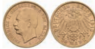
603 20 Mark, 1912, Friedrich II., wz. Rf., vz. J. 192 400,—