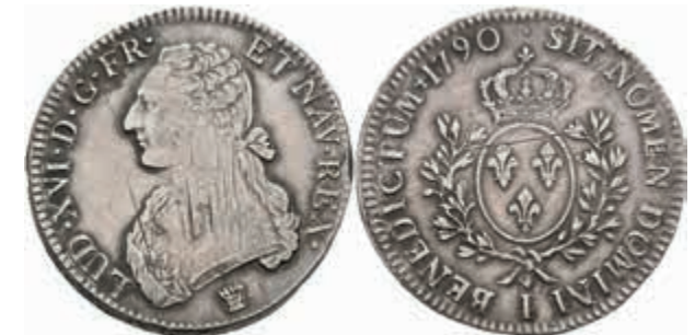
877 Ecu, 1790, Louis XVI., Limoges, Gadoury 356, justiert, ss+. 80,—

Alle Einzellose und Zertifikate/Gutachten sind unter www.rhenumis.de farbig abgebildet!