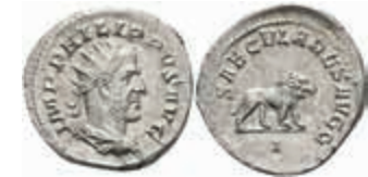
190 Philippus I. Arabs, 244-249, Antoninian (3,26g), Rom. Av: Büste nach rechts, darum Umschrift. Rev: Löwe nach rechts, darum "SAECVLARES AVGG". RIC 12, vz. 80,—