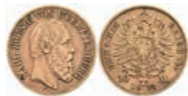
726 10 Mark, 1873, Karl, wz. Rf., ss. J. 289 220,—