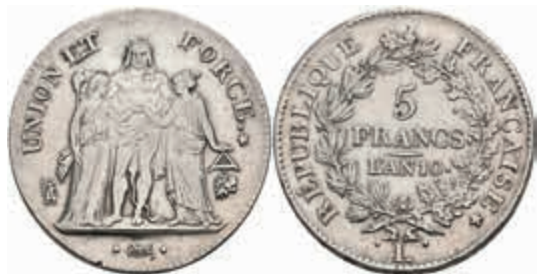
880 5 Francs, An 10 (1801/1802), Bayonne, Gadoury 563a, poliert, kl. Rf., ss. 180,—