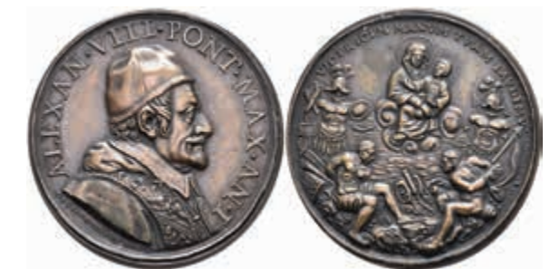
1299 Kirchenstaat, Alexander VIII., Bronzemedaille (Dm. ca. 39 mm, ca. 30,1 g), Jahr 1, 1689/90 (spätere Prägung), von Giuseppe Ortolani, auf die Sieghaftigkeit. Av: Brustbild nach rechts. Rev: Meeresufer mit zwei Tropaea