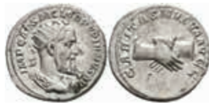
204 Pupienus, 238, Antoninian (4,15g), Rom. Av: Büste nach rechts, darum Umschrift. Rev: Zwei Hände im Handschlag, darum "CARITAS MVTVM AVGG". RIC 10b, etw. Belag, vz. 400,—