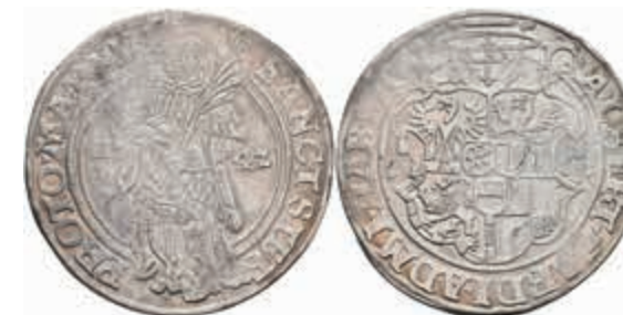
416 Taler, 1542, Albrecht II. von Brandenburg, Dav. 9210, ss+. 400,—

Goldmünzen ab 1800 sowie Goldbarren sind als Anlagegold ggf. umsatzsteuerfrei (auch für das Aufgeld), soweit der Zuschlagpreis inkl. Aufgeld und Losgebühr nicht höher als der Goldwert + 80% ist.