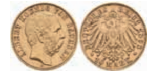
716 10 Mark, 1898, Albert, ss-vz. J. 263 280,—