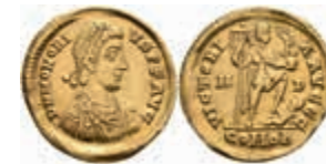
234 Honorius, 393-424, Solidus (4,47g), Mediolanum. Av: Büste nach rechts, darum Umschrift. Rev: Kaiser mit Viktoria und Labarum steht auf Gefangenen, darum Umschrift. RIC 1206, ss. 650,—