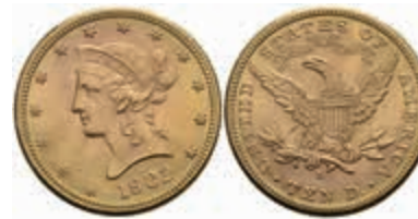
1073 10 Dollars, Gold, 1902, Liberty Head, San Francisco, Fb. 158, kl. Kratzer, vz-st. 700,—