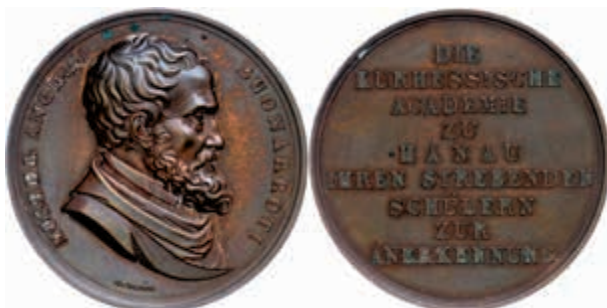
1280 Hessen-Kassel, Bronzemedaille (Dm. ca. 49mm, ca. 56,73g), o.J., von Voigt, Prämienmedaille für die 1. Klasse der Zeichenakademie zu Hanau. Av: Brustbild Buonarrotis nach rechts, darum Umschrift. Rev: 9 Zeilen Schrift. Etwas Belag, f. vz. Selten. (Abbildung auf 85% verkleinert) 250,—