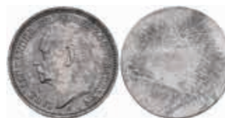
1241 Sachsen-Weimar-Eisenach, Carl Alexander, Stempelpatrize aus Eisen/Stahl (magnetisch) zu 20 Mark, J. 282. 14,98g, zaponiert, selten. 100,—