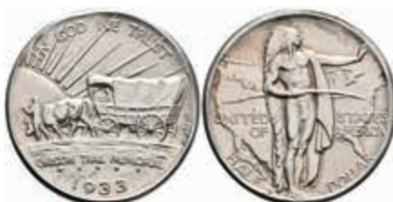
1110 1/2 Dollar, 1933, D, Oregon Trail, KM 159, wz. Kr., vz-st. 150,—