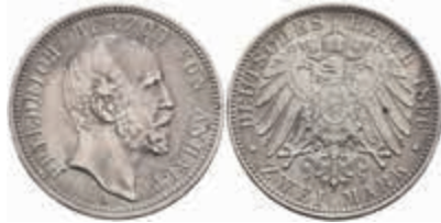
501 2 Mark, 1896, Friedrich I., Randfehler, ss+. J. 20 280,—