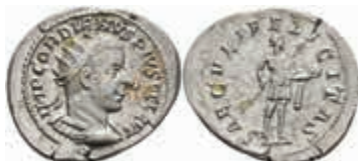
203 Gordianus III., 238-244, Antoninian (5,4g), Rom. Av: Büste nach rechts, darum Umschrift. Rev: Stehender Kaiser mit Speer und Globus nach rechts, darum "SAECVLI FELICITAS". RIC 216, ss. Sehr schweres Exemplar! 30,—