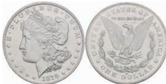
1058 Dollar, 1878, San Francisco, KM 110, Slab NNC MS65, wz. Kr., Avers f. st, Revers st. 70,—