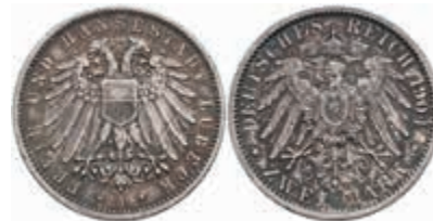
530 2 Mark, 1904, kl. Rf., f. vz. J. 81 80,—

Alle Einzellose und Zertifikate/Gutachten sind unter www.rhenumis.de farbig abgebildet! Dort sind auch 304 weitere Lose zu finden, die nicht im gedruckten Katalog, sondern nur im Internet zu finden sind!