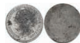
1232 Preußen, Wilhelm I., Stempelmatrize aus Eisen/Stahl (magnetisch) zu 5 Mark. 18,07g. Etwas korrodiert. 50,—