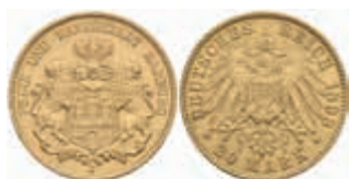
650 20 Mark, 1893, kl. Rf., vz. J. 212 400,—