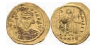
263 Phocas, 602-610, Solidus (4,30g), Konstantinopel. Av: Brustbild mit Kreuzglobus von vorn, darum Umschrift. Rev: Stehende Viktoria mit Kreuzglobus von vorn, darum Umschrift. Sear 620, Schürfspur, wellig, ss-vz. 350,—