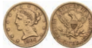
1074 5 Dollars, Gold, 1906, Philadelphia, Coronet Head, Fb. 145, kl. Rf., ss. 380,—