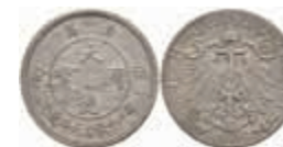
792 Kiautschou, 5 Cent, 1909, Avers f. ss, Revers ss-vz. J. N 729 80,—