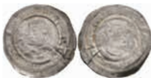
420 Brakteat (0,48g), Landfried, um 1170. Brustbild mit Krummstab nach links. Berger 2559 (Reichenau), Cahn 108a, Einriss, s-ss. 30,—