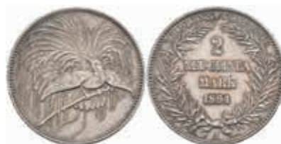
788 Neuguinea, 2 Mark, 1894, vz. J. N706 450,—