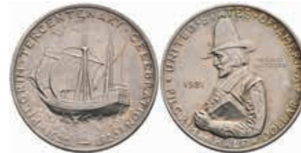
1089 1/2 Dollar, 1921, Pilgrim, KM 147.2, wz. Kr., Patina, f. st. 100,—