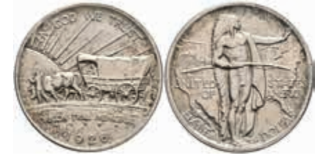
1102 1/2 Dollar, 1926, S, Oregon Trail, KM 159, f. st. 100,—