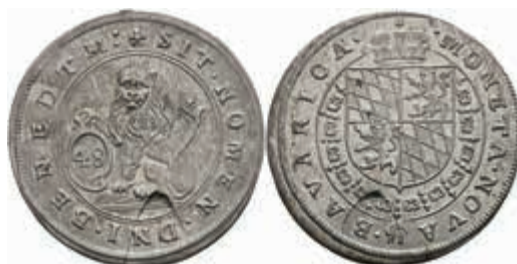
391 Kipper 48 Kreuzer (Zwölfbätzner), o.J. (1620/1621), Maximilian I., Hahn 74, Schrötlingsfehler, vz. 250,—