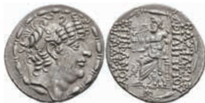
110 Tetrachme (15,48g), 93-83 v. Chr., Philip I. Philadelphos, unbestimmte Münzstätte in Kilikien. Av: Kopf nach rechts. Rev: Thronender Zeus Nikephoros mit Zepter nach links. SC 2461.5, ss. 300,—