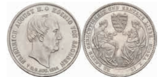
490 Taler, 1854, Friedrich August II., auf seinen Tod, AKS 117, J. 94, Kratzer/berieben, zaponiert, vz. 70,—