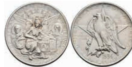
1113 1/2 Dollar, 1934, Texas, KM 167, vz. 70,—