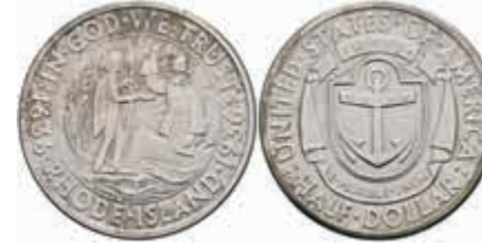
1163 1/2 Dollar, 1936, S, Rhode Island, KM 185, vz-st. 80,—