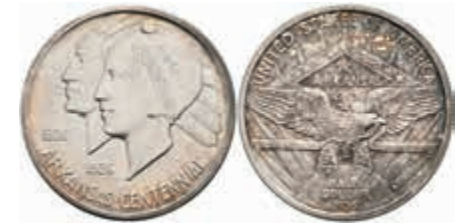
1126 1/2 Dollar, 1935, S, Arkansas, KM 168, Patina, st. 100,—