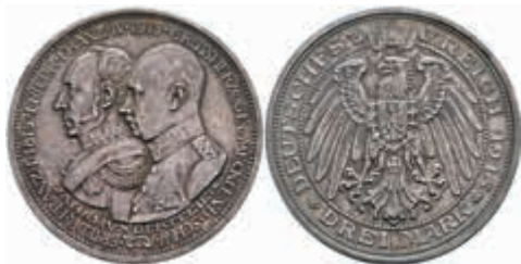
535 3 Mark, 1915, Friedrich Franz IV., auf die Jahrhundertfeier des Großherzogtums, kl. Rf., schöne Patina, vz. J. 88 150,—