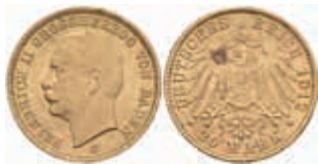
602 20 Mark, 1912, Friedrich II., kl. Kr., vz. J. 192 400,—

Alle Einzellose und Zertifikate/Gutachten sind unter www.rhenumis.de farbig abgebildet! Dort sind auch 304 weitere Lose zu finden, die nicht im gedruckten Katalog, sondern nur im Internet zu finden sind!