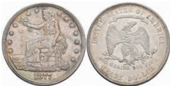
1056 Trade Dollar 1877, KM 108, kl. Rf., ss. 100,—