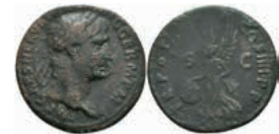
164 Traianus, 98-117, Kupfer As (9,43 g), dat. 100 n. Chr., Rom. Av: IMP CAES NERVA TRAIANVS AVG GERM P M. Büste des Traianus nach rechts mit Lorbeerkrantz und Paludamentresten auf beiden Schultern. Rev: TR POT