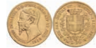
934 Sardinien, 20 Lire, Gold, 1858, Vittorio Emanuele II., Fb. 1147, kl. Rf., ss. 300,—