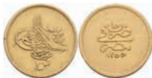
1038 100 Kurush, Gold, AH 1255/15, Abdülmecid, Randfehler, ss. 350,—