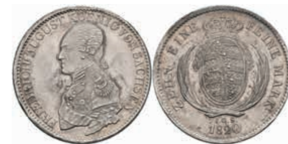
479 Taler, 1820, Friedrich August I., IGS, AKS 22, J. 30, kl. Rf., vz. 180,—