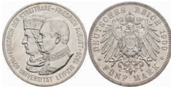
564 5 Mark, 1909, Friedrich August III., Universität Leipzig, kl. Kr., Randfehler, vz+. J. 139 130,—