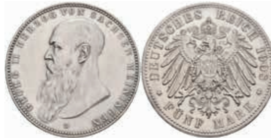
574 5 Mark, 1908, Georg II., kl. Rf., leicht berieben, zaponiert, ss-vz. J. 153b 100,—