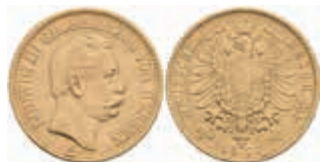
658 20 Mark, 1873, Ludwig III., ss. J. 214 400,—