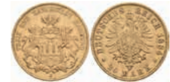
644 20 Mark, 1884, ss. J. 210. 400,—