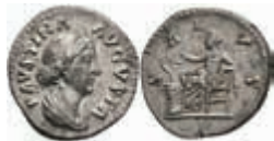
183 Faustina Junior, 147-175, Denar (2,81g). Av: Büste mit Diadem nach rechts, darum "FAVSTINA AVGVSTA". Rev: Salus nach rechts sitzend füttert um Altar gewundene Schlange, darum "SALVS". RIC 714 (Aurelius), ss-vz. 50,—