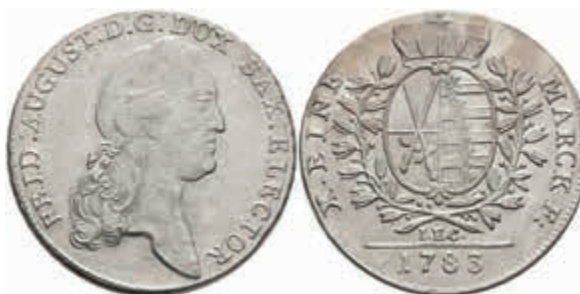
436 Taler, 1783, Friedrich August III., IEC, Dav. 2695, Schnee 1079, Kahnt 1081, ss-vz. 70,—