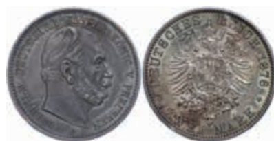
540 2 Mark, 1876, A, Wilhelm I., kräftige Patina, vz-st. J. 96 200,—