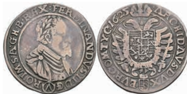
361 Taler, 1625, Ferdinand II., Wien, Voglhuber 154/IX, Dav. 3091, s-ss. 100,—