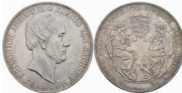
487 Doppeltaler, 1854, Friedrich August II., AKS 116, J. 96, kl. Rf., vz. 100,—