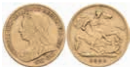
913 1/2 Sovereign, 1900, Victoria, Fb. 397, ss. 180,—