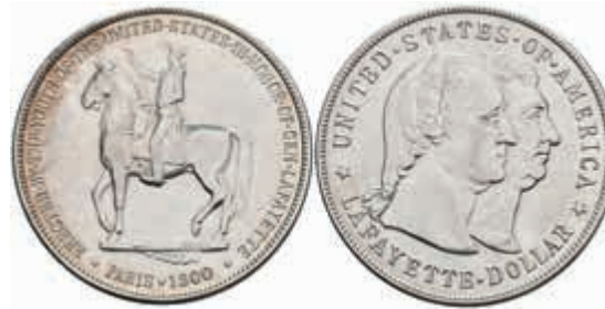
1071 Dollar, 1900, Lafayette-Dollar, KM 118, ss. 200,—