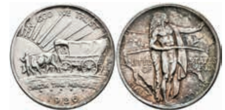
1103 1/2 Dollar, 1926, S, Oregon Trail, KM 159, wz. Rf., Patina, vz-st. 100,—