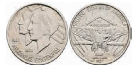
1175 1/2 Dollar, 1937, D, Arkansas, KM 168, kl. Kr., vz-st. 70,—