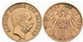
718 20 Mark, 1895, Albert, kl. Rf., ss. J. 264 400,—