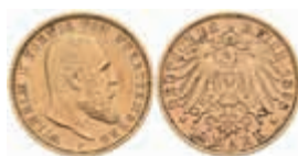
744 10 Mark, 1898, Wilhelm II., wz. Rf., ss+v. J. 295 220,—