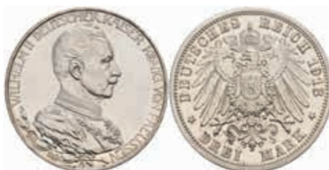
549 3 Mark, 1913, Wilhelm II., Regierungsjubiläum, Haarlinien, PP. J. 112 50,—