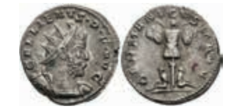
218 Gallienus, 256-259, Antoninian (3,87g), Lugdunum. Av: Büste nach rechts, darum Umschrift. Rev: Trophaeum, darunter zwei gefesselte Gefangene, darum "GERMANICVS MAX V". RIC 18, ss. 50,—