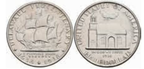
1150 1/2 Dollar, 1936, Delaware, KM 179, vz. 120,—