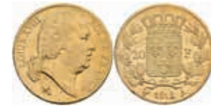
891 20 Francs, Gold, 1818, Louis XVIII., Paris, Fb. 538, Randfehler, justiert, ss+. 280,—