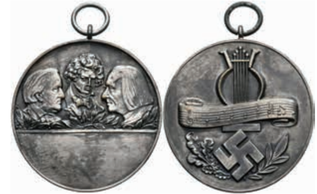
1420 Tragbare versilberte Bronzemedaille (Dm. ca. 49,8 mm, ca. 44,5 g), o.J., unsigniert. Av: Köpfe von Wagner, Beethoven und Liszt über Lorbeerzweigen. Rev: Lyra und Noten über Hakenkreuz vor Lorbeer- Eichenzweig. Kl. Rf., vz. Selten. (Abbildung auf 83% verkleinert) 100,—