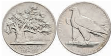
1119 1/2 Dollar, 1935, Connecticut, KM 169, kl. Kr., vz. 120,—