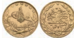
1042 100 Kurush, Gold, AH 1327/9, Mehmed V., Fb. 160, ss. 300,—