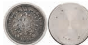
1233 Stempelmatrize aus Eisen/Stahl (magnetisch) zu 10 Mark 1906. 8,44 g. 70,—