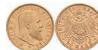
749 20 Mark, 1894, Wilhelm II., wz. Rf., vz. J. 296 400,—