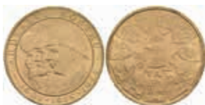
983 20 Lei, Gold, 1944, Michael I., auf die Wiedereingliederung Siebenbürgens, Fb. 21, vz. 350,—