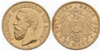
597 20 Mark, 1894, Friedrich I., kl. Rf., f. vz. J. 189 380,—