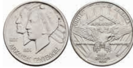
1121 1/2 Dollar, 1935, D, Arkansas, KM 168, vz. 70,—