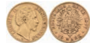
612 10 Mark, 1877, Ludwig II., ss. J. 196 220,—