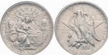
1167 1/2 Dollar, 1936, Texas, KM 167, NGC MS65. 120,—