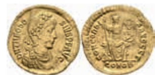
230 Theodosius I., 379-395, Solidus (4,38g), Constantinopel. Av: Büste nach rechts, darum Umschrift. Rev: Thronende Constantinopolis mit Zepter und Schild, darum Umschrift. RIC 70a, wellig, Randfehler, ss. 400,—