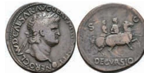
155 Nero, 54-68, Sesterz (23,31g), Lugdunum. Av: Büste nach rechts, darum Umschrift. Rev: Reitender Nero und Soldat nach rechts, darunter "DECVRGIO". Vgl. BMC 311, geglättet, ss. 300,—

Alle Einzellose und Zertifikate/Gutachten sind unter www.rhenumis.de farbig abgebildet!