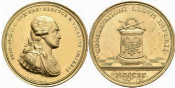
1259 Sachsen, Friedrich August III., vergoldete Silbermedaille (Dm. ca. 53,80mm, ca. 70,35g), 1790, von K.W. Hoekner, auf das Vikariat. Av: Büste nach rechts, darum Umschrift. Rev: Altar mit Insignien, Schwert, Zepter und Eichenkranz. Vgl. Slg Merseb. 1961, etwas Grünspan, vz. Mit Unterlegzettel des Sammlers. (Abbildung auf 77% verkleinert) 600,—