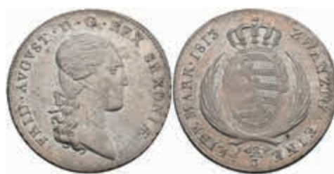
477 2/3 Taler, 1813, Friedrich August I., IGS, AKS 32, vz. 100,—

Alle Einzellose und Zertifikate/Gutachten sind unter www.rhenumis.de farbig abgebildet! Dort sind auch 304 weitere Lose zu finden, die nicht im gedruckten Katalog, sondern nur im Internet zu finden sind!