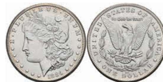
1066 Dollar, 1884, Carson City, KM 110, kl. Rf., wz. Kr., vz. 100,—