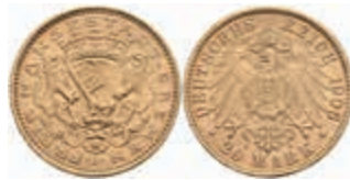
635 20 Mark, 1906, vz. J. 205 1700,—