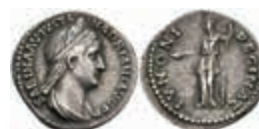
174 Sabina, 125-138, Denar (3,51g), Rom. Av: Kopf nach rechts, darum Umschrift. Rev: Juno mit Patera und Zepher steht nach links, darum "IVNONI REGINAE". RIC 401a, ss. 120,—