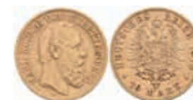
734 10 Mark, 1878, Karl, Randfehler, ss. J. 292 200,—