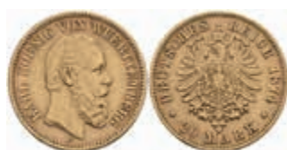
738 20 Mark, 1874, Karl, Randfehler, ss. J. 293 350,—