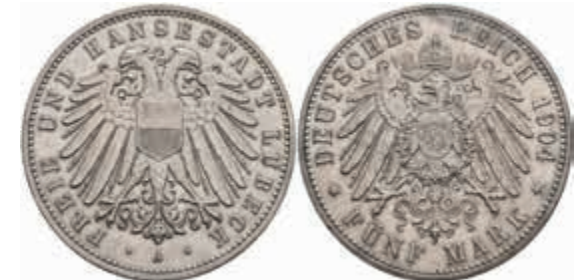
533 5 Mark, 1904, kl. Rf., zaponiert, vz. J. 83 250,—