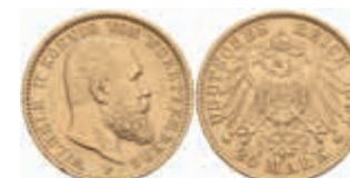
750 20 Mark, 1897, Wilhelm II., wz. Rf., ss-vz. J. 296 350,—