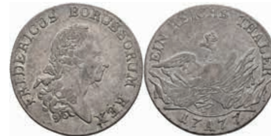
414 Taler, 1777, Friedrich II., Berlin, Olding 70, Dav. 2590, ss. 100,—