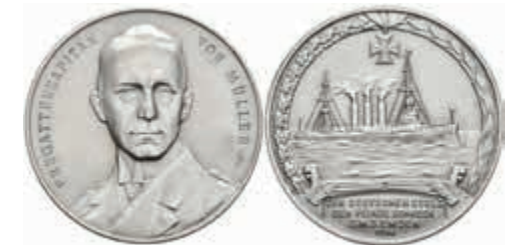
1387 Silbermedaillen (Dm. ca. 33,20mm, ca. 17,90g), 1914, von Lauer, auf den Fregattenkapitän Karl von Müller. Av: Brustbild von vorn, darum Umschrift. Rev: Ansicht des Kreuzers Emden, darunter Tafel mit 4 Zeilen Schrift. Rand punziert, vz. 50,—