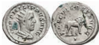
194 Philippus I. Arabs, 244-249, Antoninian (5,29g), Rom. Av: Büste nach rechts, darum Umschrift. Rev: Löwe nach rechts, darum "SAECULARES AVGG". RIC 12, ss-vz. 80,—