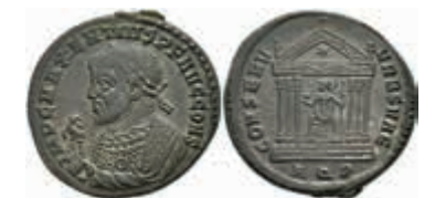
227 Maxentius, 307-310, Follis (6,98g), Aquileia. Av: Büste nach links, darum Umschrift. Rev: Sitzende Roma in Tempel, darum "CONSERV-VRB SVAE". RIC 124, ss-vz. 80,—