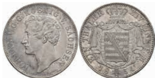
492 Taler, 1854, Johann, AKS 128, J. 97, kl. Rf., ss-vz. 50,—