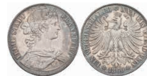
467 Taler, 1860, AKS 8, J. 41, kl. Rf., f. vz. 50,—