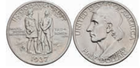
1174 1/2 Dollar, 1937, Boone, KM 165.2, wz. Kr., vz-st. 80,—