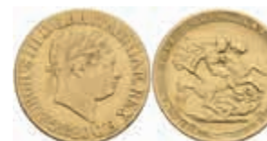
909 1 Sovereign, 1820, George III., Fb. 371, kl. Rf., ss. 700,—