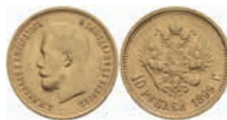
988 10 Rubel, Gold, 1899, Nikolaus II., St. Petersburg, Fb. 179, kl. Rf., ss. 400,—