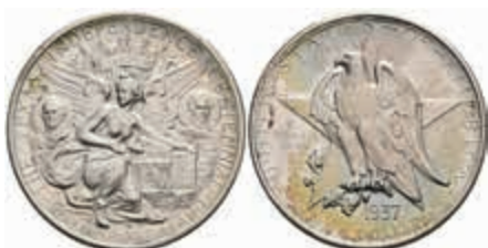
1178 1/2 Dollar, 1937, D, Texas, KM 167, f. st. 120,—