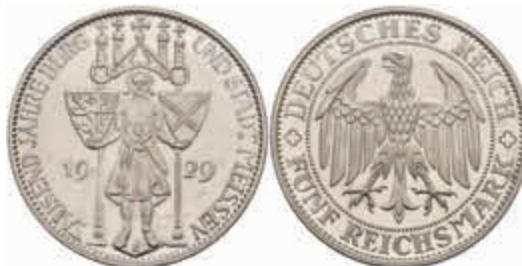
774 5 Reichsmark, 1929, Meissen, kl. Kr., PP. J. 339 350,—