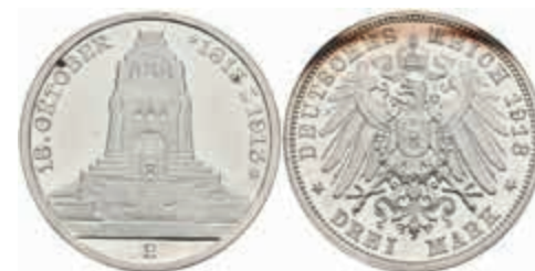
566 3 Mark, 1913, Völkerschlachtdenkmal, wz. Kratzer, PP. J. 140 100,—