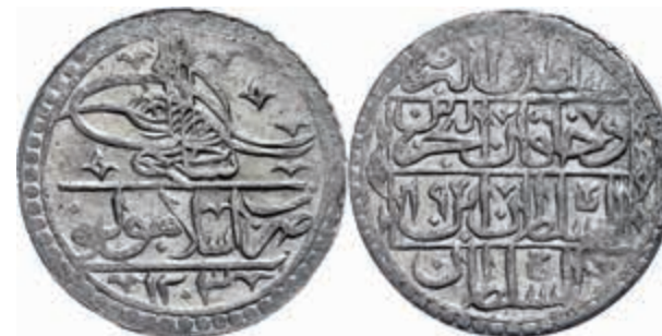
1032 Yüzlük, AH 1203/19, Selim III., Konstantinopel, KM 507, kl. Schrötungsfehler, leichte Prägeschwäche, f. vz. Los 1278 der 154. Auktion Numismatik Lanz, München, 2012. 400,—