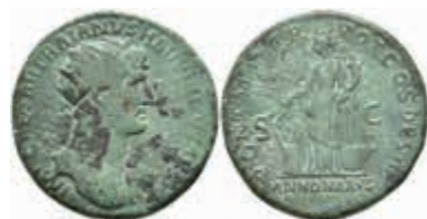
171 Hadrianus, 117-138, Dupondius (13,31g), dat. 119-120 n. Chr., Rom. Av: IMP CAESAR TRAIANVS - HADRIANVS AVG. Büste des Hadrianus nach rechts mit Strahlenkrone und Paludamentrest auf der linken Schulter. Rev: PONT MAX T - R POT COS III // ANNONA AVG; S - C. Annona steht nach links, hält Getreideähren und Cornucopiae (Füllhorn), links: Modius, rechts: Prora. RIC II, 570; Str II, 522. schöne grüne Patina stellenweise schwarz, ss-f. vz. 250,—