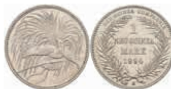
787 Neuguinea, 1 Mark, 1894, zaponiert, f. vz J. N 705 150,—