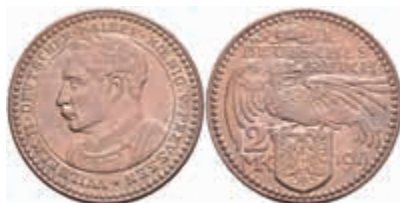
1247 Preußen, 2 Mark, 1913, Probe, Kupfer, Wilhelm II., von. K. Goetz, Schaaf 111 G3, ss-vz. 50,—