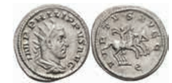
193 Philippus I. Arabs, 244-249, Antoninian (3,83g), Rom. Av: Büste nach rechts, darum Umschrift. Rev: Philippus I und Philippus II. auf Pferden nach rechts, darum "VIRTVS AVGG". RIC 10, ss-vz. 50,—