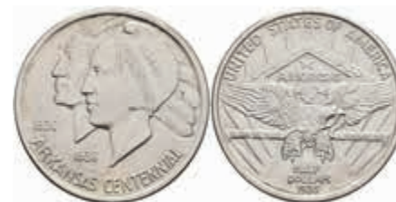
1115 1/2 Dollar, 1935, Arkansas, KM 168, f. st. 100,—