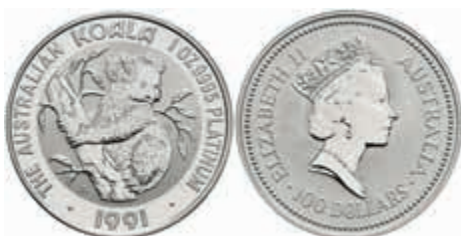
816 100 Dollars, Platin, 1991, Koala, KM 149, st. 800,—