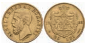
981 20 Lei, Gold, 1883, Karl I., Fb. 3, kl. Rf., ss. 400,—