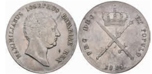
447 Taler, 1814, Maximilian I. Joseph, AKS 44, J. 14, kl. Schrötlingsfehler, ss-vz. 90,—