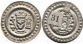
441 Brakteat (0,35g), Friedrich II., 1215-1250. Königskopf zwischen Blütenzweigen und Turm von vorn. Berger 2598, Cahn 186, st. 150,—