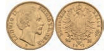
609 20 Mark, 1873, Ludwig II., ss. J. 194 380,—