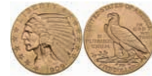
1078 5 Dollars, Gold, 1909, Denver, Indian Head, Fb. 151, vz. 400,—