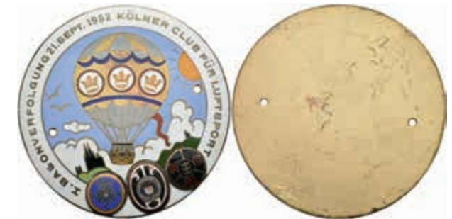
1422 Köln, einseitige emaillierte Bronzeplakette (Dm. ca. 81,0 mm, ca. 85,0 g), 1952, unsigniert, auf die erste Ballonverfolgung des Kölner Clubs für Luftsport am 21. September 1952. Av: Fliegender Heißluftballon, darunter 3 Wappen. 2 Befestigungslöcher, vz. (Abbildung auf 52% verkleinert) 80,—