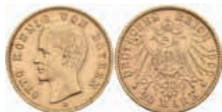
624 20 Mark, 1900, Otto, kl. Rf., ss-vz. J. 200 370,—