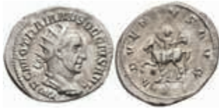
212 Trajanus Decius, 249-251, Antoninian (3,25g), Rom. Av: Büste nach rechts, darum Umschrift. Rev: Der Kaiser zu Pferd nach links, darum "ADVENTVS AVG". RIC 11, ss. 50,—