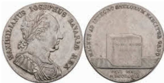
450 Taler, 1818, Maximilian I. Joseph, AKS 59, J. 15, Revers leicht berieben, vz. 200,—