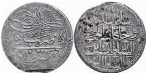
1024 Kurus, AH 1143, Mahmud I., Gümüşhane, KM 212, Prägeschwäche und Schrötungsfehler, Zainende, ss. Selten! 240,—