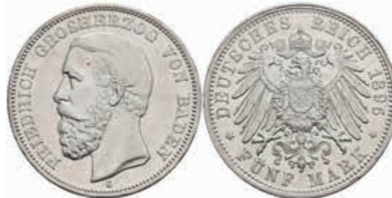
506 5 Mark, 1895, Friedrich I., kl. Kr. und Rf., vz-st. J. 29 700,—