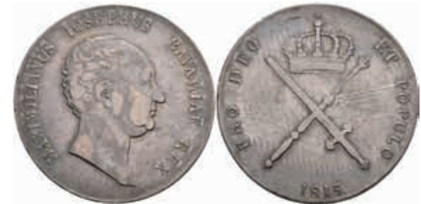
449 Taler, 1815, Maximilian I. Joseph, AKS 44, J. 14, kl. Kratzer, schöne Patina, ss. 80,—

Alle Einzellose und Zertifikate/Gutachten sind unter www.rhenumis.de farbig abgebildet! Dort sind auch 304 weitere Lose zu finden, die nicht im gedruckten Katalog, sondern nur im Internet zu finden sind!