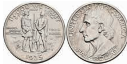
1123 1/2 Dollar, 1935, D, Boone, KM 165.2, kl. Rf., f. st. 150,—