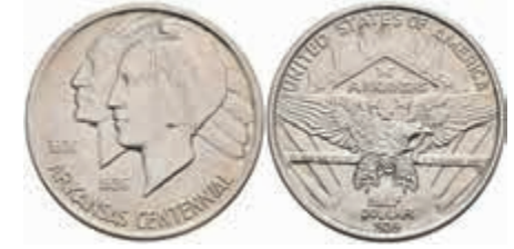
1199 1/2 Dollar, 1939, Arkansas, KM 168, Avers vz-st, Revers st. 180,—