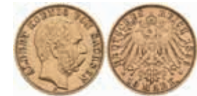
714 10 Mark, 1893, Albert, ss. J. 263 250,—