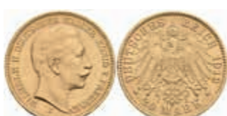
691 20 Mark, 1912, J, Wilhelm II., wz. Rf. und Kr., vz+. J. 252 400,—