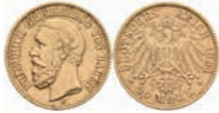
598 20 Mark, 1894, Friedrich I., kl. Rf., ss-vz. J. 189 370,—