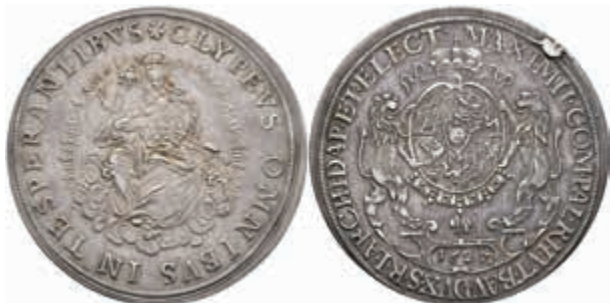
397 Taler, 1627, Maximilian I., Dav. 6075, Hahn 111, Stempelfehler, vz. Mit altem Unterlegzettel. (Abbildung auf 91% verkleinert) 500,—