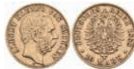
708 10 Mark, 1888, Albert, kl. Rf., ss. J. 261 250,—