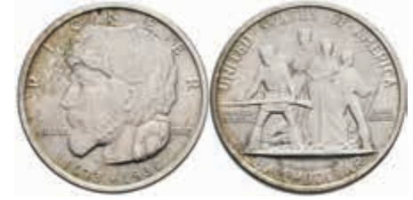
1151 1/2 Dollar, 1936, Elgin, KM 180, vz-st. 100,—