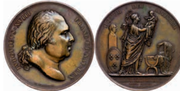
1325 Frankreich, Louis XVIII., Bronzemedaille (Dm. ca. 50 mm, ca. 70,52g), 1820, von Andrieu, auf die Geburt des Prinzen Heinrich von Bourbon. Av: Büste nach rechts, darum Umschrift. Rev: Gallia hebt Neugeborenen aus der Krippe. Kl. Rf., ss-vz. (Abbildung auf 83% verkleinert) 150,—