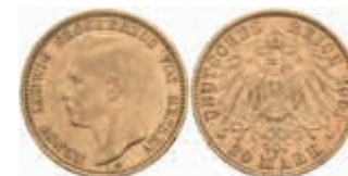
664 20 Mark, 1898, Ernst Ludwig, kl. Rf., ss. J. 225 450,—