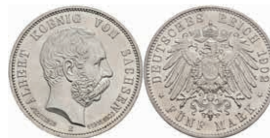
556 5 Mark, 1902, Albert, auf seinen Tod, wz. Rf. und kl. Kratzer, vz-st. J. 128 150,—

Goldmünzen ab 1800 sowie Goldbarren sind als Anlagegold ggf. umsatzsteuerfrei (auch für das Aufgeld), soweit der Zuschlagpreis inkl. Aufgeld und Losgebühr nicht höher als der Goldwert + 80% ist.