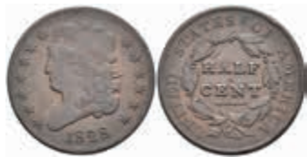
1052 1/2 Cent, 1828, Variante mit 13 Sternen, KM 41, kl. Rf., ss. 50,—