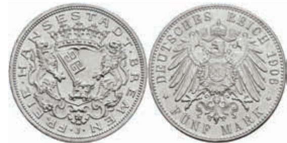
522 5 Mark, 1906, kl. Rf., gereinigt, st. J. 60 200,—