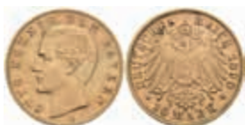
619 10 Mark, 1890, Otto, ss. J. 199 220,—