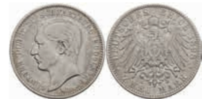
580 2 Mark, 1898, Günther Viktor, ss, J. 167. 220,—