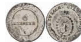
499 6 Kreuzer, 1806, Friedrich, AKS 151, Prägeschwäche, Stempelfehler, ss. Selten. 50,—