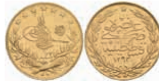
1041 100 Kurush, Gold, AH 1293/32, Abdülhamid II., kl. Rf., ss. 300,—

Dort sind auch 304 weitere Lose zu finden, die nicht im gedruckten Katalog, sondern nur im Internet zu finden sind!