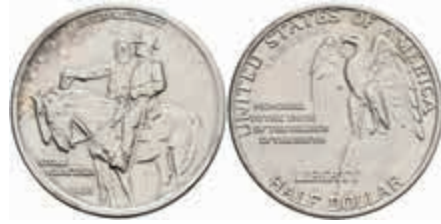
1098 1/2 Dollar, 1925, Stone Mountain, KM 157, vz-st. 30,—