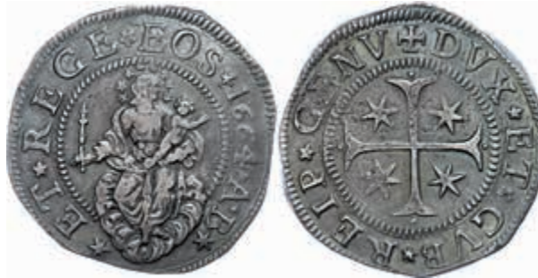
929 Genua, Scudo, 1664, Dav. 3901, ss-vz. 700,—