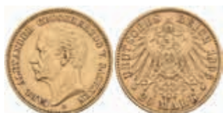
723 20 Mark, 1896, Carl Alexander, wz. Rf., ss-vz. J. 282 2800,—