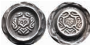
347 Schongau, Brakteat (0,76g), Konradin, 1258-1268. Brustbild des Königs umgeben von Ranken. Berger 2681, vz. 150,—