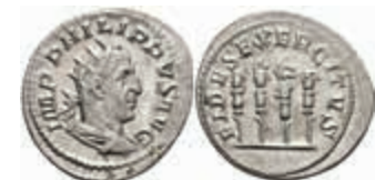
191 Philippus I. Arabs, 244-249, Antoninian (3,56g), Rom. Av: Büste nach rechts, darum Umschrift. Rev: Vier Standarten, darum "FIDES EXERCITVS". RIC 62, f. vz. 50,—