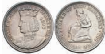
1069 1/4 Dollar, 1893, Isabel I., KM 117, wz. Rf., kl. Kr., vz. 120,—