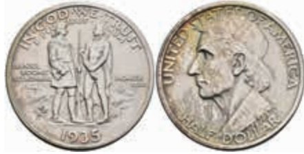
1117 1/2 Dollar, 1935, Boone, KM 165.1, wz. Kr., f. st. 80,—