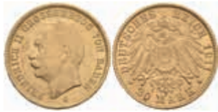
601 20 Mark, 1911, Friedrich II., kl. Kr. und Rf., f. vz. J. 192 350,—