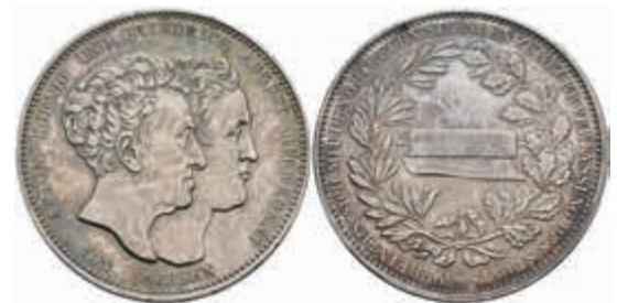
484 Taler, 1831, Anton, auf die Verfassung vom 4. September, AKS 84, J. 65, kl. Rf., vz. 100,—

Goldmünzen ab 1800 sowie Goldbarren sind als Anlagegold ggf. umsatzsteuerfrei (auch für das Aufgeld), soweit der Zuschlagpreis inkl. Aufgeld und Losgebühr nicht höher als der Goldwert + 80% ist.