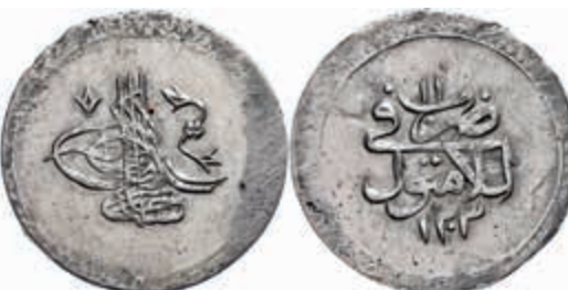
1031 Kurus, AH 1203/11, Selim III., Konstantinopel, KM 498, Prägeschwäche am Rand, ss. Selten! 110,—