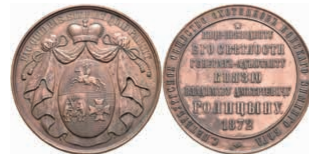
1349 Russland, Bronzemedaille (Dm. ca. 64,5mm, ca. 106,73g), 1872, von A. Semenov, auf die Freunde der Gesellschaft der Winter-Pferdereitenden, gewidmet ihrem Vizepräsidenten, dem Fürsten Vladimir Dmitrievich Golitsin. Av: Wappen auf bekröntem Wappenmantel. Rev: 7 Zeilen Schrift. Diakov 786.1, vz. (Abbildung auf 64% verkleinert) 200,—

Vergoldet (abgegriffen), Randfehler, ss. (Abbildung auf 81% verkleinert) 70,—