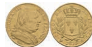
889 20 Francs, Gold, 1815, Louis XVIII., Paris, Fb. 525, kl. Rf., ss. 250,—