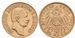
722 20 Mark, 1905, Friedrich August III., wz. Rf., f. vz. J. 268 400,—