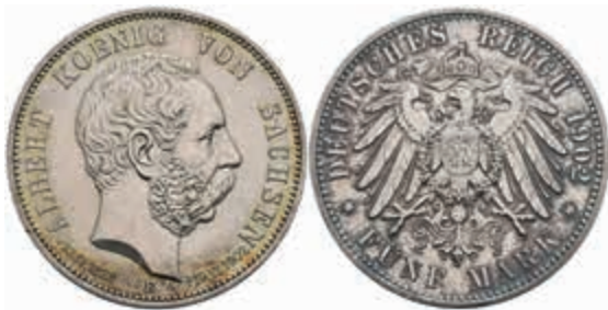
557 5 Mark, 1902, Albert, auf seinen Tod, wz. Rf., vz-st. J. 128 180,—