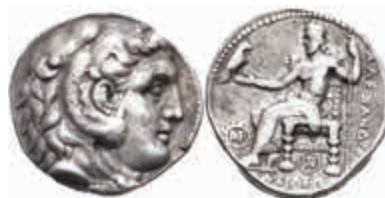
19 Tetradrachme (16,99g), 336-323 v. Chr., Alexander III., Babylon. Av: Herakleskopf mit Löwenfell nach rechts. Rev: Thronender Zeus nach links. Price 3733/3734, ss. 300,—