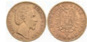
610 10 Mark, 1875, Ludwig II., kl. Kr., ss. J. 196 220,—