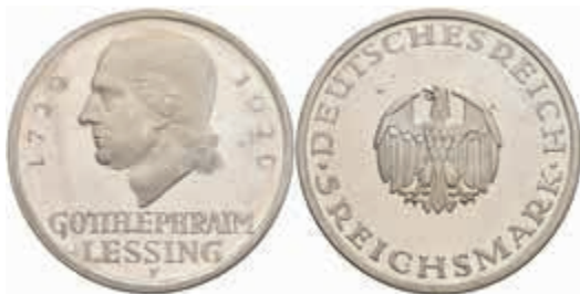
770 5 Reichsmark, 1929, F, Lessing, zaponiert, PP. J. 336 300,—