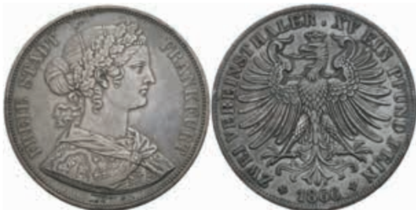
470 Doppeltaler, 1866, AKS 4, J. 43, kl. Rf., dunkle Patina, ss-vz 100,—