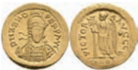
238 Zeno, 474-491, Solidus (4,45g), Konstantinopel. Av: Büste mit Schild und Speer von vorn, darum Umschrift. Rev: Stehende Victoria mit Gemmenkreuz nach links, darum Umschrift. RIC 911, ss-vz. 550,—