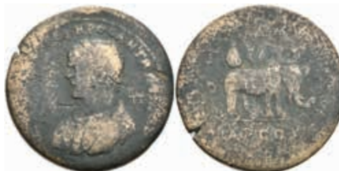
247 Kilikien, Tarsus, Æ (16,42g), Caracalla, 198-217. Av: Büste nach links, darum Umschrift. Rev: Elefant nach rechts, darum Umschrift. SNG Levante-, SNG von Aulock -, McClean 9116, gering erhalten. 50,—