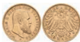
747 10 Mark, 1904, Karl, kl. Rf., ss-vz. J. 295 200,—