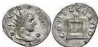
196 Trajanus Decius, 235-270, Antoninian (2,32g), Rom. Av: Kopf nach rechts, darum "DIVO TITO". Rev: Altar, darum "CONSECRATIO". RIC 81b, vz. 100,—