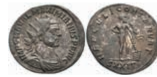
224 Maximianus I. Herculus, 286-305, Antoninian (3,78g), Ticinium. Av: Büste nach rechts, darum Umschrift. Rev: Stehender Hercules mit Keule und Löwenfell nach rechts, darum "HERCVLI CONSERVAT / SXXIT". RIC 545, ss-vz. 50,—