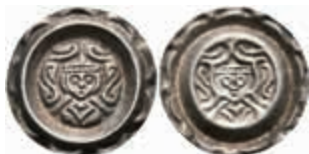
344 Schongau, Brakteat (0,75g), Konradin, 1258-1268. Brustbild des Königs umgeben von Ranken. Berger 2681, vz. 150,—