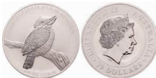
822 30 Dollars, 2010, Kookaburra, 1 Kilo Silber, in Kapsel, st. (Abbildung auf 41% verkleinert) 700,—