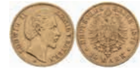
611 10 Mark, 1875, Ludwig II., ss. J. 196 220,—