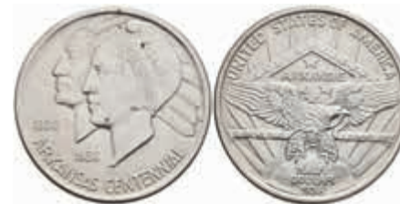
1185 1/2 Dollar, 1938, Arkansas, KM 168, Avers vz-st. Revers st. 150,—