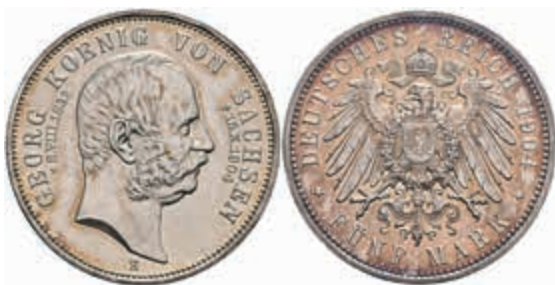
559 5 Mark, 1904, Georg, auf seinen Tod, wz. Kr. und kl. Rf., f. st. J. 133 200,—