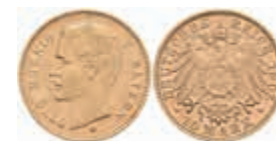
629 10 Mark, 1905, Otto, vz. J. 201 240,—