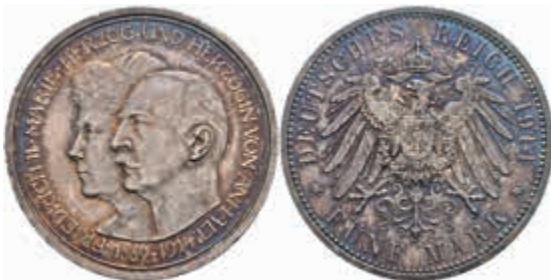
504 5 Mark, 1914, Friedrich II., auf die Silberne Hochzeit, kl. Kr., kl. Rf., schöne Patina, vz. J. 25 150,—