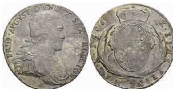
475 Taler, 1806, Friedrich August III., SGH, Dav. 850, Kratzer, ss. 80,—