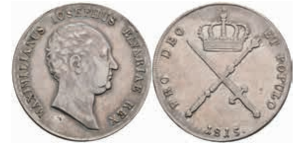
448 Taler, 1815, Maximilian I. Joseph, AKS 44, J. 14, Randfehler, ss. 80,—