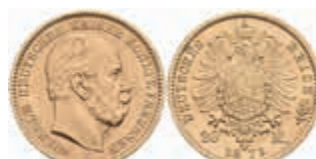
675 20 Mark, 1873, C, Wilhelm I., kl. Rf., vz. J. 243 350,—