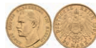
662 20 Mark, 1893, Ernst Ludwig, kl. Rf., ss-vz. J. 223 2200,—