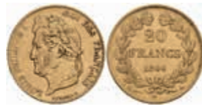
899 20 Francs, Gold, 1844, Louis Philippe I., Paris, Fb. 560, ss. 280,—