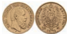
725 10 Mark, 1873, Karl, ss-vz. J. 289 180,—