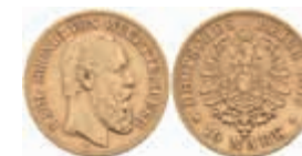
731 10 Mark, 1875, Karl, ss. J. 292 220,—