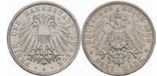
531 3 Mark, 1908, kl. Kratzer, vz., J. 82. 120,—

Alle Einzellose und Zertifikate/Gutachten sind unter www.rhenumis.de farbig abgebildet! Dort sind auch 304 weitere Lose zu finden, die nicht im gedruckten Katalog, sondern nur im Internet zu finden sind!