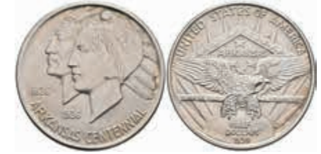
1200 1/2 Dollar, 1939, D, Arkansas, KM 168, Avers f. st, Revers st. 200,—