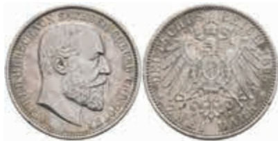
570 2 Mark, 1895, Alfred, ss. J. 145 300,—