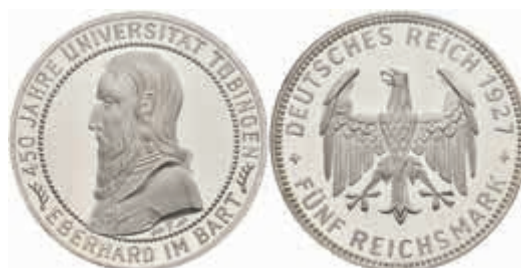
761 5 Reichsmark, 1927, Tübingen, wz. Kratzer, PP. J. 329 400,—