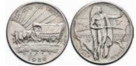
1101 1/2 Dollar, 1926, Oregon Trail, KM 159, kl. Rf., vz-st. 100,—