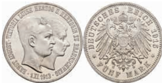
519 5 Mark, 1915, Ernst August, zum Regierungsantritt, ohne Lüneburg, kl. Rf., kl. Kratzer, zaponiert, vz-st. J. 56 1200,—