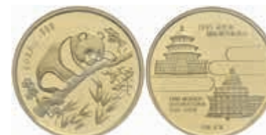
861 1/2 oz Gold, 1995, Internationale Münzmesse München, Panda, in Originalschatulle mit Zertifikat, verschleißt, PP. Auflage nur 1500 Exemplare! 750,—