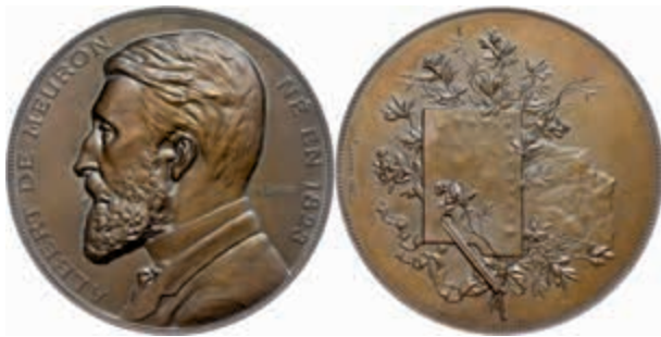
1359 Schweiz, Bronzemedaille (Dm. ca. 69,00mm, ca. 187,02g), 1887, von F. Landry, auf den Maler Albert de Meuron. Av: Büste nach links, darum Umschrift. Rev: Farbmischpalette vor Zweigen und Berg. Rand punziert, st. (Abbildung auf 60% verkleinert) 150,—