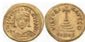
260 Tiberius II. Constantinus, 578-582, Solidus (4,50g), Konstantinopel. Av: Brustbild mit Schild und Kreuzglobus von vorn, darum Umschrift. Rev: Kreuz auf vier Stufen, darum Umschrift. Sear 422, etw. wellig, ss. 400,—