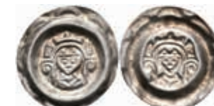
379 Brakteat (0,79g), Hartmann II., 1250-1286. Av: Brustbild des Bischofs zwischen zwei Krummstäben von vorn, darüber Bogen mit Zinnen und zwei Türmchen. Berger 2646, Slg. Bonhoff 1913, vz. 120,—