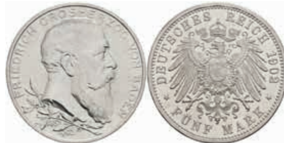
507 5 Mark, 1902, Friedrich I., zum Regierungsjubiläum, kl. Kratzer, vz-st. J. 31 120,—