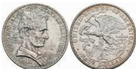
1081 1/2 Dollar, 1918, Illinois-Lincoln, KM 143, wz. Kr., st. 150,—