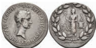
239 Augustus, ca. 28 v. Chr., Cistophor (11,88g), Ephesus. Av: Kopf nach rechts, darum Umschrift. Rev: Stehende Pax mit Caduceus, davor "PAX", dahinter Cista Mystica, darum Lorbeerkranz. RIC 476, BMC 691, ss. 600,—