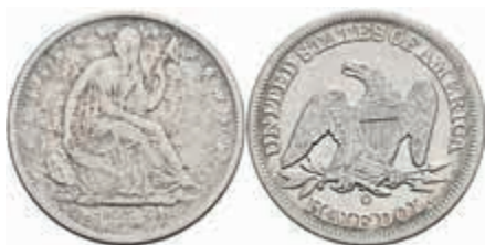
1054 1/2 Dollar, 1858, New Orleans, KM A68, ss. 50,—