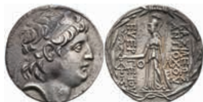
108 Tetrachme (16,39g), Antiochos VII., 130-80, posthum, Kappadokien. Av: Kopf nach rechts. Rev: Stehende Athena nach links. SC 2148, Hornsilber, ss. 150,—