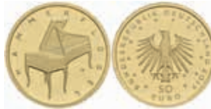
805 50 Euro, Gold, 2019, D, Hammerflügel, in Ausgabeschatulle, mit Zertifikat, in Kapsel, st. J. 641. 400,—