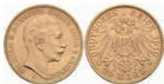
690 20 Mark, 1910, J, Wilhelm II., vz. J. 252 380,—