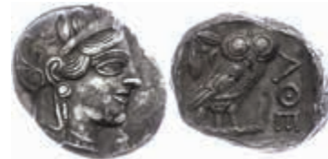
41 Athen, Tetradrachme (17,16g), ca. 403-365 v. Chr., Av: Athenekopf mit attischem Helm nach rechts, Rev: Eule nach rechts, dahinter Ölweig und Mondsichel, davor "AOE". Svoronos Pl. 15, Schürfspuren, ss-vz. 500,—