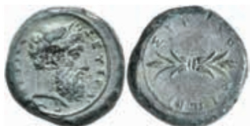
15 Syrakus, Æ-Hemidrachme (15,19g), ca. 367-344 v. Chr. Av: Zeuskopf nach rechts. Rev: Blitzbündel. SNG ANS 470/471, ss-vz. 150,—