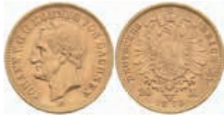
700 20 Mark, 1873, Johann, kl. Rf., ss+-. J. 258 400,—