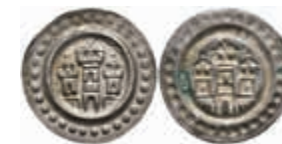
429 Brakteat (0,42g), nach 1250. Dreitürmige Burg. Berger 2549, ss-vz. 130,—