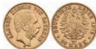
711 20 Mark, 1876, Albert, kl. Rf., ss. J. 262 400,—