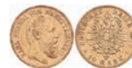
735 10 Mark, 1879, Karl, ss. J. 292 300,—