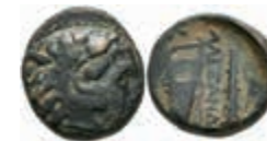
23 Tarsos, Bronze (6,01g) ca. 327 - 323 v. Chr., Alexander III. der Große (336 - 323 v. Chr.), Av: Kopf des jugendlichen Herakles mit Löwenfell rechts. Rev: Keule über Bogen in Köcher, darüber Weintraube neben. Price 3029, Müller 1539, ss+. 50,—