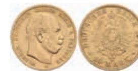
680 10 Mark, 1875, A, Wilhelm I., kl. Rf., ss. J. 245 180,—