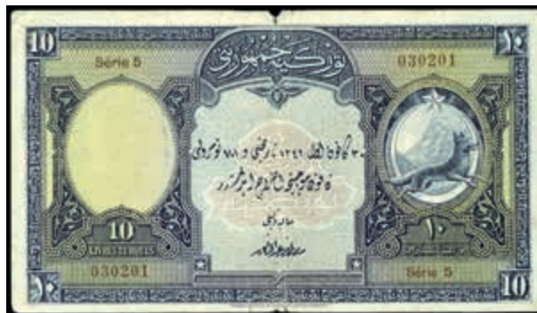
1672 Türkei, 10 Livres Turques, AH 1341 (1926) Druck: TDLR, London. Pick 121a, Erh. III. (Abbildung auf 47% verkleinert) 300,—