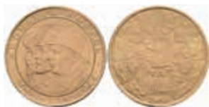
982 20 Lei, Gold, 1944, Michael I., auf die Wiedereingliederung Siebenbürgens, Fb. 21, vz-st. 300,—