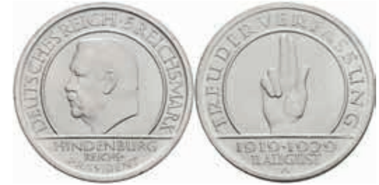
775 5 Reichsmark, 1929, A, Schwurhand, wz. Rf., vz-st. J. 341 70,—