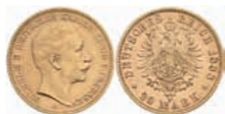
686 20 Mark, 1888, Wilhelm II., wz. Rf., ss-vz. J. 250 350,—