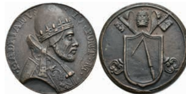
1290 Kirchenstaat, Hadrian IV., Bronzegussmedaille (Dm. ca. 45,5 mm, ca. 43,9 g), o.J., unsigniert. Av: Brustbild nach rechts. Rev: Wappen. Vz. (Abbildung auf 91% verkleinert) 30,—