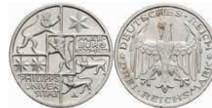
762 3 Reichsmark, 1927, Marburg, Zaponlackreste, wz. Rf., f. st. J. 330 50,—