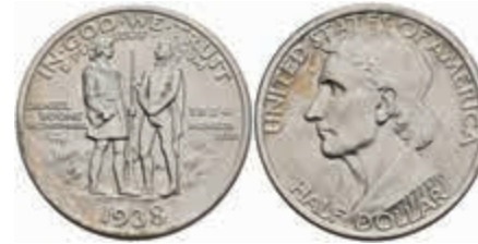
1186 1/2 Dollar, 1938, Boone, KM 165.2, kl. Kr., f. st. 150,—