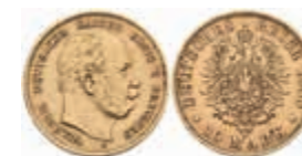
682 10 Mark, 1888, A, Wilhelm I., ss. J. 245 200,—