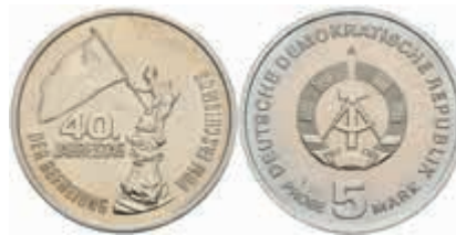
807 5 Mark, o.J. (1985), 40. Jahrestag Sieg über den Faschismus, Motivprobe "Fahnen Schwinger", mit eingepunzter Seriennummer 102, winzige Kratzer, st. Auflage nur 300 Exemplare! Sehr selten! J. 1603 P5 3000,—