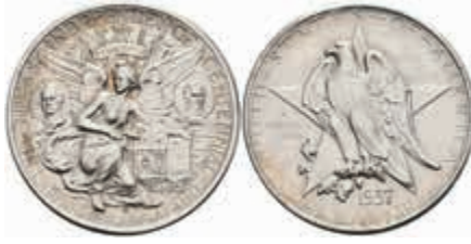
1183 1/2 Dollar, 1937, S, Texas, KM 167, vz-st. 100,—