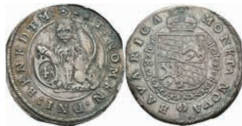
392 Kipper 48 Kreuzer (Zwölfbätzner), o.J. (1620/1621), Maximilian I., Hahn 74, ss. Mit altem Unterlegzettel. 200,—