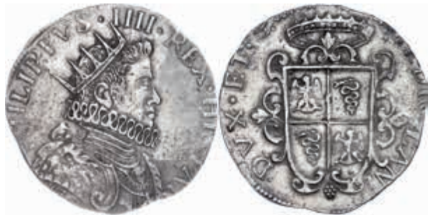
928 Mailand, Ducaton, 1630, Filippo IV., Dav. 4001, vz. 750,—