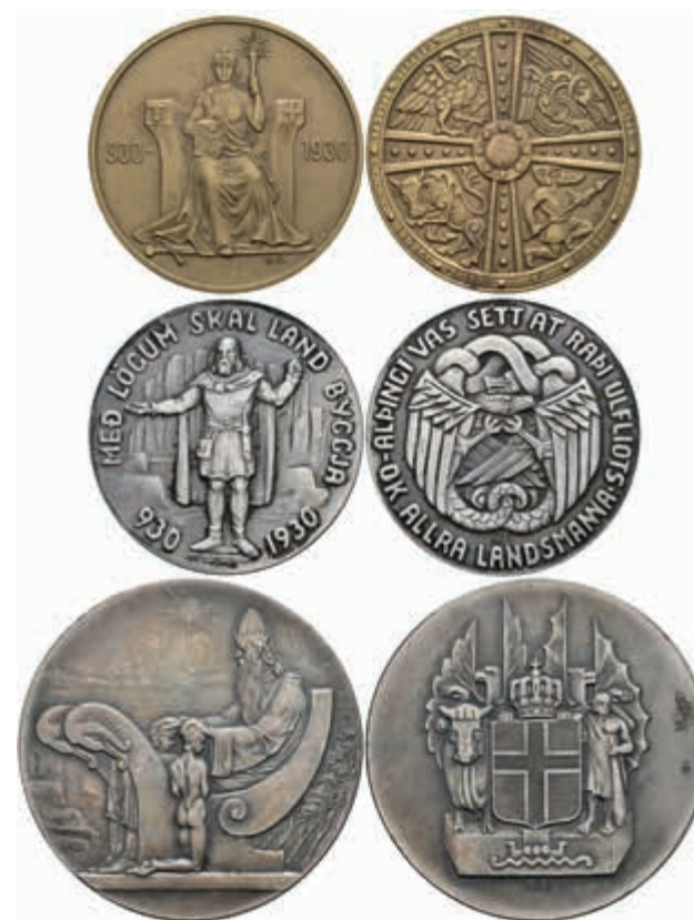
922 Set zu 2, 5 und 10 Kronur, 1930, 1000 Jahre Isländisches Parlament, staatliche Medaillen, in Ausgabeetui, st. (Abbildung auf 93% verklei- nert) 250,—