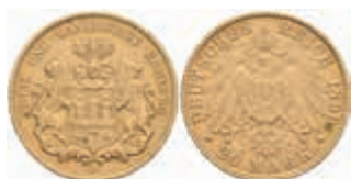
654 20 Mark, 1899, wz. Rf., ss. J. 212 380,—