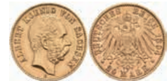
717 20 Mark, 1894, Albert, ss-vz. J. 264 450,—