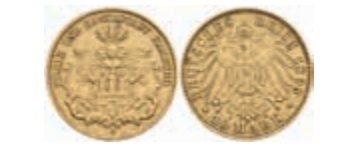
646 10 Mark, 1890, ss. J. 211 220,—