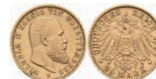
751 20 Mark, 1897, Wilhelm II., wz. Rf., ss. J. 296 350,—