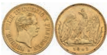
472 Friedrichs d'or, 1842, Friedrich Wilhelm IV., AKS 63, J. 112, ss-vz. 1500,—