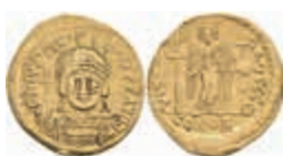
256 Justinianus I., 527-565, Solidus (3,93g), Konstantinopel. Av: Büste mit Kreuzglobus von vorn, darum Umschrift. Rev: Stehende Victoria mit Christogrammstab und Kreuzglobus von vorn, darum Umschrift. Sear 140, ss. 400,—