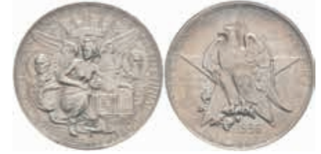
1149 1/2 Dollar, 1936, D, Texas, KM 167, PCGS MS65. 120,—