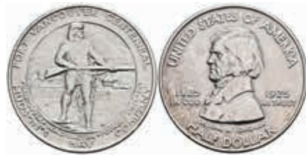
1099 1/2 Dollar, 1925, Vancouver, KM 158, kl. Rf., vz-st. 150,—