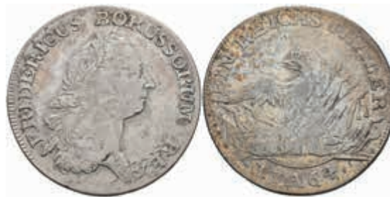
413 Taler, 1764, A, Friedrich II., Dav. 2586, Olding 69 a, kl. Schrötlingsfehler, f. ss. 50,—