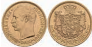
865 20 Kronen, Gold, 1912, Frederik VIII., Fb. 297, Kratzer, vz. 380,—