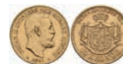
1007 10 Kronen, Gold, 1901, Oskar II., Fb. 94b, ss-vz. 180,—