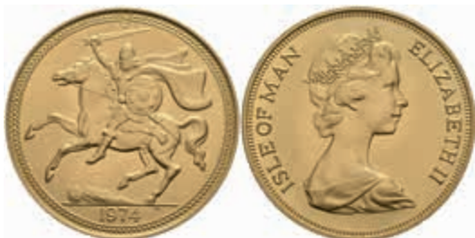
914 Isle of Man, 5 Pounds, Gold, 1974, st. 1900,—