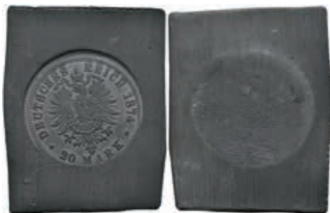
1236 Kaiserreich, Abschlag eines Reversstempels zu 20 Mark, 1874, auf Bleiblech. 15,89g. 30,—