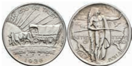
1155 1/2 Dollar, 1936, Oregon Trail, KM 159, st. 150,—