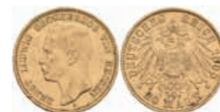
663 20 Mark, 1898, Ernst Ludwig, kl. Kr. und Rf., ss-vz. J. 225 500,—