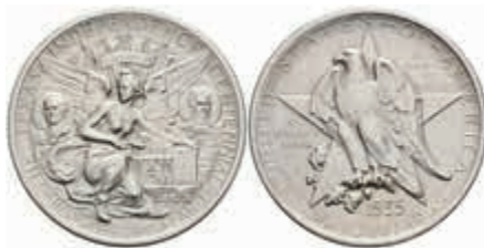
1133 1/2 Dollar, 1935, Texas, KM 167, st. 130,—