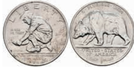
1096 1/2 Dollar, 1925, California, KM 155, st. 150,—