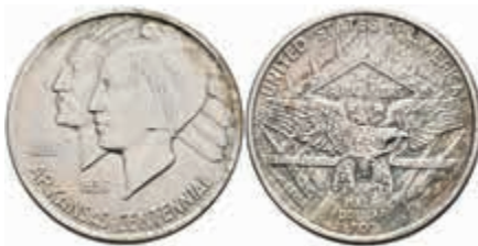
1181 1/2 Dollar, 1937, S, Arkansas, KM 168, vz. 70,—