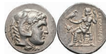
26 Tetradrachme (16,90g), 280-275 v. Chr., posthum, Alexander III., Parium. Av: Herakleskopf mit Löwenfell nach rechts. Rev: Thronender Zeus nach links, daneben Ochsenkopf. Price 1459, ss. Selten! 700,—