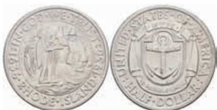
1156 1/2 Dollar, 1936, Rhode Island, KM 185, vz. 50,—