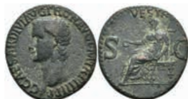
148 Caligula, 37-41, As (10,59g), Rom. Av: Kopf nach links, darum Umschrift. Rev: Thronende Veste mit Zepter und Patera nach links, darum "VESTA SC". RIC 54, geglättet, ss. 200,—