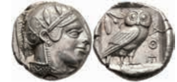
40 Athen, Tetradrachme (17,20g), ca. 415 v. Chr. Av: Athenekopf mit attischem Helm nach rechts. Rev: Eule nach rechts, dahinter Ölweig und Mondsichel. Svoronos Tf. 13, Nr. 3-11, vz. Aus einer rheinischen Privatsammlung. Los 165 der 193. Auktion Münz Zentrum Rheinland, 2021, Solingen. 750,—