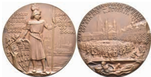
1394 Bronzemedaille (Dm. ca. 87,80mm, ca. 171,68g), 1918, von K. Goetz, Ausrufung der deutschen Republik in Köln. Av: Stehender Soldat mit Speer und Schild, im Hintergrund Stadtansicht mit Dom. Rev: Szene der Ausrufung auf dem Neumarkt, darüber Schrift, darunter Flussgott. Kienast 275, vz. (Abbildung auf 47% verkleinert) 250,—