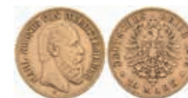
732 10 Mark, 1876, Karl, ss. J. 292 220,—