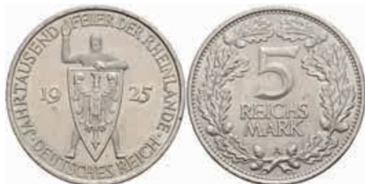
756 5 Reichsmark, 1925, A, Rheinlande, kl. Rf., vz. J. 322 60,—