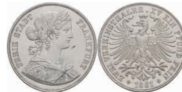
468 Doppeltaler, 1861, AKS 4, J. 43, kl. Rf., berieben, vz+. 100,—