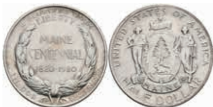
1082 1/2 Dollar, 1920, Maine, KM 146, bearbeitete Stelle, vz. 50,—