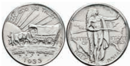
1108 1/2 Dollar, 1933, D, Oregon Trail, KM 159, f. st. 150,—