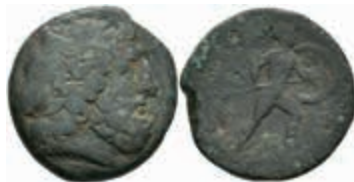
18 Messana, Bronze (9,43g), um 200 v. Chr. Av.: Zeuskopf nach rechts. Rev.: Ares schreitet mit Schild und Speer nach rechts, SNG München 732 BMC 25, f. ss. 50,—