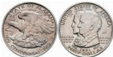
1084 1/2 Dollar, 1921, Alabama, KM 148.1, Variante mit 2*2, wz. Rf., vz-st. 250,—