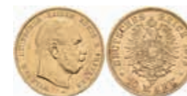
681 10 Mark, 1875, A, Wilhelm I., kl. Rf., vz. J. 245. 250,—