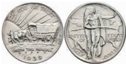
1201 1/2 Dollar, 1939, D, Oregon Trail, KM 159, st. 300,—