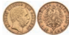
709 10 Mark, 1888, Albert, ss. J. 261 320,—