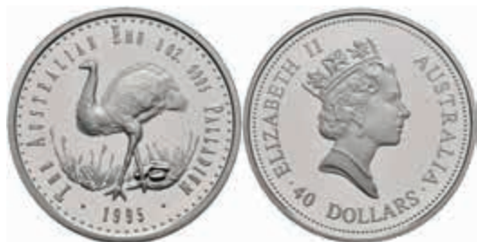
817 40 Dollars, Palladium, 1995, Emu, 31,1g fein, KM 313, mit Zertifikat in Ausgabeschatulle, PP. Auflage 2500 Stück! (Abbildungen siehe Onlinekatalog) 2200,—