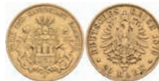
642 20 Mark, 1879, wz. Rf., ss, seltener Jahrgang! J. 210 450,—