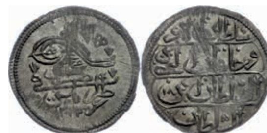
1035 40 Para, AH 1223/18, Mahmud II., Tripolis, KM 186.1 (Libyen), stark justiert, vz. Sehr selten! Erworben bei Baldwins & Sons, London. Davor Los 1847 der 210. Auktion "The Sultan Collection Part II", Fritz Rudolf Künker, Osnabrück, 2012. 500,—

Goldmünzen ab 1800 sowie Goldbarren sind als Anlagegold ggf. umsatzsteuerfrei (auch für das Aufgeld), soweit der Zuschlagpreis inkl. Aufgeld und Losgebühr nicht höher als der Goldwert + 80% ist.