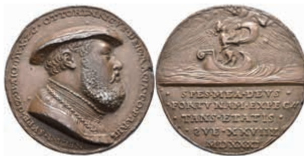
1252 Pfalz-Neuburg, Otto Heinrich, bronzierte Bleigussmedaille (Dm. ca. 42,20mm, ca. 34,87g), 1531. Büste mit Hut nach rechts, darum Umschrift.

Rev: Fortuna mit Segel in Boot nach rechts, im Abschnitt darunter 5 Zeilen Schrift. Slg. Memmesheimer 2828, Randfehler, ss. (Abbildung auf 97% verkleinert) 200,—