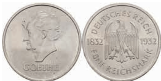
780 5 Reichsmark, 1932, A, Goethe, Kratzer, kl. Rf., vz. J. 351 1500,—