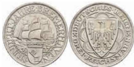
757 3 Reichsmark, 1927, Bremerhaven, kl. Rf., vz+. J. 325 50,—