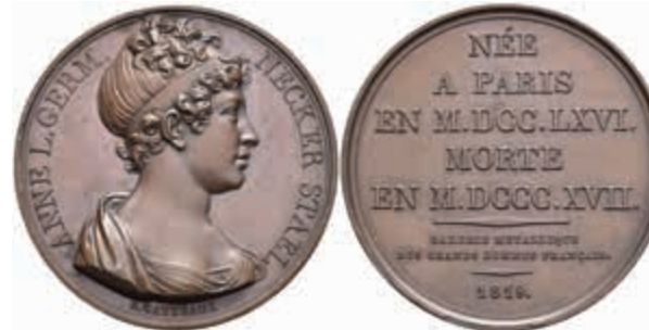
1324 Frankreich, Bronzemedaille (Dm. ca. 41 mm, ca. 37,51g), 1819, auf Germaine de Stael. Av: Büste nach rechts, darum Umschrift. Rev: 8 Zeilen Schrift. Slg. Julius 3852, Wurzbach 8516, vz. 30,—