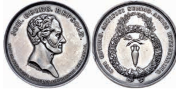
1266 Hamburg, versilberte Bronzemedaille (Dm. ca. 43mm, ca. 43,44g), 1830, von Alsing, auf den Tod von Johann Georg Repsold. Av: Kopf nach rechts, darum Umschrift. Amphore im doppelten Kranz, darum Umschrift. Wz. Rf., vz-st. 300,—