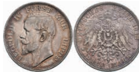
527 3 Mark, 1913, Leopold IV., kl. Rf., ss-vz. J. 79 280,—