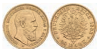
685 20 Mark, 1888, Friedrich III., kl. Rf., ss+. J. 248 350,—