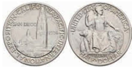
1144 1/2 Dollar, 1936, D, California-Expo, KM 171, wz. Rf., vz-st. 70,—