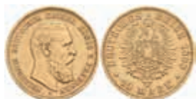
684 10 Mark, 1888, Friedrich III., ss, J. 247. 200,—