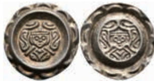
346 Schongau, Brakteat (0,76g), Konradin, 1258-1268. Brustbild des Königs umgeben von Ranken. Berger 2681, vz-st. 400,—