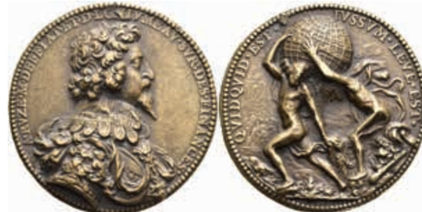
1297 Frankreich, Louis XIII., Bronzegussmedaille (Dm. ca. 65,30mm, ca. 100,61g), 1630 (späterer Anfertigung?), unsign. (J. Warin?), auf Antoine Ruzé, Marquis d'Effiat et de Longjumeau (1581-1632). Av: Brustbild nach rechts, darum Umschrift. Rev: Atlas mit der geschulterten Weltkugel nach links, dahinter Herkules, darum Umschrift. Kl. Einriss/gestopftes Loch, ss. (Abbildung auf 63% verkleinert) 150,—