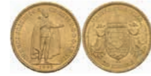
1048 20 Kronen, Gold, 1893, Franz Joseph I., Fb. 250, vz+. 300,—