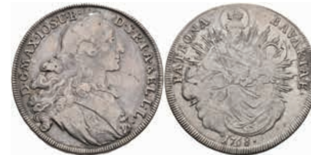
404 Taler, 1768, Maximilian III. Joseph, Hahn 307, justiert, ss. 50,—