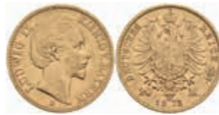
607 20 Mark, 1872, Ludwig II., kl. Rf., ss. J. 194 380,—