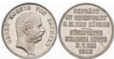
558 Silber-Gedenkmünze in 2 Mark Größe, 1903, Georg, auf den Besuch der Münze durch den König, üblicher Stempelriss, kl. Kratzer, zaponiert, vz-st. J. 131 700,—