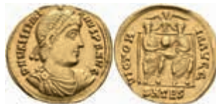
229 Valentinianus I., 364-367, Solidus (4,44g), Thessalonika. Av: Büste nach rechts, darum Umschrift. Rev: Valentinianus und Valens thronen mit Globus nebeneinander, darüber geflügelte Victoria, darum "VICTOR - IA AVGG - SMTES". RIC 4b1, ss. 800,—