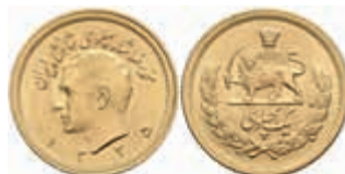
919 1 Pahlavi, Gold, 1956 (1335 SH), Mohammed Reza Pahlavi, Fb. 101, f. st. 380,—