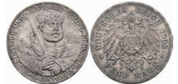
579 5 Mark, 1908, Wilhelm Ernst zur 350-Jahrfeier der Universität Jena, kl. Rf., vz-st. J. 161 200,—