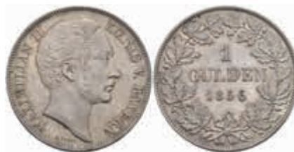
463 Gulden, 1856, Maximilian II., AKS 151, J. 82, ss-vz. 60,—