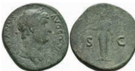
176 Hadrianus, 134-138 n. Chr., Bronze Sesterz (29,12g) dat. 134-138, Rom. Av: HADRIANVS - AVG COS III P P. Büste des Hadrianus nach rechts mit Lorbeerkrone. Rev: S - C. Diana steht nach links, hält Pfeil und Bogen. RIC II, 777d; Str II, 702, ss. 80,—

Goldmünzen ab 1800 sowie Goldbarren sind als Anlagegold ggf. umsatzsteuerfrei (auch für das Aufgeld), soweit der Zuschlagpreis inkl. Aufgeld und Losgebühr nicht höher als der Goldwert + 80% ist.