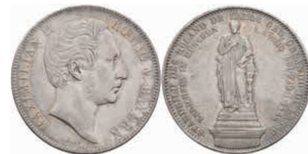
457 Geschichtsdoppeltaler, 1849, Maximilian II., Standbild Orlando di Lasso, AKS 165, J. 88, ss. 900,—