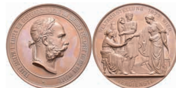
1351 Österreich, Bronzemedaille (Dm. ca. 70,4 mm, ca. 138,68g), 1873, von J. Tautenhayn und K. Schwenzer, Verdienstmedaille der Weltausstellung in Wien. Av: Kopf Kaiser Franz Josefs I. nach rechts. Rev: Stehende Fortuna mit Füllhorn reicht Frau mit Fortuna mit Füllhorn reicht einer Frau mit Spinnrocken ein einem Arbeiter Lorbeerkränze. Kl. Rf., vz-st. (Abbildung auf 60% verkleinert) 50,—