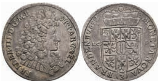
411 2/3 Taler, 1692, Friedrich III., LCS, Dav. 270, kl. Schrötlingsfehler und Kratzer, ss-vz. 80,—