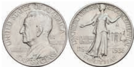
1153 1/2 Dollar, 1936, Lynchburg, KM 183, vz-st. 120,—