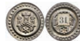
430 Brakteat (0,52g), nach 1250. Torbogen mit Zinnturm und zwei kleineren Türmen, darin ein Stern. Berger 2551, vz. 150,—

Alle Einzellose und Zertifikate/Gutachten sind unter www.rhenumis.de farbig abgebildet!