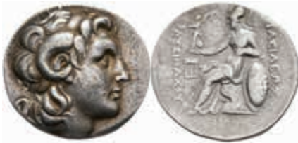
30 Tetradrachme (16,12g), Lysimachos, ca. 280 v. Chr. Av: Alexanderkopf mit Diadem und Ammonshorn nach rechts. Rev: Sitzende Athena Nikephoros nach links. Ss. Mit Unterlegzettel 350,—