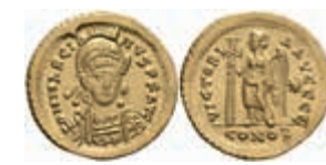
236 Marcianus, 450-457, Solidus (4,46g), Constantinopel. Av: Büste mit Schild und Speer von vorn, darum Umschrift. Rev: Stehende Victoria mit Langkreuz nach links, rechts im Feld ein Stern, darum Umschrift. RIC 505, ss-vz. 1000,—