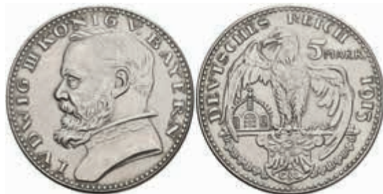
1246 Bayern, 5 Mark, 1913, Probe, Silber, Ludwig III., von. K. Goetz, Schaaf 53 G1, 25,2g, 2,6mm dick, wz. Rf., vz. 120,—