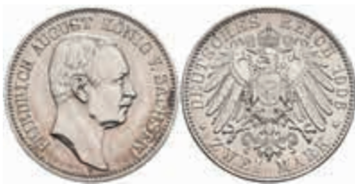
560 2 Mark, 1906, Friedrich August III., kl. Rf., vz-st. J. 134 80,—