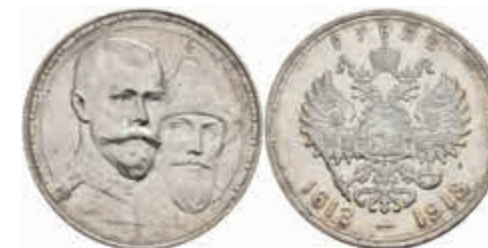
990 Rubel, 1913, Nikolaus II., St. Petersburg, 300 Jahre Romanov Dynastie, Bitkin 336, kl. Rf. und Kratzer, vz-st. 70,—