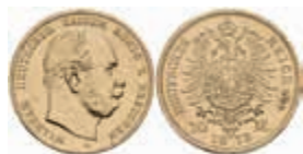
668 10 Mark, 1872, A, Wilhelm I., kl. Kr., kl. Rf., vz-st. J. 242. 200,—