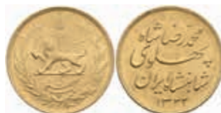
918 1 Pahlavi, Gold, 1943 (SH 1322), Mohammed Reza Pahlavi, Fb. 97, Schrötlingsfehler am Rand, kl. Rf., vz. 350,—