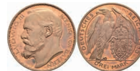
1244 Bayern, 3 Mark, 1913, Probe, Bronze, Ludwig III., von. K. Goetz, Schaaf 52 G1, PP. 100,—