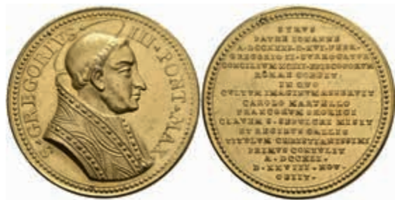
1305 Kirchenstaat, Gregor III., vergoldete Bronze- Jesuitenmedaille (Dm. ca. 38 mm, ca. 21,6 g), o.J. (1712), von Vestner bei Lauffer, auf den Heiligen Gregor III. Av: Brustbild mit Heiligenschein nach rechts. Rev: 17 Zeilen Schrift. Lauffer 92, Bernh. 557, kl. Rf., vz-st. 150,—