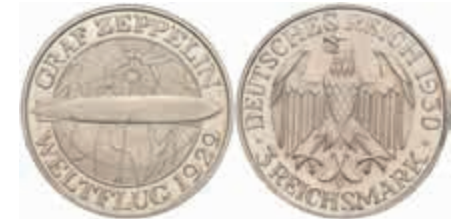
776 3 Reichsmark, 1930, A, Zeppelin, kl. Kratzer, PP. J. 342 100,—