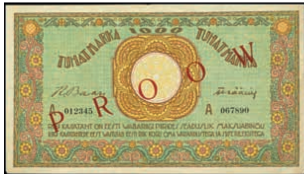
1650 Estland, Eesti Vabariigi, 1000 Marka, o. D (1920-21), Probe, Ser. A 012345/ A 067890, einseitiger Druck mit rotem Überdruck RROOV, P 50p, Erh. II. (Abbildung auf 42% verkleinert) 350,—