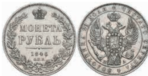
984 Rubel, 1846, Nikolaus I., St. Petersburg, Bitkin 208, kl. Rf., ss-vz. 60,—