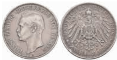
525 2 Mark, 1898, Ernst Ludwig, Randfehler, ss. J. 72 250,—