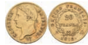
887 20 Francs, Gold, 1812, Napoleon I., Lille, Fb. 512, kl. Rf., ss. 300,—