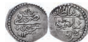
1033 1/4 Budju, AH 1205, Selim III., KM 44 (Algerien), Prägeschwäche am Rand, ss. 140,—