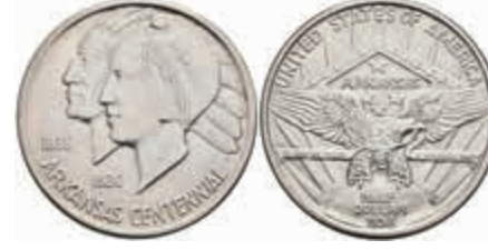
1187 1/2 Dollar, 1938, D, Arkansas, KM 168, vz. 120,—