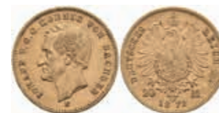
698 20 Mark, 1872, Johann, kl. Rf., ss. J. 258 400,—