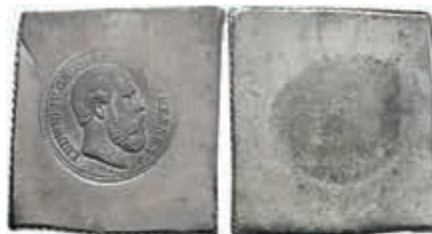
1239 Hessen, Ludwig IV., Abschlag des Aversstempels zu 20 Mark, 1890, J. 220, auf Zinnblech. 12,99g, Prägeschwäche, selten. 70,—