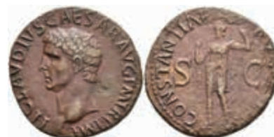
151 Claudius, 41-54, As (10,33g), Rom. Av: Kopf nach links, darum Umschrift. Rev: Stehende Constantia mit Speer nach links, darum Umschrift. RIC 95, geglättet, ss-vz. 80,—