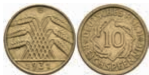
755 10 Reichspfennig, 1931, G, ss. J. 317. 100,—