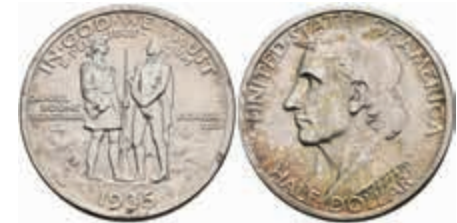
1127 1/2 Dollar, 1935, S, Boone, KM 165.1, f. st. 120,—