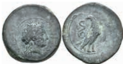
17 Herbessos, Æ-Dilitron (17,75g), ca. 340-335 v. Chr. Av: Kopf der Sikelia nach rechts. Rev: Adler nach rechts, dahinter eine Schlange. SNG ANS -, SNG Cop. -, ss. 200,—