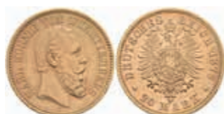
740 20 Mark, 1876, Karl, wz. Rf., vz. J. 293 450,—