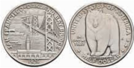
1166 1/2 Dollar, 1936, San Francisco, KM 174, vz-st. 80,—