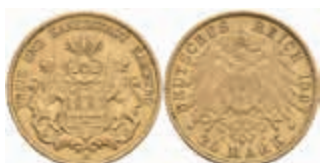
653 20 Mark, 1897, ss. J. 212 380,—