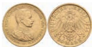
693 20 Mark, 1914, Wilhelm II., kl. Rf., vz-st. J. 253 400,—