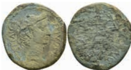
149 Octavian und Divus Julius Caesar, 38 n. Chr., Bronze Dupondius? (13,7g), unbest. Mzst., Av: (CAESAR) DIV (I F, leicht bärtiger Kopf des Octavian n. r). Rev: DIVOS IVLIVS; belorbearter Kopf von Caesar, n. r. Crawford 535/1, Sydenham 1335, RPC I 620, s-ss. 50,—