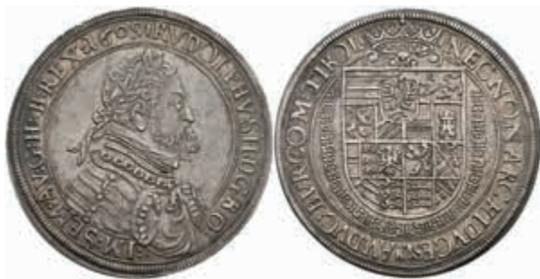
360 Taler, 1609, Rudolf II., Hall, Dav. 3006, kl. Rf., f. vz. 500,—