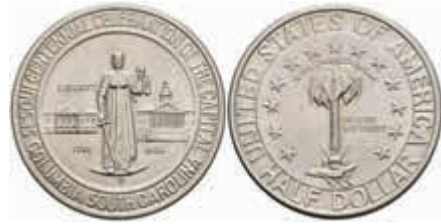
1146 1/2 Dollar, 1936, D, Columbia, KM 178, f. st. 150,—