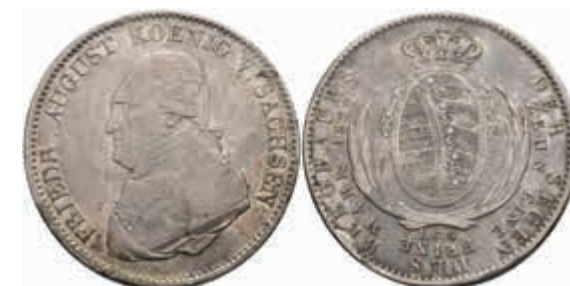
480 Taler, 1822, Friedrich August I., AKS 25, J. 34, Druckstelle, kl. Kratzer und Rf., ss. 150,—