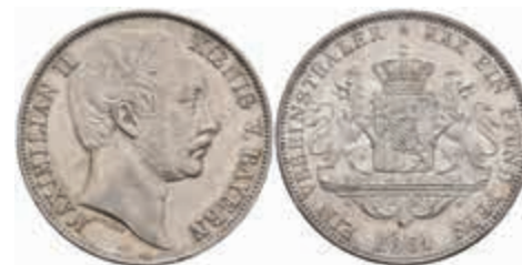
465 Taler, 1861, Maximilian II., AKS 149, J. 94, vz-st. 150,—