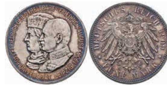
565 5 Mark, 1909, Friedrich August, Universität Leipzig, wz. Kr., vz-st J. 139 130,—