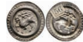
352 Sigmaringen-Helfenstein, Brakteat (0,52g), 1247-1263, nach links schreitender Hirsch. Cahn 215, Berger 2514, ss. Sehr selten! 1300,—