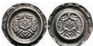
345 Schongau, Brakteat (0,75g), Konradin, 1258-1268. Brustbild des Königs umgeben von Ranken. Berger 2681, vz. 150,—