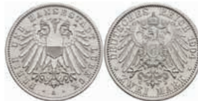
529 2 Mark, 1904, f.st, J. 81. 160,—