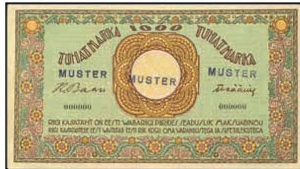
1653 Estland, Eesti Vabariigi, 1000 Marka, 1923, Probe zu P50 c, Serie Nr. 000000, einseitiger Druck mit blauem Überdruck MUSTER dreifach, P 50 p, Erh. II. (Abbildung auf 41% verkleinert) 250,—