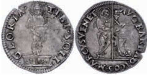
925 Venedig, Mocenigo (Lira), o.J. (1486-1501), Agostino Barbarigo, IP, Randfehler, ss-vz. 200,—