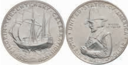
1087 1/2 Dollar, 1921, Missouri, KM 149.1, Slab NTC MS65, st. 50,—