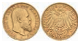
742 10 Mark, 1893, Wilhelm II., wz. Rf., ss. J. 295 250,—