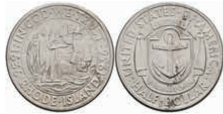
1147 1/2 Dollar, 1936, D, Rhode Island, KM 185, vz-st. 80,—