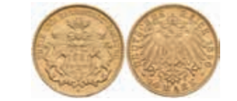
645 10 Mark, 1890, ss-vz. J. 211 250,—