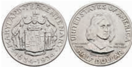
1112 1/2 Dollar, 1934, Maryland, KM 166, wz. Kr., f. st. 100,—