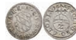
396 30 Kreuzer, 1625, Maximilian I., Hahn 93, vz. 30,—

Goldmünzen ab 1800 sowie Goldbarren sind als Anlagegold ggf. umsatzsteuerfrei (auch für das Aufgeld), soweit der Zuschlagpreis inkl. Aufgeld und Losgebühr nicht höher als der Goldwert + 80% ist.