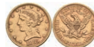
1067 5 Dollars, Gold, 1885, Philadelphia, Fb. 143, ss. 300,—

Goldmünzen ab 1800 sowie Goldbarren sind als Anlagegold ggf. umsatzsteuerfrei (auch für das Aufgeld), soweit der Zuschlagpreis inkl. Aufgeld und Losgebühr nicht höher als der Goldwert + 80% ist.