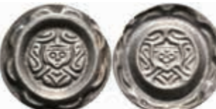
350 Schongau, Brakteat (0,79g), Konradin, 1258-1268. Brustbild des Königs umgeben von Ranken. Berger 2681, vz. 150,—