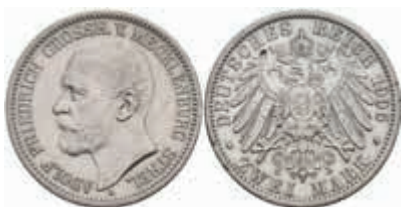
537 2 Mark, 1905, Adolf Friedrich V., Randfehler, zaponiert, ss. J. 91 250,—