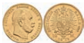
670 10 Mark, 1872, A, Wilhelm I., kl. Rf., vz-st. J. 242 220,—