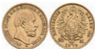
667 20 Mark, 1872, Friedrich Franz II., wz. Rf., ss. J. 230 1400,—