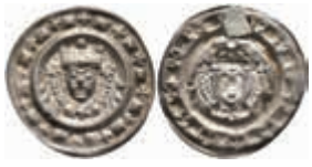
443 Brakteat (0,45g), Friedrich II., 1215-1250. Brustbild des Kaisers mit zwei Flügeln von vorn. Berger 2596, Cahn 227, vz. 300,—

Goldmünzen ab 1800 sowie Goldbarren sind als Anlagegold ggf. umsatzsteuerfrei (auch für das Aufgeld), soweit der Zuschlagpreis inkl. Aufgeld und Losgebühr nicht höher als der Goldwert + 80% ist.