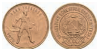
994 10 Rubel, Gold, 1975, Tschernonetz, Fb. 181a, f. st. 400,—