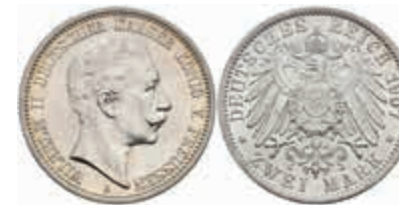
545 2 Mark, 1907, Wilhelm II., vz-st. J. 102. 30,—