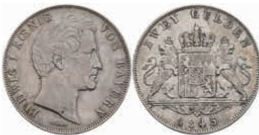
453 Doppelgulden, 1845, Ludwig I., AKS 77, J. 63, wz. Rf., f. vz. 120,—