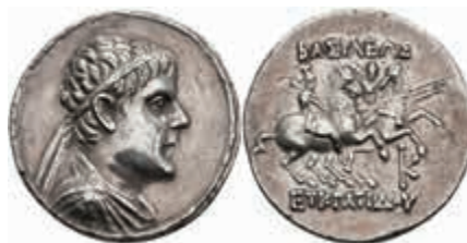
111 Tetrachme (15,07g), Eukratides I., 171-135. v. Chr. Av: Büste nach rechts. Rev: Dioskuren mit Lanzen und Palmzweigen auf Pferden nach rechts. Mitchiner 168f., Felder bearbeitet/geglättet, ss. Aus einer rheinischen Privatsammlung. Erworben in den 1980/90er Jahren im rheinischen Münzhandel. 900,—