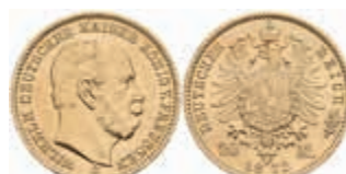
674 20 Mark, 1872, C, Wilhelm I., kl. Rf., vz+. J. 243 380,—