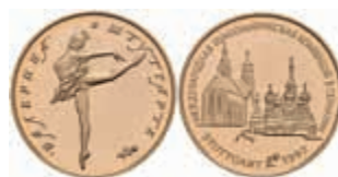
1002 Goldmedaille in 50 Rubel Größe, 1993, sog. Stuttgartballerina, mit Zertifikat mit Nummer 289, in Ausgabeetui, in Kapsel, PP. Auflage nur 500 Exemplare! 450,—