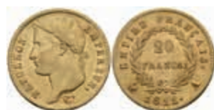
885 20 Francs, Gold, 1811, Napoleon I., A (Paris), Fb. 511, kl. Rf., ss. 280,—