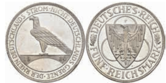
777 5 Reichsmark, 1930, F, Rheinlandräumung, kl. Kratzer, Randabschliff, PP. J. 346 200,—