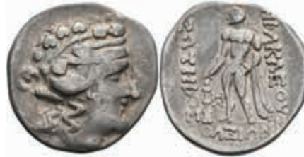
33 Thasos, Tetradrachme (14,78g), ca. 1. Jh. v. Chr. Av: Dyonisokopf nach rechts. Rev: Heracles mit Löwenfell und Keule nach links. S-ss. 100,—