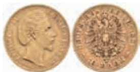
615 10 Mark, 1881, Ludwig II., ss. J. 196 240,—