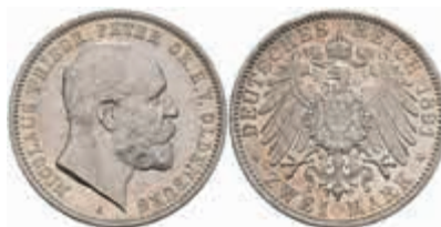
539 2 Mark, 1891, Nicolaus Friedrich Peter, vz. J. 93 300,—