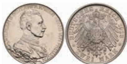
548 2 Mark, 1913, Wilhelm II., Regierungsjubiläum, Haarlinien, PP. J. 111 30,—