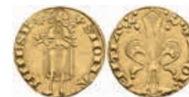
923 Florenz, Fiorino d'oro (3,45g), o.J.(1252-1422), Fb. 275, ss. 800,—

Alle Einzellose und Zertifikate/Gutachten sind unter www.rhenumis.de farbig abgebildet!