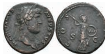
173 Hadrian, 125-128, As (11,35g), Rom. Av: Kopf nach rechts, darum Umschrift. Rev: Stehende Minerva mit Schild und Speer nach rechts, darum "COS III". RIC 664 var., geplättet, ss. 50,—