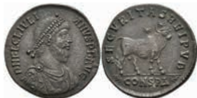
228 Julian II., 361-363, Follis (8,64g), Constantinopel. Av: Brustbild nach rechts, darum Umschrift. Rev: Stier nach rechts, darüber zwei Sterne, darum "SECVRITAS REI PVB". RIC 163, vz. 100,—