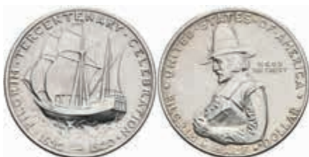
1083 1/2 Dollar, 1920, Pilgrim, KM 147.1, vz-st. 50,—