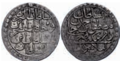
1026 15 Para (1/2 Zolota, 7,01g), AH 1171/2, Mustafa III., Istanbul, KM 309, Pere 634, Hsp., ss. 540,—