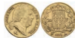
890 20 Francs, Gold, 1818, Louis XVIII., A (Paris), Fb. 538, ss. 280,—