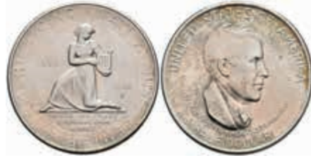
1145 1/2 Dollar, 1936, D, Cincinnati Music Center, KM 176, wz. Kr, f. st. 150,—