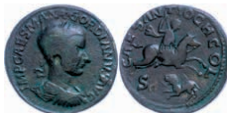
249 Pisidien, Antiochia, Æ (21,90g), 238-244, Gordianus III. Av: Büste nach rechts, darum Umschrift. Rev: nach rechts reitender Kaiser mit Speer, darunter Löwe, darum Umschrift. SNG Paris 1234, ss. 130,—