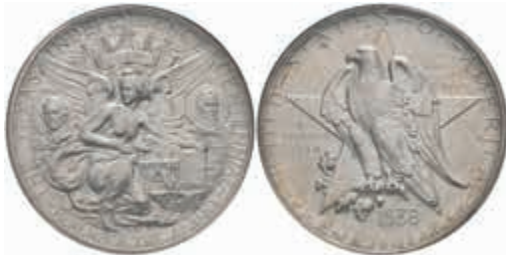
1190 1/2 Dollar, 1938, D, Texas, KM 167, NGC MS66. 200,—