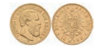
660 10 Mark, 1878, Ludwig IV., ss. J. 219 350,—