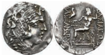
32 Odessos, Tetradrachme (16,32g), ca. 2./1. Jh. v. Chr. Av: Herakleskopf nach rechts. Rev: Thronender Zeus nach links. Price 1201, ss. 150,—