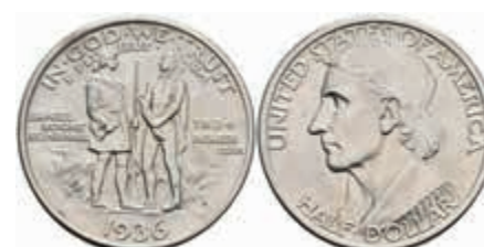
1138 1/2 Dollar, 1936, Boone, KM 165.2, f. st. 100,—