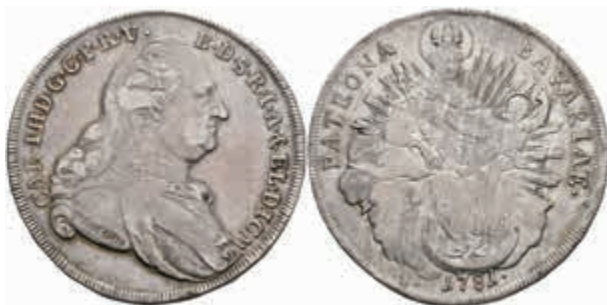
409 Taler, 1781, Karl Theodor, Hahn 346, Dav. 1965, justiert, ss-vz. 120,—