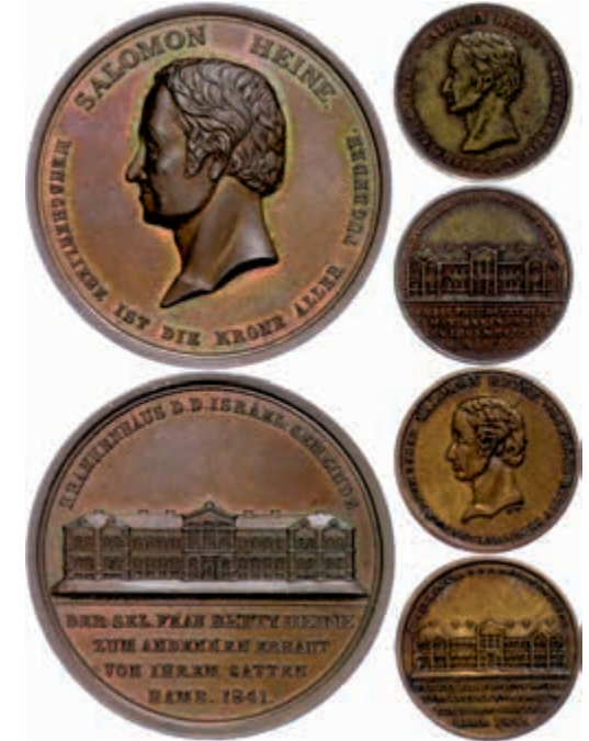
1270 Hamburg, Bronzemedaille (Dm. ca. 45mm), 1841, von H.F. Alsing, auf die Erbauung des Krankenhauses der israelitischen Gemeinde durch Salomon Heide. Dazu dieselbe (2x) Revers mit leichter Abweichung (Dm. ca. 23mm). Gaedchens 2070, ss-vz. 400,—