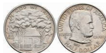
1090 1/2 Dollar, 1922, Grant Memorial, KM 151.1, vz. 50,—