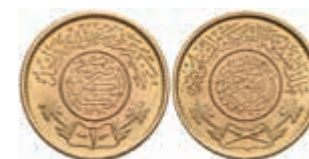
1005 Pound, 1950, AH 1370, Fb. 1, st. 380,—