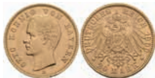
623 20 Mark, 1900, Otto, kl. Rf. und Kratzer, f. vz. J. 200 380,—