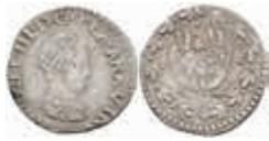
926 Neapel, 1/2 Carlino, Silber, o.J. (1611-1621), Philipp III. 1598-1621. Av: Gekrönte Büste n. r. Rev: Das Goldene Vlies dazwischen Beizeichen Kreuz, KM# 17, MIR# 216/8, ss+. 70,—