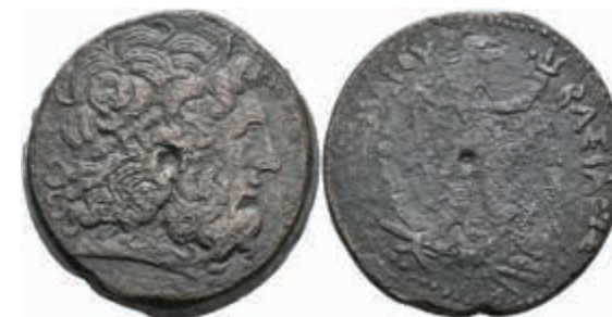
115 Alexandria, Bronze Tetrobol (42,35g) Ptolemaios III. Eupator 246 - 221 v. Chr. Av: Kopf des Zeus Ammon mit Diadem rechts. Rev: Adler mit angelegten Flügeln und Füllhorn auf Blitzbündel nach links stehend, Kopf nach rechts gewendet, zwischen den Beinen Monogramm. Svoronos, Pt. 148, 974. SNG Cop. 224. Braune Patina, ss-s 70,—