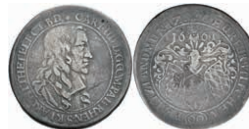
427 Gulden (60 Kreuzer), 1661, Karl Ludwig von Simmern, Dav. 746, s-ss. 70,—