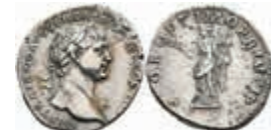
167 Trajanus, 113-114, Denar (3,35g), Rom. Av: Büste nach rechts, darum Umschrift. Rev: Stehende Felicitas mit Caduceus und Füllhorn nach links, darum "SPQR OPTIMO PRINCIPI". RIC 272, Woytek 422b, ss. 80,—