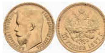
985 15 Rubel, Gold, 1897, Nikolaus II., St. Petersburg, Fb. 177, kl. Rf., ss+. 800,—