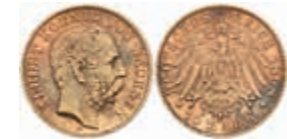
715 10 Mark, 1898, Albert, kl. Rf. und Kratzer, Parina, ss. J. 263 200,—