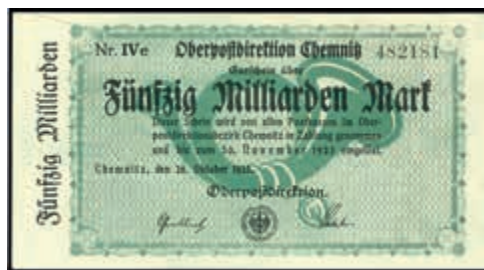
1741 Chemnitz (Sachsen), Oberpostdirektion. 10, 20 und 50 Milliarden Mark, 26.10.1923. Schoenawa 45-W-3/4/5, Erh. I- (Abbildung auf 50% verkleinert) 200,—