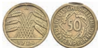
1249 50 Rentenpfennig, 1924, A, J. 310, Verprägung, ss. 20,—