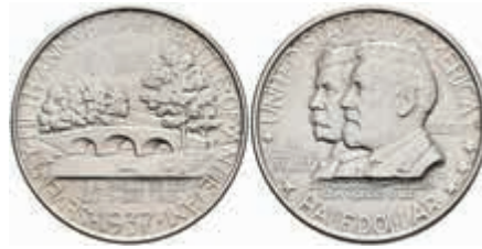
1172 1/2 Dollar, 1937, Battle of Antietam, KM 190, f. st. 400,—