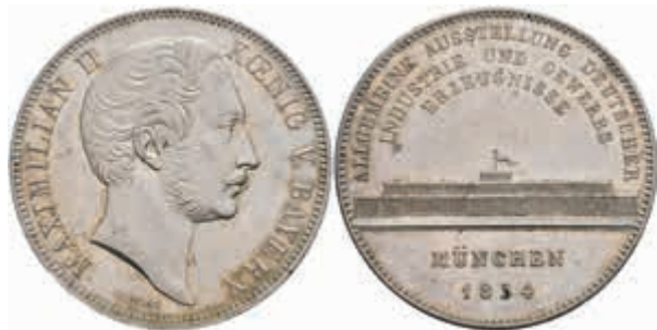
459 Geschichtsdoppeltaler, 1854, Maximilian II., Glaspalast, AKS 166, J. 89, kl. Rf., vz. 400,—