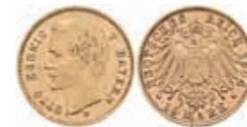
628 10 Mark, 1904, Otto, ss+. J. 201 220,—