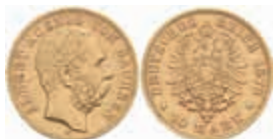
705 10 Mark, 1878, Albert, wz. Rf., ss. J. 261 200,—