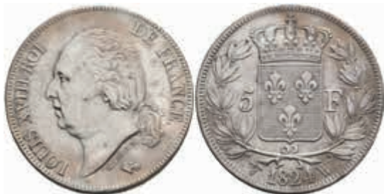
893 5 Francs, 1824, Louis XVIII., Lille, Gadoury 614, ss-vz. 80,—