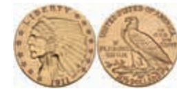
1079 2 1/2 Dollars, Gold, 1911, Philadelphia, Indian Head, Fb. 120, ss. 200,—

Alle Einzellose und Zertifikate/Gutachten sind unter www.rhenumis.de farbig abgebildet! Dort sind auch 304 weitere Lose zu finden, die nicht im gedruckten Katalog, sondern nur im Internet zu finden sind!