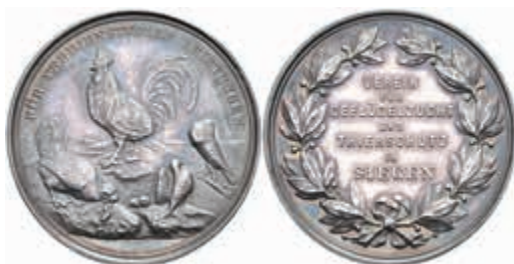
1283 Siegen, Silbermedaille (Dm. ca. 35,3 mm, ca. 12,1 g), o.J., unsigniert, für verdienstvolle Leistungen des Vereins für Geflügelzucht und Thierschutz in Siegen. Av: Hahn und weitere Tiere. Rev: 7 Zeilen Schrift im Lorbeerkranz. Im Etui, schöne Patina, st. 50,—