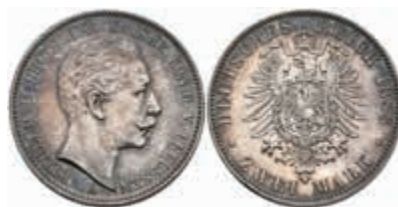
542 2 Mark, 1888, Wilhelm II., Rf., Patina, ss-vz, J. 100. 200,—