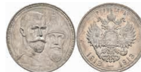
991 Rubel, 1913, Nikolaus II., St. Petersburg, 300 Jahre Romanov Dynastie, Bitkin 336, kl. Rf. und Kratzer, vz. 70,—