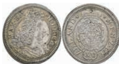
401 15 Kreuzer, 1701, Maximilian II. Emanuel, Hahn 192, ss. 40,—