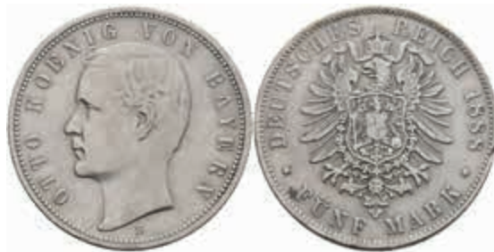
516 5 Mark, 1888, Otto, kl. Rf., zaponiert, ss. J. 44 100,—

Bitte geben Sie realistische Gebote ab! Gebote deutlich unter Metallwert sind praktisch chancenlos und für alle Seiten Zeitverschwendung!