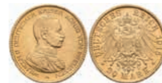
695 20 Mark, 1915, Wilhelm II., kl. Kratzer auf dem Avers, vz-st. J. 253 4000,—