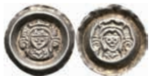
372 Brakteat (0,75g), Hartmann II., 1250-1286. Av: Brustbild des Bischofs zwischen zwei Krummstäben von vorn, darüber Bogen mit Zinnen und zwei Türmchen. Berger 2646, Slg. Bonhoff 1913, vz-st. 180,—