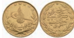
1043 100 Kurush, Gold, AH 1336/1, Mohammed VI., Fb. 186, ss. 300,—