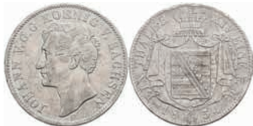
491 Taler, 1854, Johann, AKS 128, J. 97, Kratzer, ss. 60,—