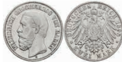
505 2 Mark, 1898, Friedrich I., kl. Rf., ss. J. 28 50,—