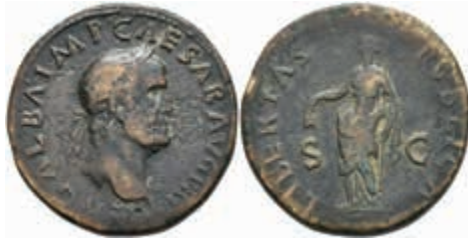
157 Galba, 68-69, Sesterz (25,27g), Rom. Av: Büste nach rechts, darum Umschrift. Rev: Stehende Libertas nach links, darum "LIBERTAS PVBLICA". RIC 387, Felder geglättet, ss. 300,—