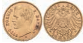
632 10 Mark, 1909, Otto, f. vz. J. 201 240,—