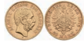
712 20 Mark, 1876, Albert, ss. J. 262 350,—