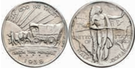
1189 1/2 Dollar, 1938, D, Oregon Trail, KM 159, st. 130,—