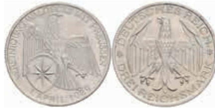
771 3 Reichsmark, 1929, Waldeck, kl. Kr., kl. Rf., vz. J. 337 80,—