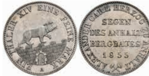
444 Taler, 1855, Alexander Carl, AKS 16, J. 66, ss+ 70,—