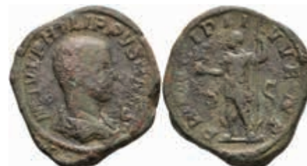
209 Philippus II Caesar, 244-247 n. Chr., Bronze Sesterz (23,27g), Rom. Av: M IVL PHILIPPVS CAES. drap. Büste n. r. / Rev: PRINCIPI IVVENTVTIS. Philippus II in Militäruniform, haltend Speer und Globus. RIC 255, ss. 50,—