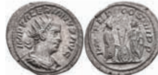
217 Valerianus I., 253-260, Antoninian (4,64g), Antiochia. Av: Büste nach rechts, darum Umschrift. Rev: Stehender Valerianus und Gallienus mit Schilden und Speeren einander gegenüber, darum "P M TR P V COS IIII PP". RIC 277, kl. Einriss, vz. 30,—