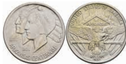
1171 1/2 Dollar, 1937, Arkansas, KM 168, vz-st. 80,—