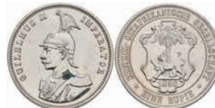
789 DOA, 1 Rupie, 1890, gereinigt, zaponiert, vz-st. J. N713 70,—