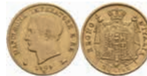
931 20 Lire, Gold, 1809, Napoleon, Mailand, Fb. 7, kl. Rf., ss. 270,—