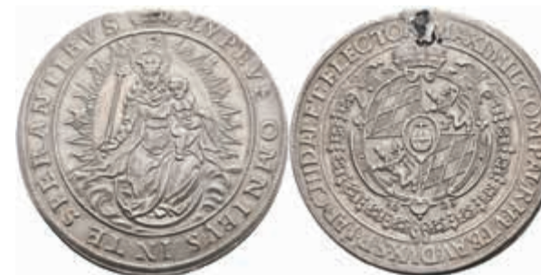
394 Taler, 1623, Maximilian I., Hahn 105, Hsp., Felder bearbeitet, ss. Mit altem Unterlegzettel. 200,—