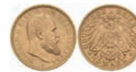
748 10 Mark, 1907, Karl, vz. J. 295 280,—