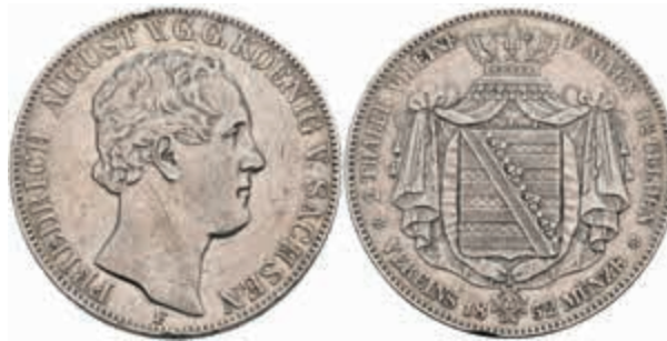
486 Doppeltaler, 1852, Friedrich August II., AKS 94, J. 78, Randfehler, kl. Kr., ss. 100,—