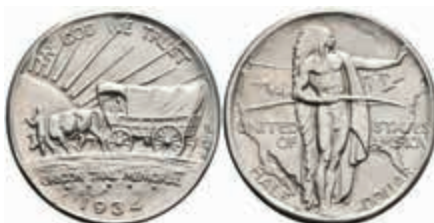
1111 1/2 Dollar, 1934, D, Oregon Trail, KM 159, vz-st. 120,—