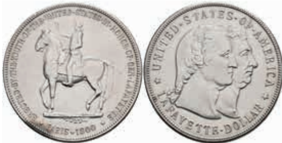
1070 Dollar, 1900, Lafayette-Dollar, KM 118, minimal berieben, vz. 250,—