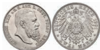
551 2 Mark, 1901, Heinrich XXII., zaponiert, f. vz. J. 118 200,—