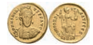
232 Honorius, 393-423, Solidus (4,40g), Constantinopel. Av: Büste mit Schild und Speer in Dreiviertelansicht, darum Umschrift. Rev: Constantinopolis frontal sitzend, darum Umschrift. RIC 8, ss-vz. 800,—