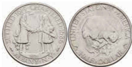
1134 1/2 Dollar, 1936, Albany, KM 173, f. st. 150,—