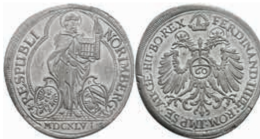
424 Zinnabschlag des Reichsguldiners von 1646, mit Titel Ferdinand III., vgl. Kellner 210, Kratzer, vz. 50,—