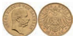
719 10 Mark, 1903, Georg, kl. Rf., ss+. J. 265 300,—