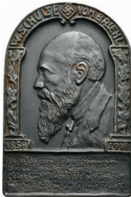
1395 Einseitige geschwärzte Eisengussplakette (ca. 66,5x100,7 mm, ca. 143,18 g), 1918, unsigniert, auf den 60. Geburtstag des Dichters Walther Schulte vom Brühl. Brustbild nach links, darüber Name zwischen Hakenkreuz, darunter Auszug eines Gedichts. Korrosionsspuren, vz. 50,—