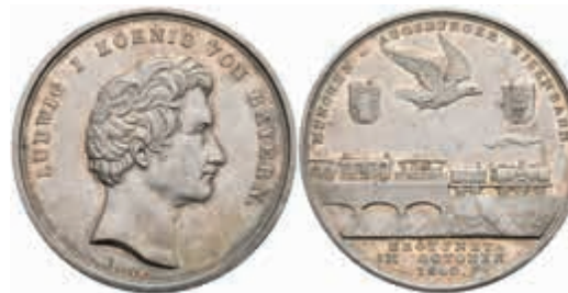
1269 Bayern, Ludwig I., Silbermedaille (Dm. ca. 37mm, ca. 15,94g), 1840, von Neuss, auf die Eröffnung der Eisenbahnlinie München-Augsburg. Av: Kopf nach rechts, darum Umschrift. Rev: Eisenbahn, darüber fliegender Adler zwischen zwei Wappen. Kl. Kratzer, vz. 150,—