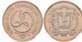
869 30 Pesos, Gold, 1974, Mittelamerikanische Spiele, KM 36, NGC - MS 69. Top Pop! 600,—