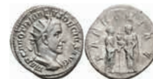
210 Trajanus Decius, 249-251, Antoninian (2,49g), Rom. Av: Büste nach rechts, darum Umschrift. Rev: Zwei Pannoniae, dazwischen Standarte, darum "PANNONIAE". RIC 41a, ss. 30,—