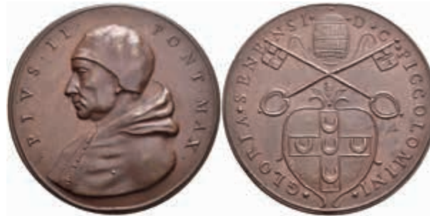
1369 Kirchenstaat, Pius II., Bronzemedaille (Dm. ca. 45 mm, ca. 41,6 g), o.J., unsigniert, auf sein Pontifikat. Av: Brustbild nach links. Rev: Piccolomini-Wappen unter Tiara und gekreuzten Schlüsseln. Spink 347, kl. Rf., vz-st. (Abbildung auf 92% verkleinert) 70,—