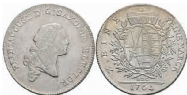
433 Taler, 1764, Friedrich August III., EDC, Sign. St., Kahnt 1065, Schnee 1060, ss-vz. 150,—