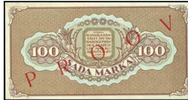
1652 Estland, Eesti Vabariigi, 100 Marka, 1923, Probe, einseitiger Druck mit rotem Überdruck RROOV, P 51p, Erh. I. (Abbildung auf 49% verkleinert) 150,—