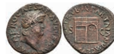
153 Nero, 54-68, As (10,26g), Rom. Av: Büste nach rechts, darum Umschrift. Rev: Janustempel, Darum Umschrift. RIC 347, ss. 150,—