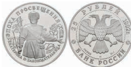
1000 25 Rubel, Palladium, 1993, Katharina die Grosse, Parchimowicz 1401, mit Zertifikat, in Kapsel, PP. 1800,—