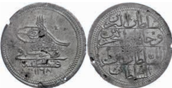
1025 Kurus (23,59g), AH 1168, Osman III., Konstantinopel, KM 264, Sultan 2067, Pere -, poröser Schrötling mit div. Schrötungsfehlern, ss. Sehr Selten! 1400,—