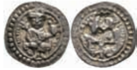
440 Brakteat (0,46g), Heinrich VI. 1190-1197. Thronender Kaiser mit Reichsapfel und Kreuzstab von vorn. Berger 2593/2595, ss. 80,—