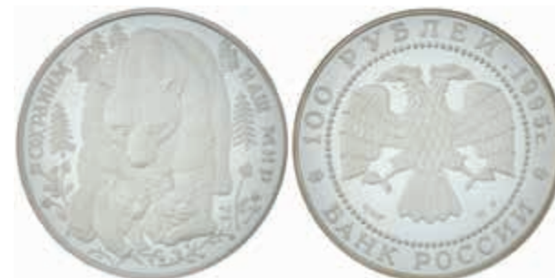
1004 100 Rubel, 1995, Braunbär, 1 kg Silber, Parchimowicz 1809, in Kapsel (gesprungen), PP. Auflage nur 500 Exemplare! (Abbildung auf 40% verkleinert) 1000,—

Bitte geben Sie realistische Gebote ab! Gebote deutlich unter Metallwert sind praktisch chancenlos und für alle Seiten Zeitverschwendung!