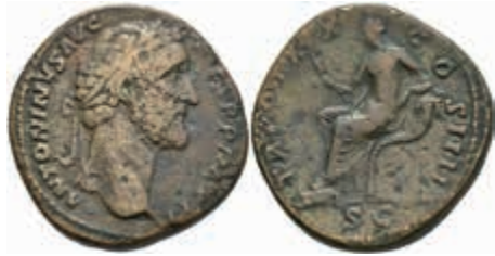
181 Antoninus Pius, 138-161, Sesterz (24,09g), Rom. Av: Büste nach rechts, darum Umschrift. Rev: Thronende Securitas mit Füllhorn nach links, darum "TR POT XX COS IIII". RIC 967, Cohné 1008, ss. 80,—