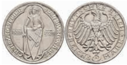
768 3 Reichsmark, 1928, Naumburg, vz. J. 333 70,—