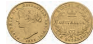
809 Sovereign, 1866, Victoria, Sydney, Fb. 10, kl. Rf., ss. 400,—