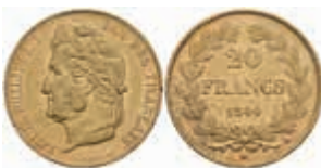
898 20 Francs, Gold, 1844, Louis Philippe I., A (Paris), kl. Rf., ss+. 300,—