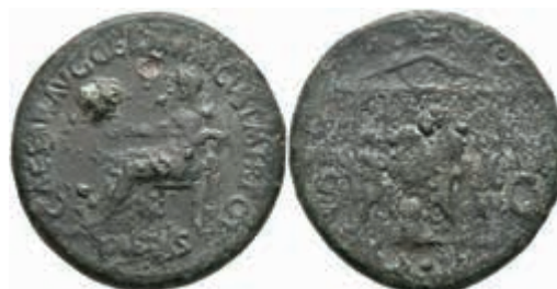
150 Caius (Caligula), 39-40 n. Chr., Bronze Sesterz (28,98g), Rom. AV: Umschrift darunter PIETAS, Pietas, verschleiert, sitzt links, eine Patera haltend, die Linke auf eine Statue gestützt. Rev: DIVO - AVG; S - C. Hexastylter Tempel mit reich dekoriertem Tympanon und Girlanden, auf dem Dach Quadriga und weitere Aufsätze; davor Opferszene: Der Kaiser capite velato opfernd, flankiert von zwei victimarii, der eine mit Opfertier, der andere mit Kultgerät. RIC I 44, dunkelgrüne Patina, ss. 250,—