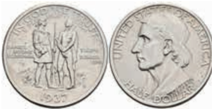
1182 1/2 Dollar, 1937, S, Boone, KM 165.2, vz. 120,—