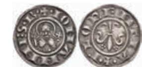
355 Florenz, Fiorino d'argento (1,78g), 1189-1252, Av: Lilie, im Außenkranz Umschrift, Rev: Brustbild des heiligen Johannes mit erhobener Rechten und Kreuzzepter von vorn, im Außenkranz Umschrift, Biaggi 783, ss. 200,—