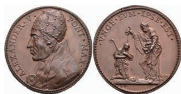
1315 Kirchenstaat, Alexander V., Bronzemedaille (Dm. ca. 40 mm, ca. 27,6 g), o.J., von St. Urbain. Vs: Brustbild nach links. rev: Samuel salbt den in Hirtengewand vor ihm knienden David. Spink 308, Stempelriß, vz. 100,—