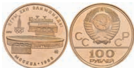
998 100 Rubel, 1/2 oz Gold, 1978, Moskau, Leninstadion, KM 163, mit Zertifikat, in Kapsel, Fingerabdrücke, PP. 700,—