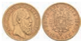
736 10 Mark, 1880, Karl, wz. Rf., ss. J. 292 220,—