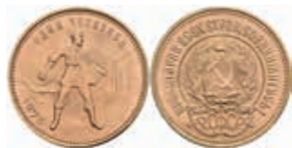
996 10 Rubel, Gold, 1975, Tschernonetz, Fb. 181a, f. st. 400,—