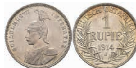
791 DOA, 1 Rupie, 1914, J, kl. Kr., vz-st. J. N 722 180,—