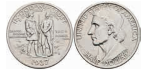
1176 1/2 Dollar, 1937, D, Boone, KM 165.2, st. 150,—