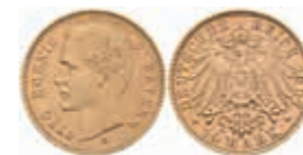
631 10 Mark, 1907, Otto, ss-vz. J. 201 240,—