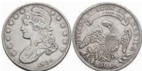
1053 1/2 Dollar, 1834, KM 37, ss. 50,—