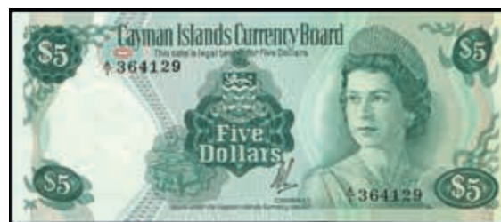
1677 Cayman-Inseln, Cayman Islands Currency Board, 1 und 5 Dollars, 1971, P- 1b und 2a, unc. Erh. I- und I. (Abbildungen siehe Onlinekatalog) (Abbildung auf 50% verkleinert) 80,—