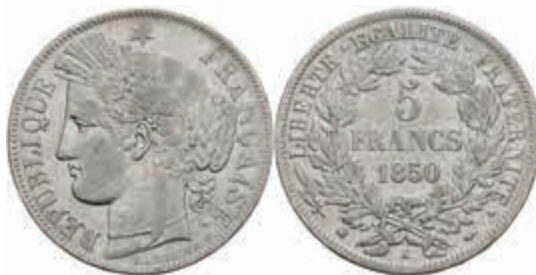
901 5 Francs, 1850, Bordeaux, Dav. 93, kl. Rf., ss. 130,—