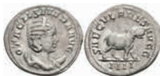
205 Otacilia Severa, 244-249, Antoninian (2,09g), Rom. Av: Büste nach rechts, darum Umschrift. Rev: Nilpferd nach rechts, darum "SAECVLARES AVGG - IIII". RIC 116b, ss-vz. 100,—