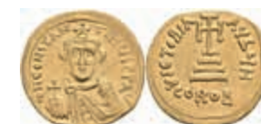
267 Constans II., 641-668, Solidus (4,21g), Konstantinopel. Av: Büste von vorn, darum Umschrift. Rev: Kreuz auf drei Stufen, darum Umschrift. Sear 938, 450,—

Goldmünzen ab 1800 sowie Goldbarren sind als Anlagegold ggf. umsatzsteuerfrei (auch für das Aufgeld), soweit der Zuschlagpreis inkl. Aufgeld und Losgebühr nicht höher als der Goldwert + 80% ist.