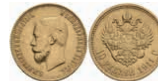
989 10 Rubel, Gold, 1911, Nikolaus II., St. Petersburg, Fb. 179, f. vz. 380,—