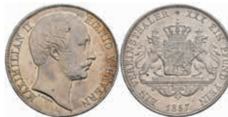
464 Taler, 1857, Maximilian II. Joseph, AKS 149, J. 94, kl. Rf., leicht berieben, vz-st. 70,—