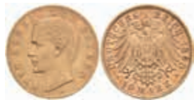
622 10 Mark, 1898, Otto, ss. J. 199 220,—