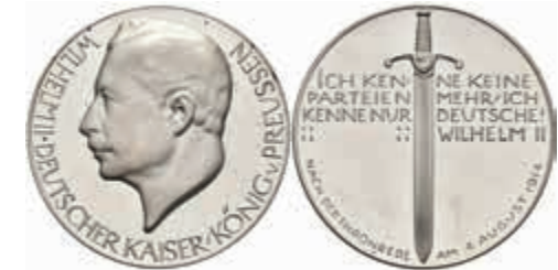
1386 Silbermedaille (Dm. ca. 33,20g, ca. 17,60g), 1914, Lauer, auf die Kaiserrede. Av: Kopf Wilhelm II. nach links, darum Umschrift. Rev: Schwert zwischen 4 Zeilen Schrift. Rand punziert, kl. Kratzer PP. 30,—