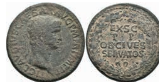
152 Claudius, 41-54, Sesterz (29,57g), Rom. Av: Kopf nach rechts, darum Umschrift. Rev: "EX SC/ P P/ OB CIVES/ SERVATOS". RIC 112, Belag, ss 150,—