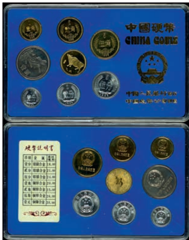
855 1 Fen bis 1 Yuan, 1985, Kursmünzensatz, Jahr des Ochsens, im Blister mit Umverpackung (beschriftet), etwas fleckig, PP. (Abbildung auf 50% verkleinert) 1500,—

Goldmünzen ab 1800 sowie Goldbarren sind als Anlagegold ggf. umsatzsteuerfrei (auch für das Aufgeld), soweit der Zuschlagpreis inkl. Aufgeld und Losgebühr nicht höher als der Goldwert + 80% ist.