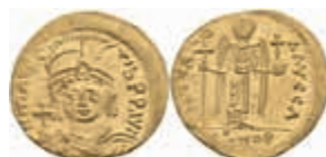
261 Mauricius Tiberius, 582-602, Solidus (4,50g), Konstantinopel. Av: Brustbild mit Schild und Kreuzglobus von vorn, darum Umschrift. Rev: Stehender Engel mit Christogrammstab und Kreuzglobus von vorn, darum Umschrift. Sear 478, ss-vz. 400,—