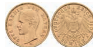
626 20 Mark, 1905, Otto, kl. Rf., vz. J. 200 400,—