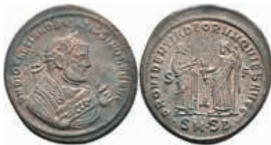
225 Diocletianus, 305-306, Follis (10,94g), Serdica. Av: Belorbeerte Büste mit Trabea, Zweig und Mappa nach rechts, darum Umschrift. Rev: Providentia und Quies stehen sich gegenüber, darum Umschrift. RIC 15, etwas Belag, ss-vz. 50,—