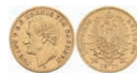
697 10 Mark, 1873, Johann, ss. J. 257 200,—