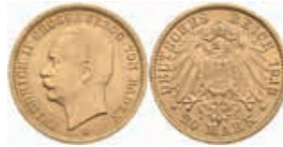
604 20 Mark, 1913, Friedrich II., wz. Rf., vz+. J. 192 450,—