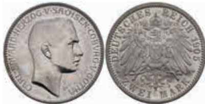
571 2 Mark, 1905, Carl Eduard, Kratzer auf Avers, f. vz, J. 147. 500,—