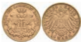
649 10 Mark, 1909, kl. Rf., ss+. J. 211 230,—