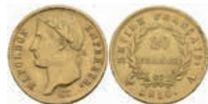
883 20 Francs, Gold, 1810, Napoleon, Paris, Fb. 511, Randfehler, ss. 250,—