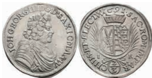
432 2/3 Taler, 1691, Johann Georg III., IK, Dav. 810, leicht berieben, wz. Hsp., f. vz. 50,—