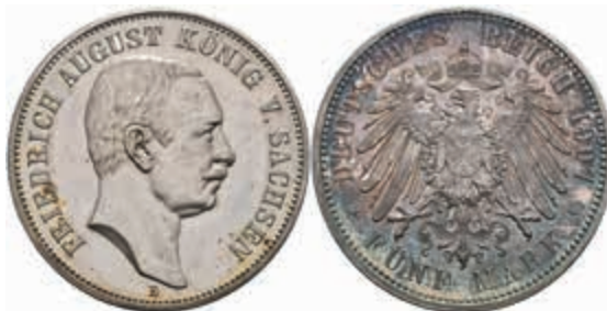
561 5 Mark, 1907, Friedrich August III., Haarlinien, st. Prachtexemplar! J. 136 250,—