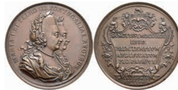
1311 Portugal, Maria I. und Pedro III., Bronzemedaille (Dm. ca. 47mm, ca. 39,33g), 1779, unsign., auf die Grundsteinlegung der Kirche des Heiligsten Herzen Jesu. Av: Beider Brustbilder nach rechts, darum Umschrift. Rev: 5 Zeilen Schrift in Kartusche. Kl. Rf., vz. (Abbildung auf 88% verkleinert) 120,—