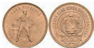
993 10 Rubel, Gold, 1975, Tschernonetz, Fb. 181a, f. st. 400,—