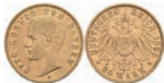
625 20 Mark, 1900, Otto, ss. J. 200 370,—