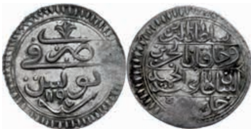
1027 Riyal, AH 1197, Abdülhamid I., Tunis, KM 65 (Tunesien), Prägeschwäche am Rand, vz. 140,—