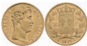
894 20 Francs, Gold, 1828, Charles X., Paris, Fb. 549, ss. 250,—