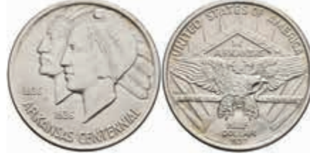
1170 1/2 Dollar, 1937, Arkansas, KM 168, f. st. 100,—