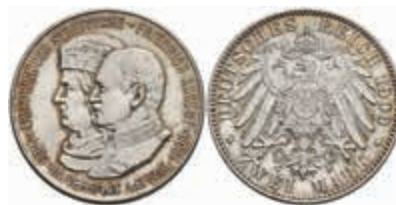
563 2 Mark, 1909, Universität Leipzig, wz. Kr., f. st. J. 138. 50,—