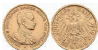
694 20 Mark, 1914, Wilhelm II., kl. Rf., vz. J. 253 380,—