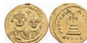
265 Heraclius, 610-641, Solidus (4,41g), Konstantinopel. Av: Die Büsten von Heraclius und Heraclius Constantin von vorn, darum Umschrift. Rev: Krückenkreuz auf drei Stufen, darum Umschrift. Sear 738, Druckstelle und Prägeschwäche am Rand, vz+. 450,—