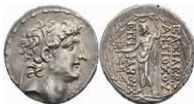
109 Tetrachme (16,37g), 112-111 v. Chr., Antiochos VIII., Antiochia. Av: Kopf nach rechts, Rev: Zeus Uranios mit Stern und Zepter nach links stehend, SC 2302.1, ss. 350,—