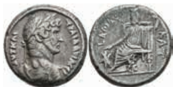
245 Ägypten, Alexandria, Billon-Tetradrachme (13,28g), Hadrianus, 117-138. Av: Büste nach rechts, darum Umschrift. Rev: Thronender Sarapis nach links. Dattari 1475, ss. Mit Unterlegzettel des Sammlers. 80,—