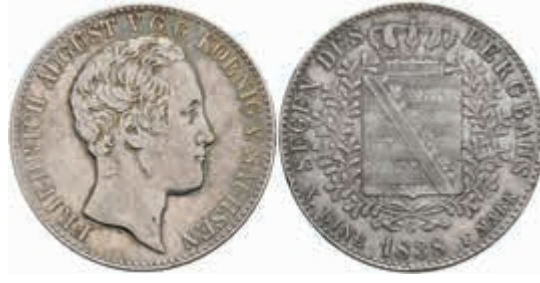
485 Taler, 1838, Friedrich August II., AKS 98, J. 75, kl. Rf., s-ss. 100,—