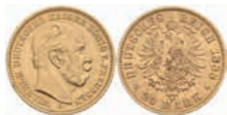
683 20 Mark, 1888, Wilhelm I., wz. Rf., f. vz. J. 246 350,—