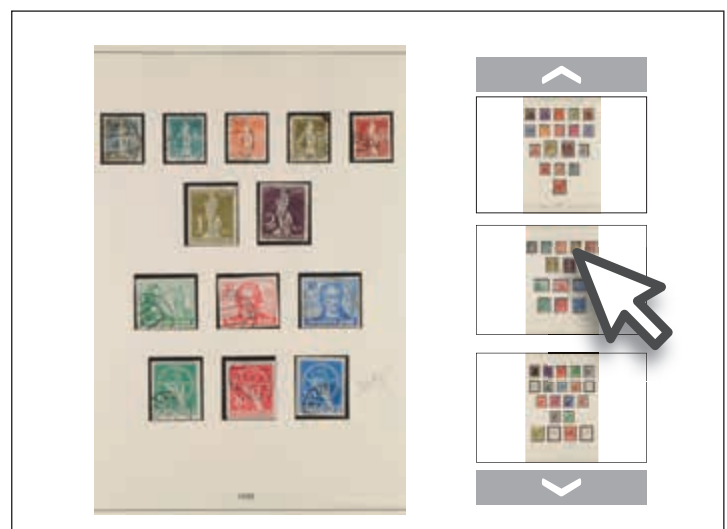
Galerieansicht mit mehreren Abbildungen zu einem Los